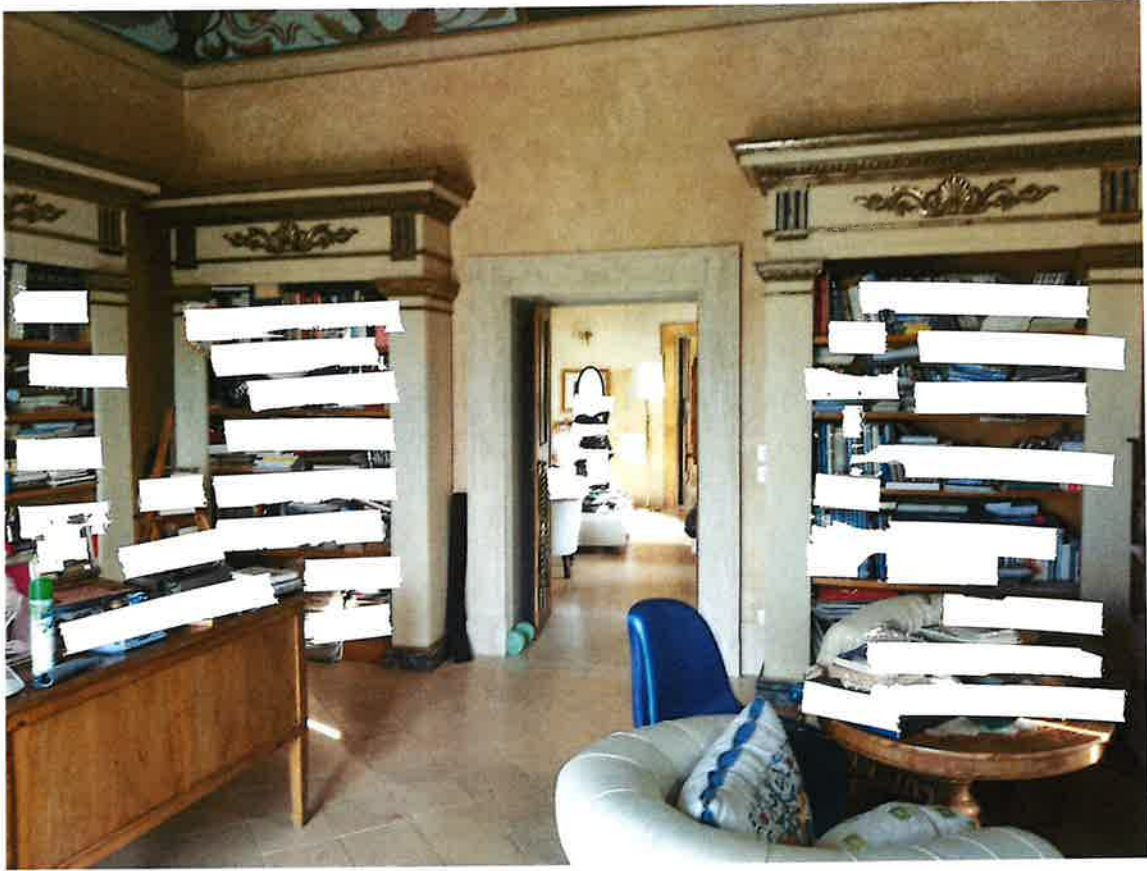
PIANO SECONDO sottotetto