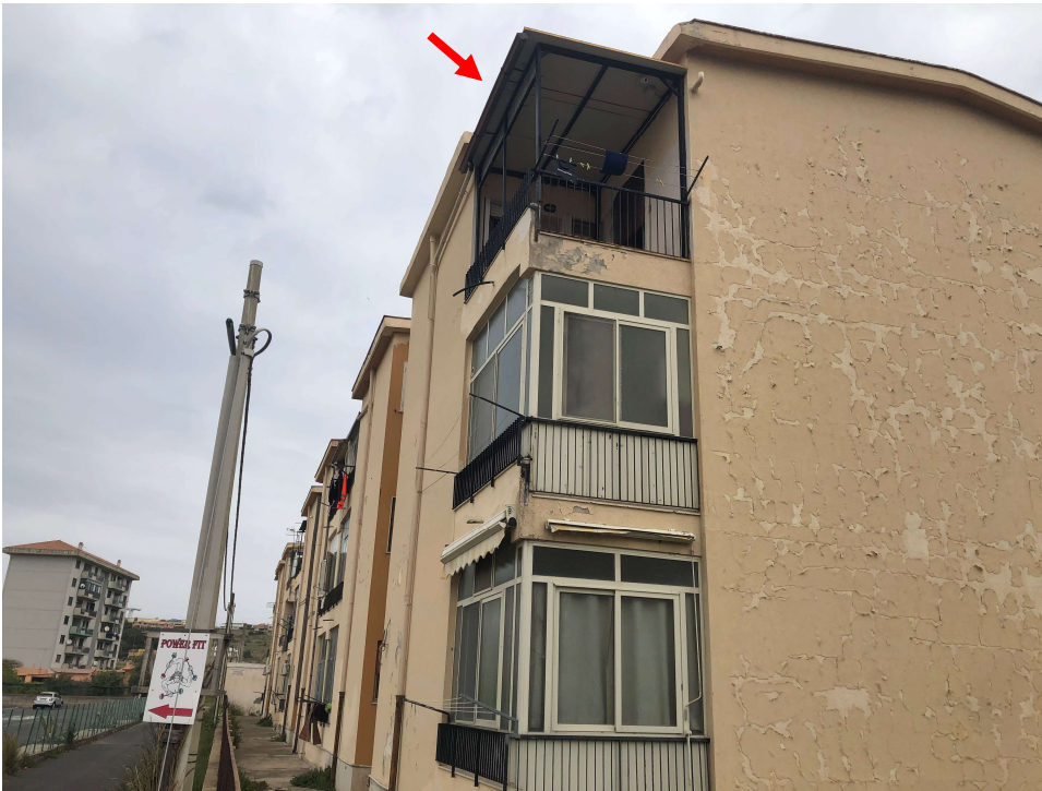
Foto 5: Vista prospetto Sud-Ovest della palazzina, la freccia indica la copertura del terrazzino realizzata in assenza di provvedimenti autorizzativi.