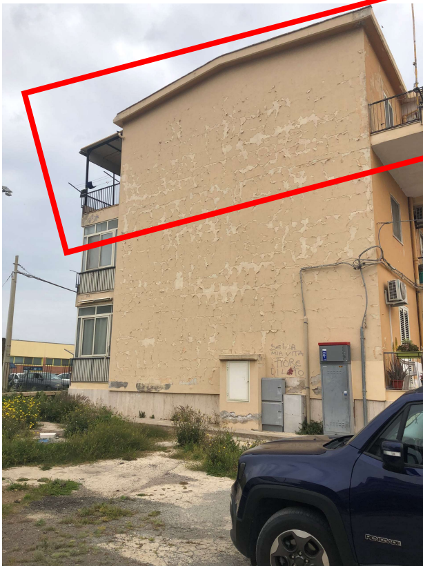
Foto 4: Vista prospetto Sud della palazzina. Il riquadro in rosso la porzione di appartamento oggetto di pignoramento.