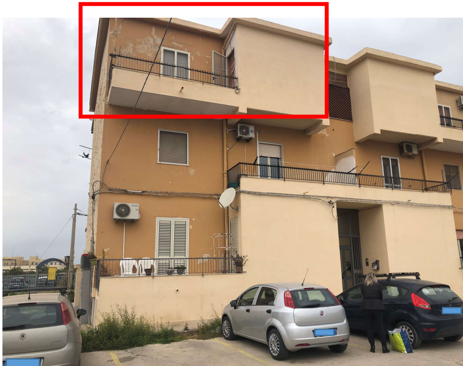
Foto 2: Vista della palazzina di cui fa parte l'appartamento pignorato. Il riquadro in rosso la porzione di appartamento esposta ad EST oggetto di pignoramento.