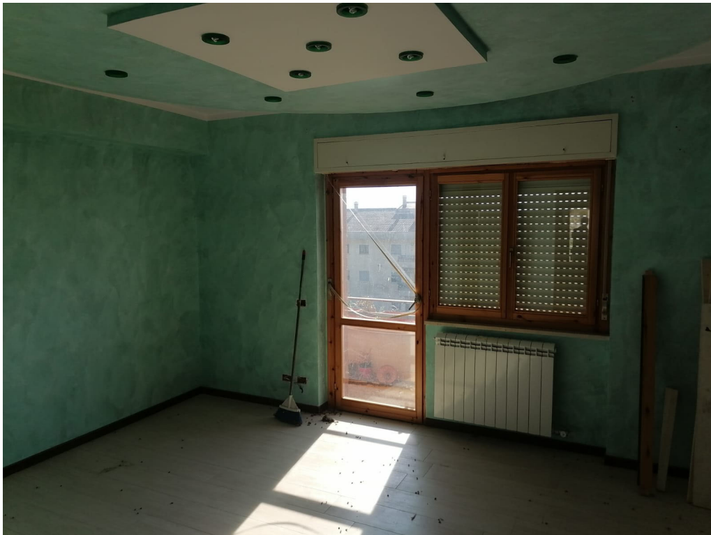
FOTO N° 8 Porzione di Fabbricato adibito ad Abitazione di tipo Civile (A/2) al Piano Terra e Secondo ubicato in Via Cappella Snc - PART. LETTO N. 3 INTERNO – PIANO SECONDO -

FOTO N° 7 Porzione di Fabbricato adibito ad Abitazione di tipo Civile (A/2) al Piano Terra e Secondo ubicato in Via Cappella Snc - PART. SOGGIORNO INTERNO – PIANO SECONDO