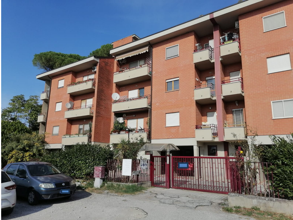
FOTO N° 2 Porzione di Fabbricato adibito ad Abitazione di tipo Civile (A/2) al Piano Terra e Secondo ubicato in Via Cappella Snc - PROSPETTO OVEST

FOTO N° 1 Porzione di Fabbricato adibito ad Abitazione di tipo Civile (A/2) al Piano Terra e Secondo ubicato in Via Cappella Snc - PROSPETTO OVEST