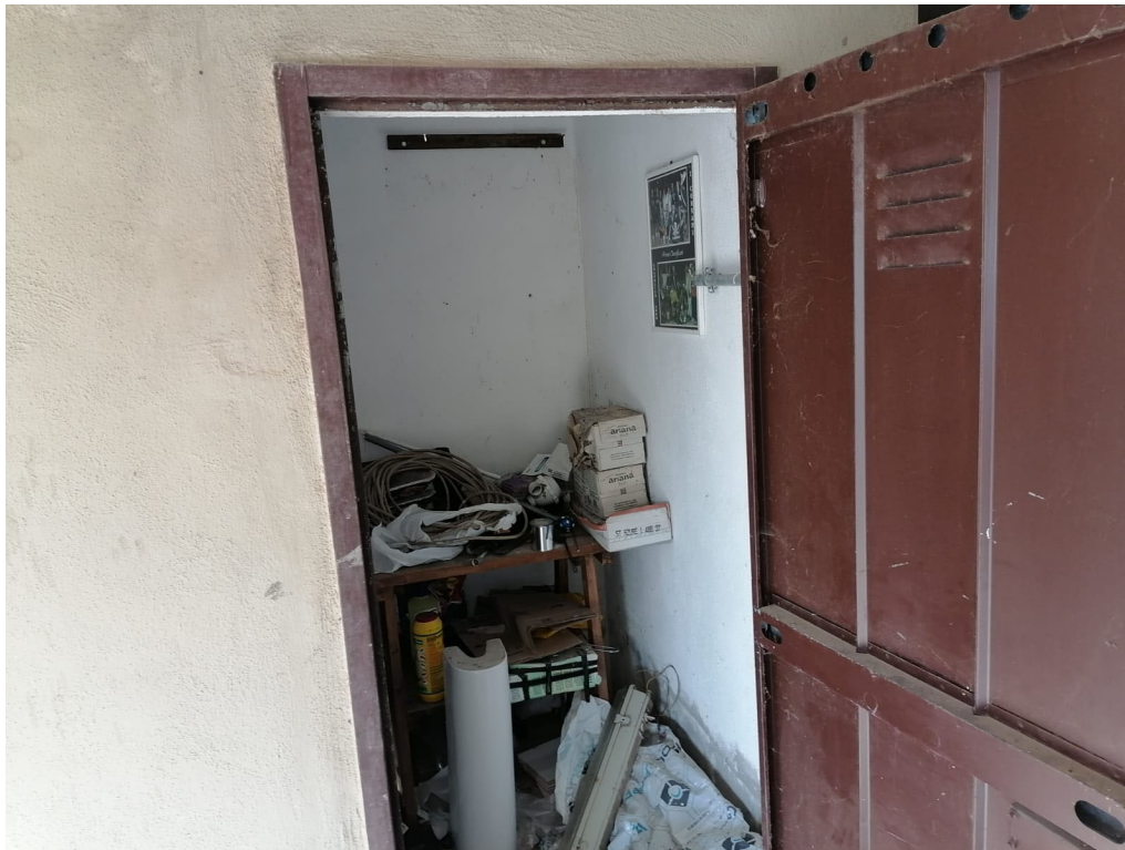
FOTO N° 6 Porzione di Fabbricato adibito ad Abitazione di tipo Civile (A/2) al Piano Terra e Secondo ubicato in Via Cappella Snc - PART. CANTINA INTERNO – PIANO TERRA -