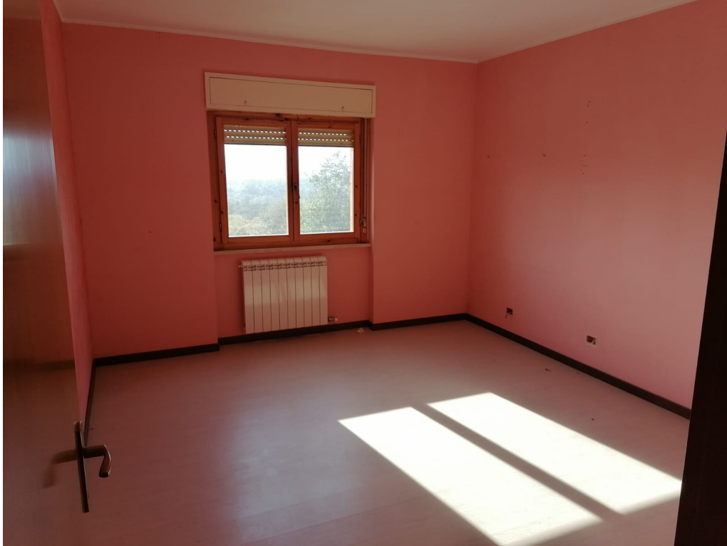
FOTO N° 10 Porzione di Fabbricato adibito ad Abitazione di tipo Civile (A/2) al Piano Terra e Secondo ubicato in Via Cappella Snc - PART. LETTO N. 1 INTERNO – PIANO SECONDO -

FOTO N° 9 Porzione di Fabbricato adibito ad Abitazione di tipo Civile (A/2) al Piano Terra e Secondo ubicato in Via Cappella Snc - PART. LETTO N. 2 INTERNO – PIANO SECONDO