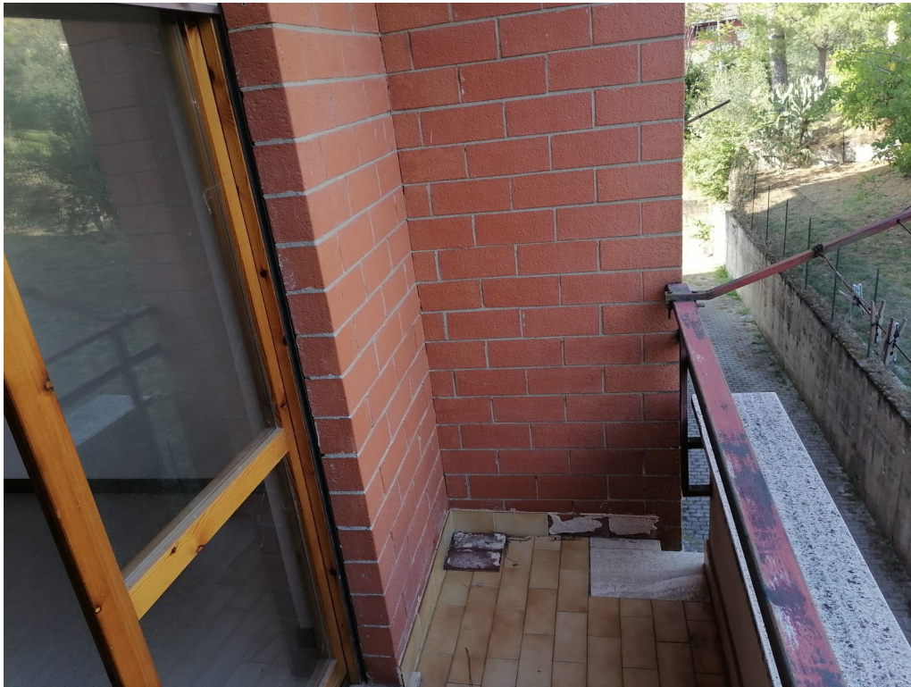
FOTO N° 14 Porzione di Fabbricato adibito ad Abitazione di tipo Civile (A/2) al Piano Terra e Secondo ubicato in Via Cappella Snc - PARTICOLARE BALCONE N. 3 - PIANO SECONDO