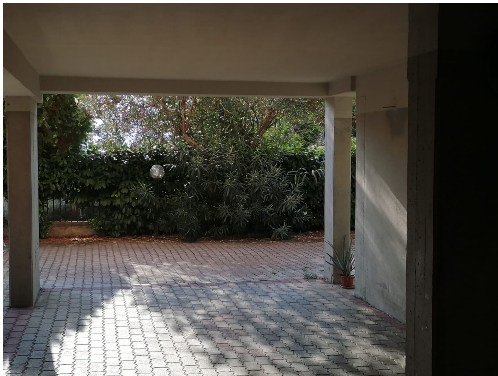
FOTO N° 4 Porzione di Fabbricato adibito ad Abitazione di tipo Civile (A/2) al Piano Terra e Secondo ubicato in Via Cappella Snc - PART. POSTO AUTO COPERTO – PIANO TERRA

FOTO N° 3 Porzione di Fabbricato adibito ad Abitazione di tipo Civile (A/2) al Piano Terra e Secondo ubicato in Via Cappella Snc - PART. POSTO AUTO COPERTO – PIANO TERRA