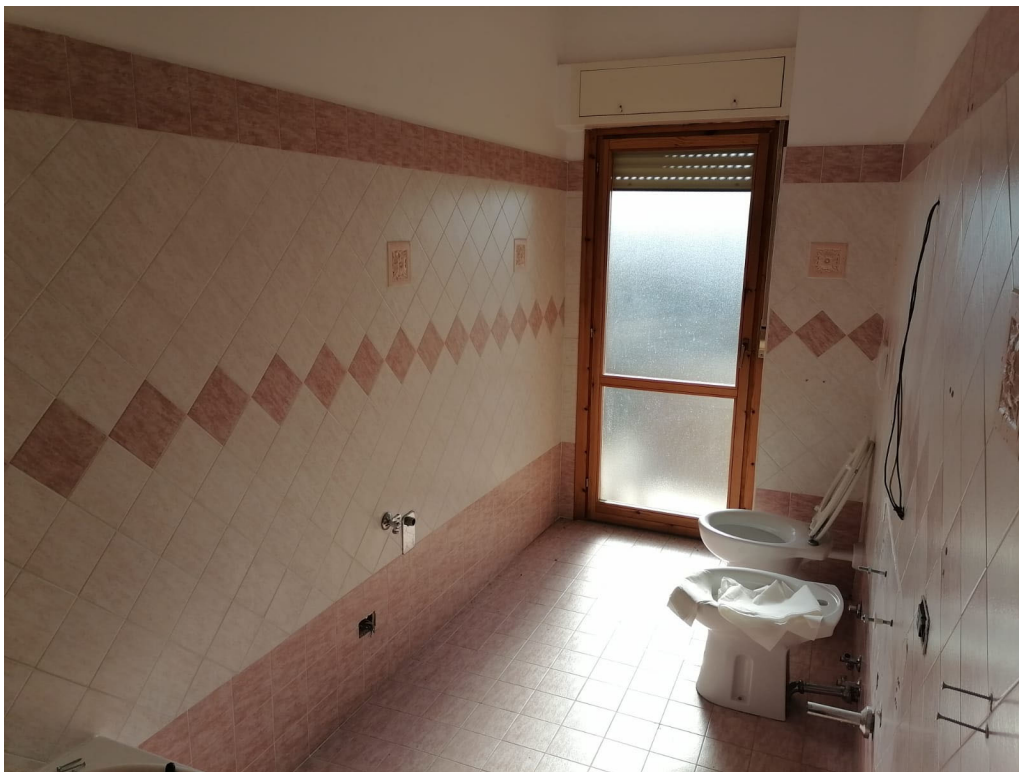
FOTO N° 12 Porzione di Fabbricato adibito ad Abitazione di tipo Civile (A/2) al Piano Terra e Secondo ubicato in Via Cappella Snc - PART. W.C. INTERNO – PIANO SECONDO