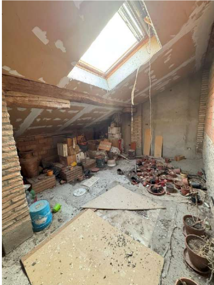
Soffitta-deposito foto 1