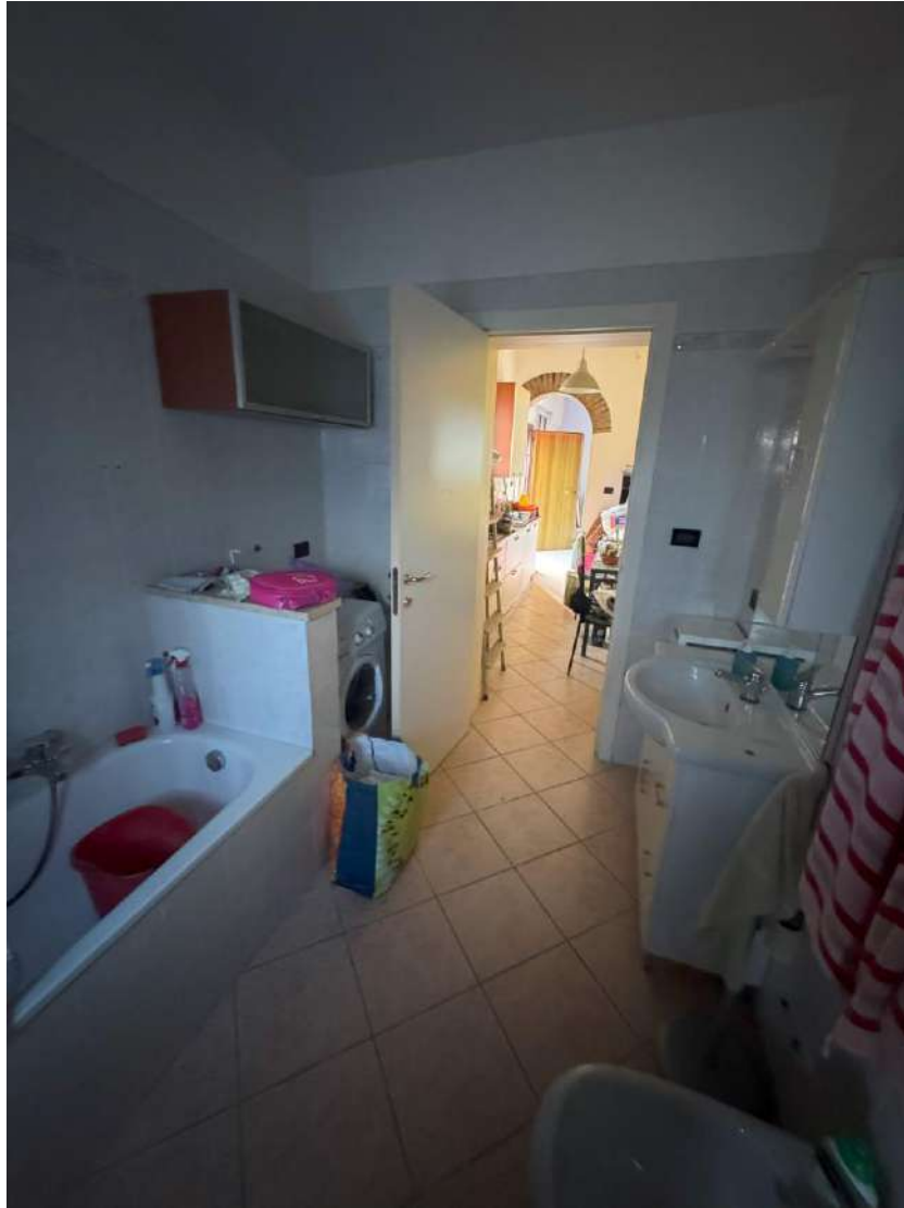
Bagno – foto 2