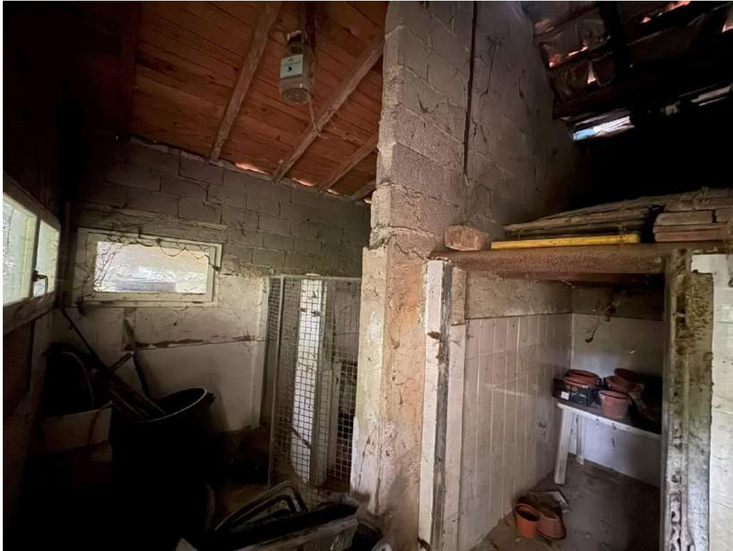
Deposito (ex pollai)