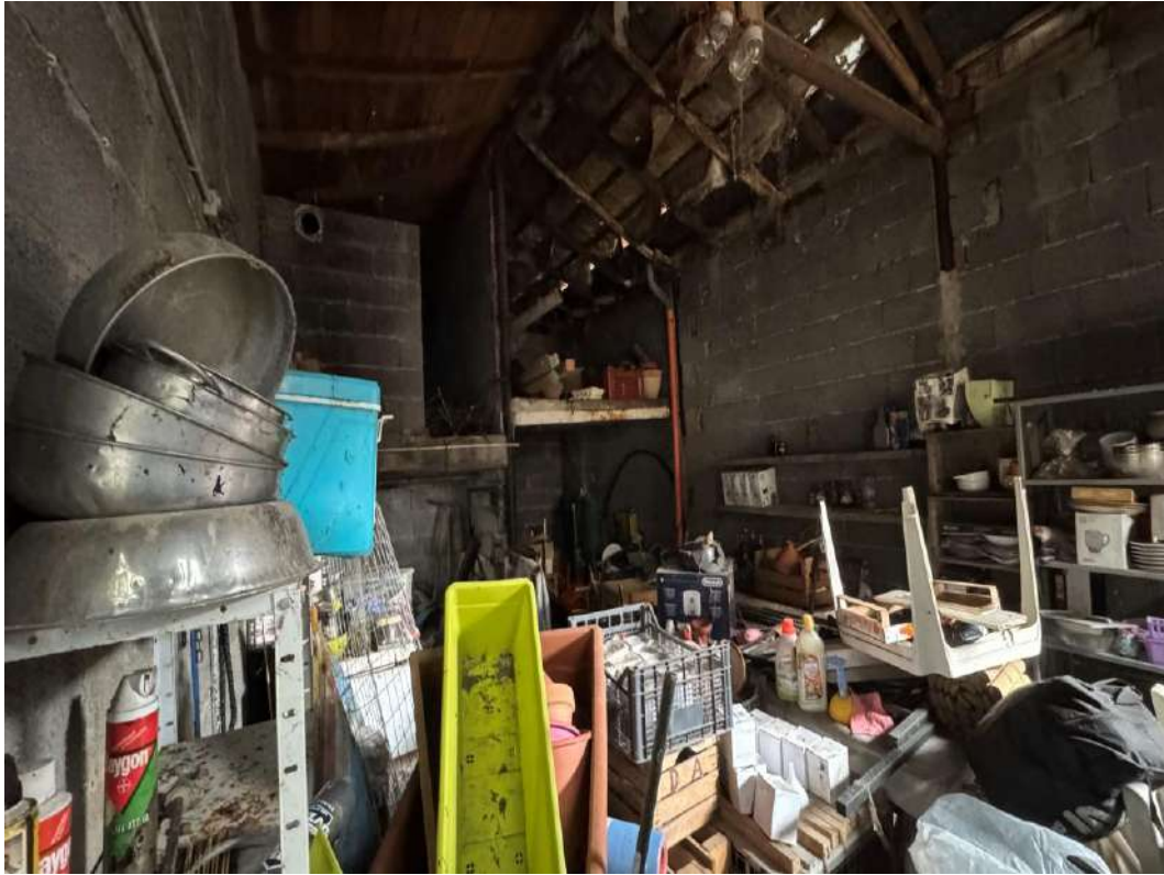
Autorimessa foto 2