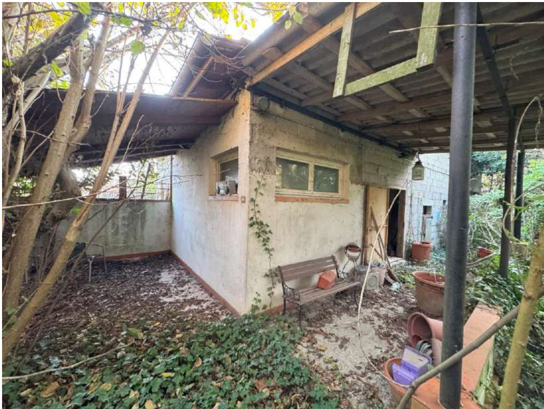
Ingresso locali deposito dal giardino