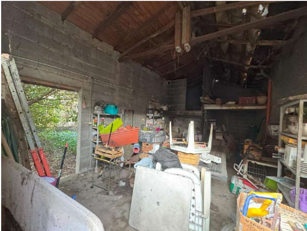
Autorimessa foto 1