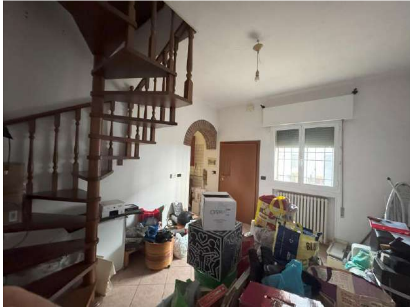
Soggiorno – foto 1