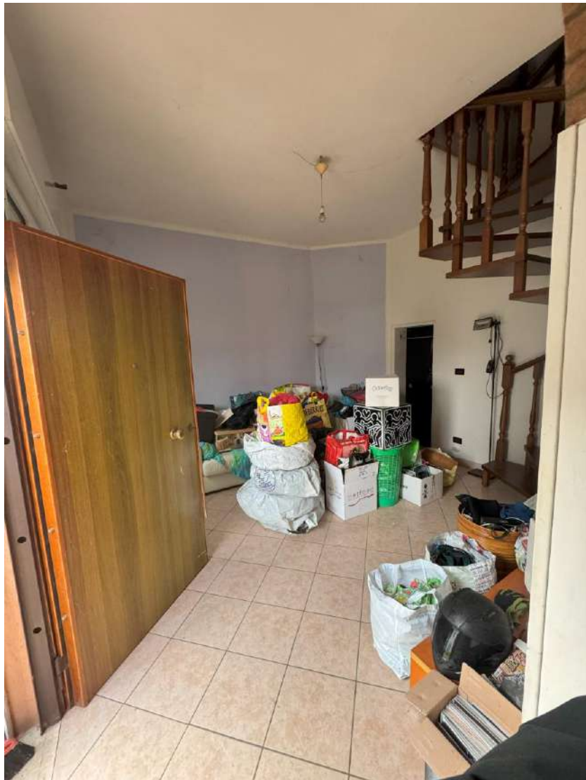
Soggiorno – foto 2