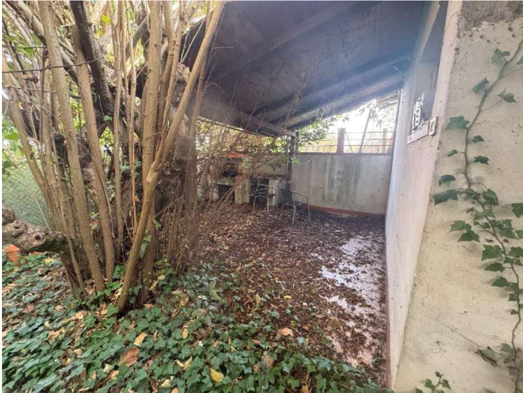
Giardino esclusivo – foto 2