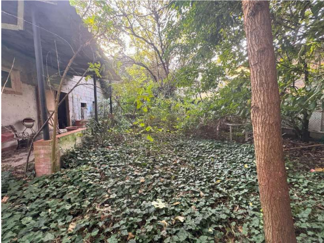
Giardino esclusivo – foto 4