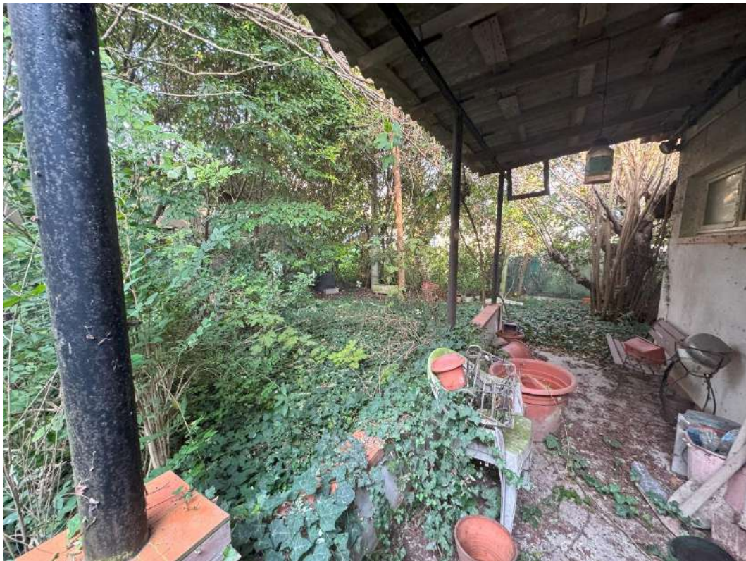
Giardino esclusivo – foto 1