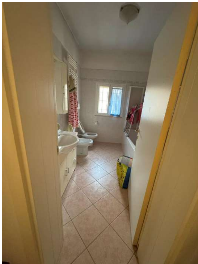
Bagno – foto 1