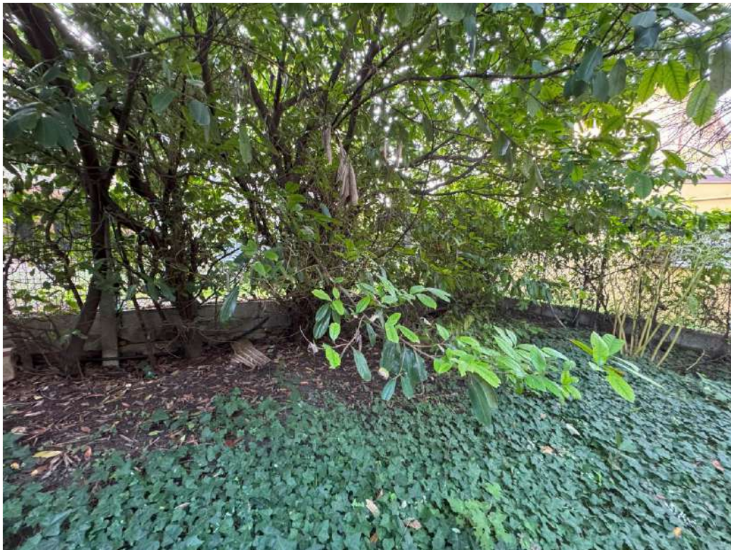
Giardino esclusivo – foto 5