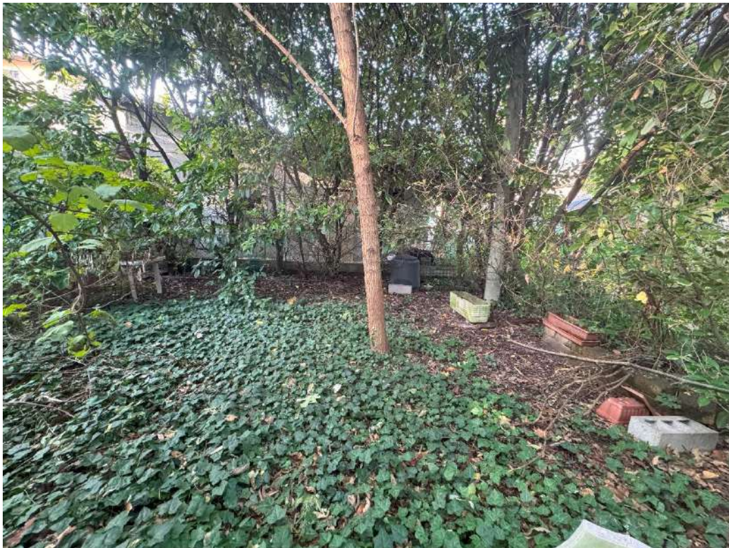
Giardino esclusivo – foto 3