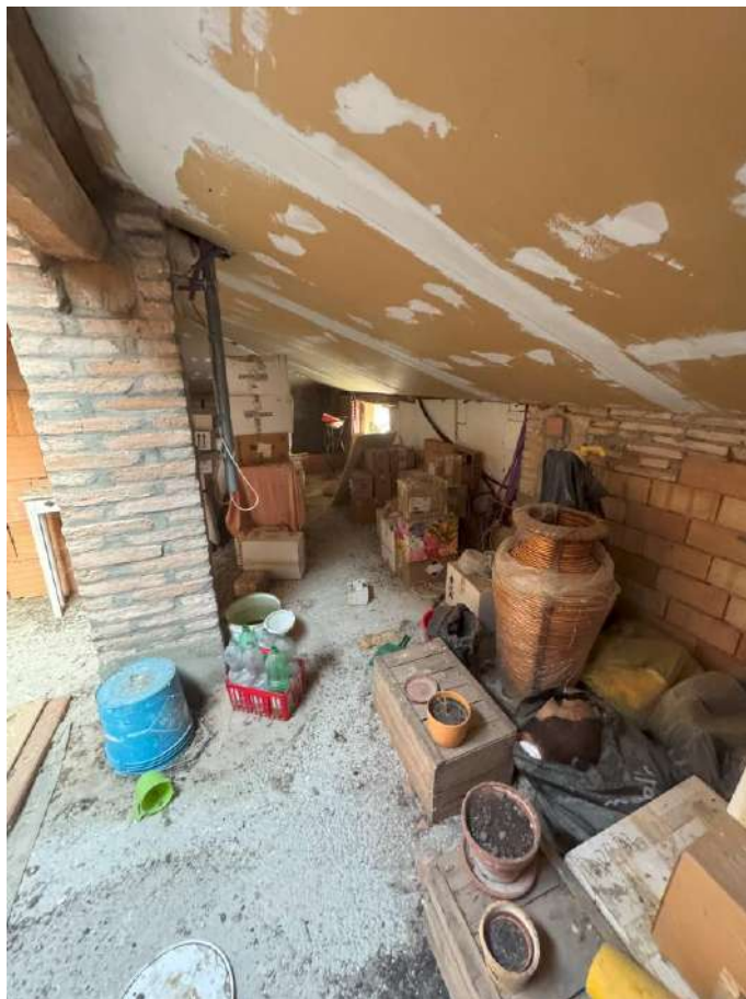
Soffitta-deposito foto 2