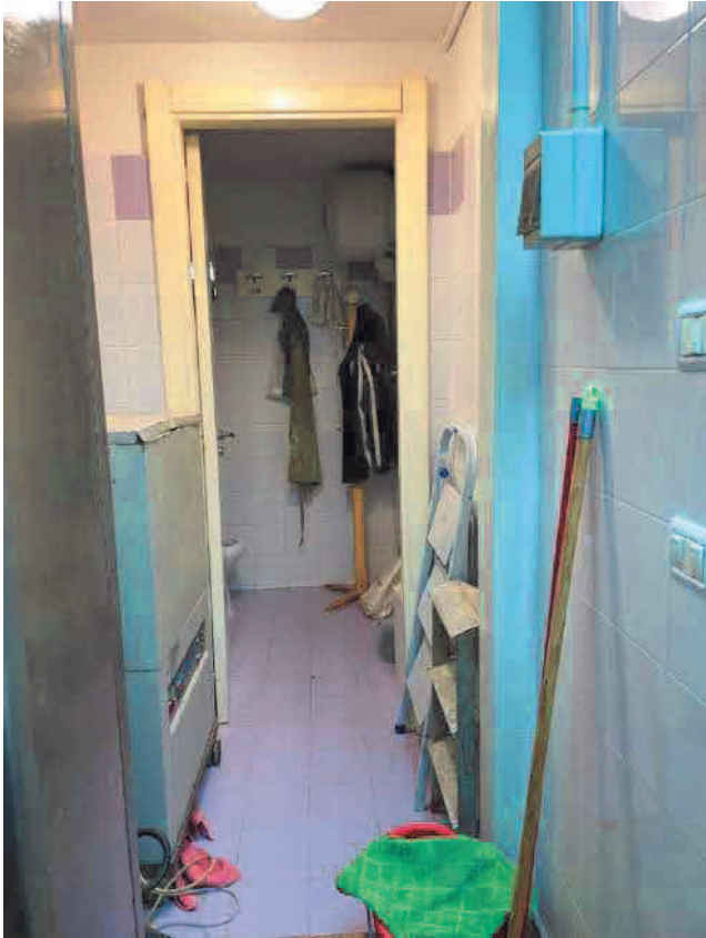
Figura 9. LOTTO UNO: Immobile pignorato al F. 31, P.Ila 3349, Sub. 5 ubicato in San Severo alla Via Francesco De Ambrosio n. 14 (disimpegno, anti-bagno e bagno).