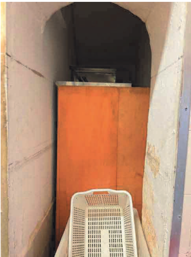
Figura 8. LOTTO UNO: Immobile pignorato al F. 31, P.IIa 3349, Sub. 5 ubicato in San Severo alla Via Francesco De Ambrosio n. 14 (sottoscala).