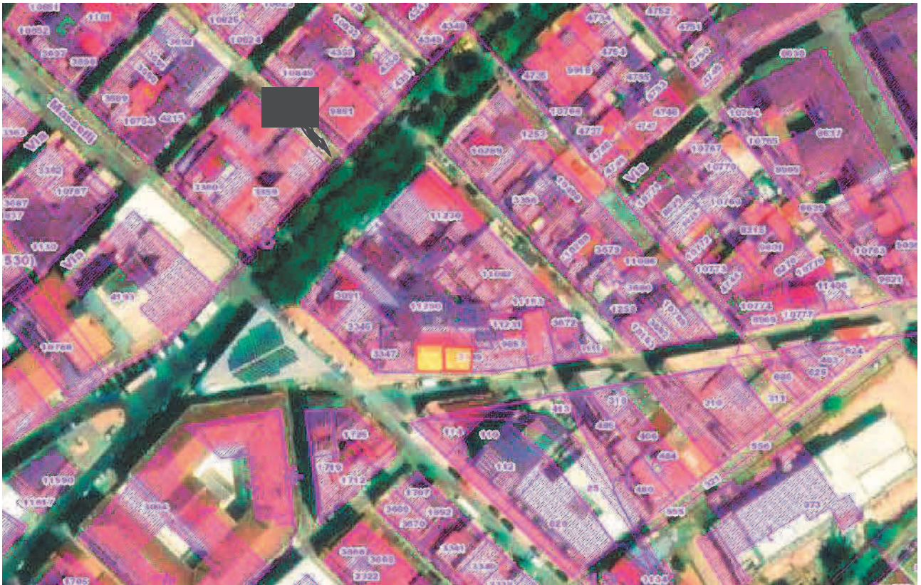
Figura 1. LOTTO UNO: Ortofoto catastale degli immobili pignorati al F. 31, P.Illa 3348, Sub. 4 e P.Illa 3349, Sub. 5 ubicati in San Severo alla Via Francesco De Ambrosio n. 6, 8 e 14.