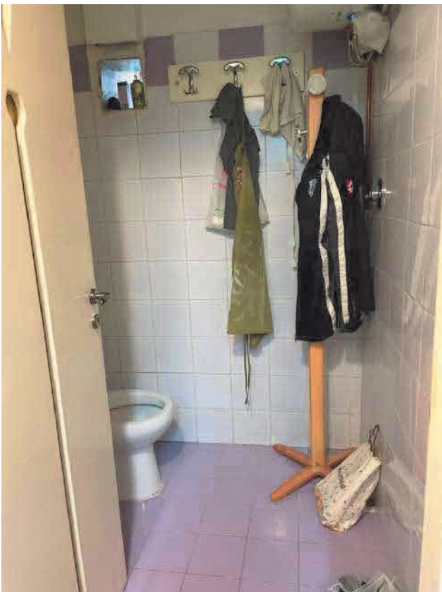
Figura 10. LOTTO UNO: Immobile pignorato al F. 31, P.Ila 3349, Sub. 5 ubicato in San Severo alla Via Francesco De Ambrosio n. 14 (bagno).