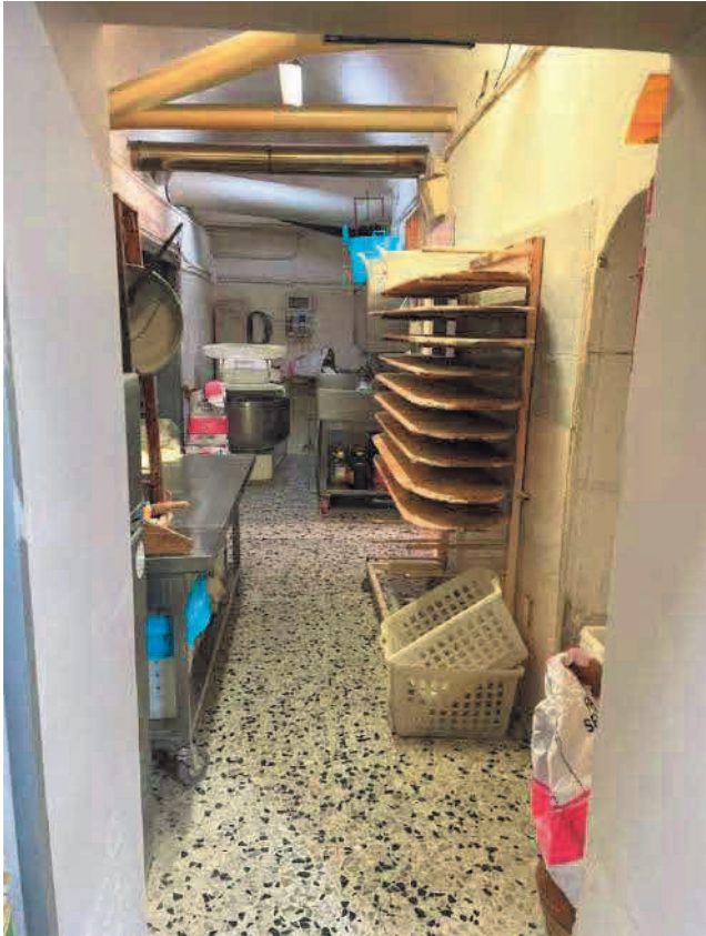
Figura 7. LOTTO UNO: Immobile pignorato al F. 31, P.IIa 3349, Sub. 5 ubicato in San Severo alla Via Francesco De Ambrosio n. 14 (retro vano).