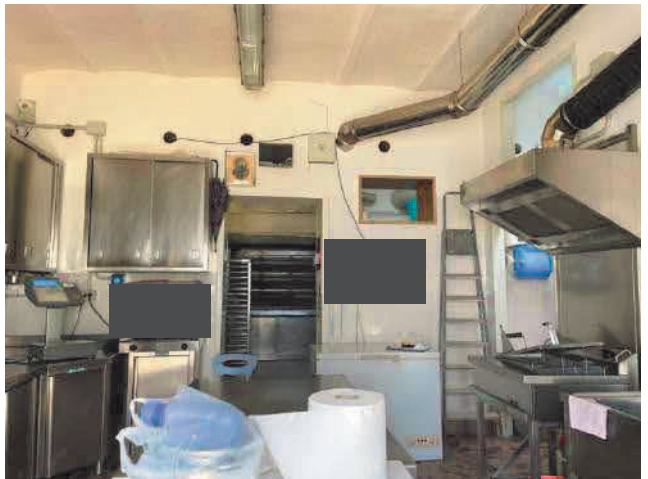
Figura 6. LOTTO UNO: Immobile pignorato al F. 31, P.Illa 3349, Sub. 5 ubicato in San Severo alla Via Francesco De Ambrosio n. 14 (laboratorio artigianale).