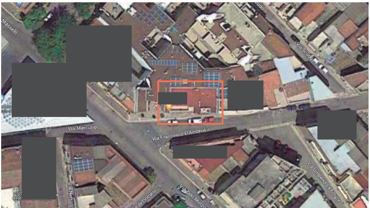
Figura 2. LOTTO UNO: Ortofoto degli immobili pignorati al F. 31, P.Illa 3348, Sub. 4 e P.Illa 3349, Sub. 5 ubicati in San Severo alla Via Francesco De Ambrosio n. 6, 8 e 14.