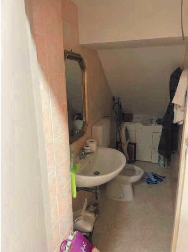
Figura 5. LOTTO UNO: Immobile pignorato al F. 31, P.Illa 3348, Sub. 4 ubicato in San Severo alla Via Francesco De Ambrosio n. 6 e 8 (bagno).