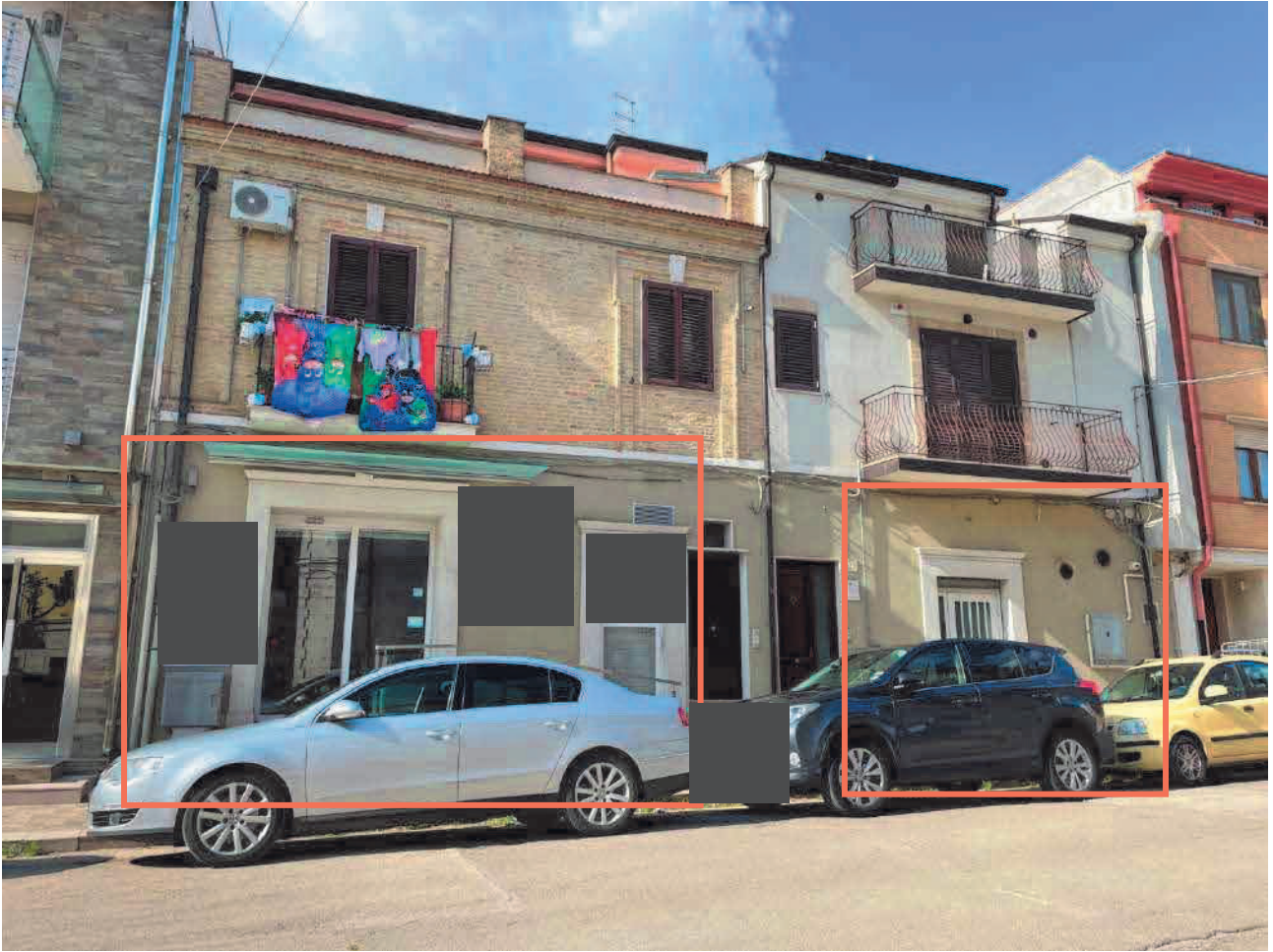
Figura 3. LOTTO UNO: Fabbricati in cui si trovano gli immobili pignorati al F. 31, P.Illa 3348, Sub. 4 e P.Illa 3349, Sub. 5 ubicati in San Severo alla Via Francesco De Ambrosio n. 6, 8 e 14.