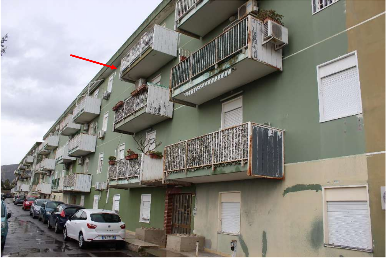
Fronte principale della scala A, lato zona parcheggio condominiale