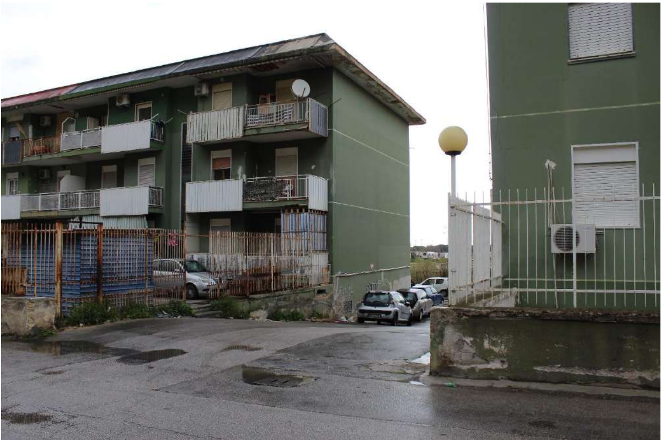
Strada di accesso dalla via Ciaculli