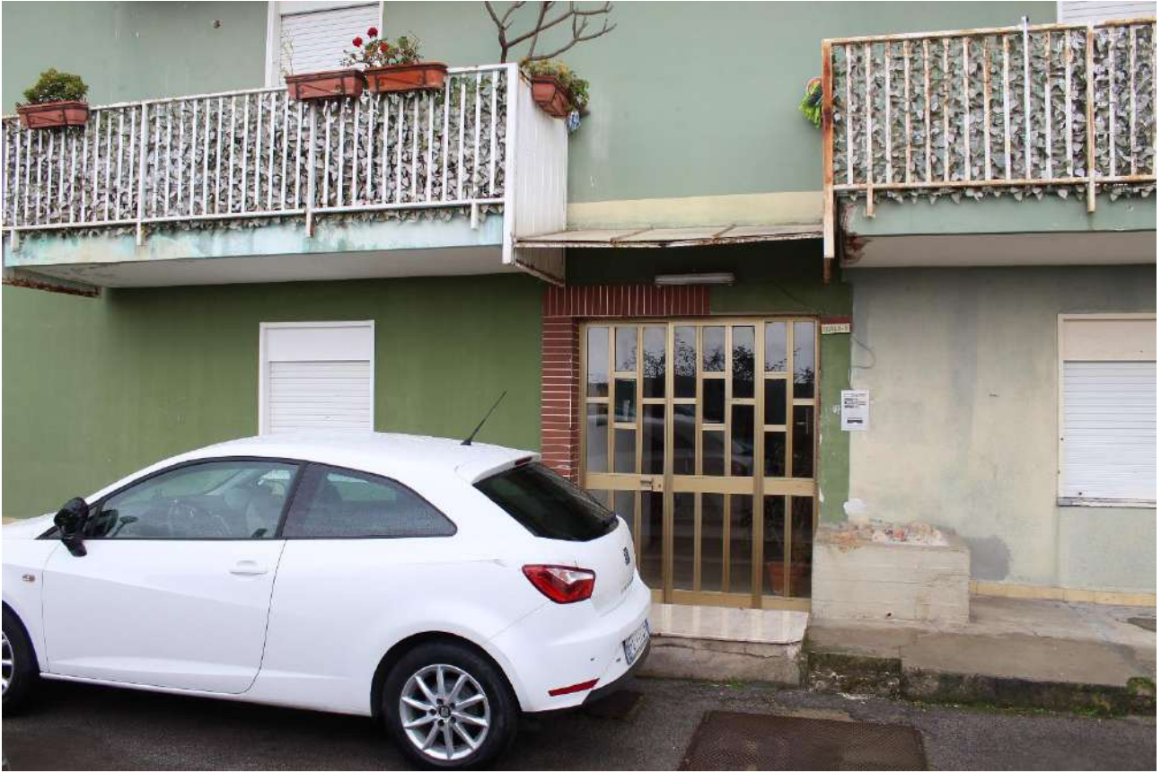
Ingresso scala A