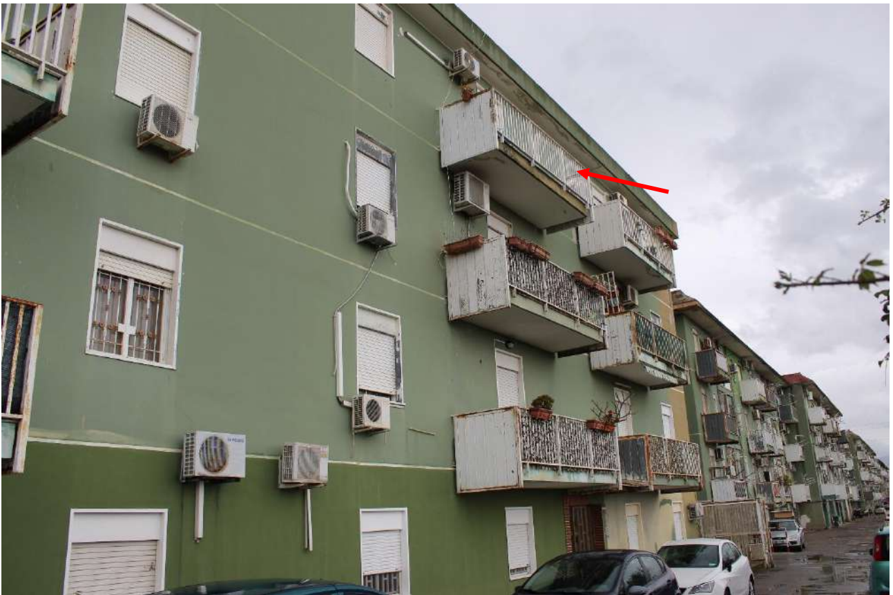
Fronte principale della scala A, a confine con area a parcheggio condominiale – Vista verso il cancello scorrevole di accesso