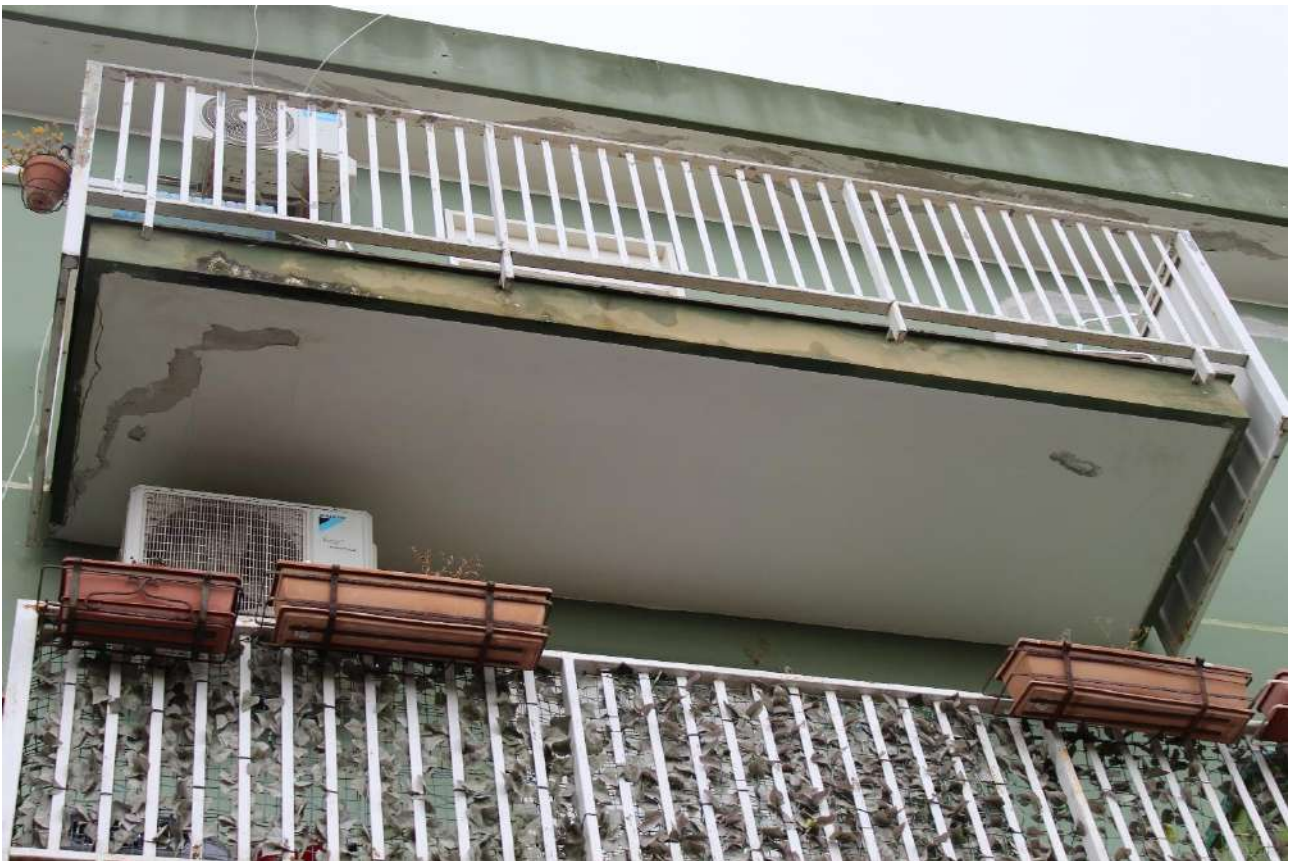
Balcone su prospetto principale con frontalino e intradosso danneggiati