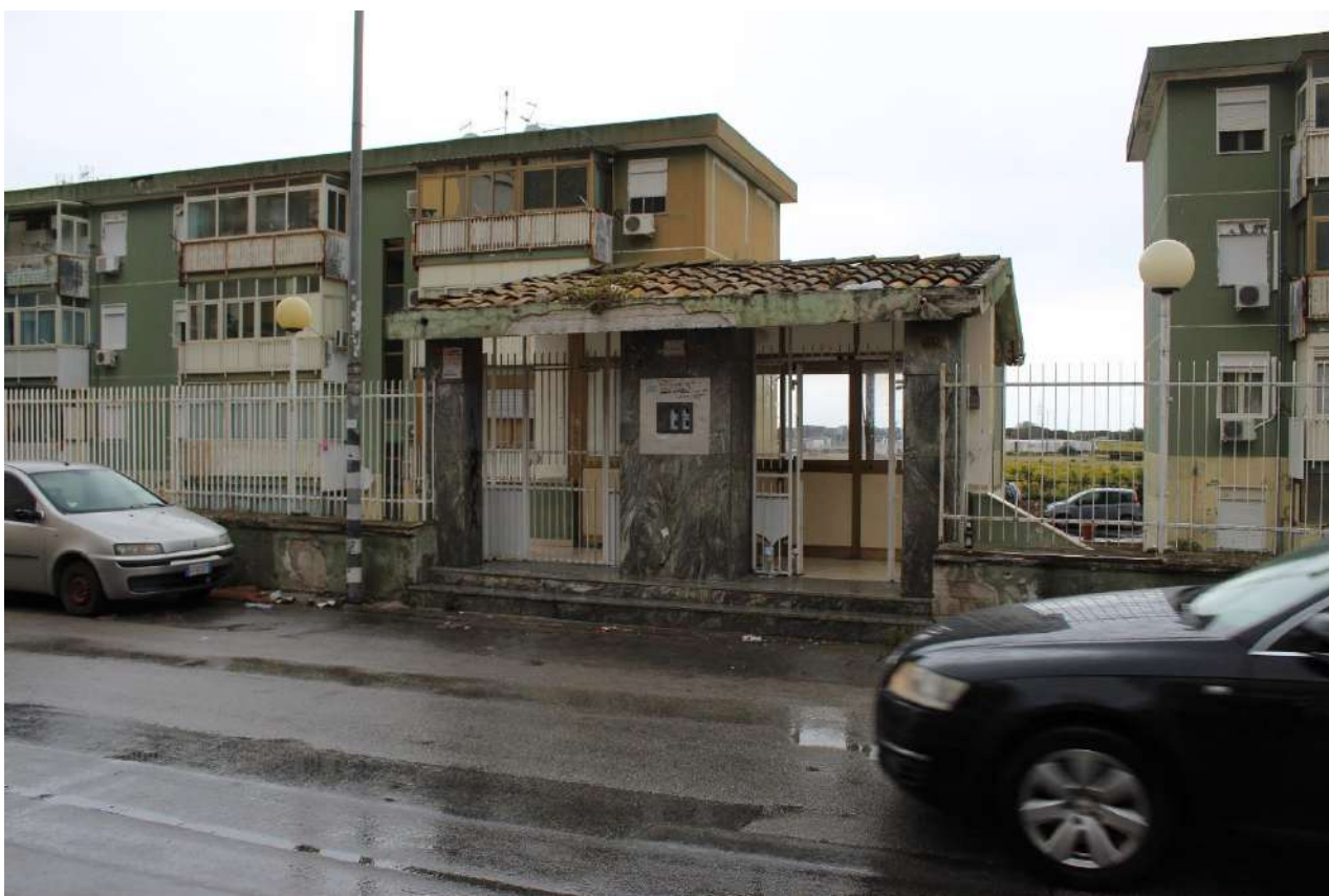
Ingresso al complesso condominiale dal civ. 30 della via Ciculli