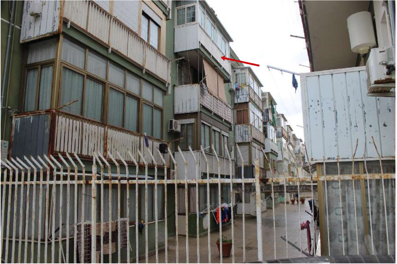
Retroprospetto dell'edificio scala A, a confine con spazi condominiali