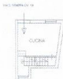
PIANO PRIMO H=mt. 2,70