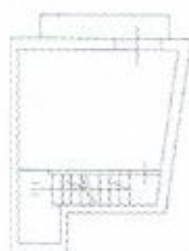
PIANO SECONDO H=mt. 2,50