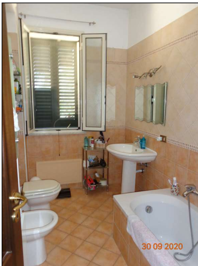
Foto n. 12 - Interni: Bagno con vasca, interno alla camera da letto principale