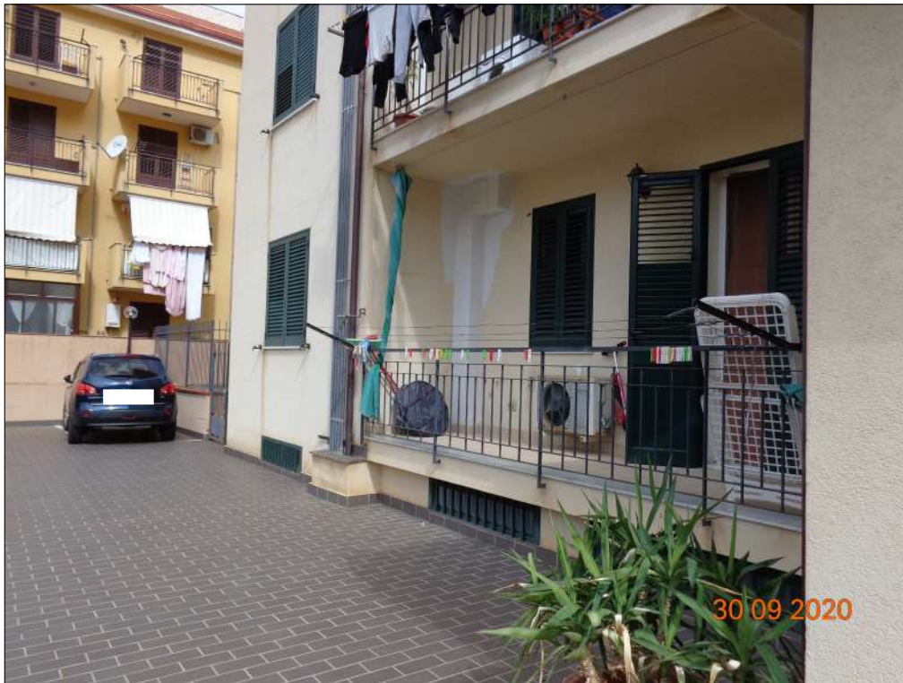
Foto n. 5 - Balcone su spazio a parcheggio condominiale