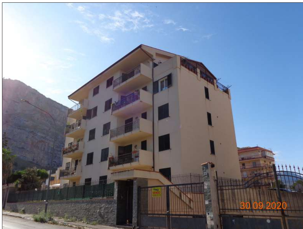
Foto n. 2 - Vista esterna