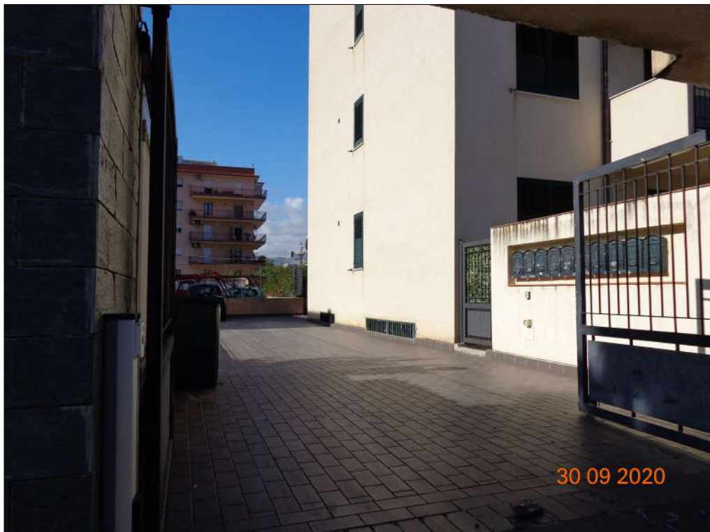
Foto n. 4 - Vista esterna dell'area parcheggio condominiale