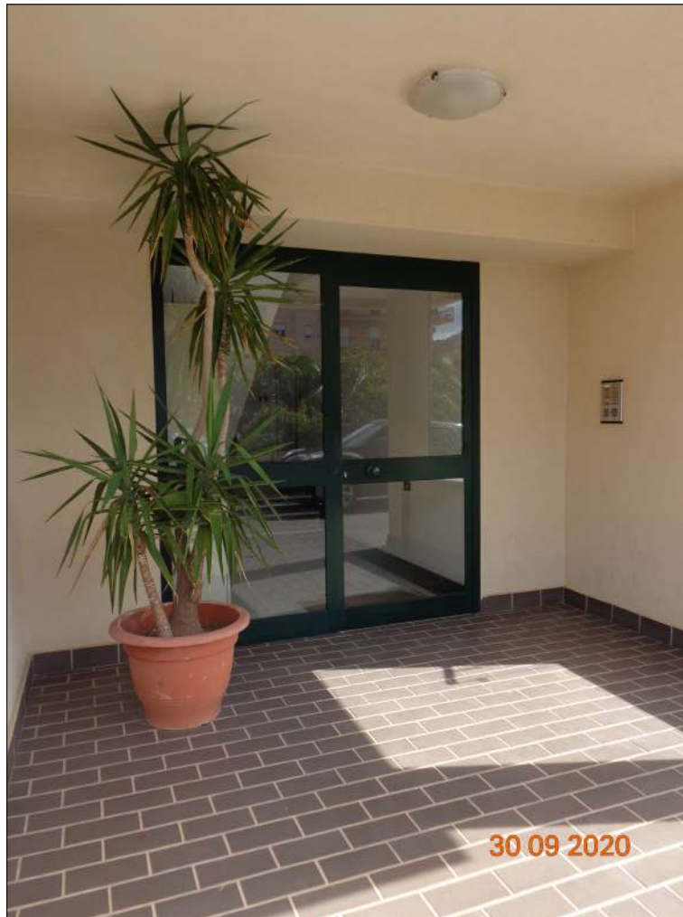
Foto n. 7 - Portone di ingresso condominiale sullo spazio a parcheggio