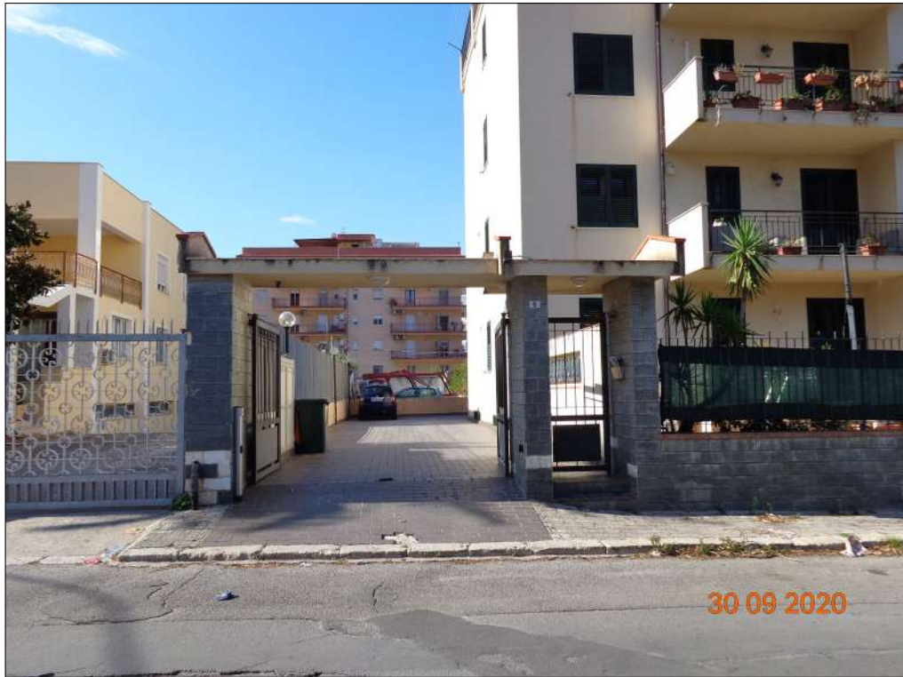
Foto n. 3 - Vista esterna dei cancelli di ingresso