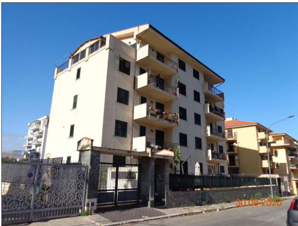
Foto n. 1 - Vista esterna