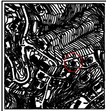
STIPULAZIONE DI ACCORDO DI INTERVENIRE... PROVA PER IL M.O. R.G.