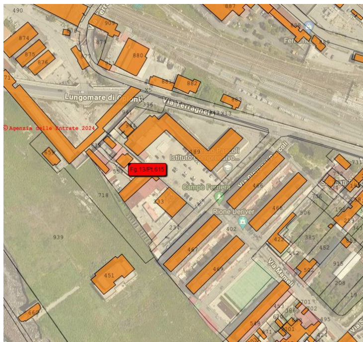
Fig.1 – stralcio aerofotogrammetrico con sovrapposizione del catasto urbano