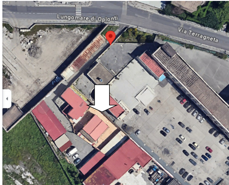
Fig.1 - Vista dell'immobile e del suo intorno

Le due unità edilizie oggetto di pignoramento immobiliare come innanzi descritte, sono ubicate nella zona a valle del comune di Torre Annunziata, ovvero quasi a ridosso della zona portuale alla quale si giunge percorrendo la via Terragneta.