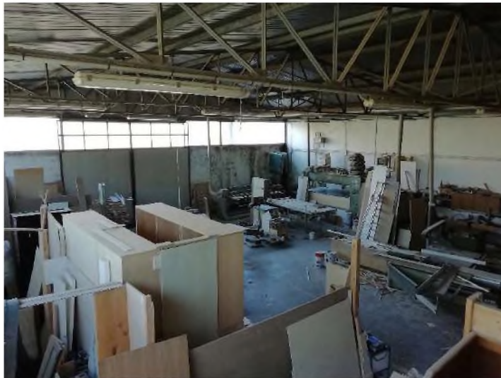
PIANO TERRA: Laboratorio