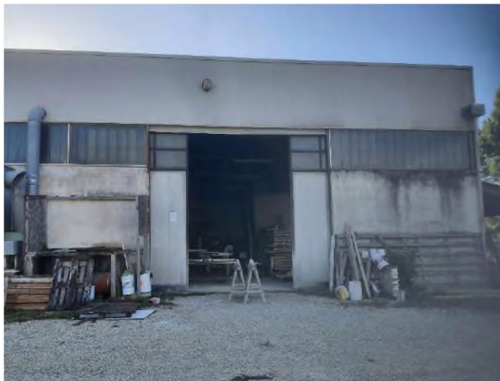
Accesso carraio lato Nord