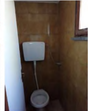
PIANO TERRA: spogliatoio e servizi igienici