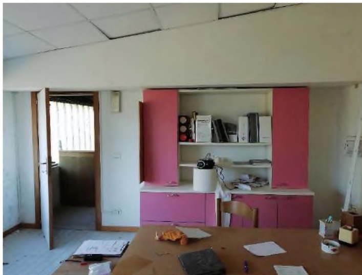
PIANO PRIMO: ufficio