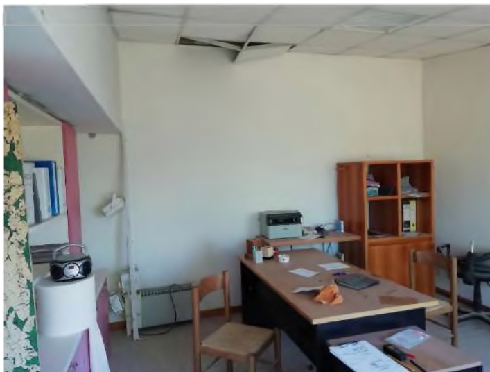
PIANO PRIMO: ufficio