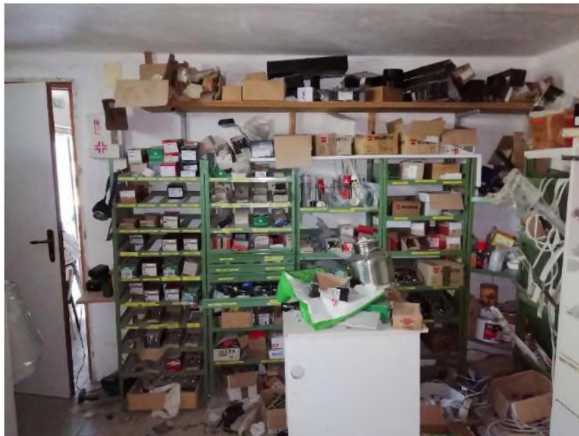
PIANO TERRA: spogliatoio