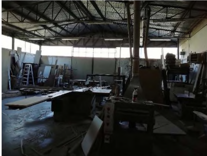
PIANO TERRA: Laboratorio