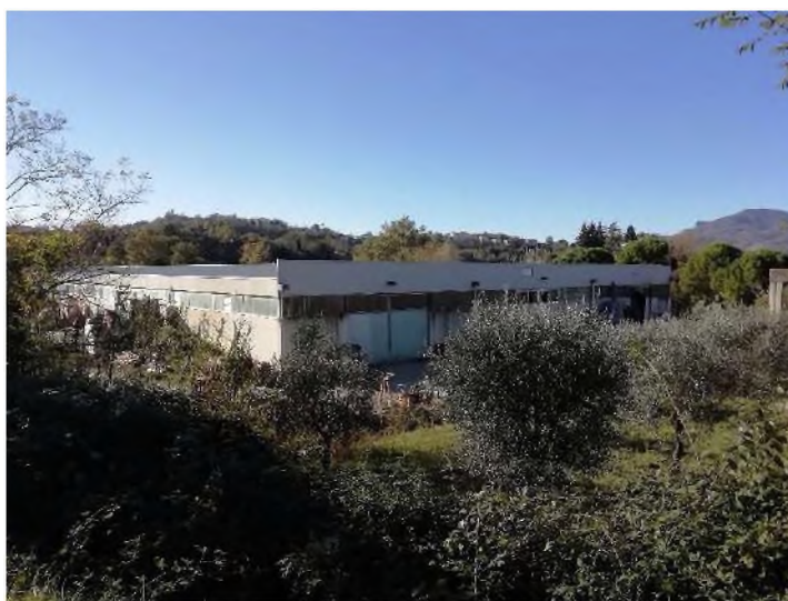
Prospetti Est e Nord