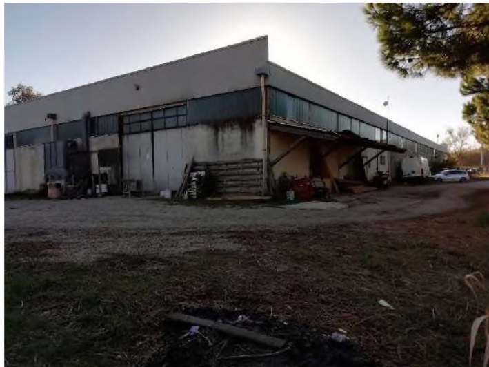
Prospetti Nord e Ovest