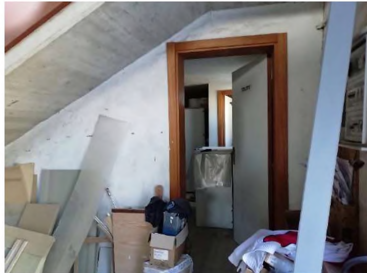
PIANO TERRA: accesso locali di servizio