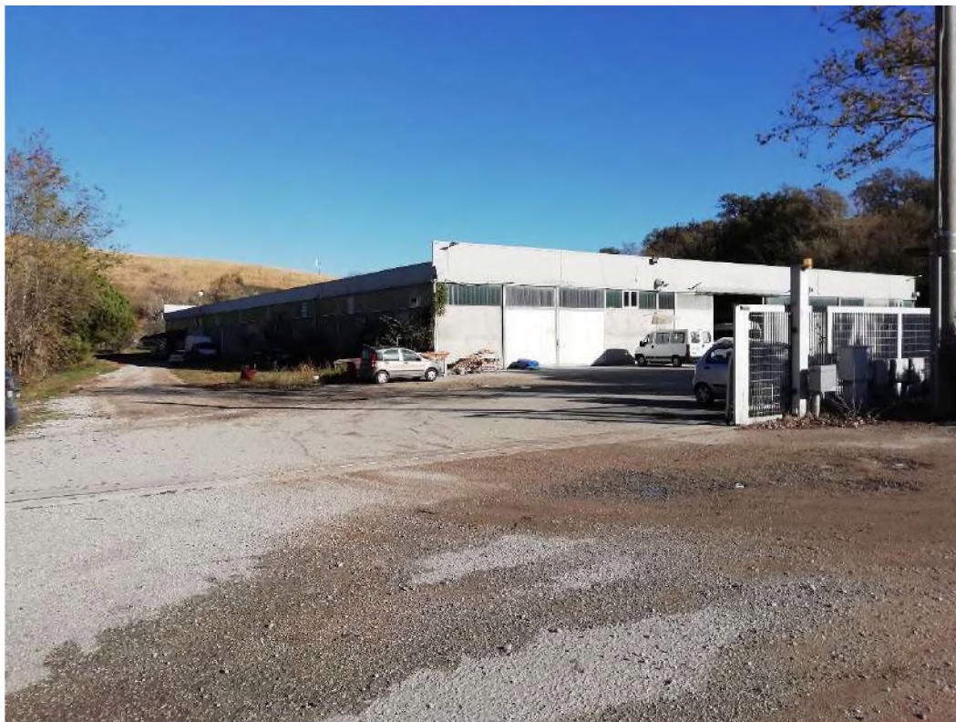
Ingresso principale all'intero fabbricato