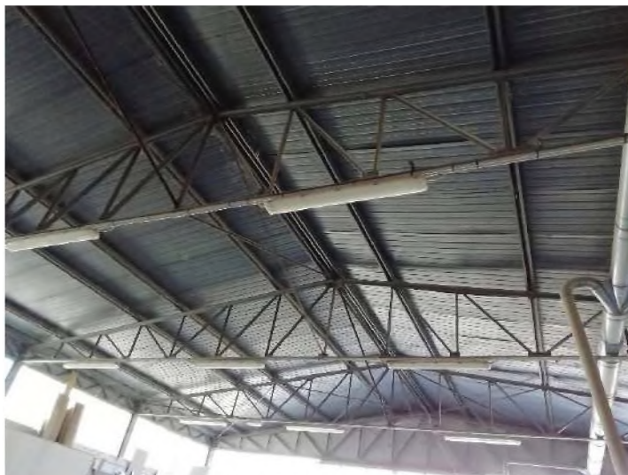
PIANO TERRA: Copertura