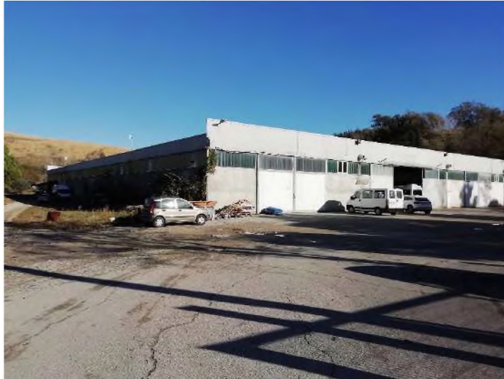
Prospetti Ovest e Sud