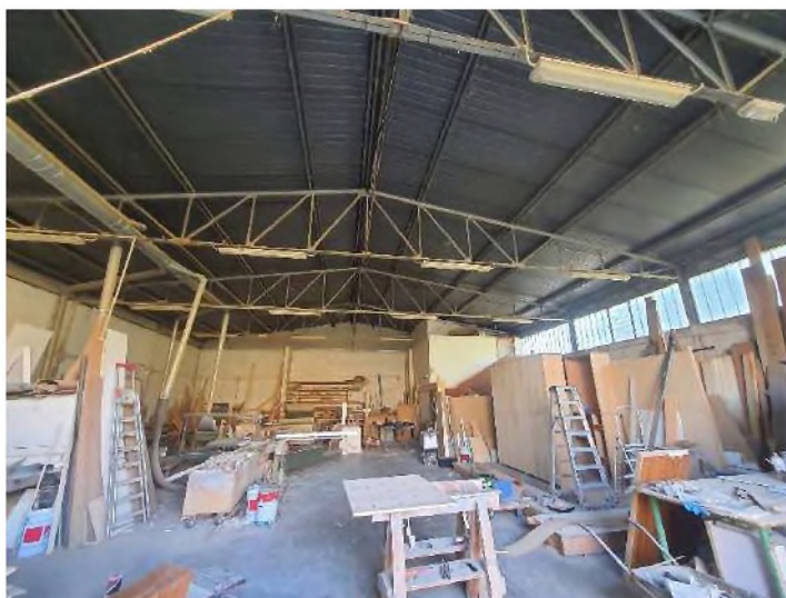
PIANO TERRA: Laboratorio