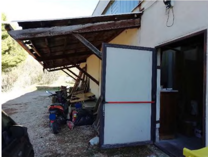
Accesso pedonale/uscita di emergenza e pensilina lato Ovest