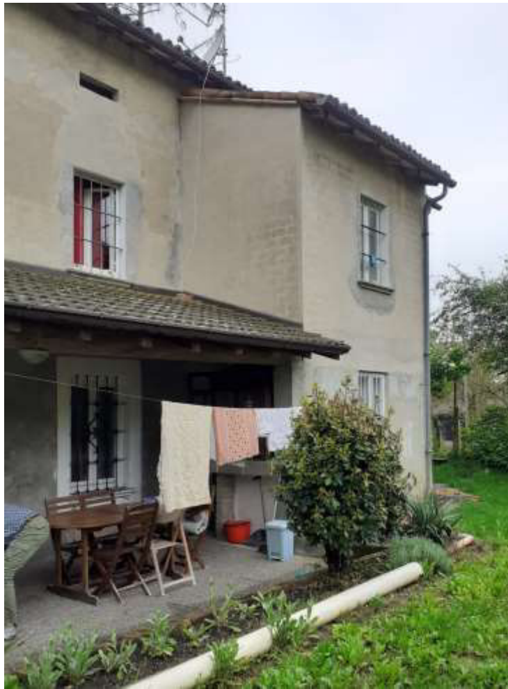
Retro Abitazione (verso cortile/ giardino interno)