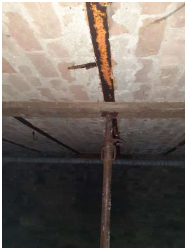
PARTICOLARE soffitto cantina al piano interrato