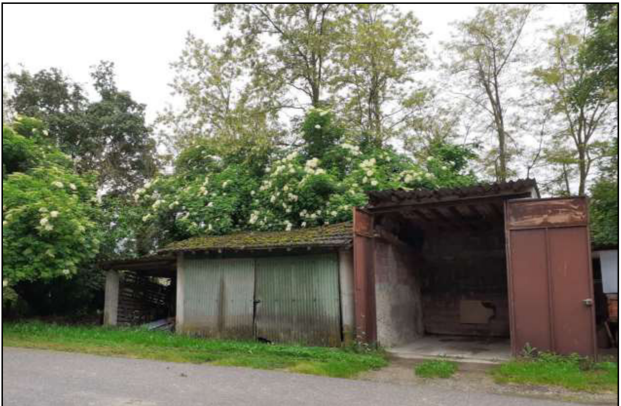
Fabbricati abusivi non sanabili (da demolire)