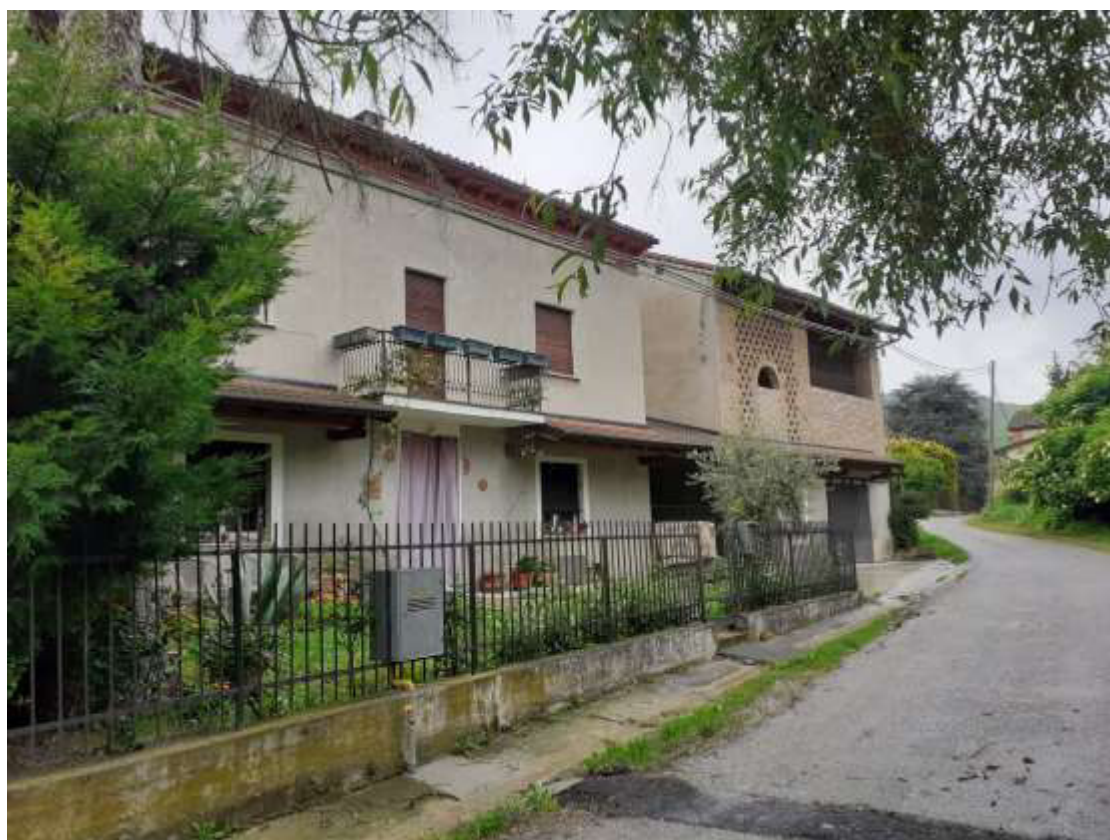
Fronte principale Abitazione (verso S.P. 203)