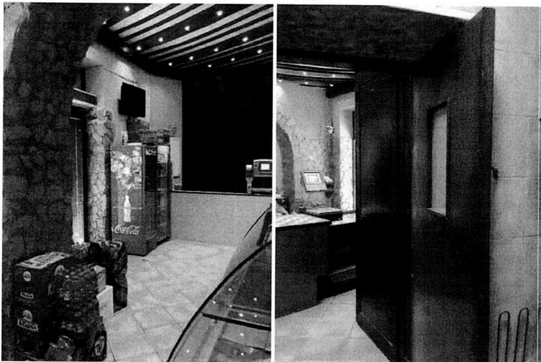
FOTO 10 e 11: Vano lato ovest del Lotto (foto di sinistra) e porta di collegamento tra il bene pignorato e il bene definito dell'interno n. 66 non oggetto di pignoramento ma di fatto collegato all'immobile oggetto di analisi (foto di destra)