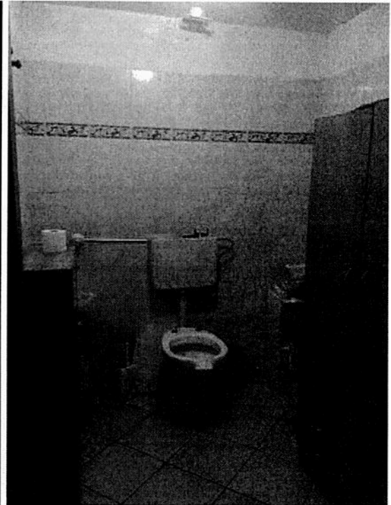
FOTO 7 e 8: WC lato est (foto di sinistra) e WC lato ovest (foto di destra)