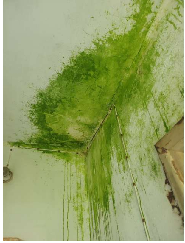
Foto 22_Presenza di infiltrazioni su solaio piano primo verso sottotetto