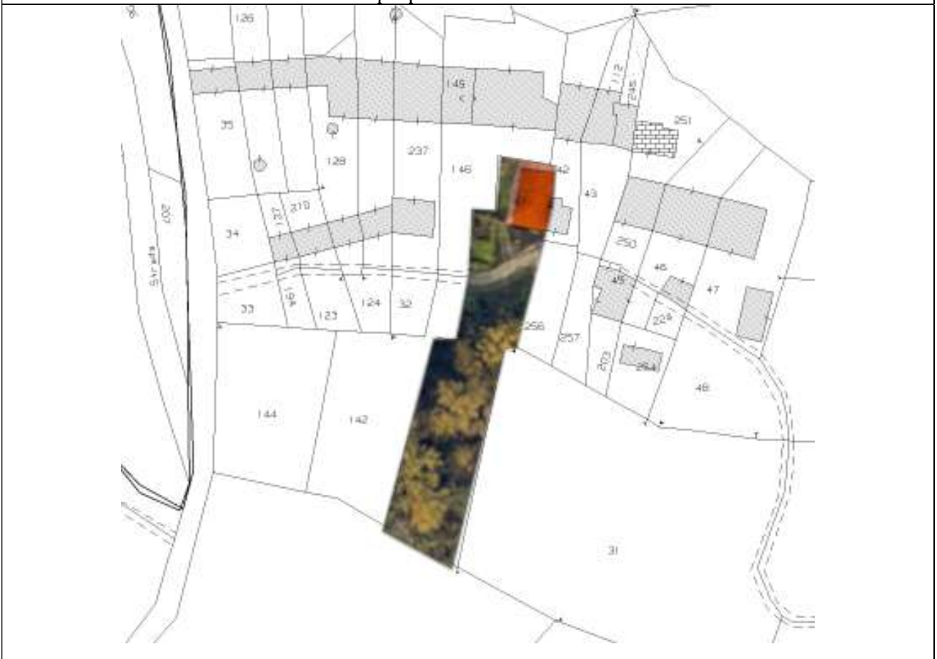
Estratto foglio catastale fg 22 Comune di Casalborgone con evidenziate di massima la costruzione edilizia in esecuzione part 236 sub 2 e sub 3 (+ BCNC sub 1) ed il terreno in esecuzione part 143 - cfr. Allegato 2 Planimetrie catastali