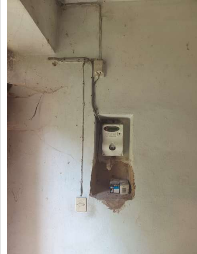
Foto 21 _Tipologia di impianto elettrico e quadro