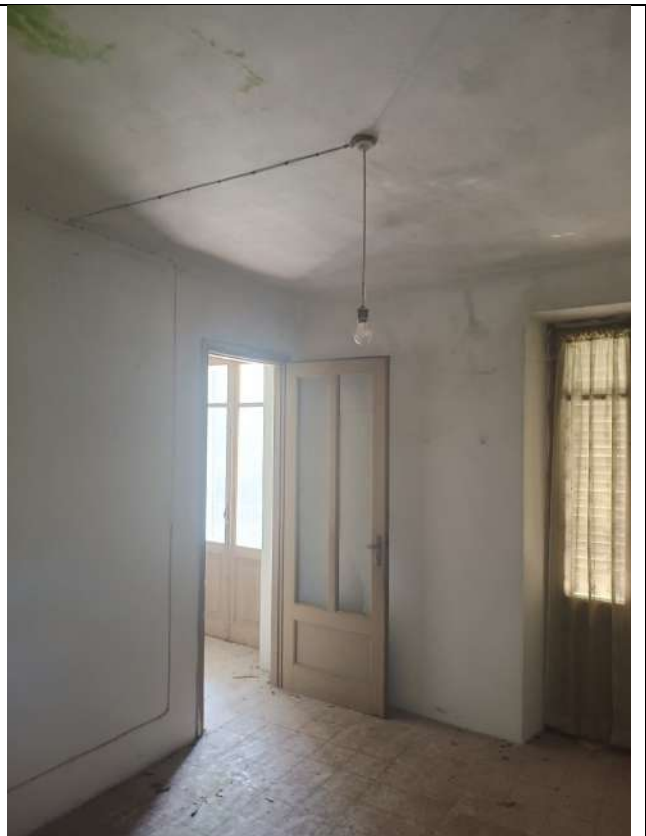
Foto 17 _Vista verso la seconda camera al piano primo , con accesso possibile solo dalla prima