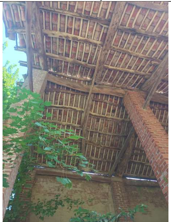
Foto 27. Vista della copertura a vista su sub 3