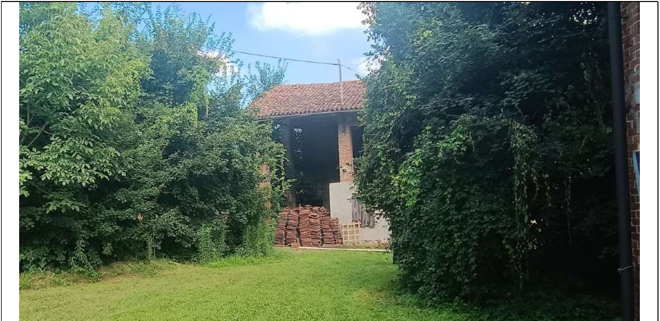
Foto 8. Vista verso la costruzione in esecuzione, dalla area interna dopo il cancello. Non vi sono delimitazioni a definire le singole proprietà