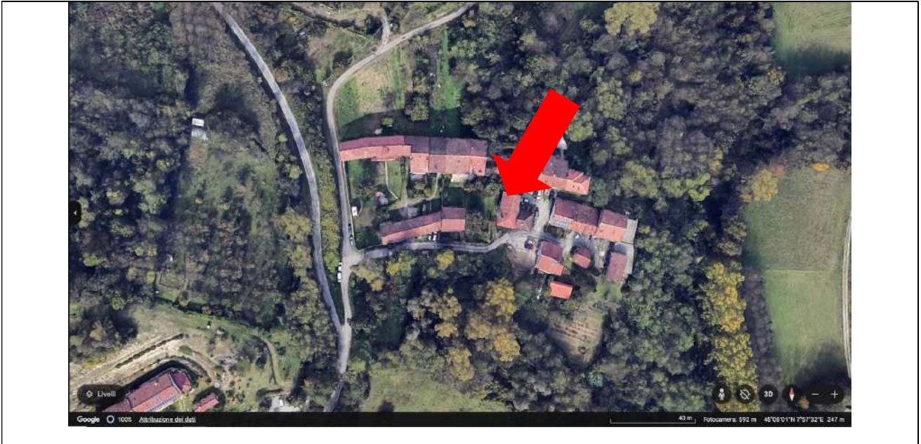
Foto 0. Vista zenitale da Google Earth® della borgata di Borganino del Comune di Casalborgone con indicata la proprietà edilizia in esecuzione