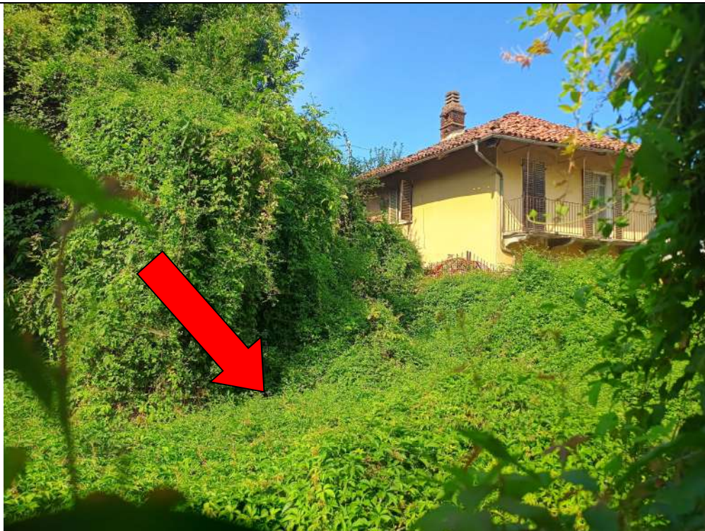
Foto 29_Vista di porzione del BCNC sub 1 verso ovest, delimitata da muro di recinzione verso la via stradale, ma senza divisioni interne verso altre proprietà