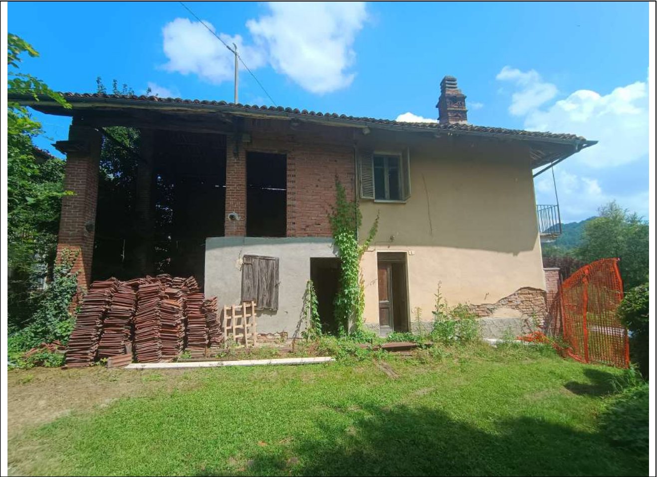
Foto 3. Prospetto ovest della costruzione