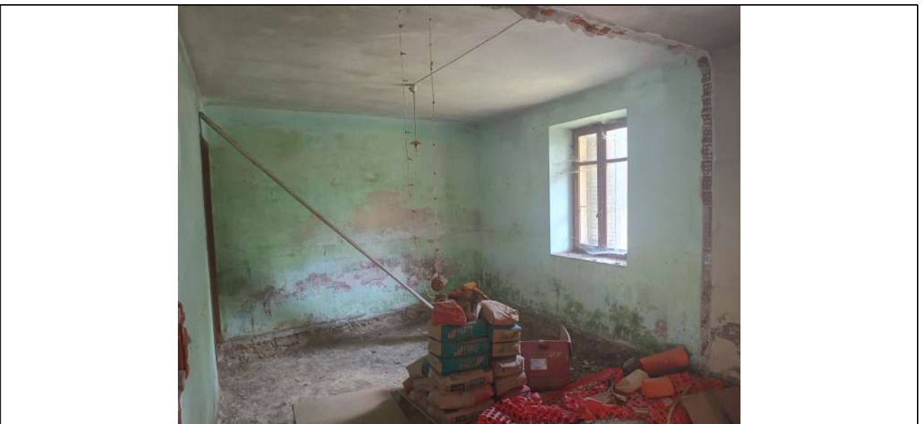
Foto 12. Vista del piano terreno fg 22 part 236 sub 2 verso est