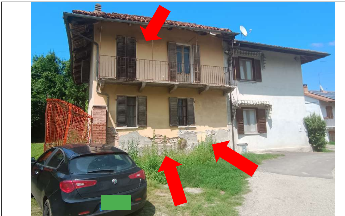
Foto 1. Vista verso la proprietà in esecuzione (evidenziata dalle frecce in rosso), a sx l'attuale ingresso - uso comune ad altre proprietà - dal cancello coperto da telo forato arancione, in primo piano il BCNC (fg 22 part 236 sub 1) per la porzione verso la via