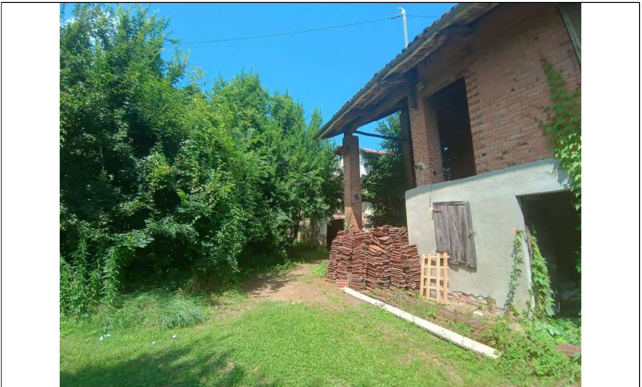
Foto 7. Particolare del sub 1 BCNC, verso le altre proprietà che si affacciano sul lato lato nord. Non vi sono delimitazioni a definire le singole proprietà