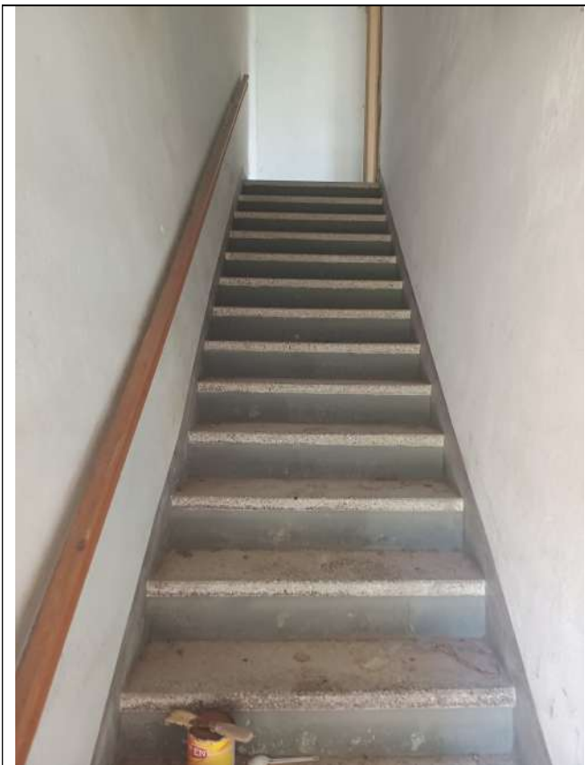
Foto 14. Vista verso collegamento verticale interno part 236 sub 2