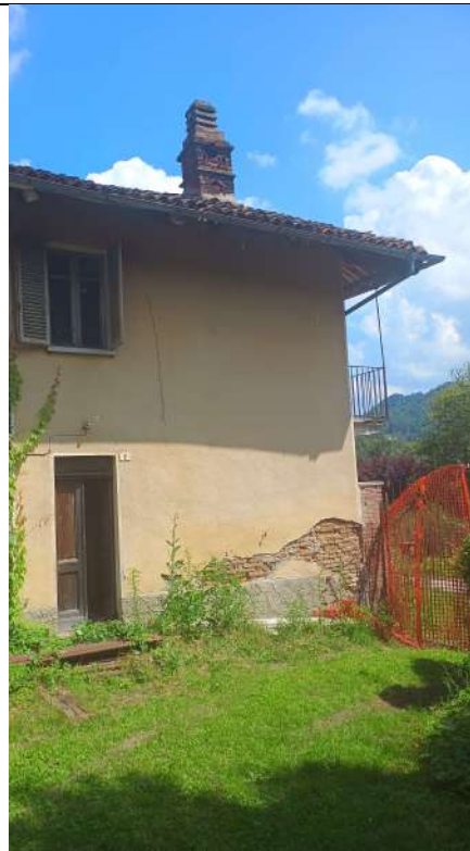
Foto 4. Porzione prospetto ovest verso testata sud (fg 22 part 236 sub 2)