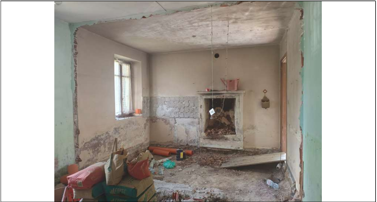
Foto 13. Vista del piano terreno fg 22 part 236 sub 2 verso ovest