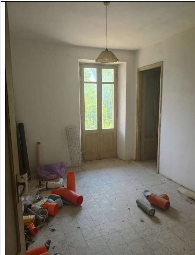
Foto 16 _Vista verso la camera che si affaccia su pianerottolo della scala (camera passante)