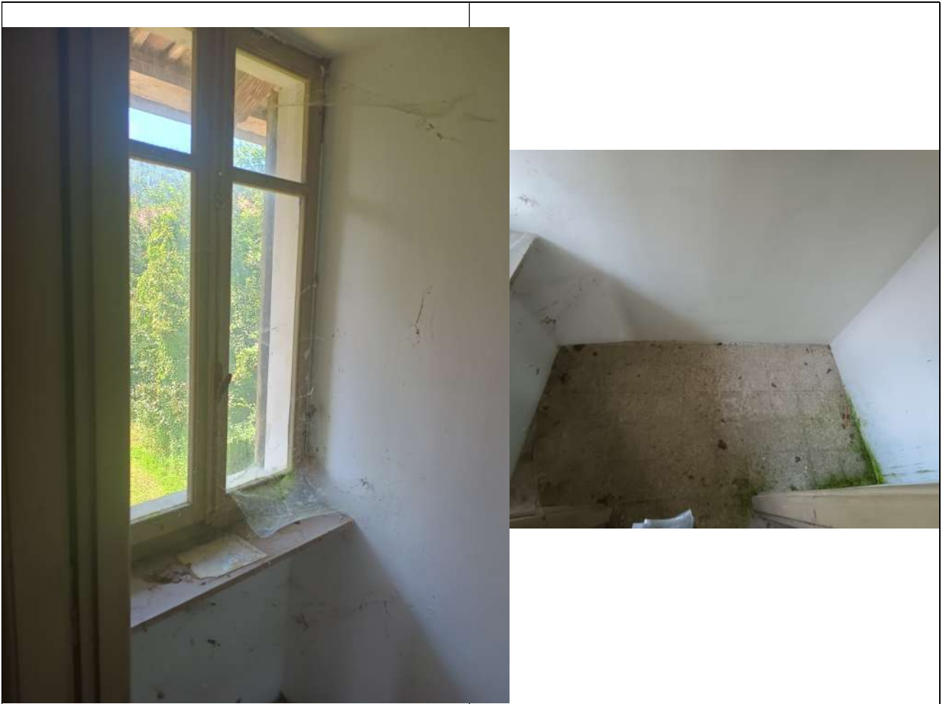
Foto 20 _Vista verso locale catastalmente definito wc, in realtà ripostiglio senza attacchi e scarichi con evidenti