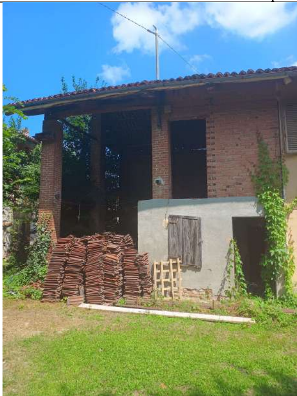
Foto 4. Porzione prospetto ovest verso testata nord (fg 22 part 236 sub 3)