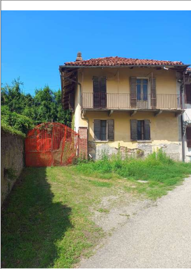
Foto 5. Particolare prospetto sud verso la via