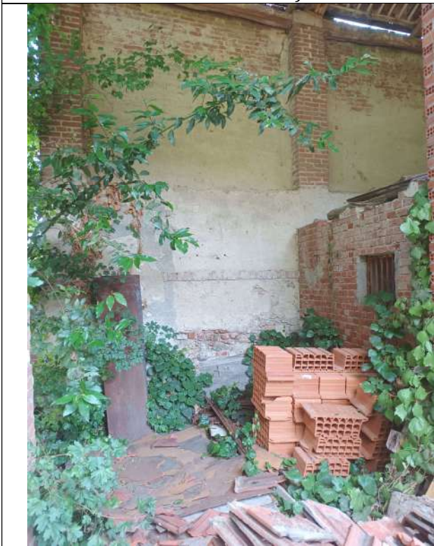
Foto 26. Vista Tettoia a nudo tetto piano terra (parte unità sub 3 lato nord)