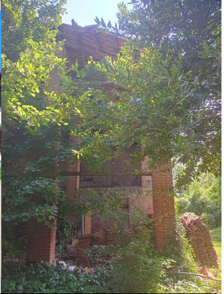
Foto 6. Particolare prospetto nord