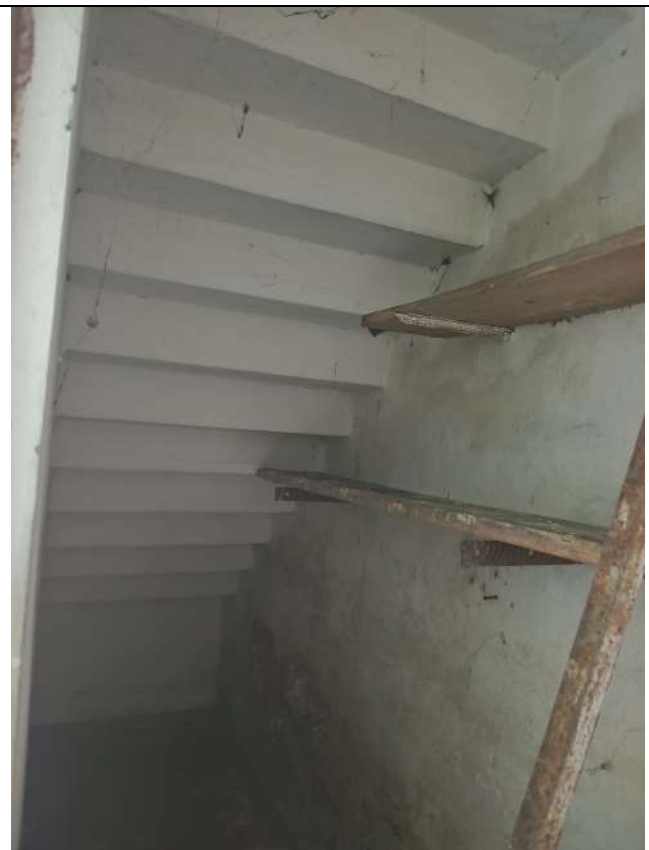
Foto 15. Vista verso sottoscala (in catasto indicato ripostiglio)