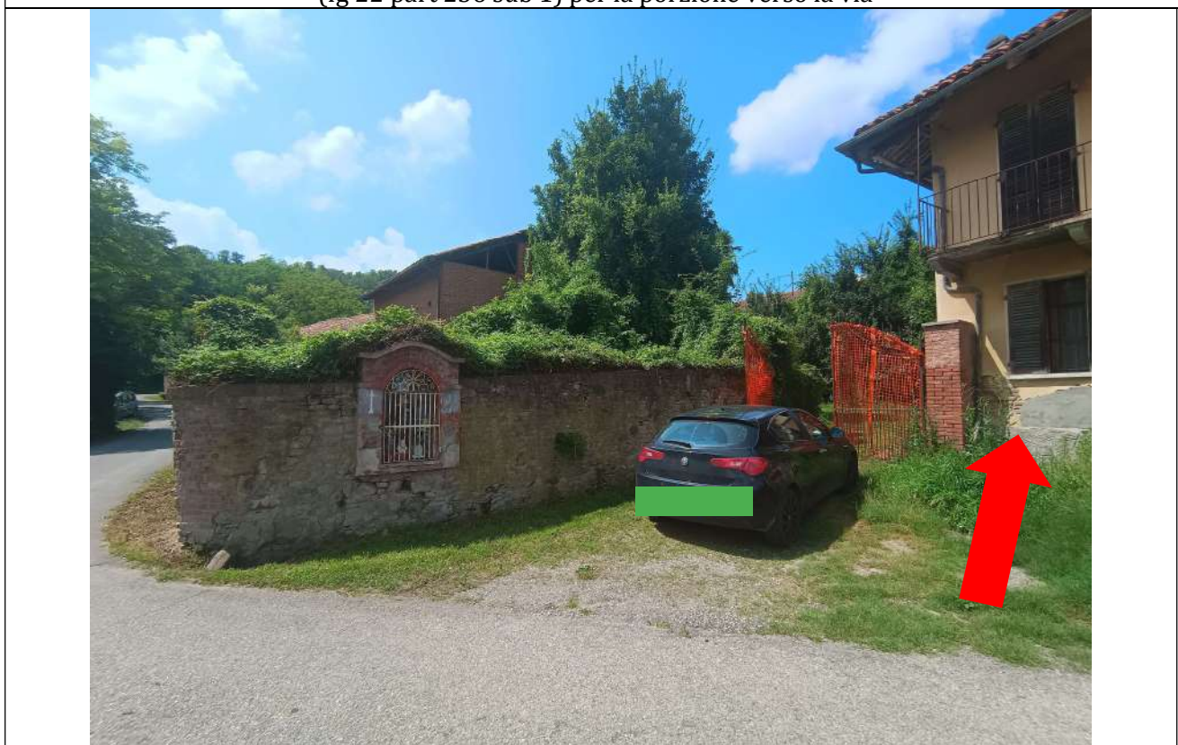
Foto 2. Vista verso la proprietà in esecuzione a dx, in primo piano il BCNC (fg 22 part 236 sub 1) per la porzione verso la via ed il cancello di ingresso, sulla sinistra il muro perimetrale dello stesso BCNC (fg 22 part 236 sub 1) verso la via