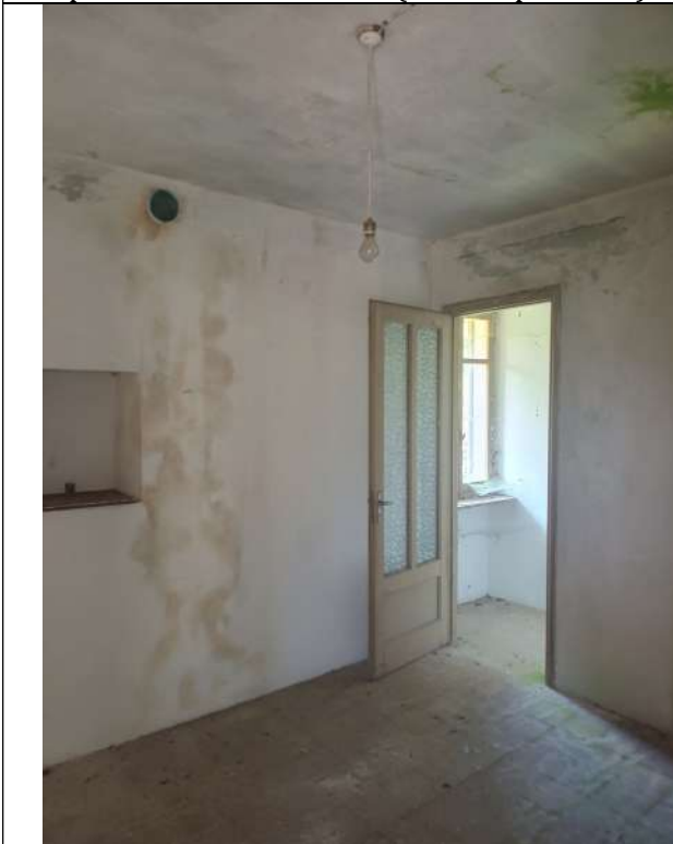
Foto 18 _vista verso accesso locale catastalmente definito wc, dalla seconda camera (in realtà locale wc è un ripostiglio senza attacchi e scarichi)