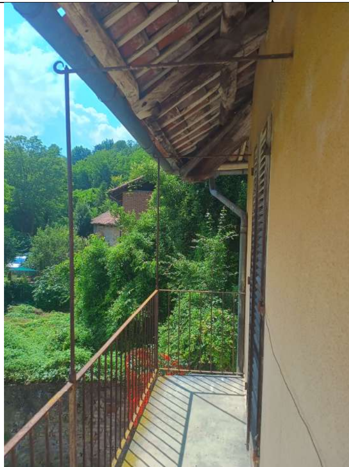
Foto 23. Vista del Balcone verso BCNC su 1 (non delimitato verso altre proprietà)