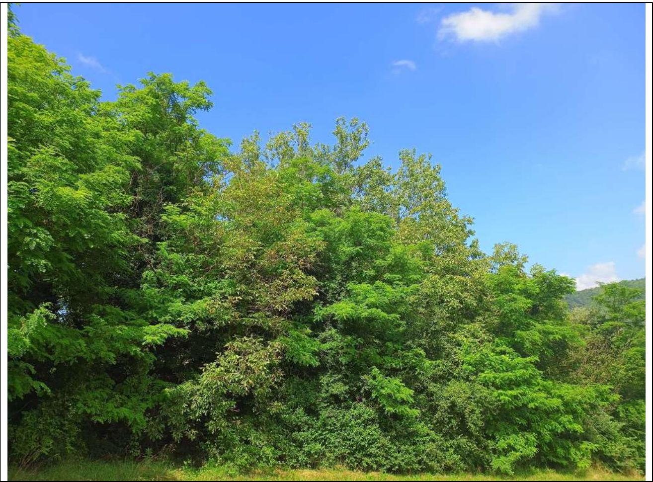
Foto 11. Vista del terreno mappale 143 da sud