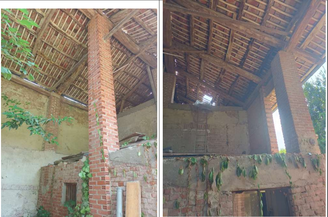
Foto 28 Vista tettoia sub 3 livello primo (non accessibile) – sullo sfondo il solaio sopra il piano primo dell'unità sub 2. Al piano primo verso Ovest la muratura perimetrale non indicata in planimetria catastale