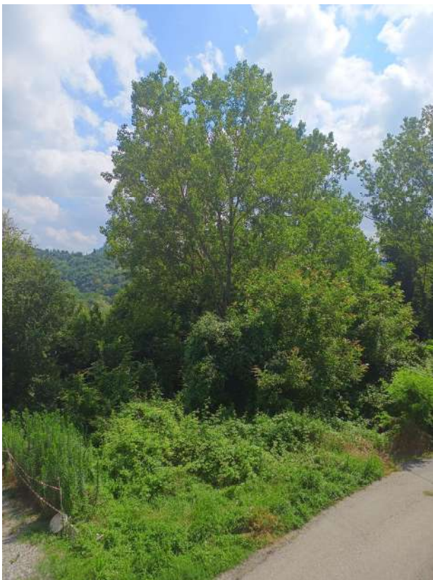
Foto 9. Vista dal balcone della costruzione verso il terreno in esecuzione part 143 (con in primo piano la via stradale che attraversa la proprietà)