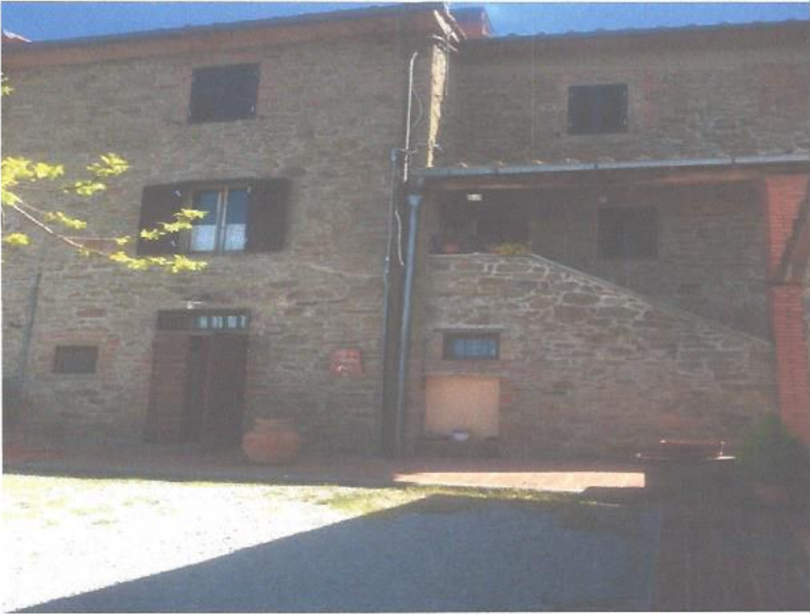
FOTO n. 1 - Ingresso di accesso al piano terra