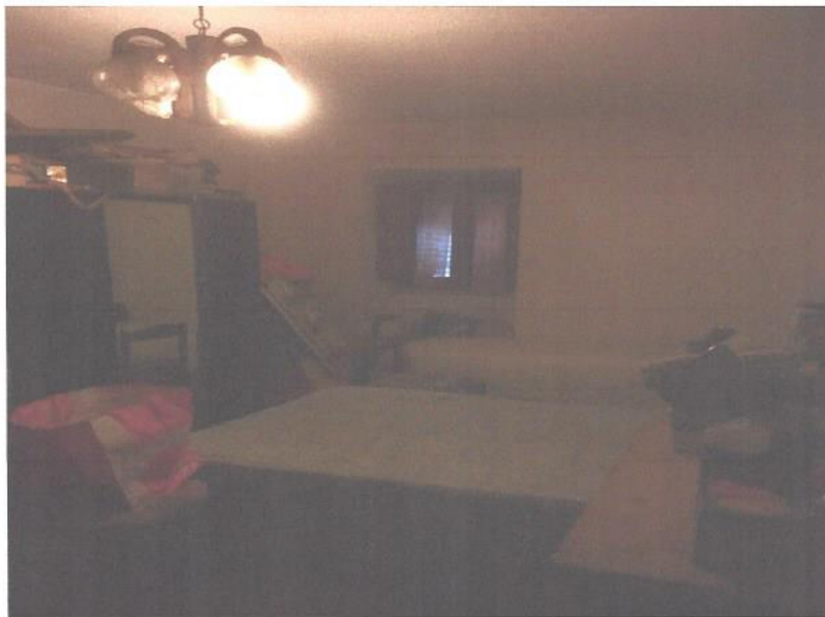
FOTO n. 6 - Camera da letto del piano primo