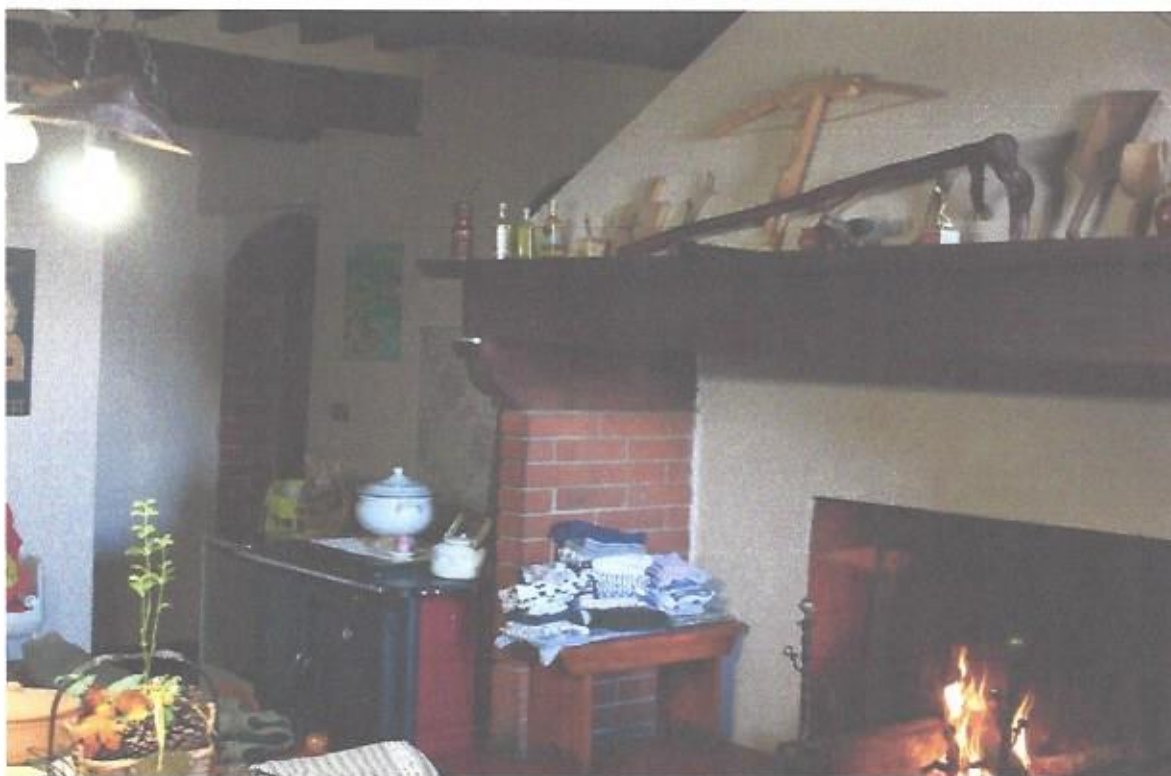
FOTO n. 5 - Particolare cucina al piano primo