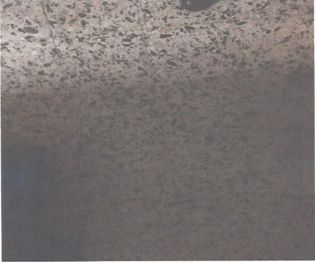
FOTO n. 8 - Pavimento in campigiane di cotto al piano terra