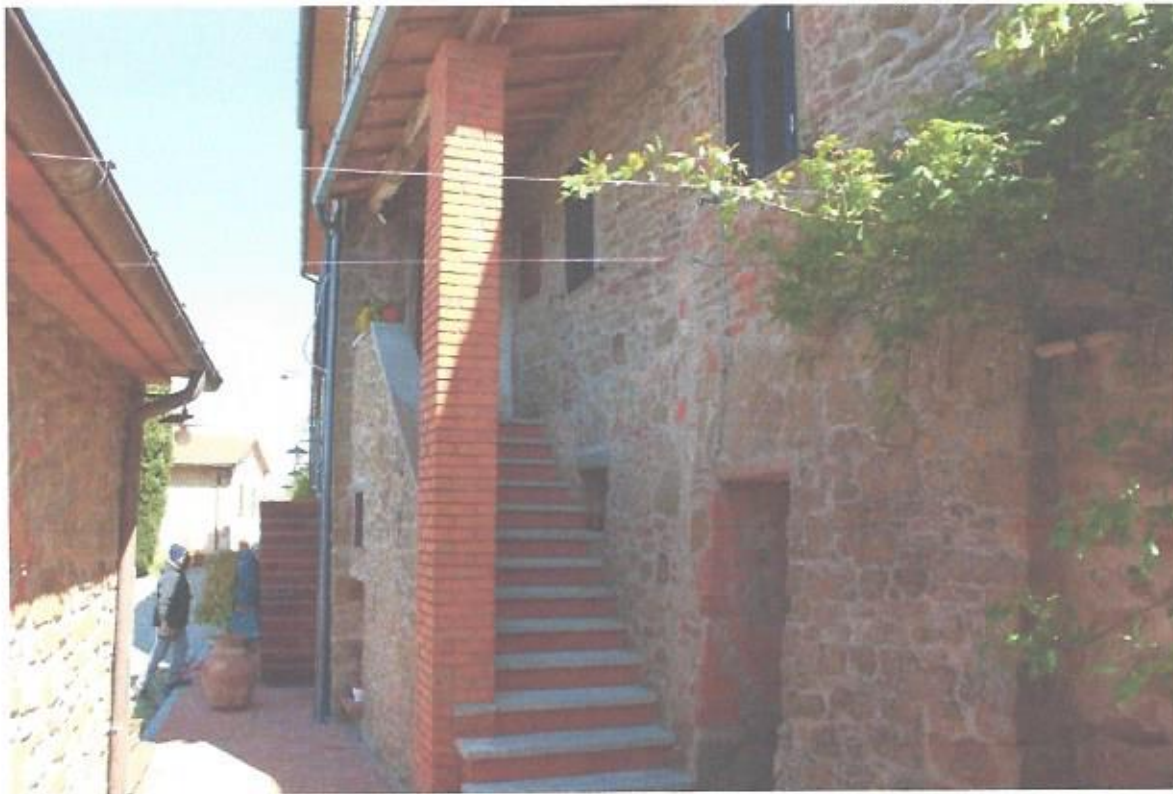
FOTO n. 2 - Scala di accesso al piano primo