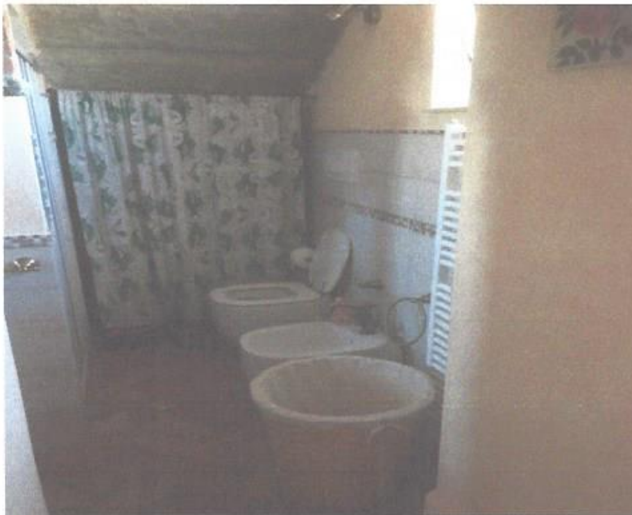
FOTO n. 4 - Particolare bagno del piano terra