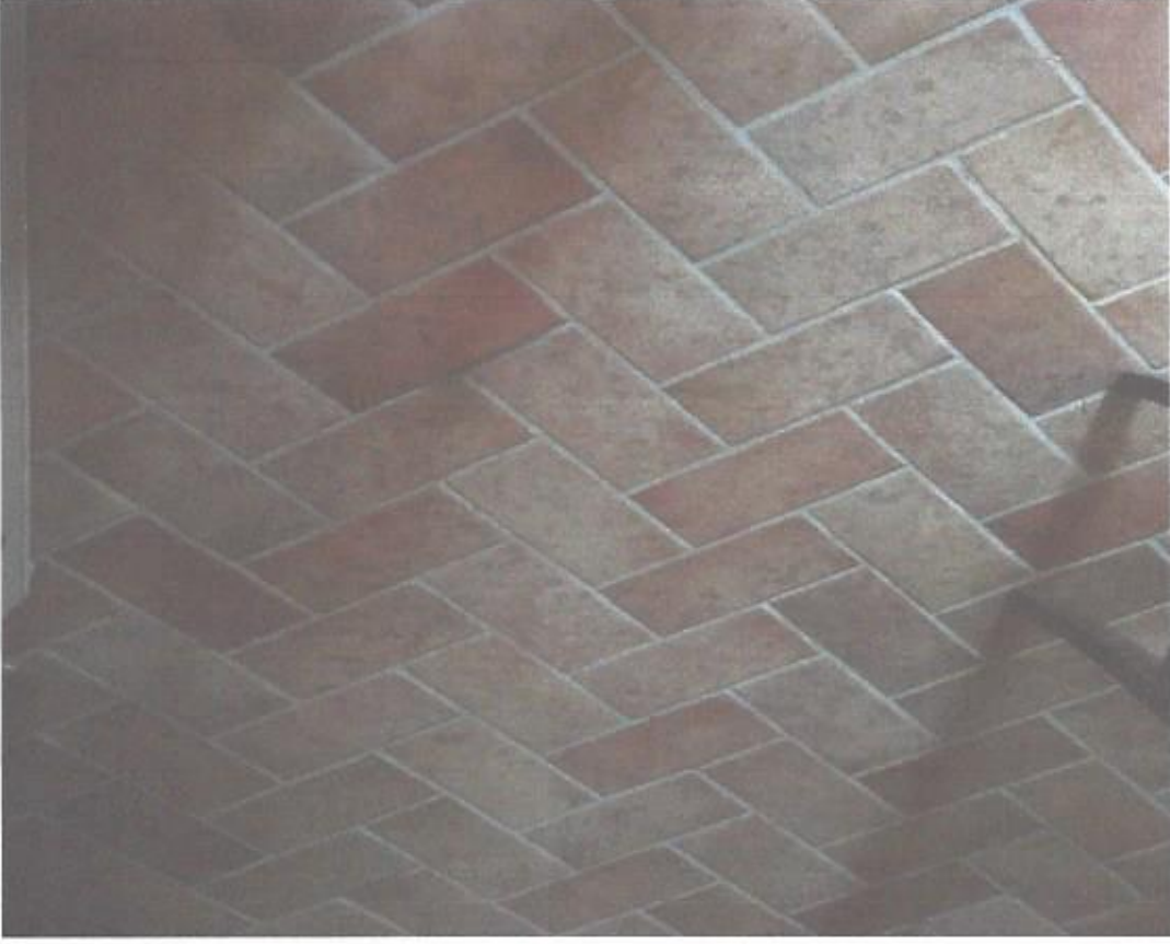
FOTO n. 7 - Pavimento in mattonelle di graniglia al piano primo