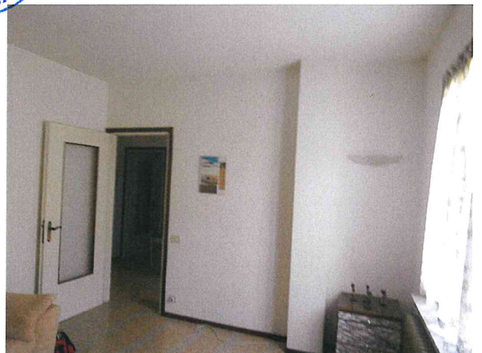
Foto 24 - Alloggio int. - camera S