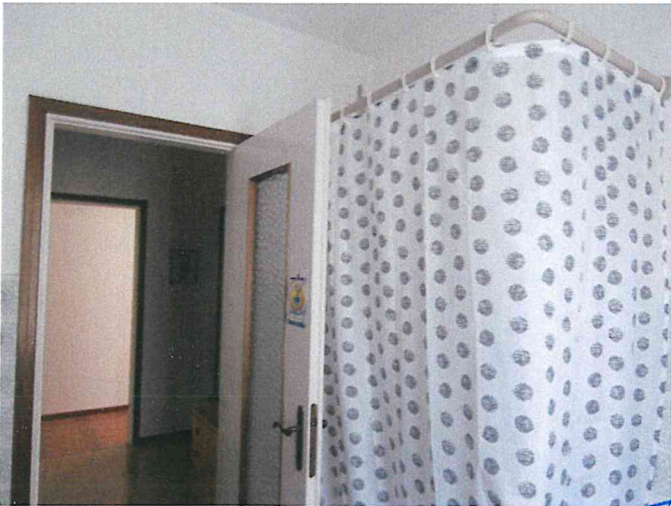
Foto 21 - Alloggio int - bagno