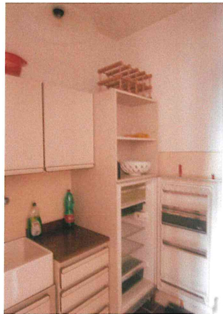
Foto 16 - Alloggio int. - cucinino