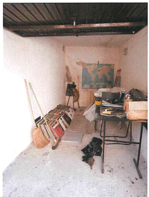
Foto 30 - Box- interno