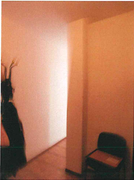
Foto 09 - Alloggio int. - ingresso