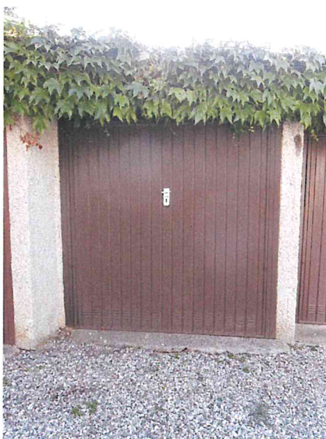
Foto 29 - Box -prospetto su corsello comune