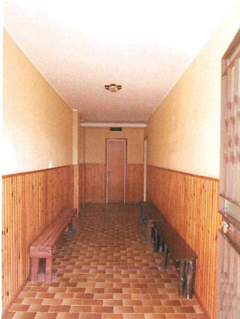
Foto 25 - accesso cantine