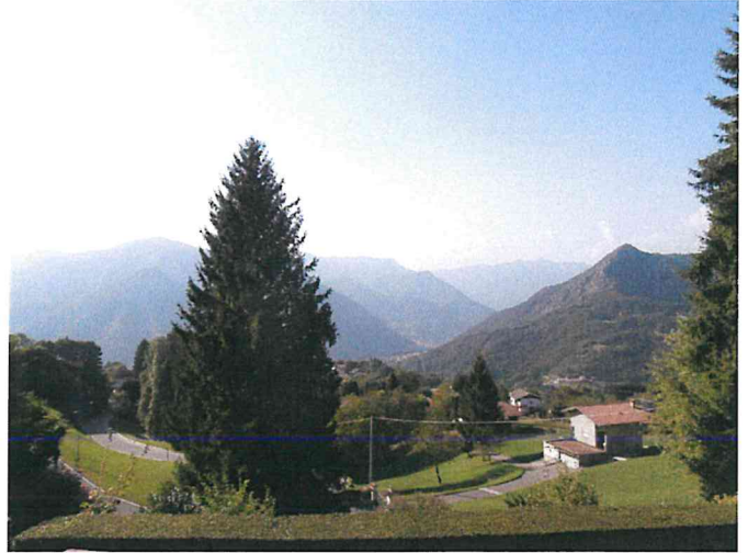
Foto 14 - Alloggio - vista da balcone soggiorno