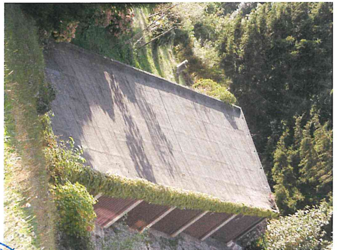
Foto 28 - Box - Copertura