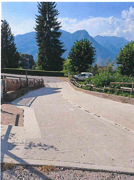
Foto 03 - Rampa accesso condominio