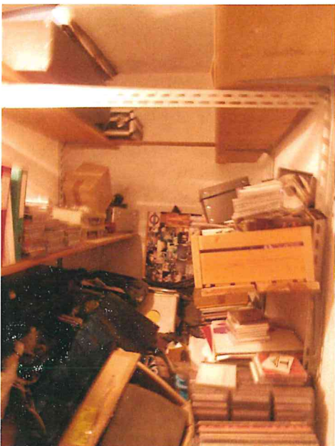
Foto 27 - Cantina - interno