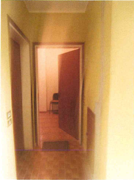
Foto 07 - Alloggio - ingresso