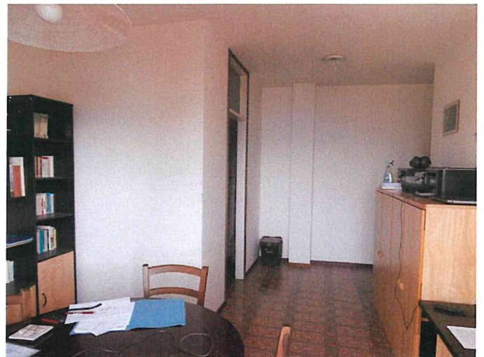
Foto 12 - Alloggio int. - soggiorno