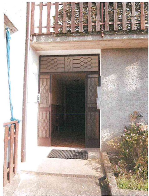
Foto 04 - Ingresso condominiale