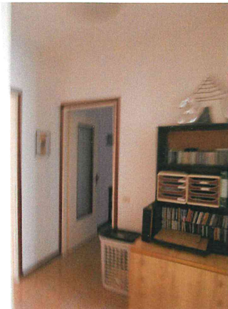
Foto 17 - Alloggio int. - disimpegno