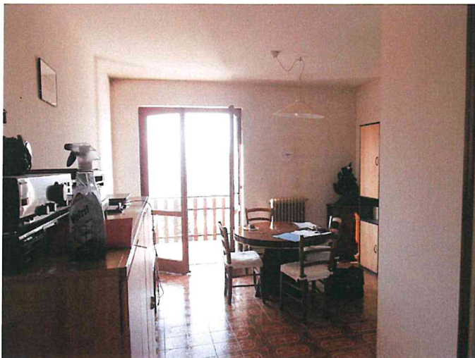
Foto 11 - Alloggio int. - soggiorno