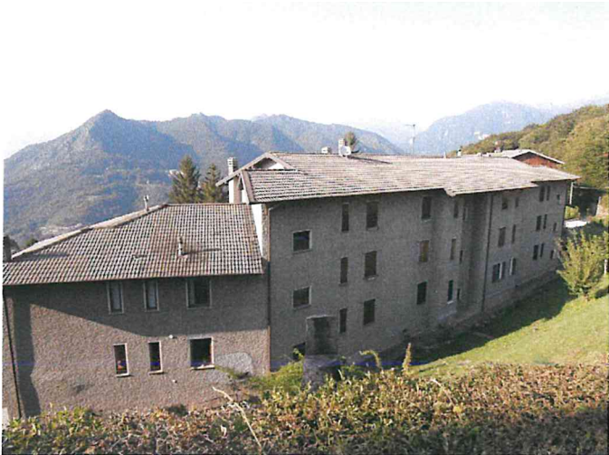
Foto 01 - Vista d'insieme fabbricato