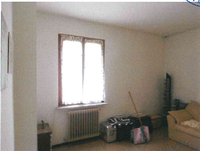
Foto 23 - Alloggio int. - camera S