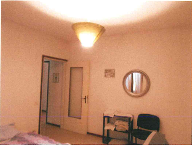
Foto 19 - Alloggio int. - camera S-E