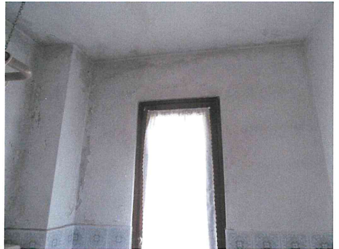
Foto 22 - Alloggio int. - bagno presenza efflorescenze