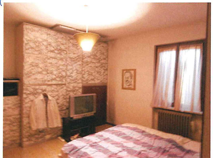
Foto 18 - Alloggio int. - Camera S-E