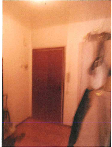
Foto 08 - Alloggio int. - ingresso