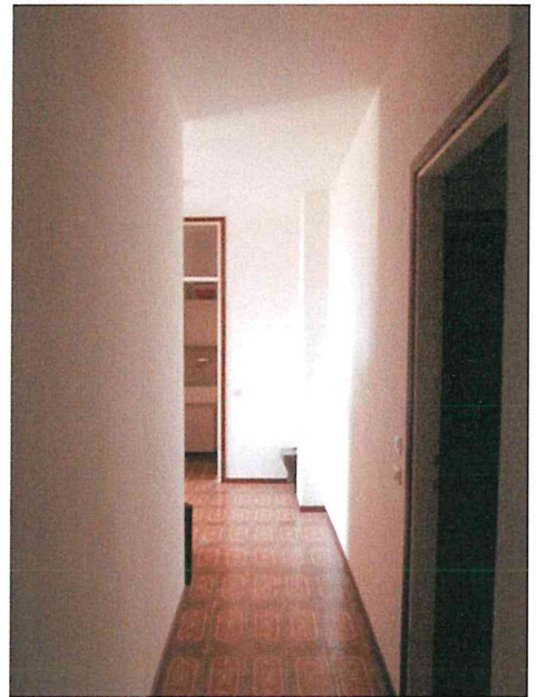
Foto 10 - Alloggio int. - corridoio