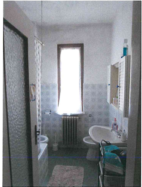
Foto 20 - Alloggio int. - bagno