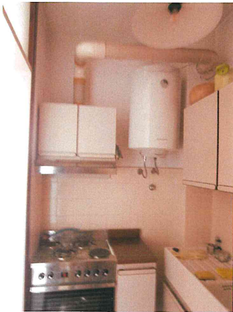
Foto 15 - Alloggio int. - cucinino