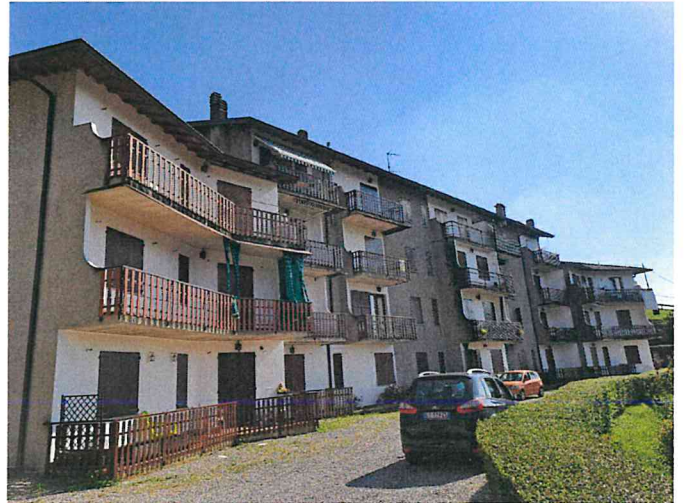
Foto 02 - Vista d'insieme fabbricato - Prospetto Nord-Ovest