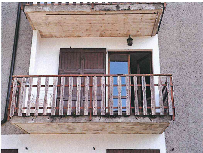
Foto 05 - Alloggio - Prospetto Nord-Ovest