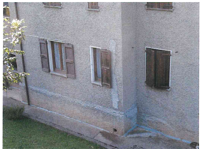
Foto 06 - Alloggio - Prospetto Sud-Est