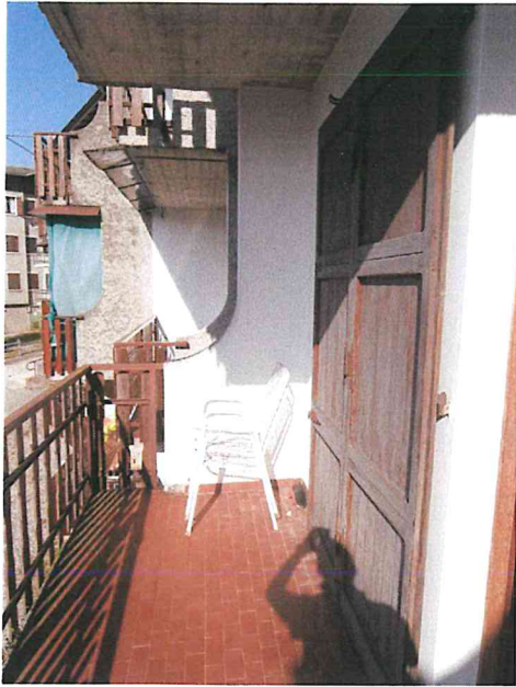
Foto 13 - Alloggio - balcone soggiorno