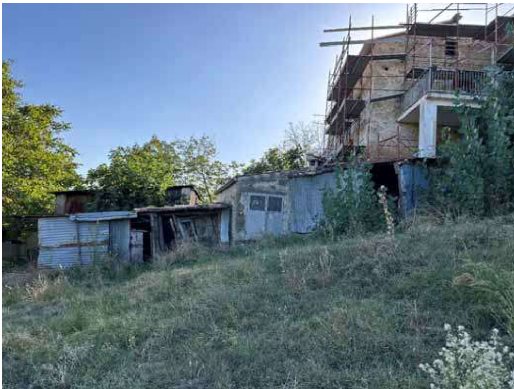
Foto 2: Baracche costruite sulla corte della unità immobiliare Fg. 4 P.IIa 433 sub 1 e terreno limitrofo.