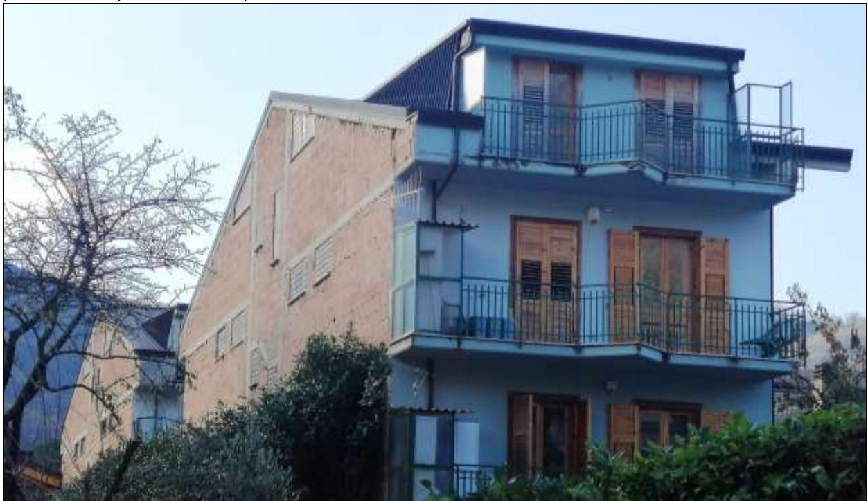
Foto del complesso condominiale formato da due palazzine disposte una dietro l'altra (le pareti posteriori delle palazzine sono prive di intonaco).

L'accesso ai singoli appartamenti avviene da ingresso condominiale con scala interna.