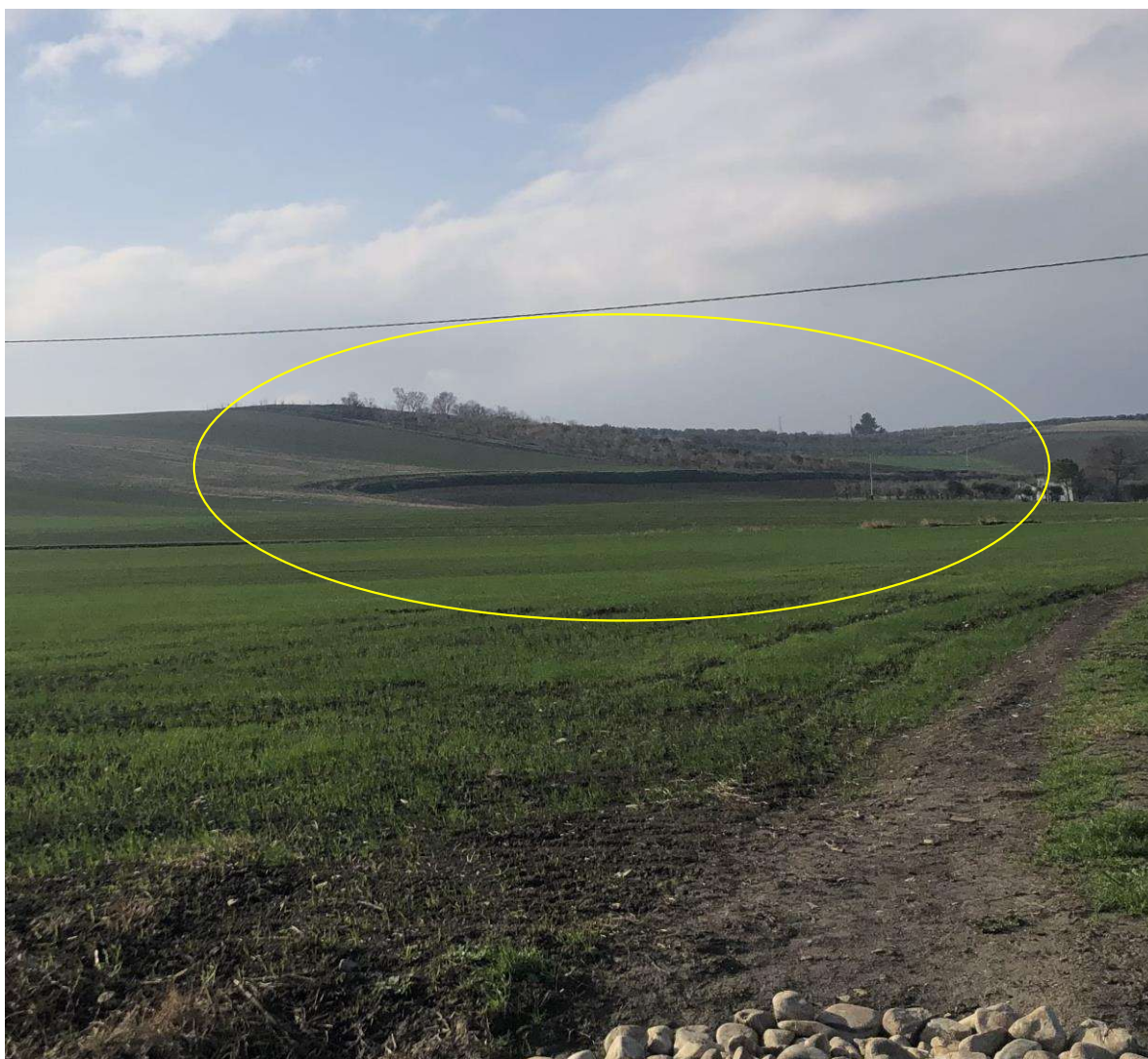
Vista del lotto dalla strada Vicinale che si diparte dalla SS 17.

c.f. FRZNN81R57A471W - Partita I.V.A. 04284360288