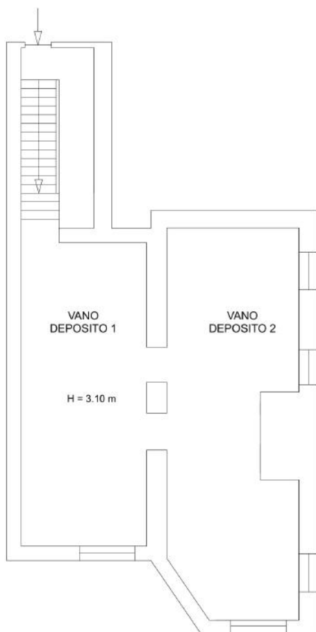
PLANIMETRIA LOCALE DEPOSITO

Costituisce pertinenza esclusiva dell'appartamento l'annessa corte esterna pavimentata posto al piano terra e il locale deposito posto, in buona parte, sulla medesima verticale al piano seminterrato, il cui accesso di guadagna dal vano scala per mezzo di una rampa di scale comune. Esso è costituito da due locali comunicanti tra loro e allo stato rustico, la cui altezza utile, misurata dal livello del piano di calpestio all'intradosso del solaio, è pari a circa 3,10 m.