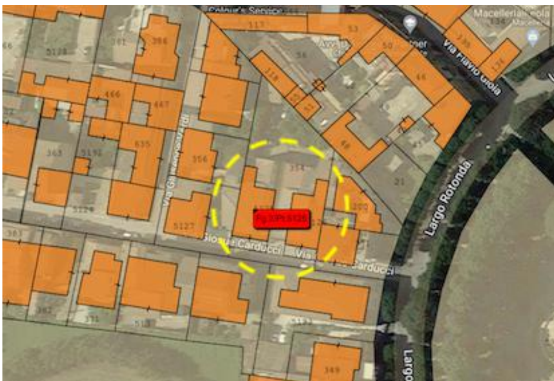
Foto n. 1 - SOVRAPPOSIZIONE VAX - ORTOFOTO

Pertanto, l'immobile posto in vendita, costituente lotto unico , è la piena ed intera proprietà di appartamento con locale deposito pertinenziale siti in San Nicola la Strada, in Via G. Carducci, n.8; confinano, nell'insieme, con Via G. Carducci, con vano scala sub 8 e con spazi comuni p.lla 354; sono riportati in N.C.E.U. di San Nicola la Strada al foglio 2, p.lla 5125, sub 5 (locale deposito) e sub 6 (appartamento).