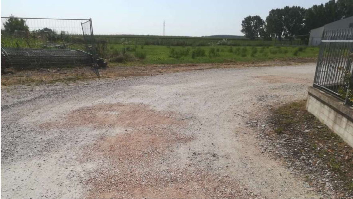
Punto di presa n° 3: vista part. 886 dalla part. 846