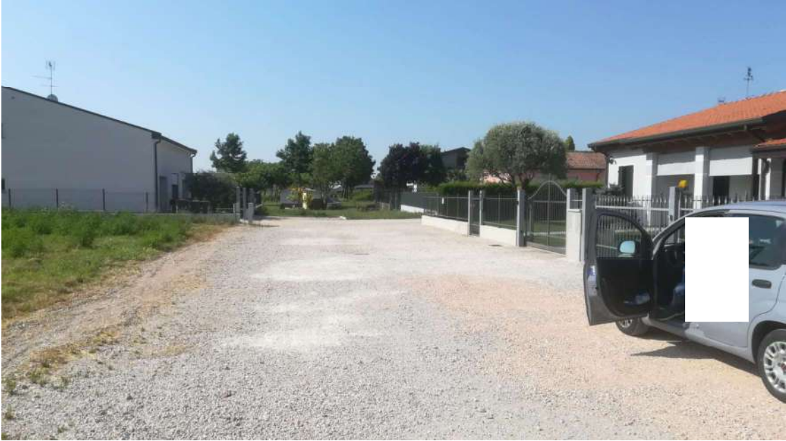
Punto di presa n° 9: vista part. 886