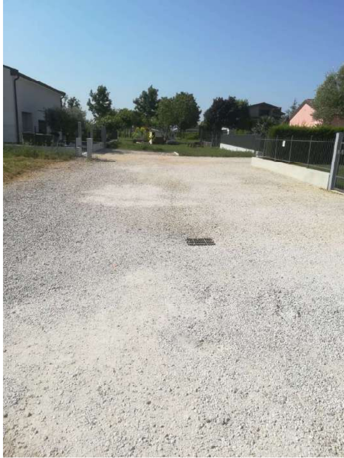
Punto di presa n° 7: vista part. 888