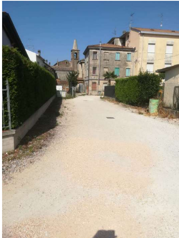
Punto di presa n° 2: vista part. 846 dalla part. 886