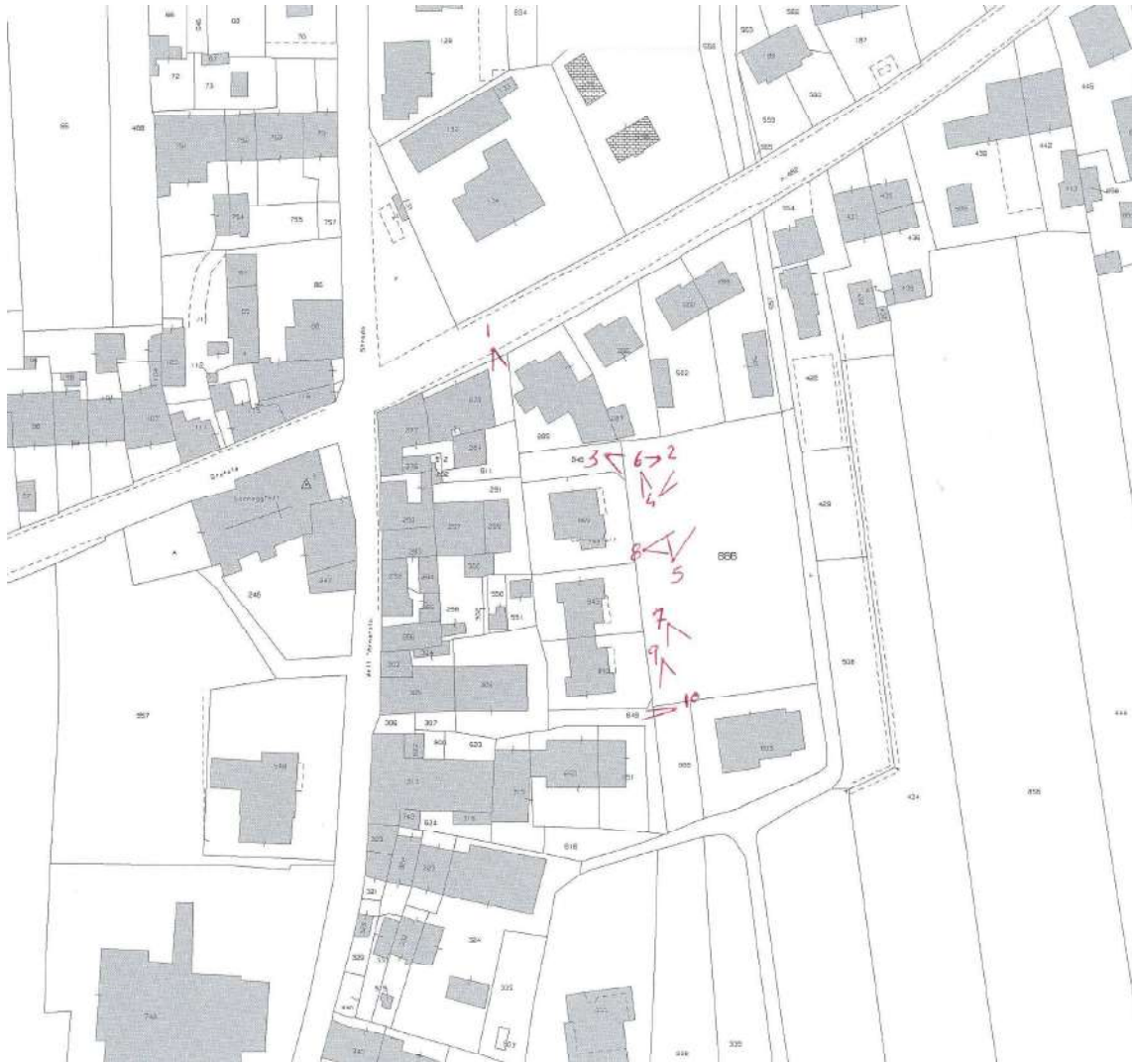
Punti di presa