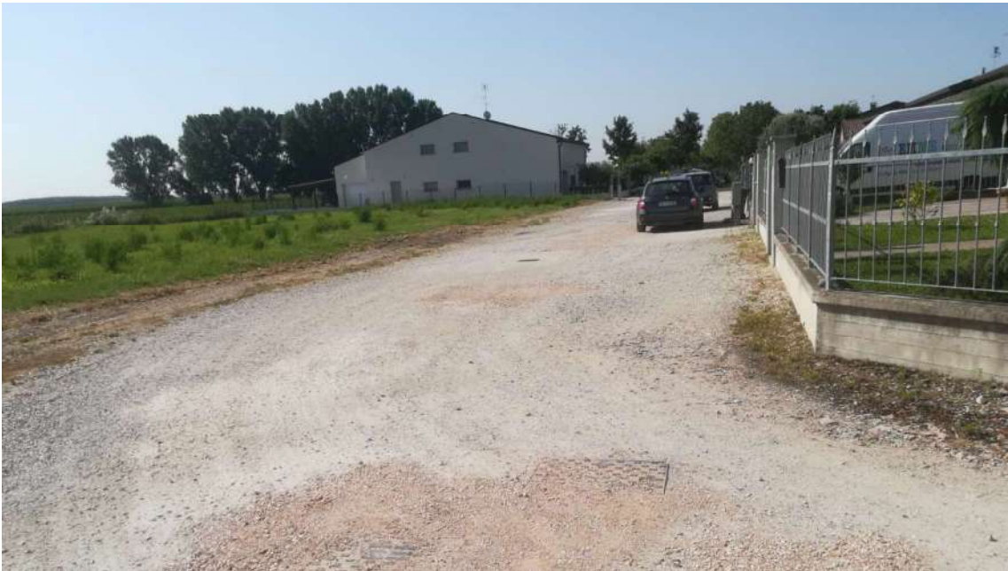
Punto di presa n° 6: vista part. 886