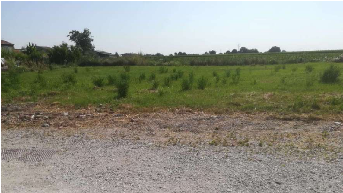
Punto di presa n° 8: vista part. 886