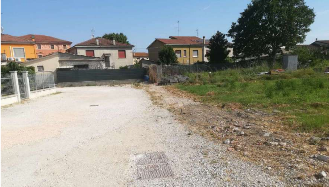
Punto di presa n° 5: vista part. 886