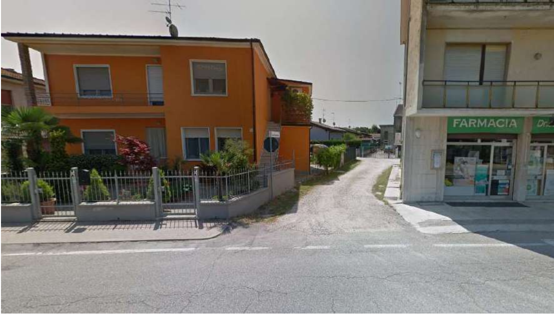
Punto di presa n° 1: strada di accesso da Via Rovigo (SP 482)