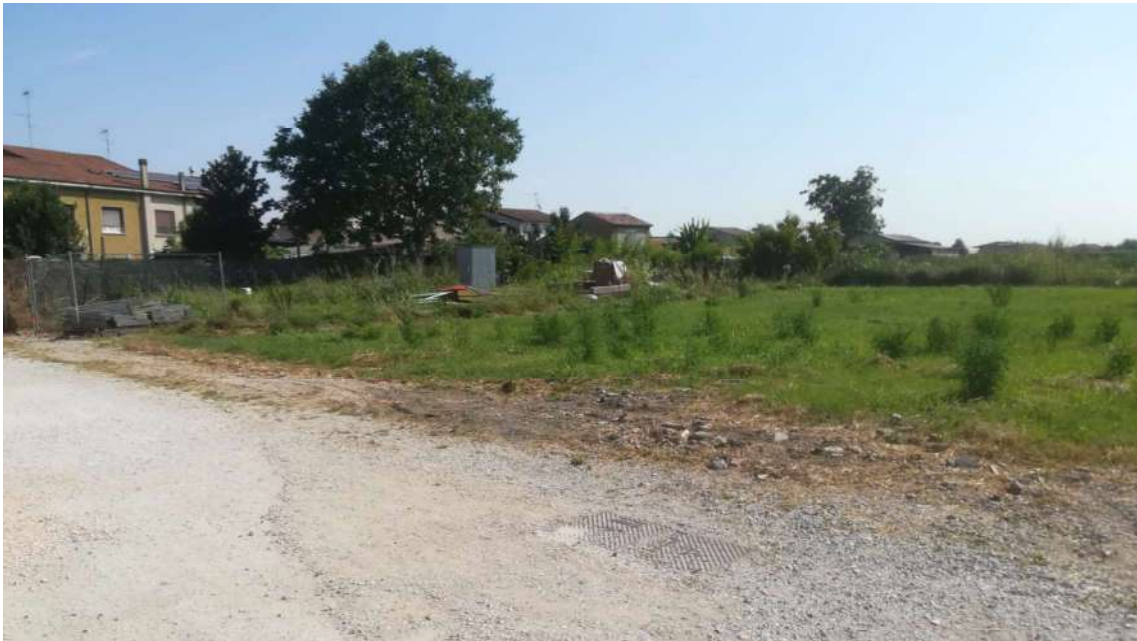
Punto di presa n° 4: vista part. 886