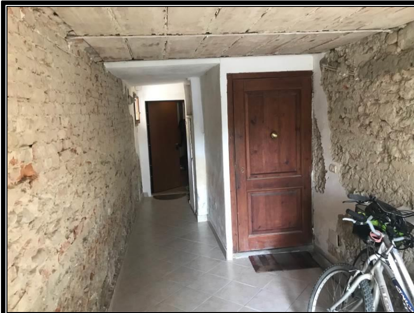
Foto 1-2-3: Prospetto principale, particolare ingresso a comune, vano scala a comune.