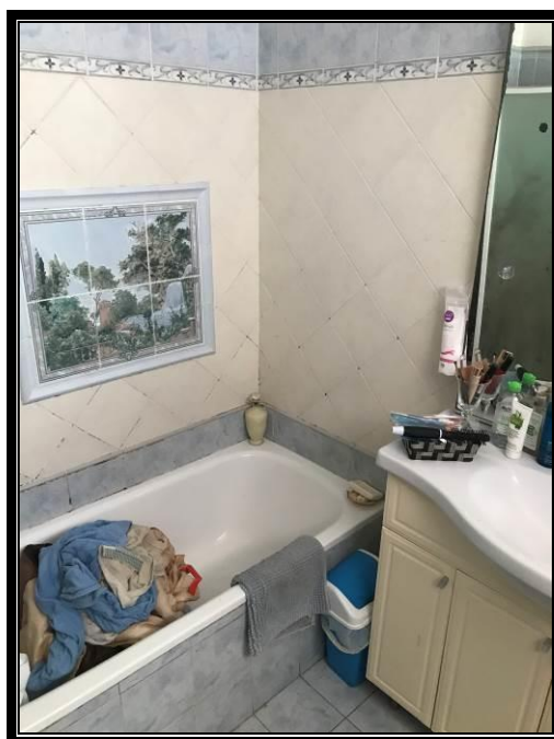
Foto 7-8-9: Camera matrimoniale, camera singola ad uso doppia, servizio igienico.

ESECUZIONE IMMOBILIARE: PROC. N. 315/2022 COMUNE DI BORGO SAN LORENZO, VIA MARCONI 29