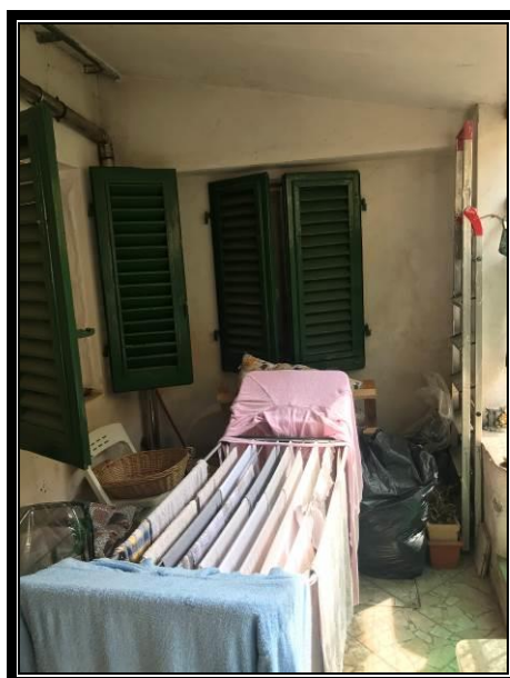
Foto 4-5-6: Ingresso appartamento, cucina-soggiorno, loggia esclusiva.