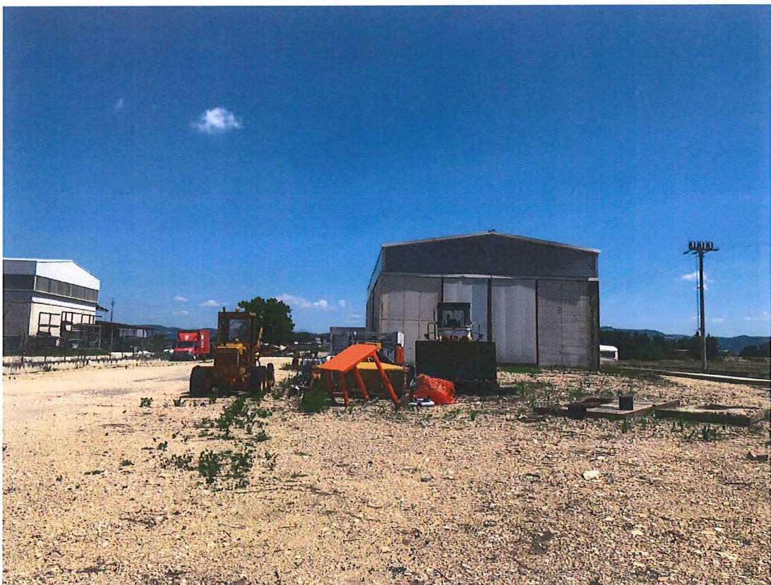
Foto n. 2 – Bettona. Facciata capannone lato ingresso (lato sud-ovest).