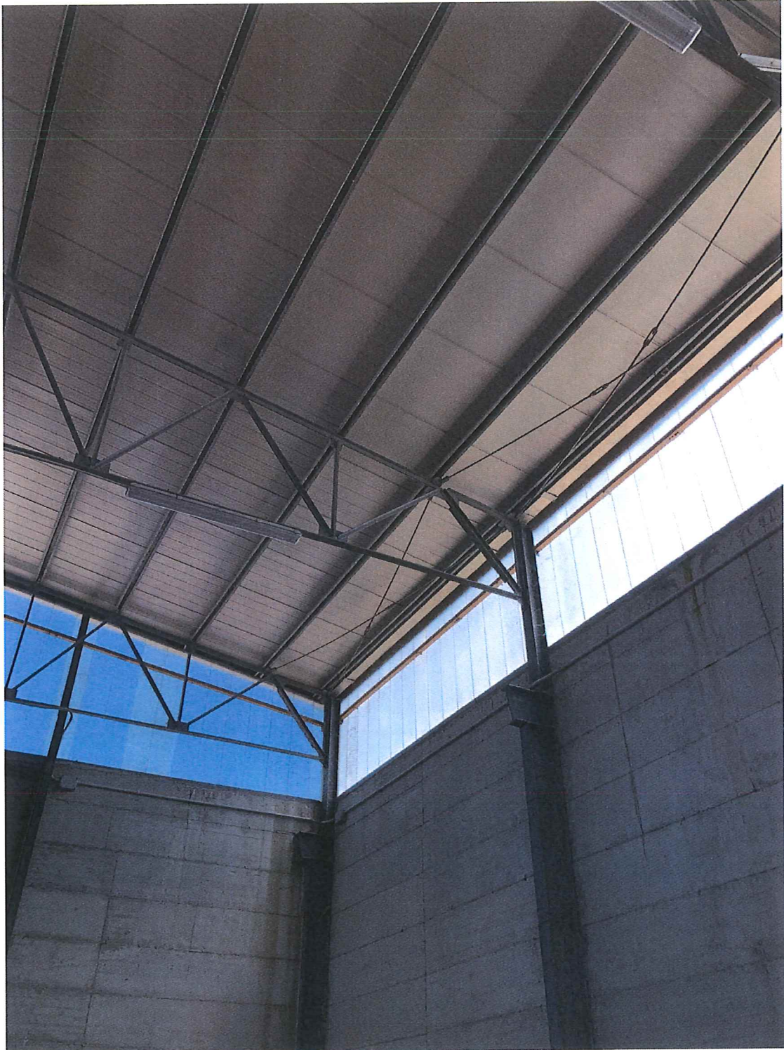
Foto n. 13 – Bettona. Interno capannone: particolari strutture e finestrate.