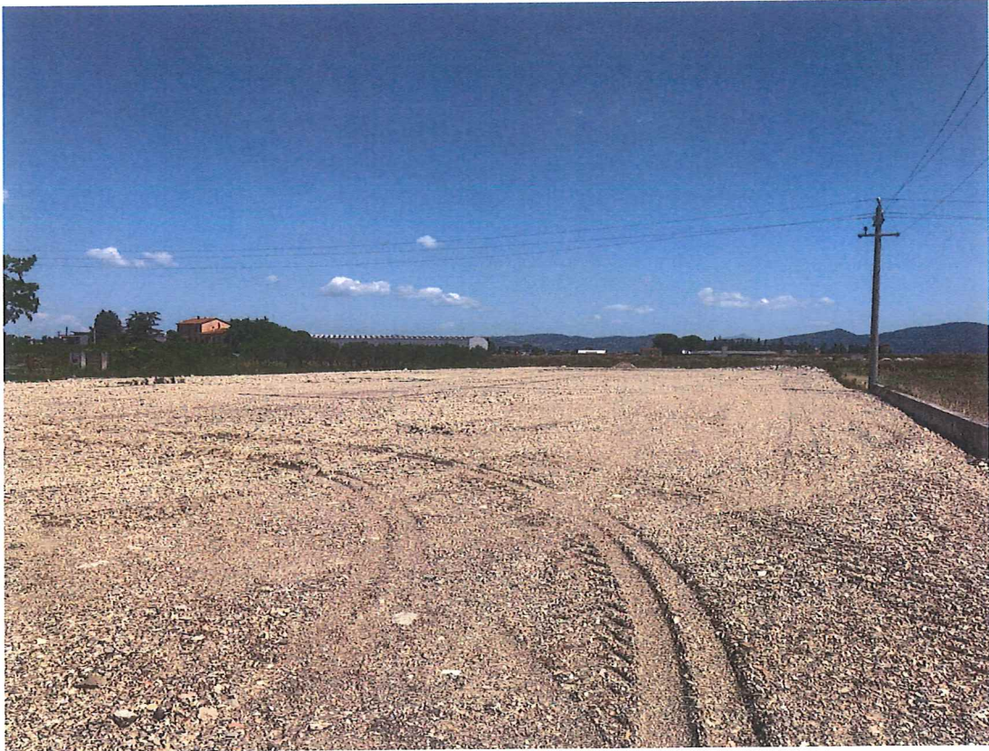
Foto n. 9 – Bettona. Vista dal capannone sulla particella n. 30 (ovvero in direzione nord-est).