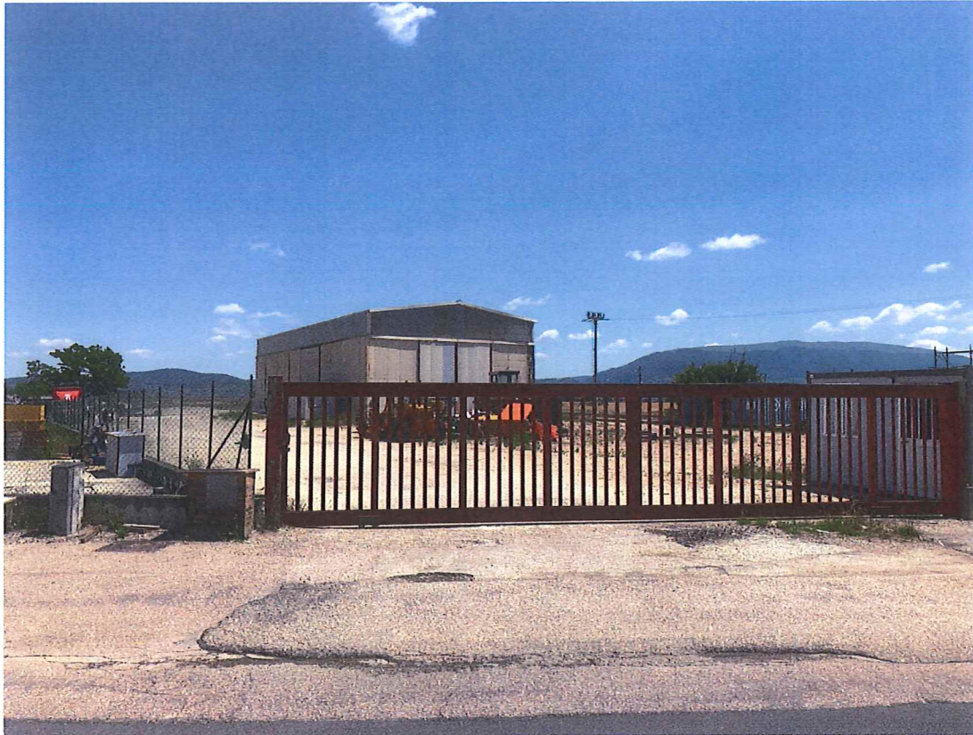
Foto n. 1 – Bettona. Accesso carrabile ai beni oggetto di esecuzione.