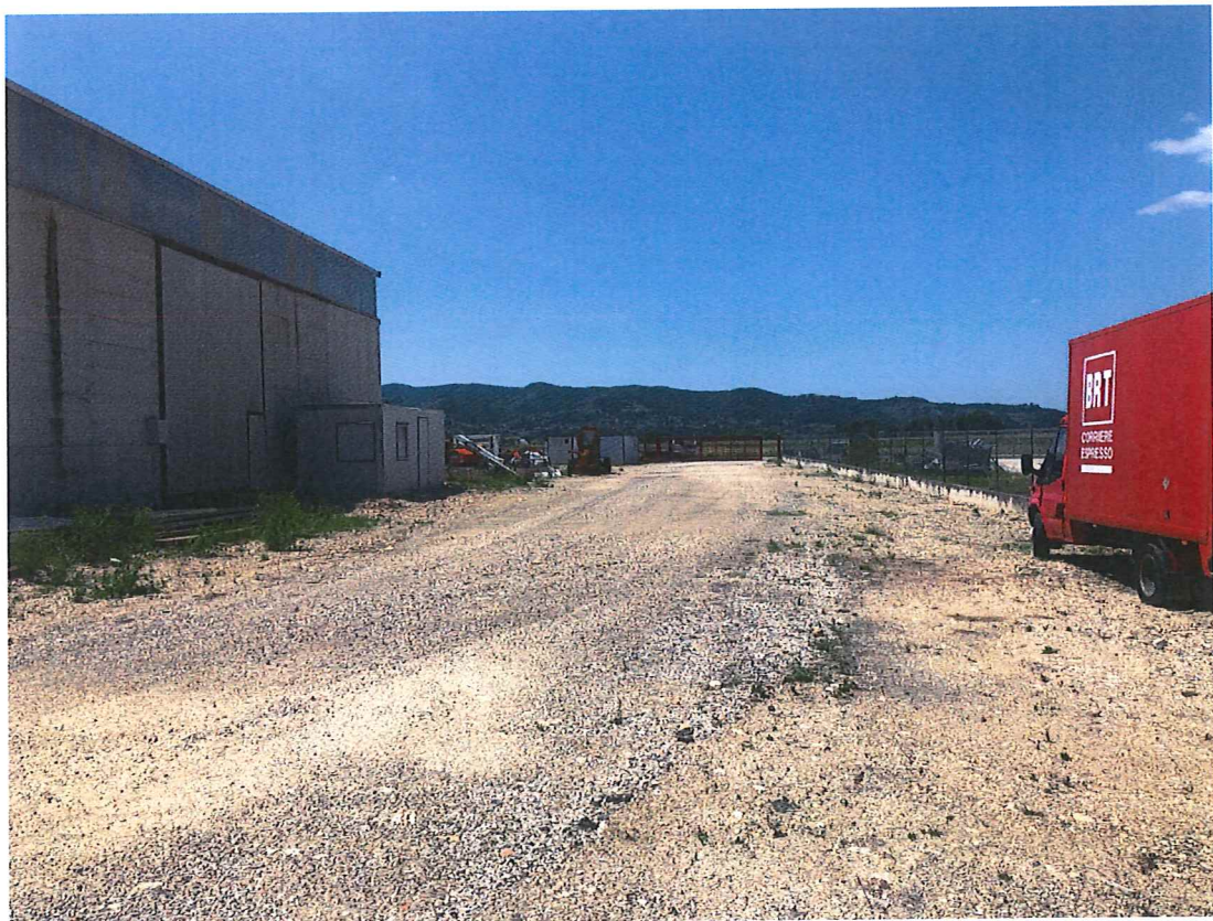
Foto n. 4 – Bettona. Piazzale esterno lato nord-ovest. Sullo sfondo l'ingresso carrabile.