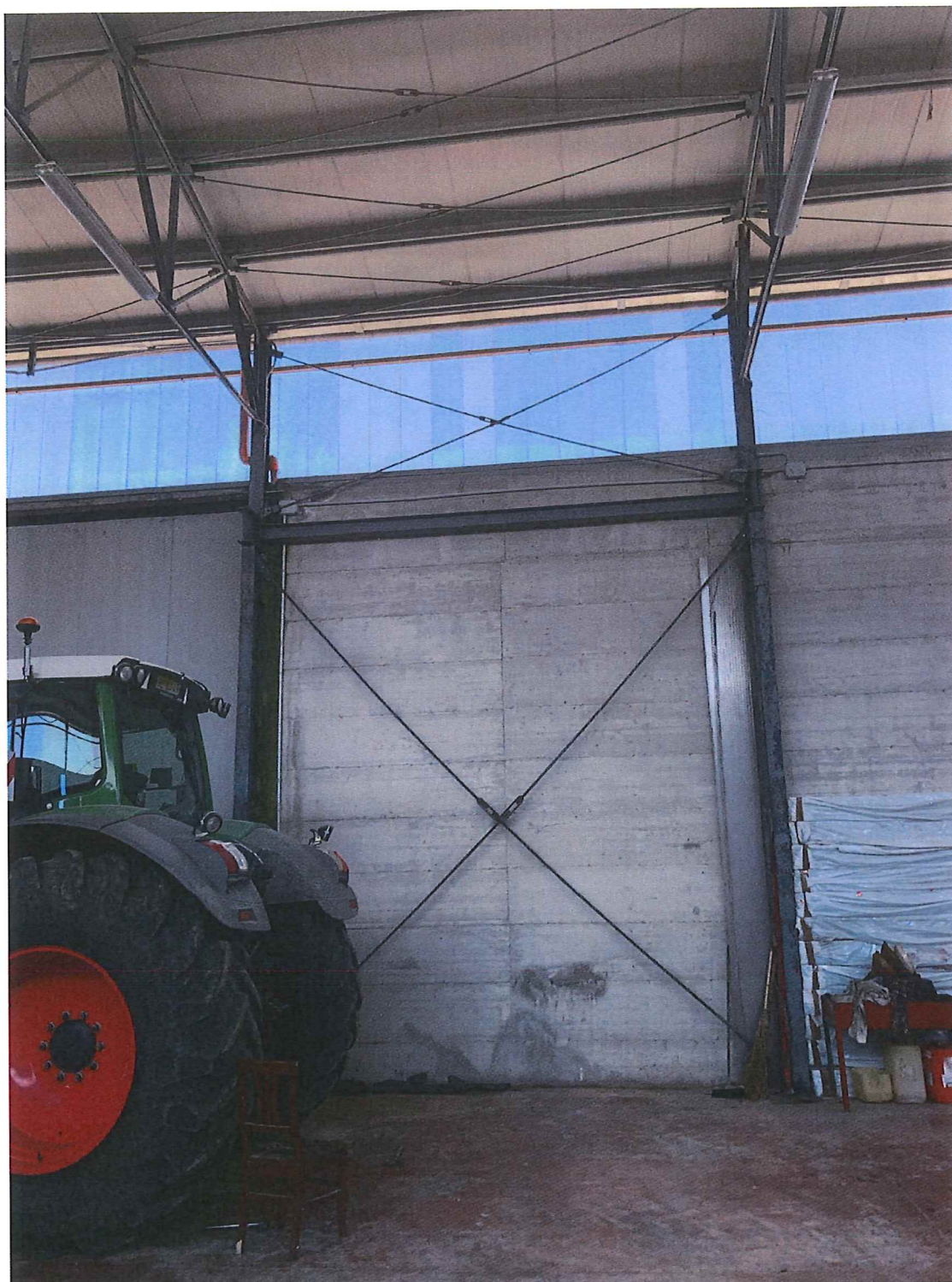
Foto n. 15 – Bettona. Interno capannone: particolare struttura in acciaio.