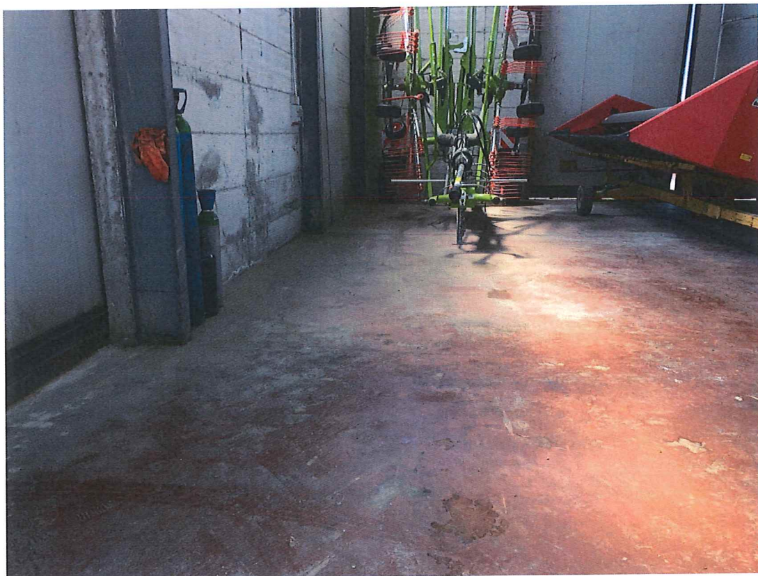
Foto n. 12 – Bettona. Interno capannone: particolare pavimentazione.