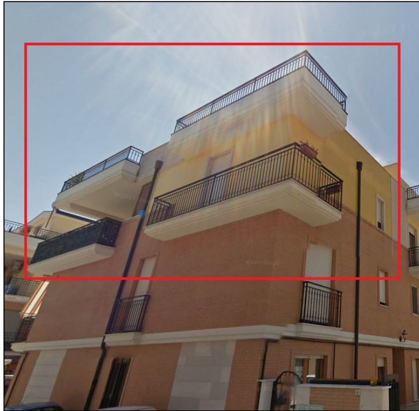
Foto 1: Vista prospetto esterno palazzina con accesso da Via Deliceto n. 1 D.