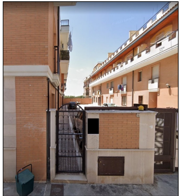
Foto 2a: Vista marciapiede (foglio 79 p.la 1510) da Via Deliceto n. 1 D.