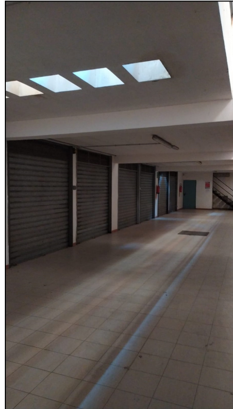
Foto 13 e 14: Vista esterna cancello ingresso al piano interrato autorimesse.