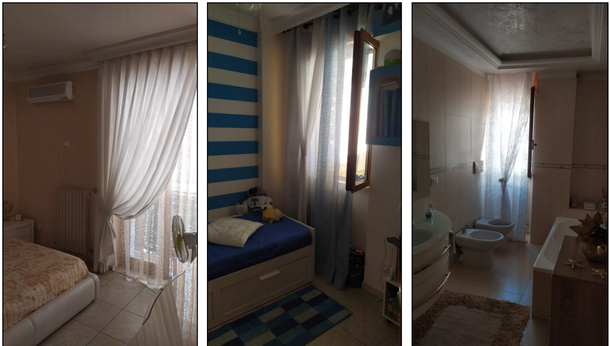
Foto 6, 7 e 8: Vista interna secondo piano: camera da letto, cameretta e bagno.