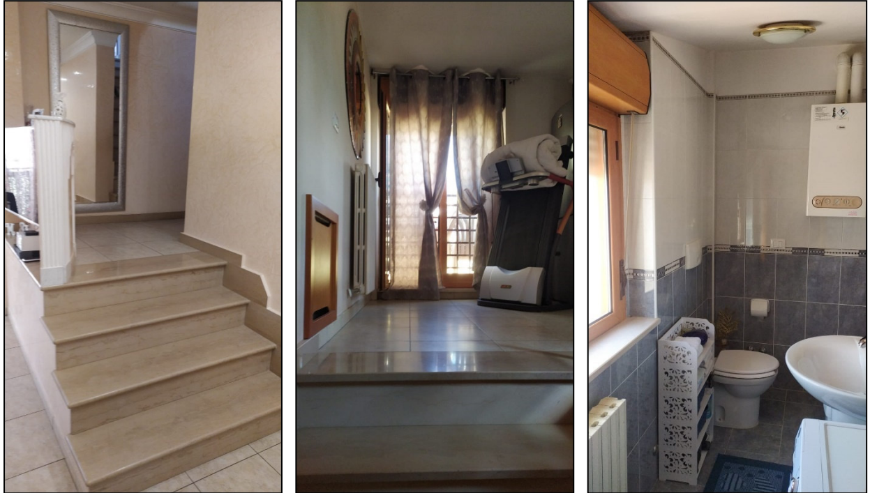
Foto 9, 10 e 11: Vista interna Appartamento: scala interna per il terzo piano, locale e bagno al terzo piano.