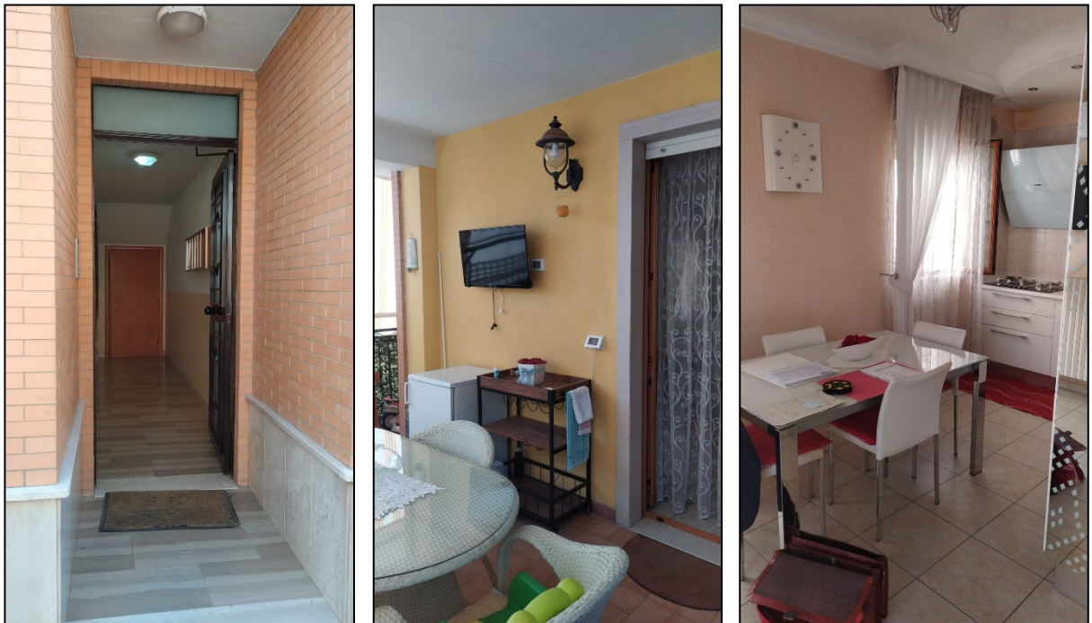
Foto 3, 4 e 5: Vista esterna portoncino ingresso palazzina e vista interna secondo piano: balcone zona giorno e zona giorno.