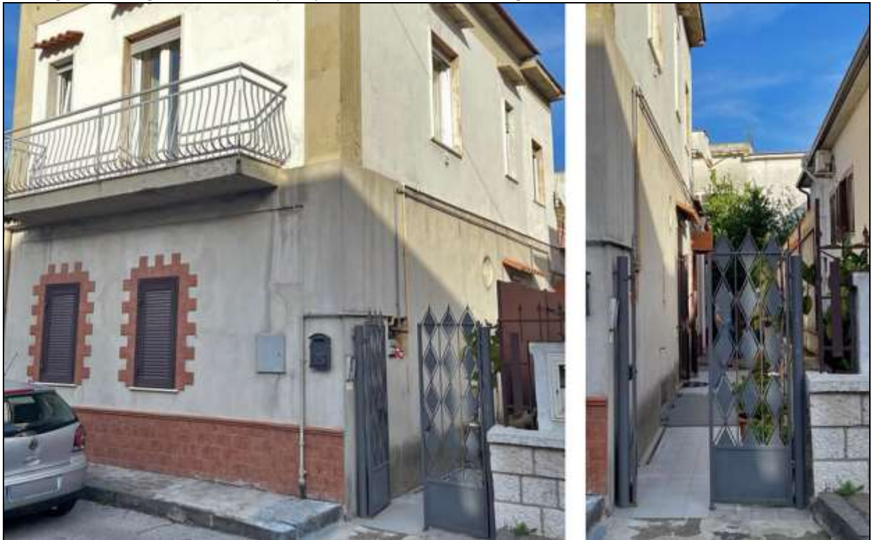
Foto degli esterni - ingresso dalla strada principale tramite cancello, con lunga e stretta corte laterale

l’appartamento con cantina ubicato al piano terra, oggetto di stima, fa parte di un piccolo complesso condominiale che include anche seconda unità abitativa situata al primo piano del fabbricato. La tipologia abitativa non è ben definita, trattasi del risultato di stratificazioni edilizie, formate da una piccola palazzina su due livelli (piano terra e primo piano) con stretto accesso formato da una stretta corte laterale che consente l’ingresso autonomo agli appartamenti ed alle cantine ubicate al piano interrato.