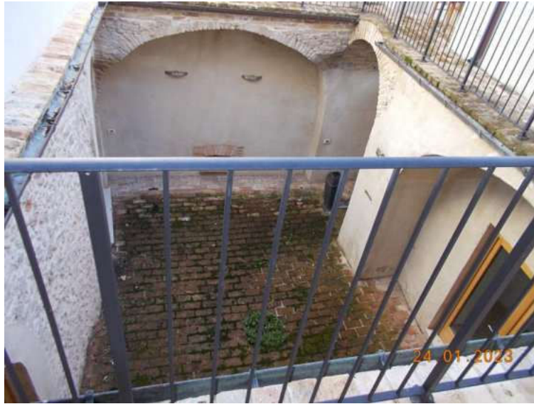
Foto 34 e 35 – Albergo al P.T. – Stanze ultimate - Fg 4 p.lla 297 sub 16