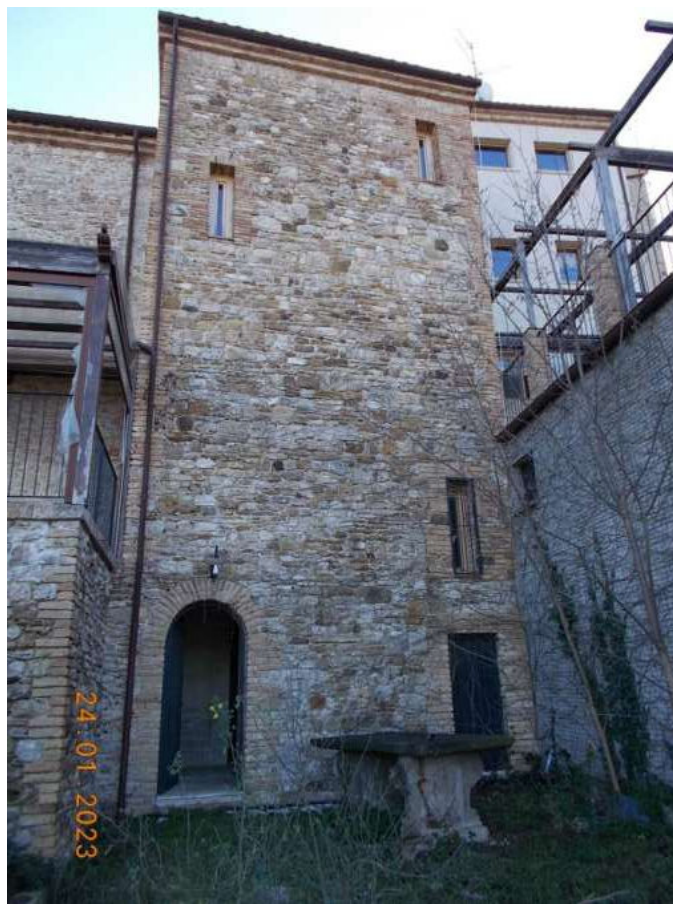
Foto 8 – Lato posteriore – Locali accessori e sovrastante giardino pensile