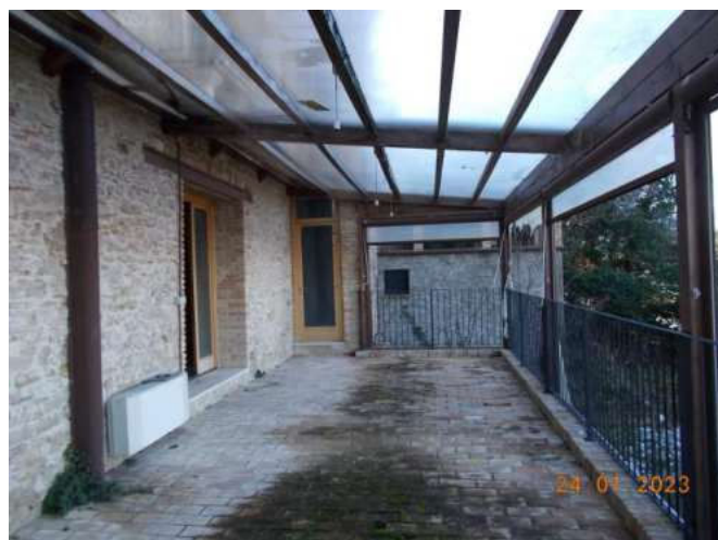
Foto 28 e 29 –Ristorante al P.T. - Cucina - Fg 4 p.Ila 297 sub 15