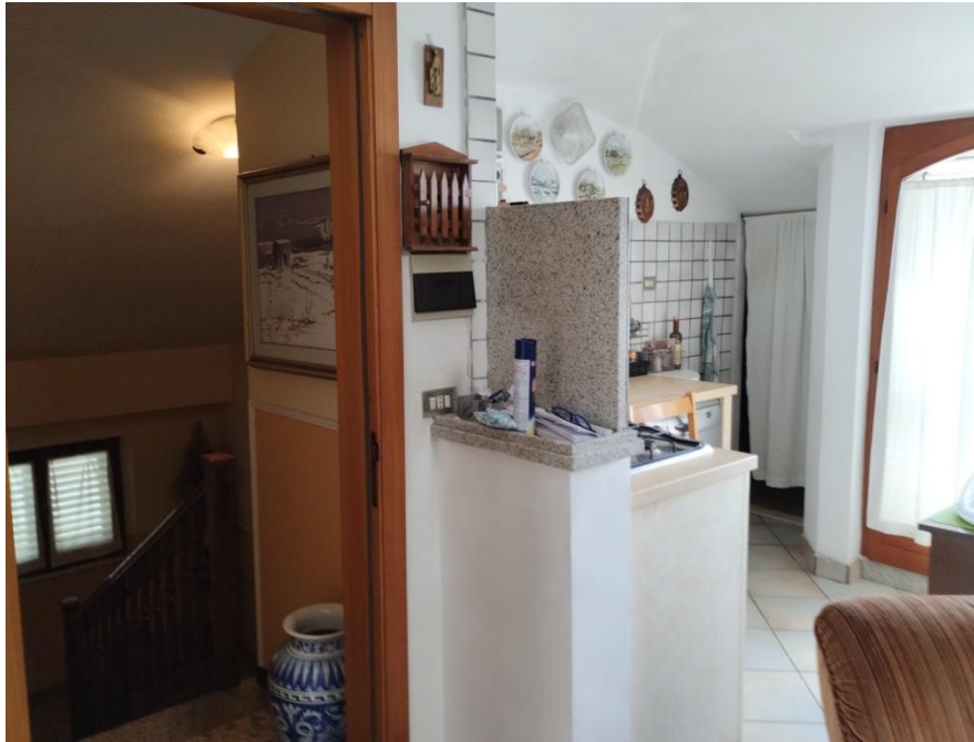
SUB. 3 : PIANO 2° Sottotetto – Soffitta ( ingresso )