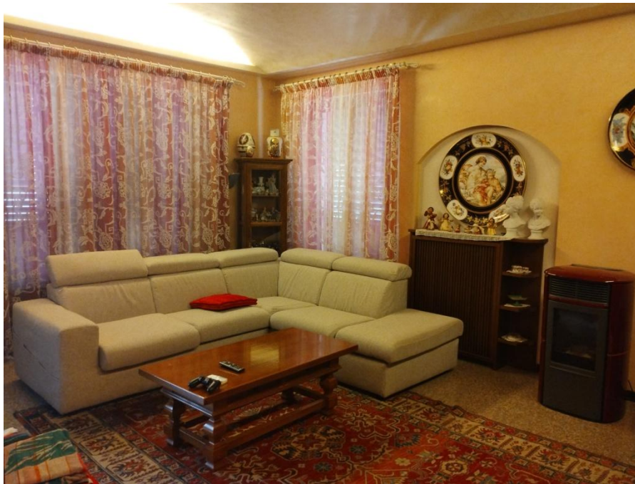
SUB 3 PIANO 1* : SALONE