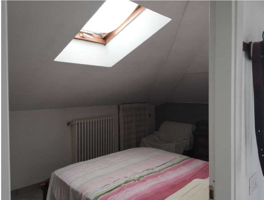
SUB. 3 : PIANO 2° Sottotetto – Soffitta ( locale adibito a camera)