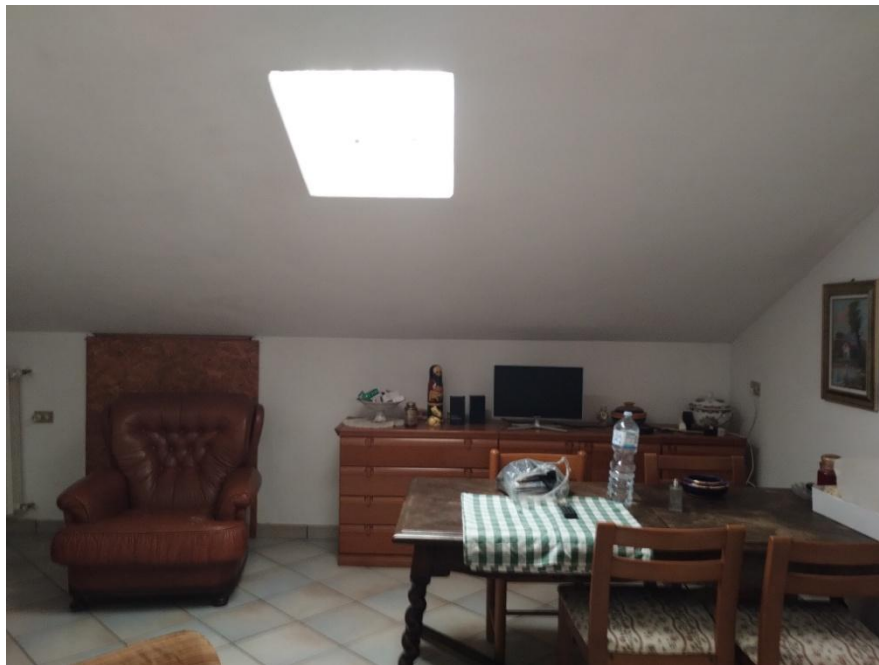
SUB. 3 : PIANO 2° Sottotetto – Soffitta