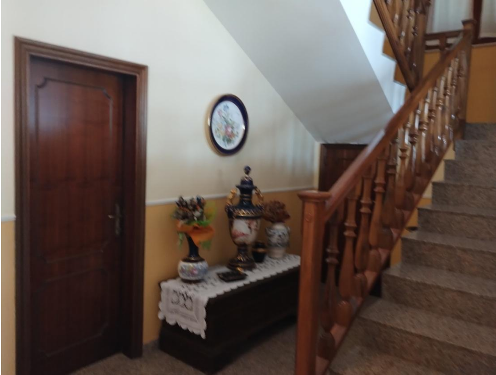
SUB. 3 : PIANO Terra : ingresso vano scale ( visibile sulla sx porta di accesso alla cantina)