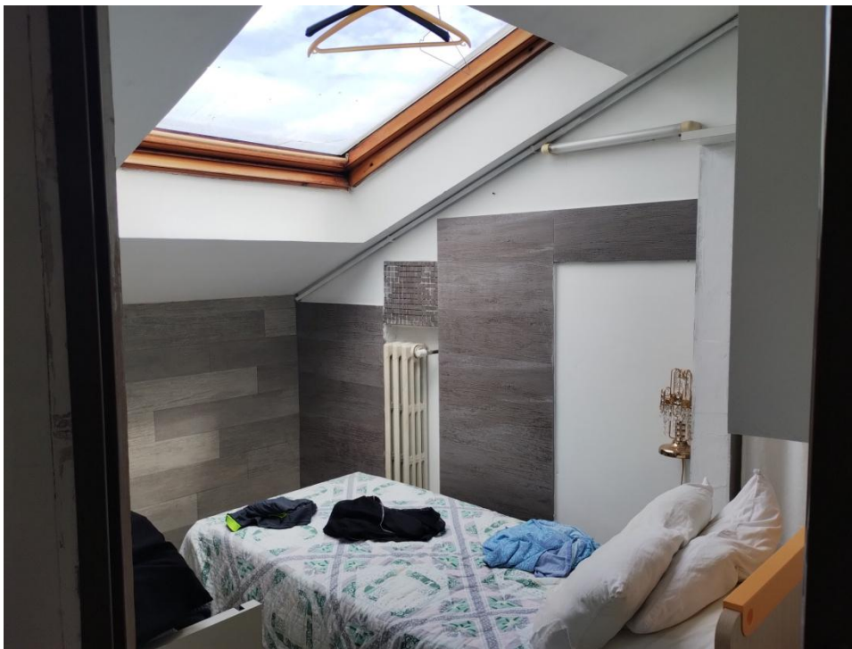
SUB. 3 : PIANO 2° Sottotetto – Soffitta ( locale adibito a camera)