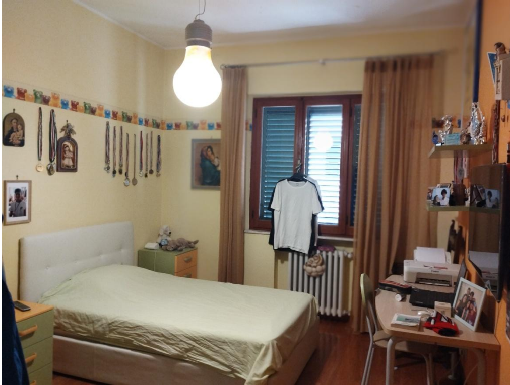
SUB.3 PIANO 1° : CAMERA DA LETTO