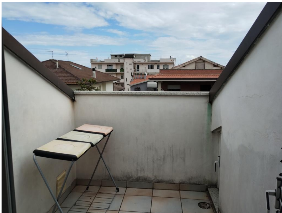
SUB. 3 : PIANO 2° Sottotetto – Soffitta ( terrazza a tasca est )