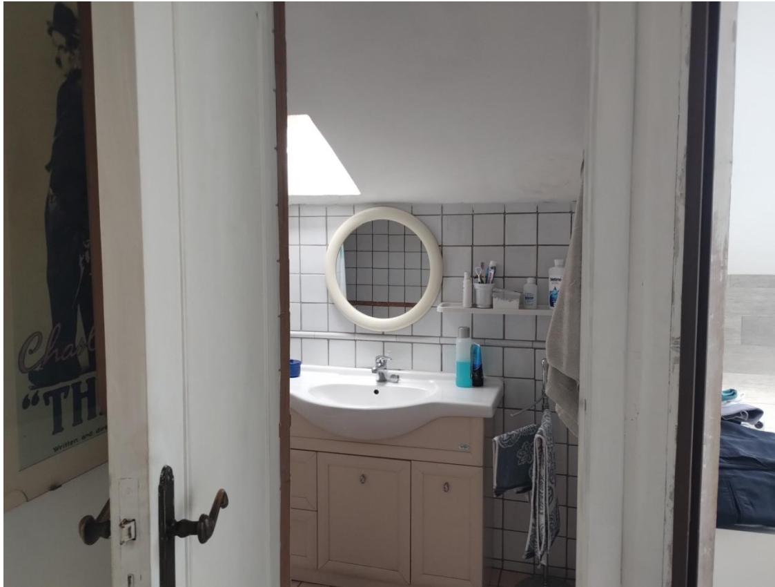
SUB. 3 : PIANO 2° Sottotetto – Soffitta ( locale adibito a bagno )