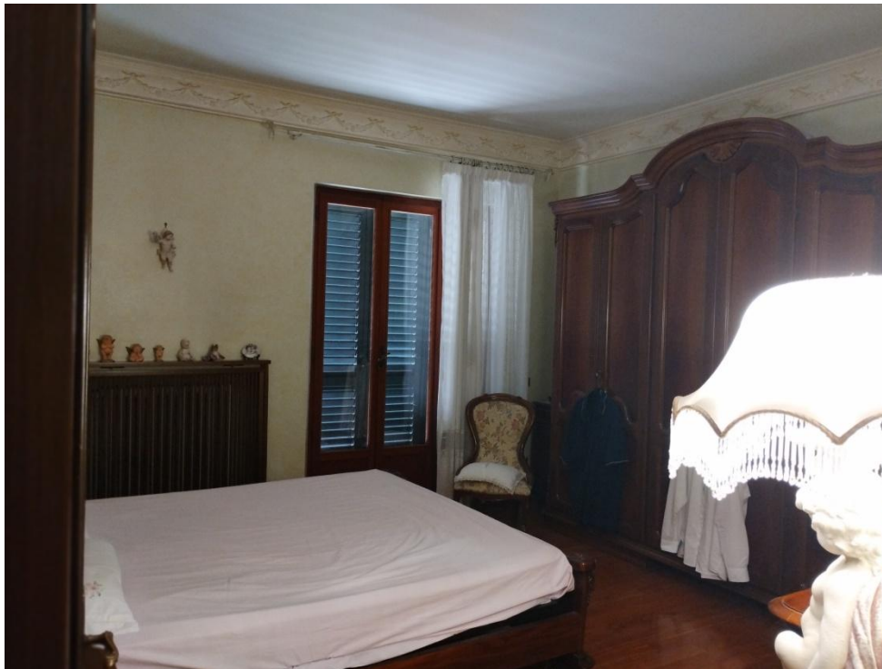
SUB. 3 : PIANO 1° : camera 3