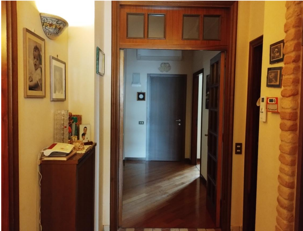
SUB. 3 : PIANO 1 ° : accesso /ingresso / disimpegno zona notte