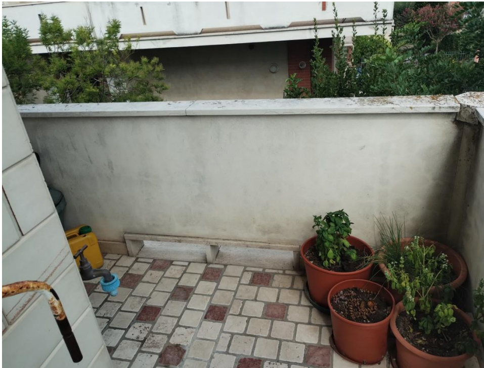
SUB. 3 : PIANO 1° ( ampliamento balcone )