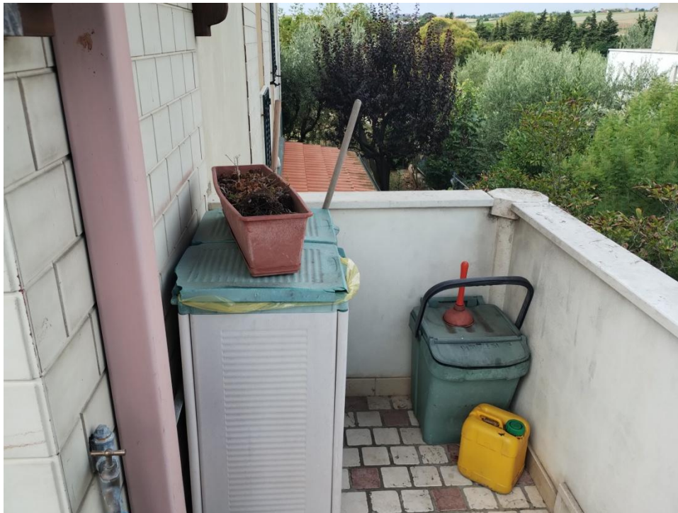
SUB. 3 : PIANO 1° ( ampliamento balcone )