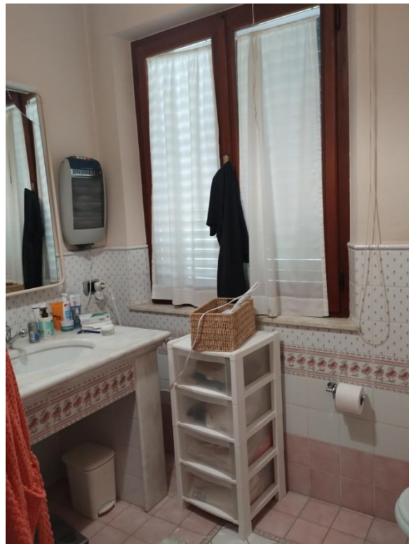
SUB. 3 : PIANO 1° : bagno