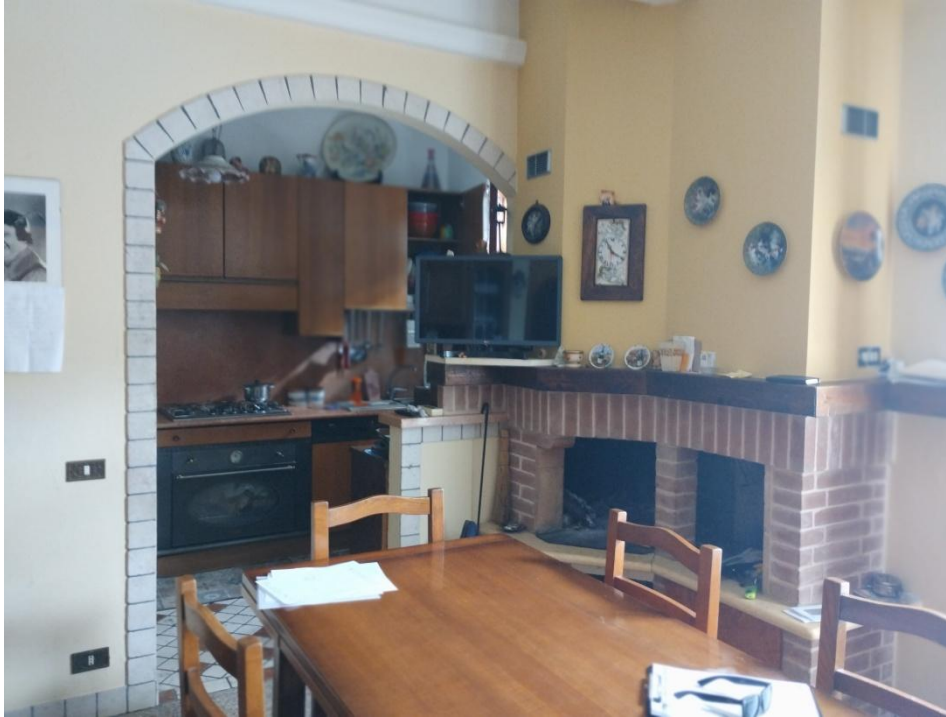
SUB. 3 : PIANO 1° CUCINA