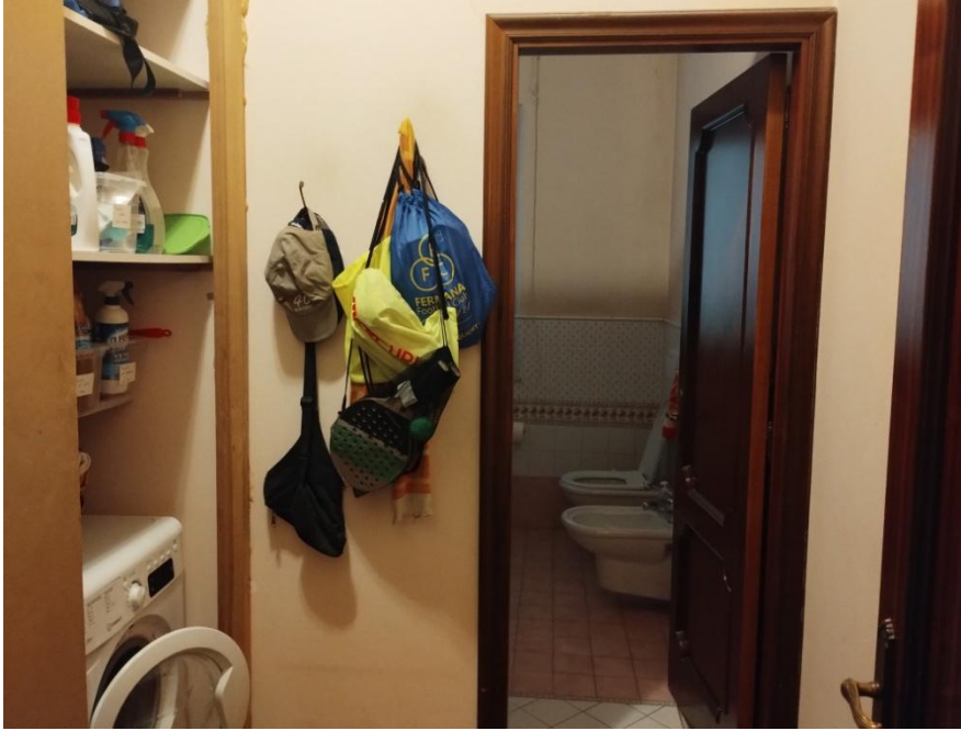
SUB. 3 : PIANO 1° ANTIBAGNO