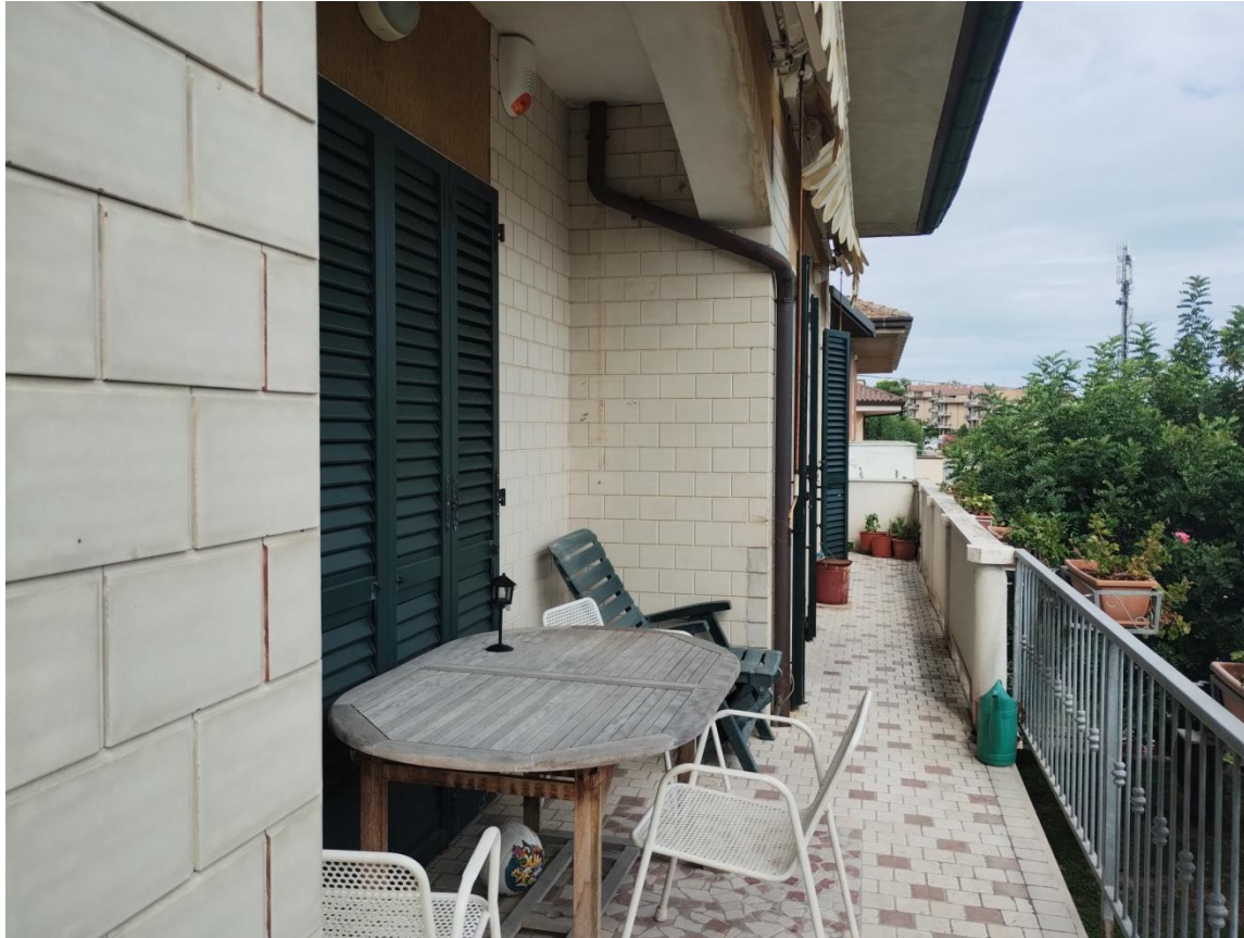
SUB. 3 : PIANO 1° balcone est