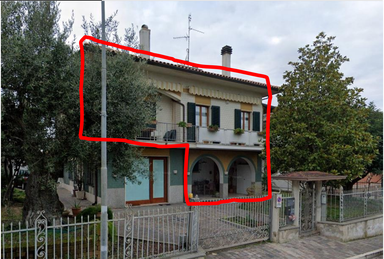
Via Solferino n.93 Porto Sant' Elpidio (FM)