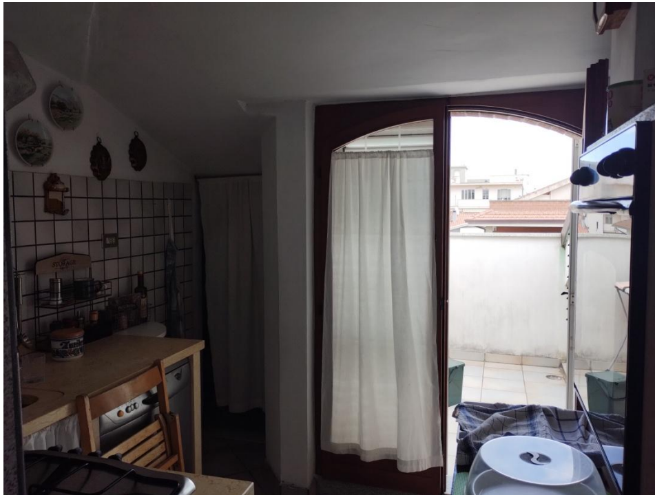
SUB. 3 : PIANO 2° Sottotetto – Soffitta ( porzione adibita a cucina)