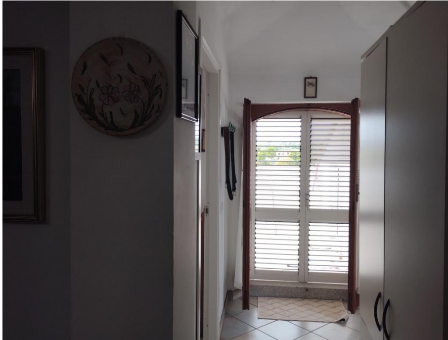
SUB. 3 : PIANO 2° Sottotetto – Soffitta ( disimpegno)