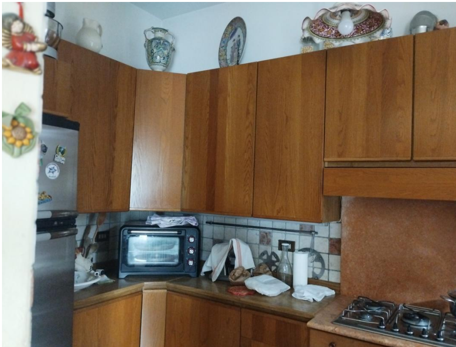
SUB. 3 : PIANO 1° : TINELLO /COTTURA