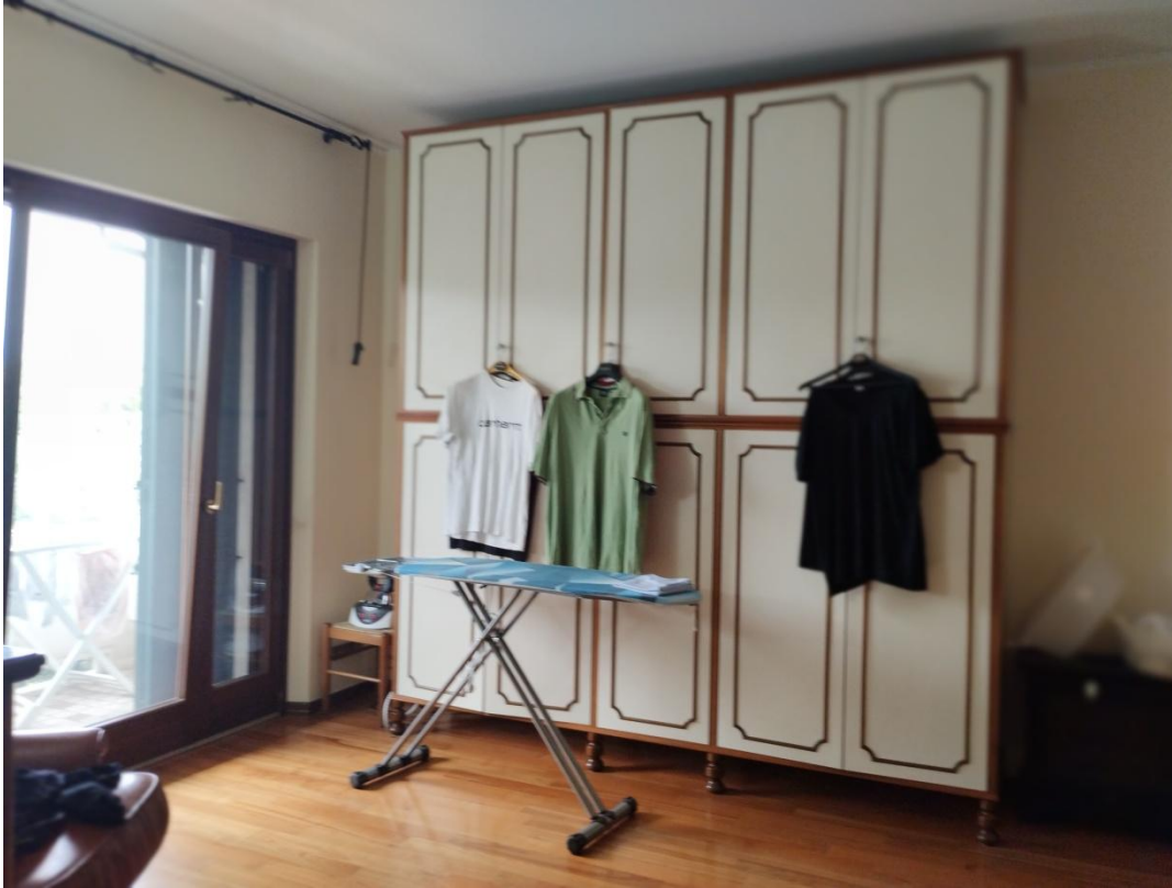
SUB. 3 : PIANO 1° : camera 3