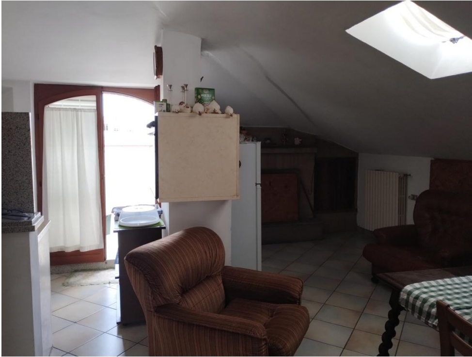
SUB. 3 : PIANO 2° Sottotetto – Soffitta