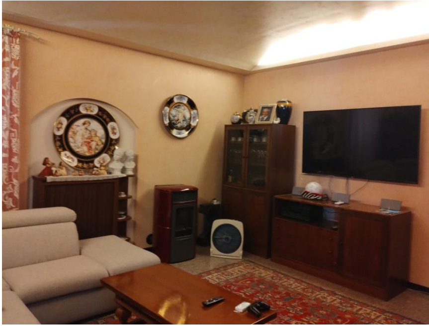
SUB. 3 : PIANO 1 ° : SALONE