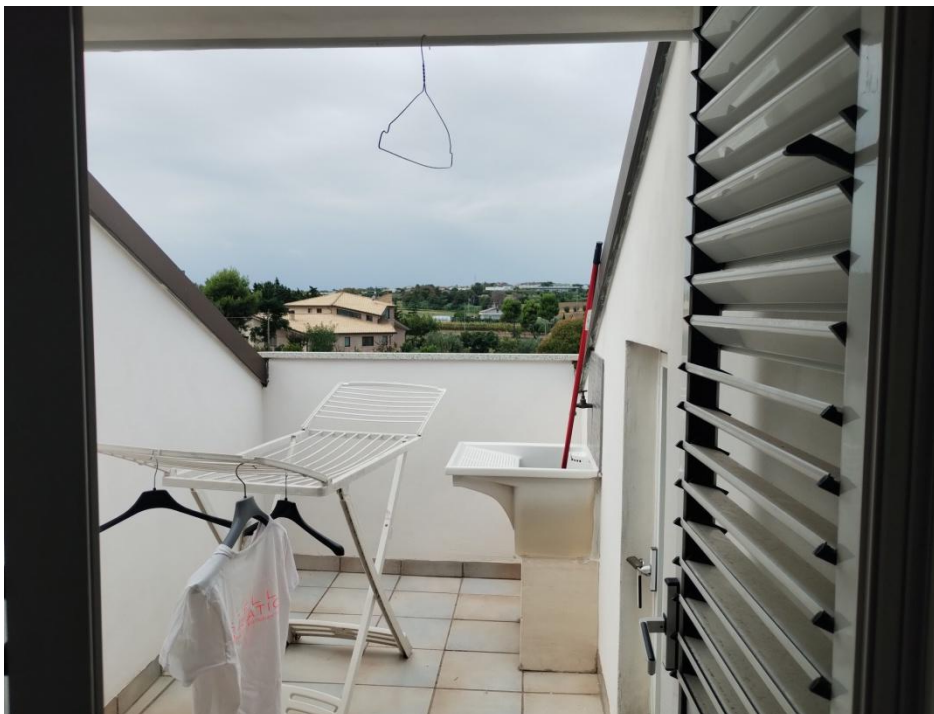
SUB. 3 : PIANO 2° Sottotetto – Soffitta ( terrazza a tasca ovest)