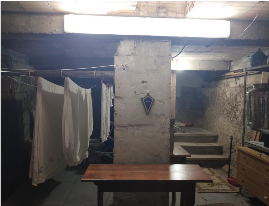
SUB. 3 : PIANO S1 : cantina