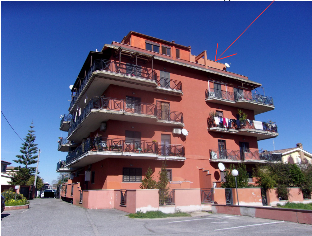
FOTO N. 2 Veduta esterna sul posto auto