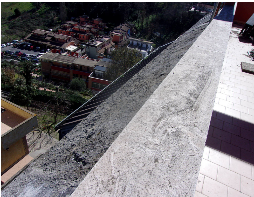
FOTO N. 14 Appartamento – Ripresa dal terrazzo sulla copertura del piano sottostante -