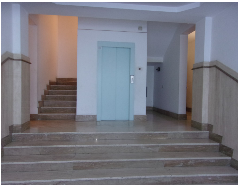
FOTO N. 6 Appartamento -Ingresso appartamento interno 12 su vano scala condominiale –