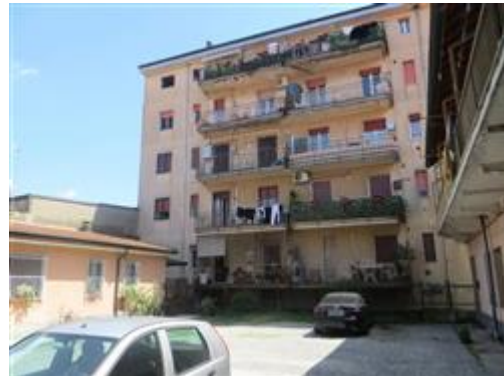
La corte interna