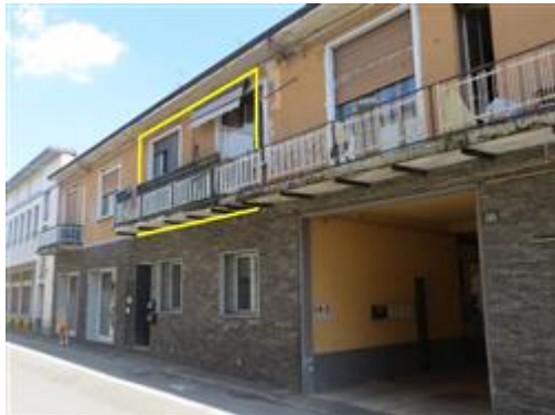
L'unità in oggetto vista da via Marconi

L'intero edificio sviluppa 2 piani fuori terra. Immobile costruito negli anni '30 e parzialmente ristrutturato probabilmente a cavallo tra gli anni '80 e '90.