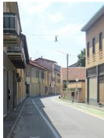
Via Guglielmo Marconi