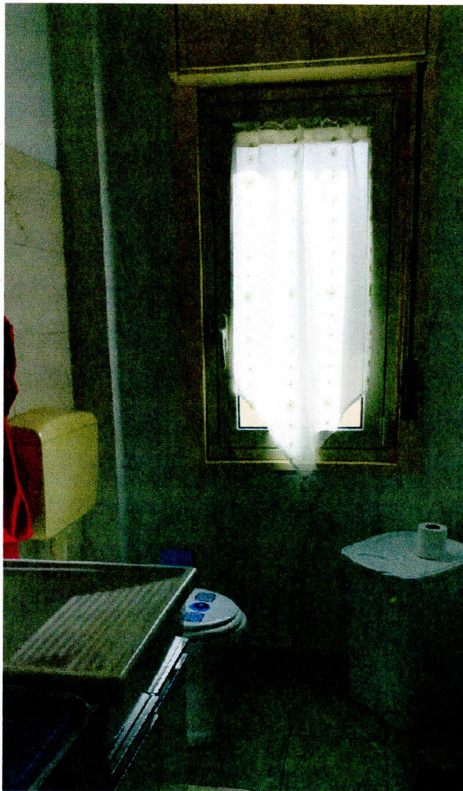
BAGNO DI SERVIZIO