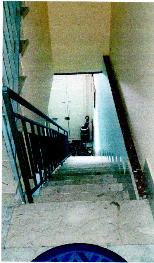
CORPO SCALA – DAL PORTONCINO DI INGRESSO AL PIANO 1°