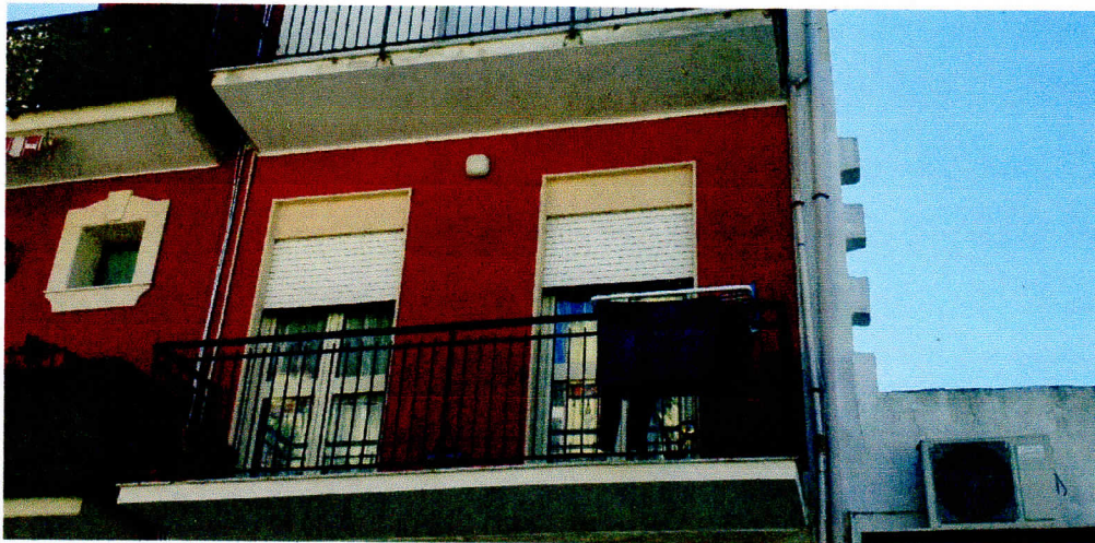
P. 1° - VIA A. MANZONI N. 62