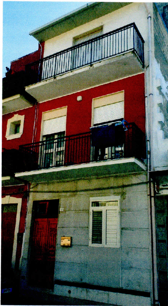
PROSPETTO PRINCIPALE- VIA A. MANZONI N. 62