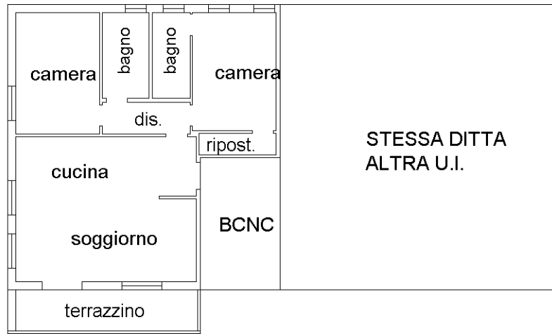
PIANO PRIMO h 270