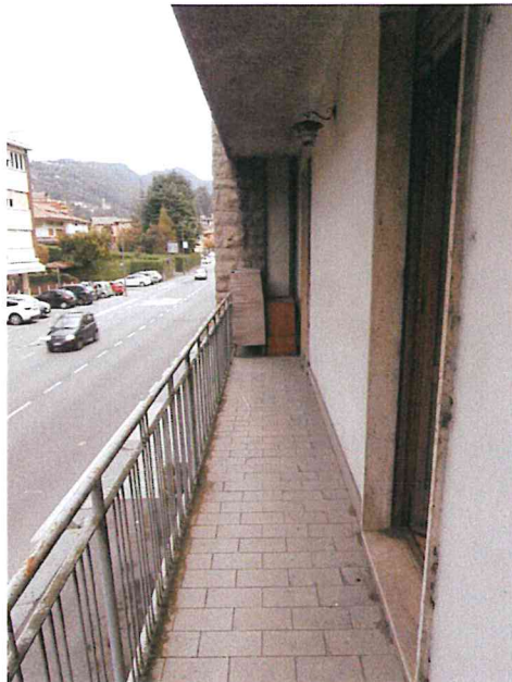
Foto 05 - Corpo A - balcone Nord