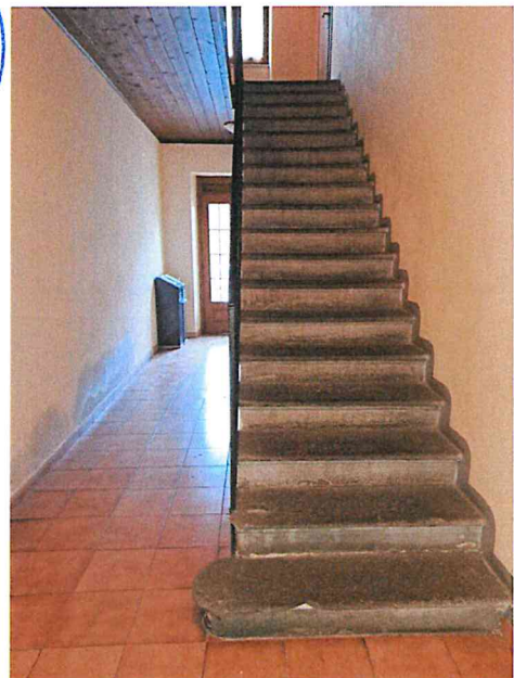
Foto 12 - Corpi A-C - scale condominiali piani fuoriterra