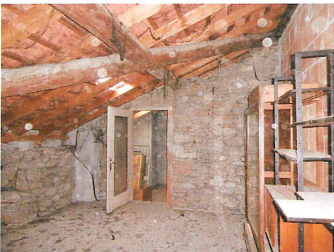
Foto 23 - Corpo C - interno - sottotetto porzione Ovest