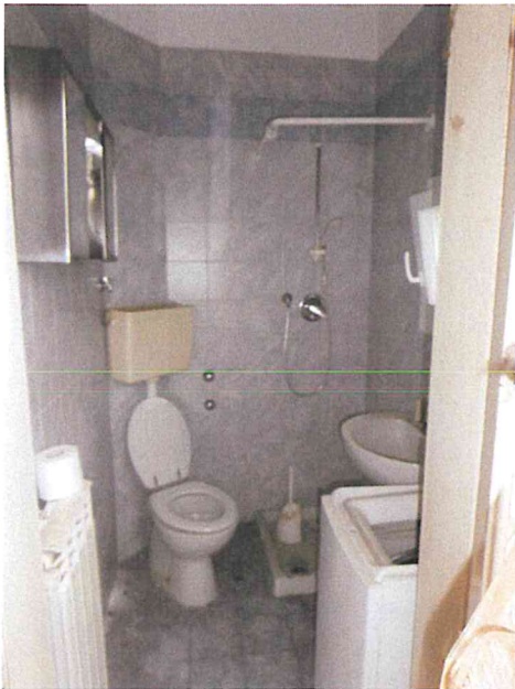
Foto 19 - Corpo A - interno - bagno