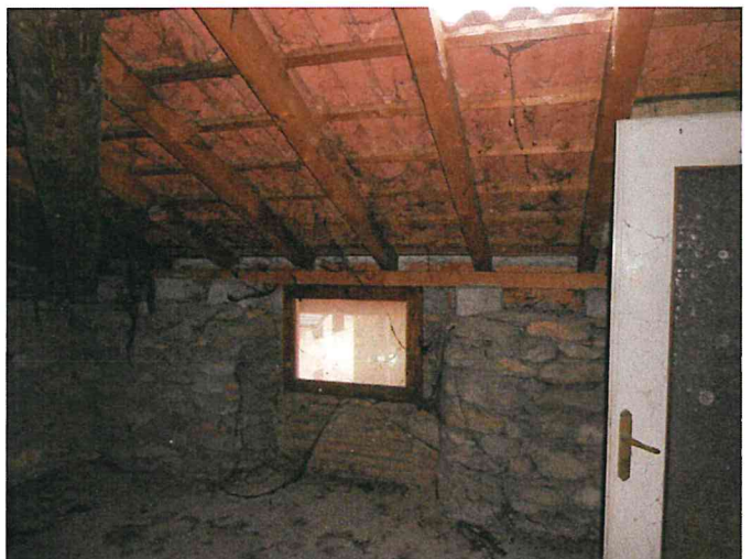
Foto 24 - Corpo C - interno sottotetto porzione Ovest