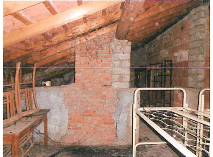
Foto 26 - Corpo C - interno - sottotetto porzione Est