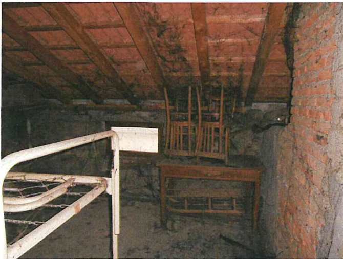
Foto 27 - Corpo C - interno - sottotetto porzione Est