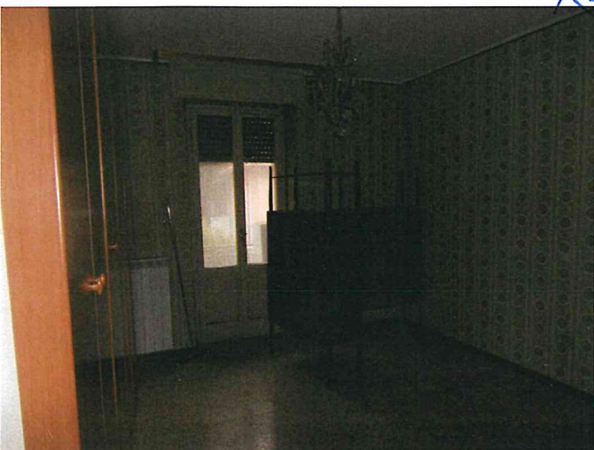
Foto 17 - Corpo A - interno - camera Nord