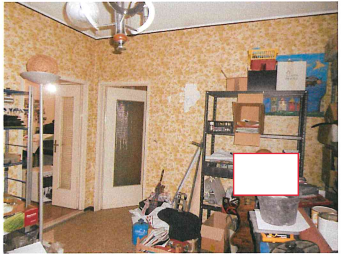
Foto 16 - Corpo A - interno - camera Sud