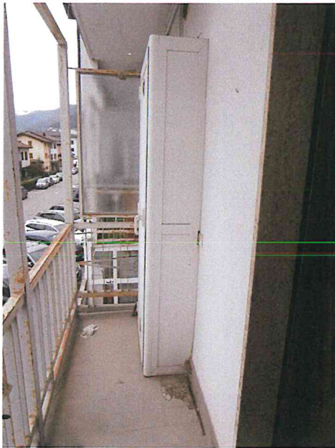
Foto 07 - Corpo A - Balcone Sud