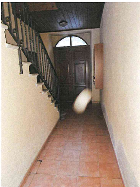
Foto 11 - Corpi A-B-C - ingresso condominiale