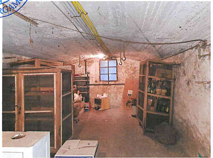
Foto 22 - Corpo B - interno - cantina comune con area esclusiva (Sud)