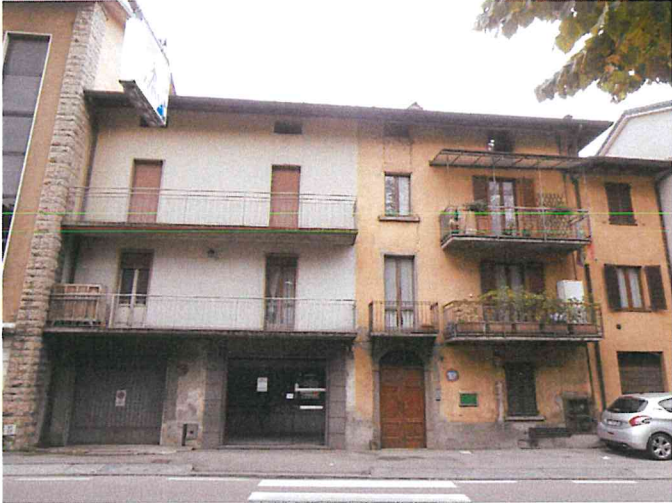
Foto 01 - Vista edificio prospetto Nord