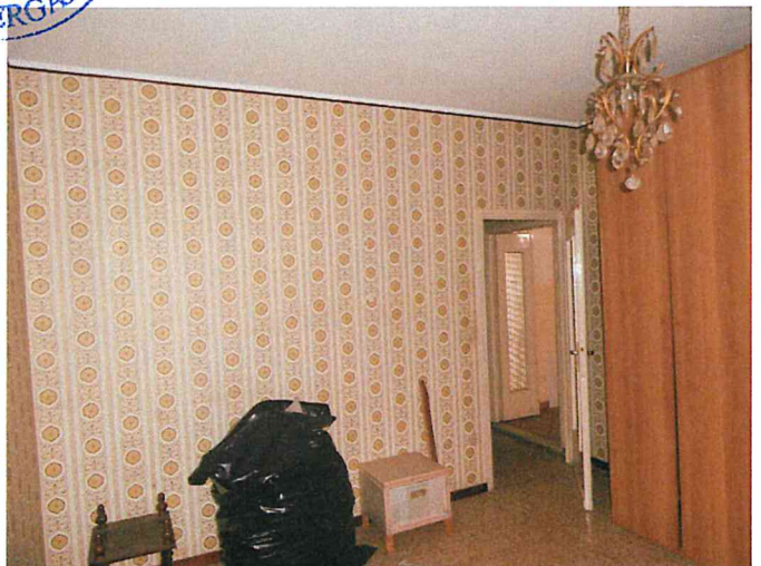
Foto 18 - Corpo A - interno - camera Nord