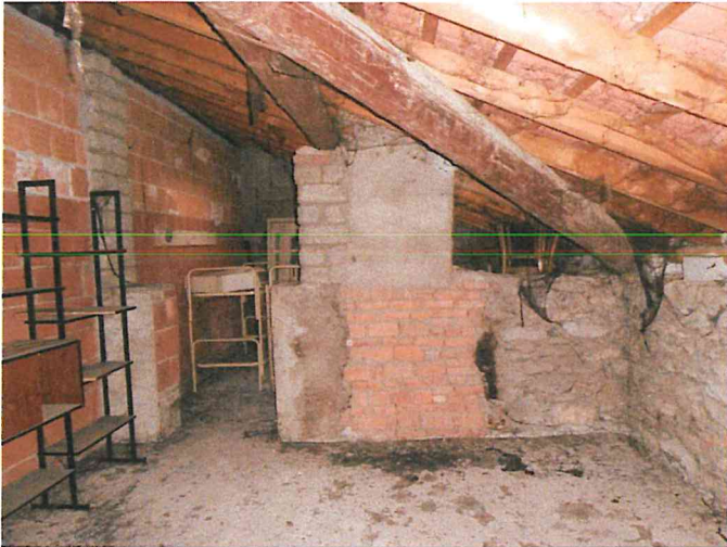
Foto 25 - Corpo C - interno - sottotetto porzione Ovest