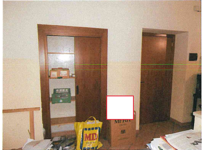
Foto 14 - Corpo A - interno - ingresso zona giorno