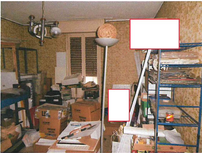
Foto 15 - Corpo A - interno - camera Sud