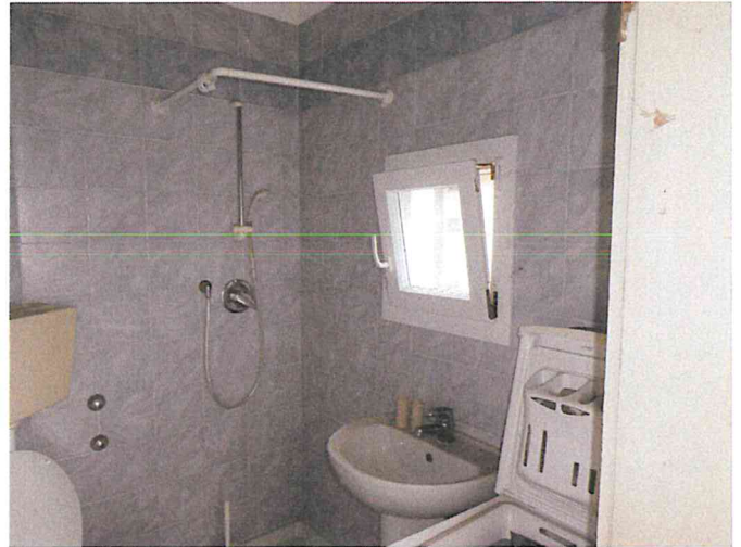
Foto 20 - Corpo A - interno - bagno