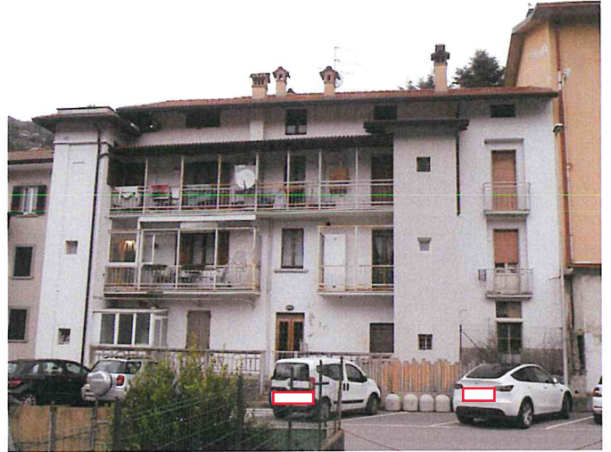
Foto 02 - Vista edificio prospetto Sud