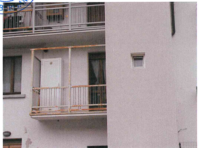
Foto 06 - Corpo A - Prospetto Sud