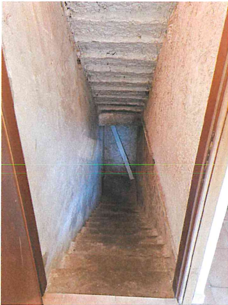
Foto 13 - Corpo B - scale condominiali piano interrato