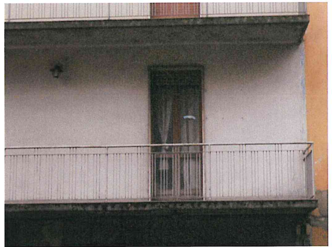
Foto 04 - Corpo A - prospetto Nord