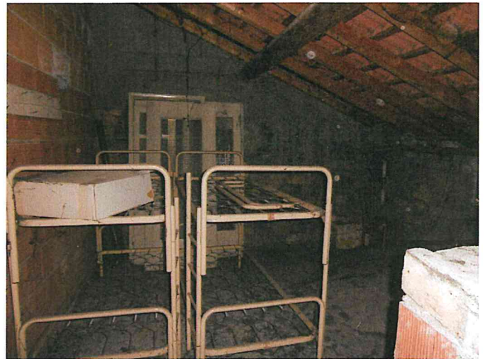
Foto 28 - Corpo C - interno - sottotetto porzione Est