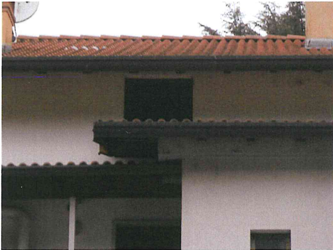
Foto 09 - Corpo C - Prospetto Sud