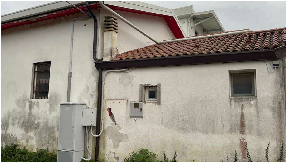
Vista retro esterna