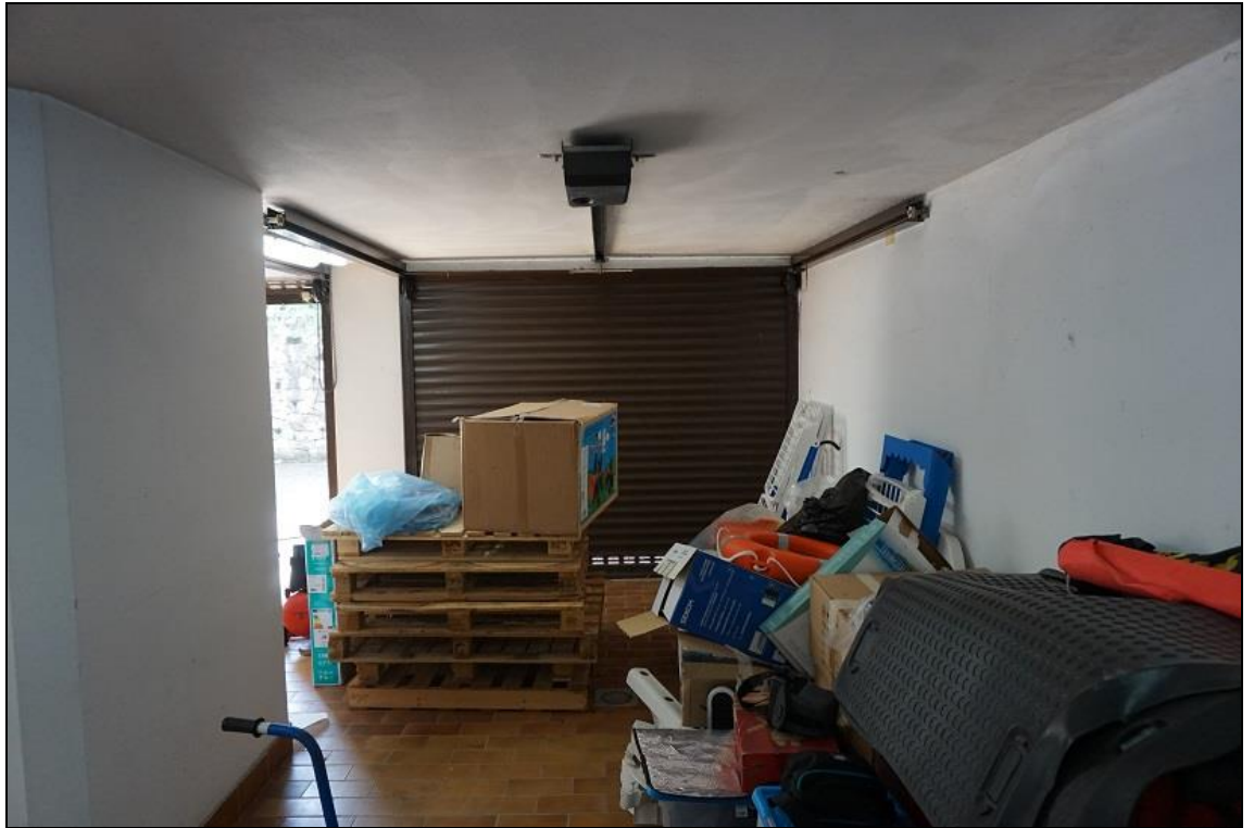
FOTO 45 – Piano interrato – Autorimessa (Part.1551 sub.8) da nord