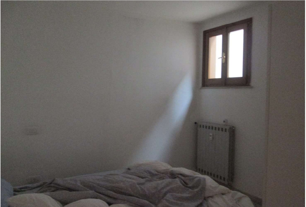
Foto 14- Camera / Rip. piano primo