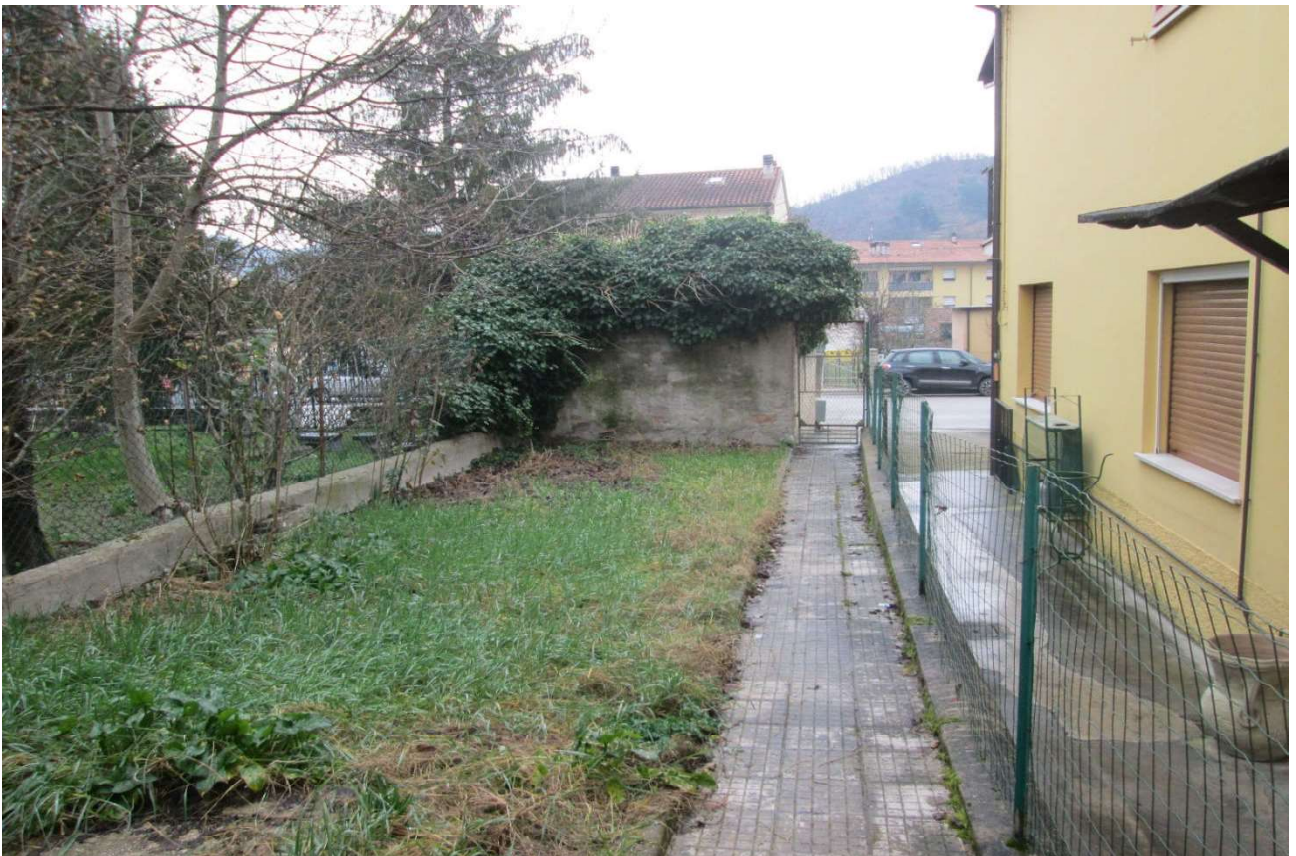
Foto 3 -Scoperto esclusivo sul retro -su Via Flaminia