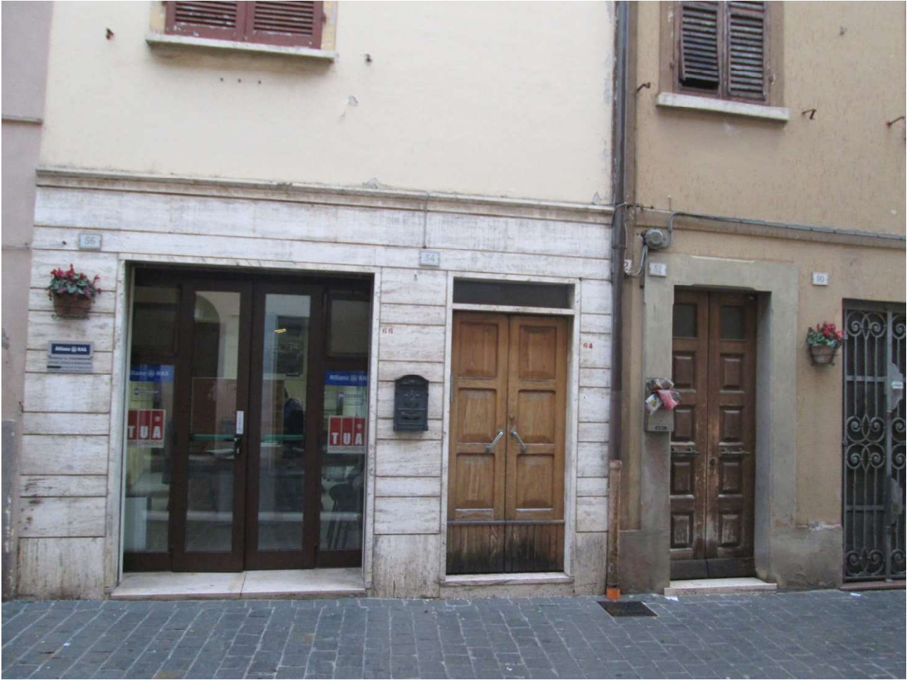
Foto 1- Prospetto su Corso Roma- vista dei due ingressi (civico54-56)