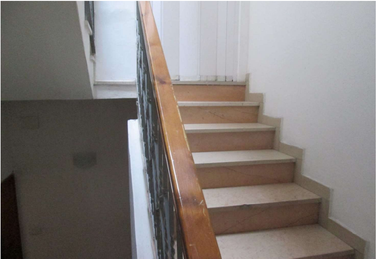
Foto 9- Scala interna