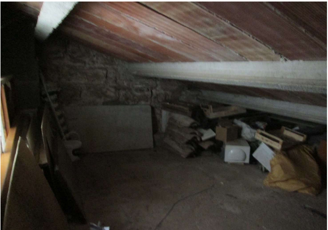
Foto 19- Locale grezzo al Piano secondo -sottotetto