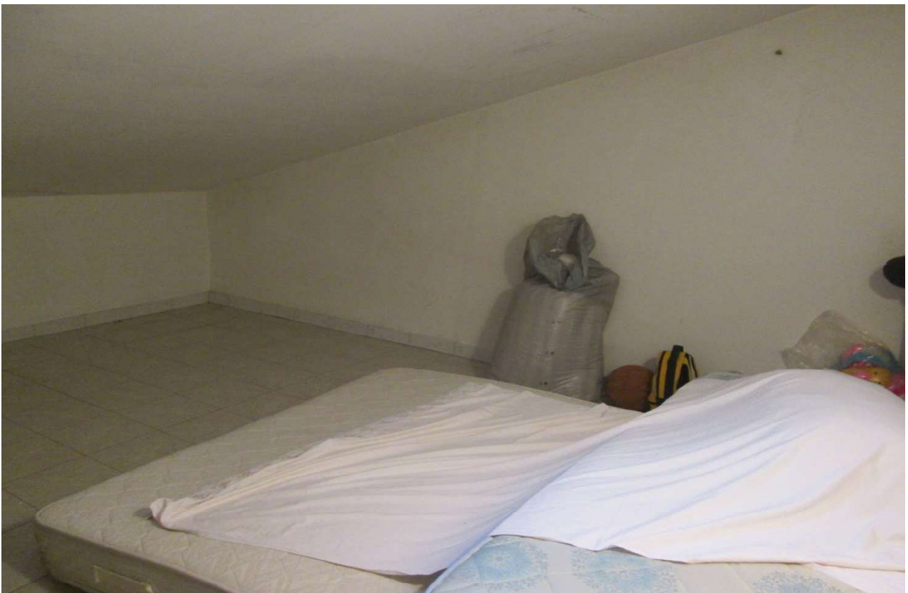
Foto 17- Vano finito al Piano secondo -sottotetto