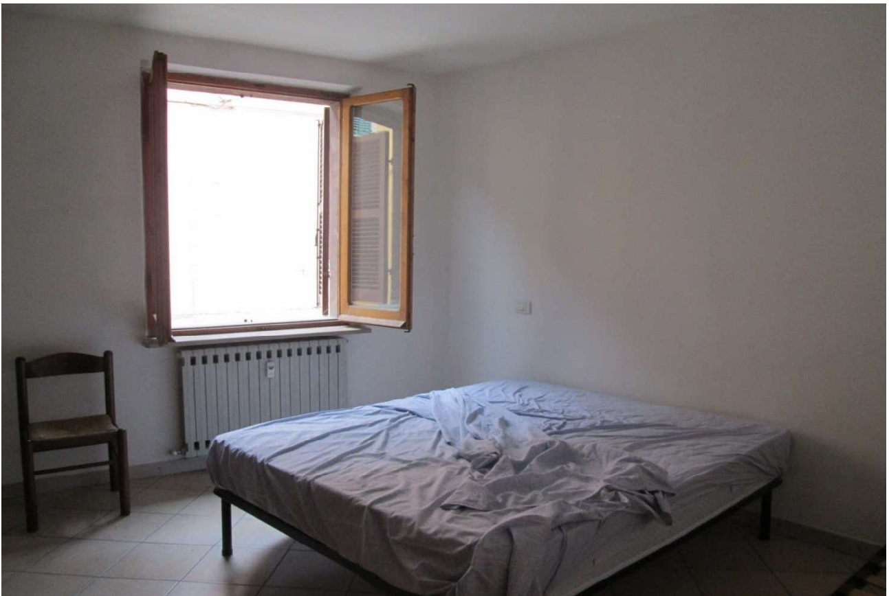
Foto 13- Camera piano primo