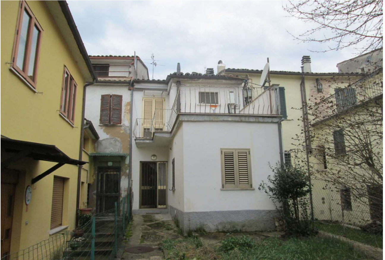
Foto 2 -Retro