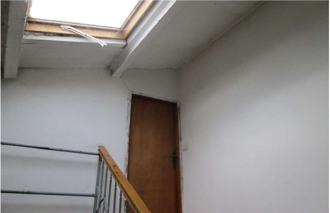
Foto 16- Porta d'ingresso al Piano secondo -sottotetto