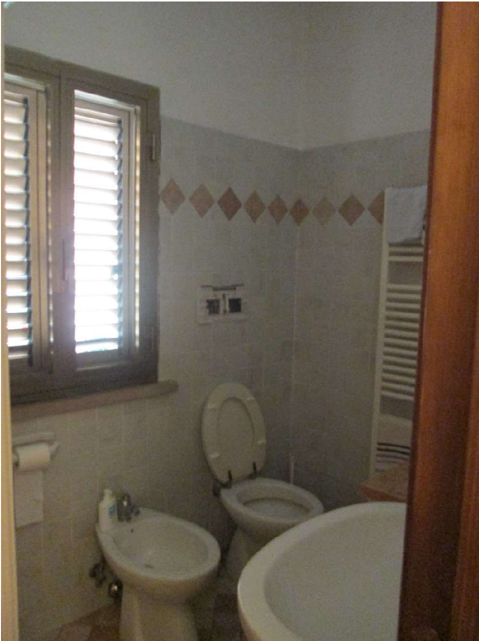
Foto 7 -Bagno al Piano Terra