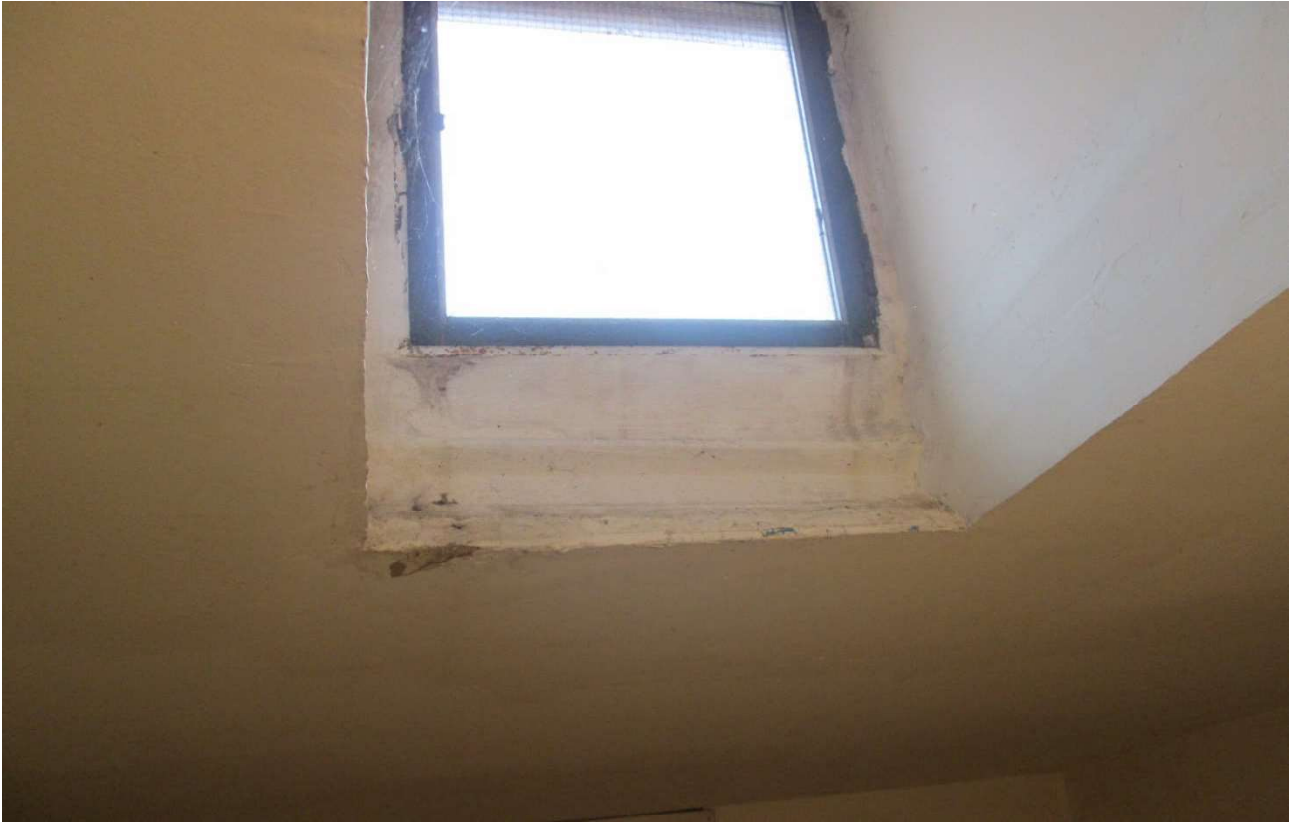
Foto 18- Abbaino nel vano finito al Piano secondo -sottotetto