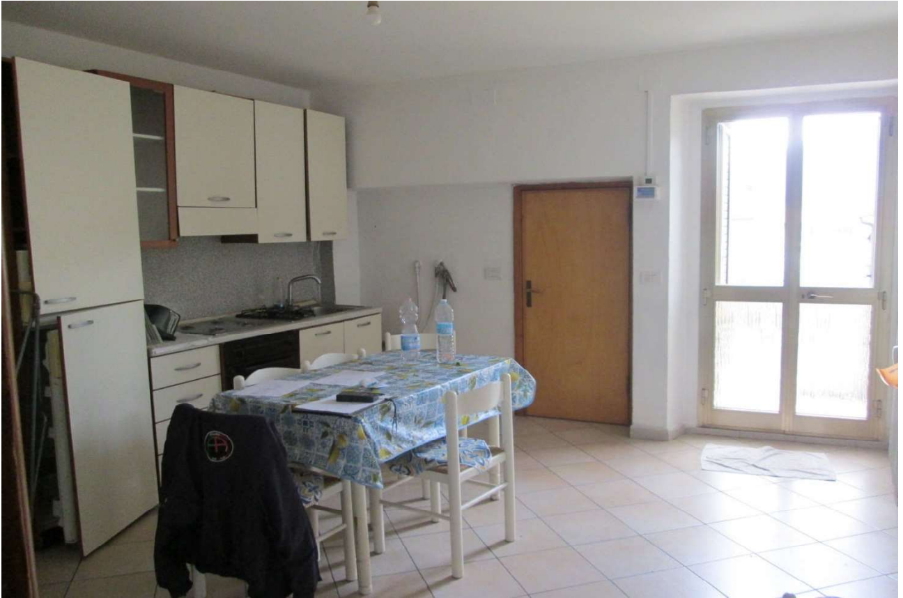
Foto 10- Zona giorno piano primo