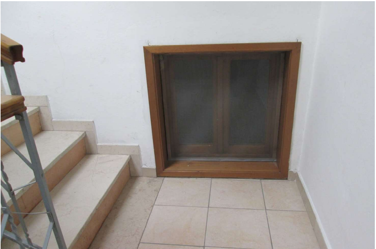
Foto 15- Finestra su scala interna (della Camera / Rip. piano primo)