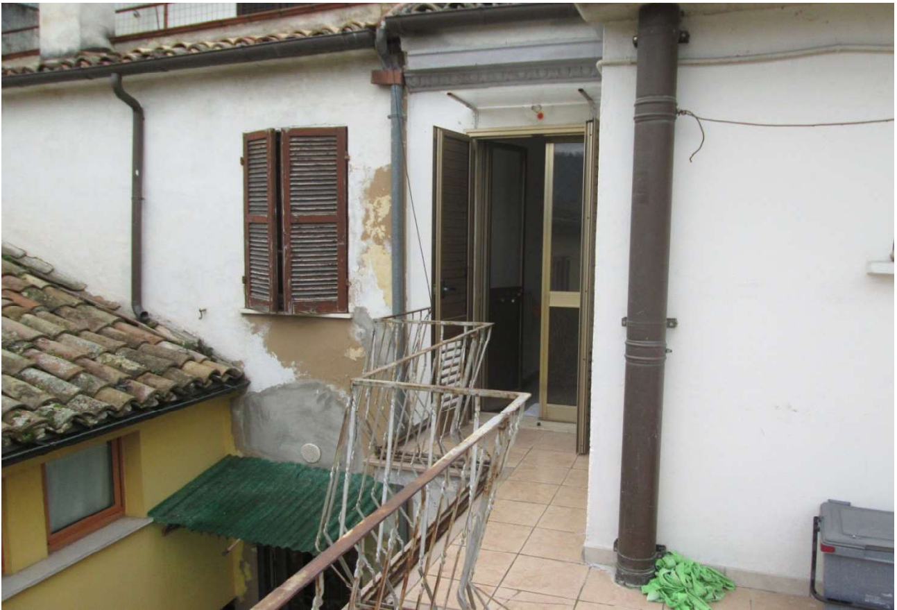
Foto 12- Terrazzo piano primo