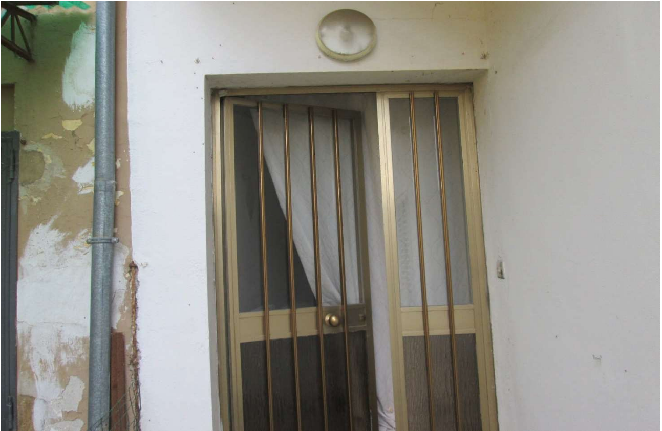
Foto 5 -Porta d'ingresso sul retro da Via Flaminia