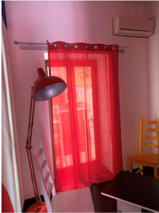
Figura 18: Disimpegno camera al piano primo (terra rialzato di via S. Spiridione)