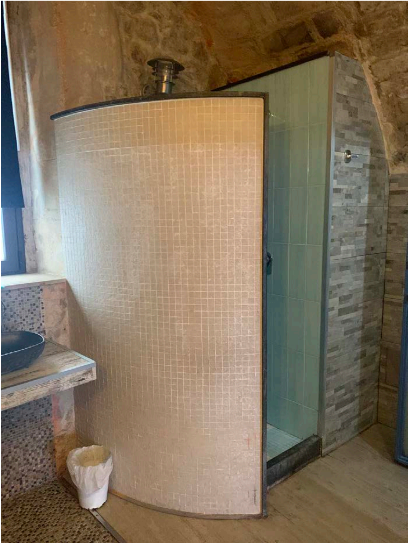
Figura 9: Alloggiamento doccia