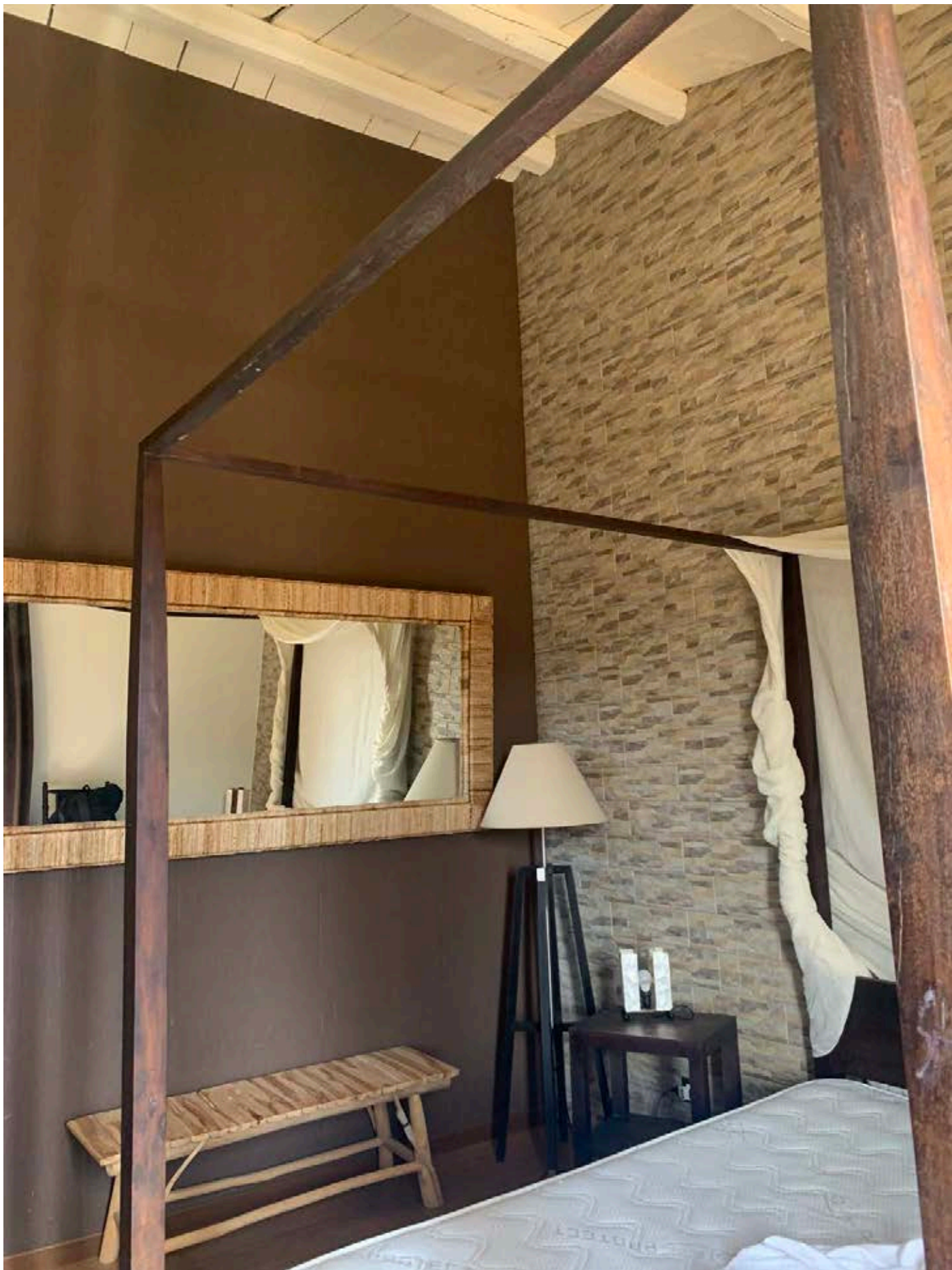
Figura 25: Camera matrimoniale al piano terzo (piano secondo di via S. Spiridione)