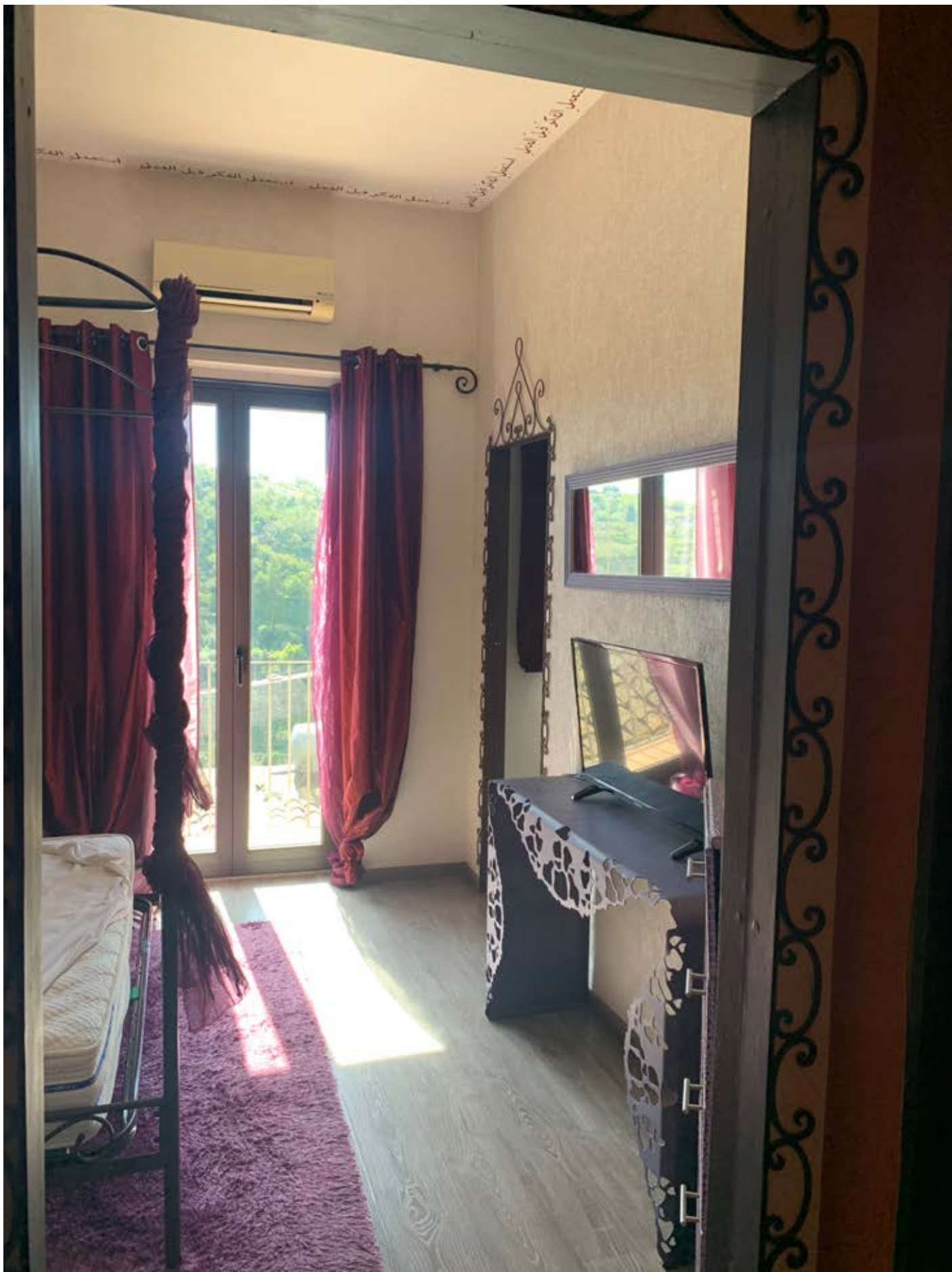
Figura 21: Camera matrimoniale al piano secondo (piano primo di via S. Spiridione)