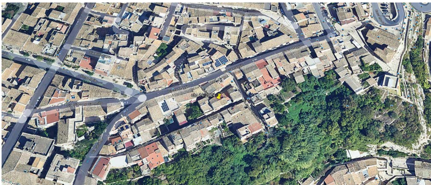
Figura 28: Immagine telerilevata dell'isolato