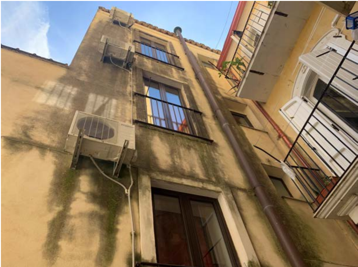
Figura 13: Facciata via Santo Spiridione