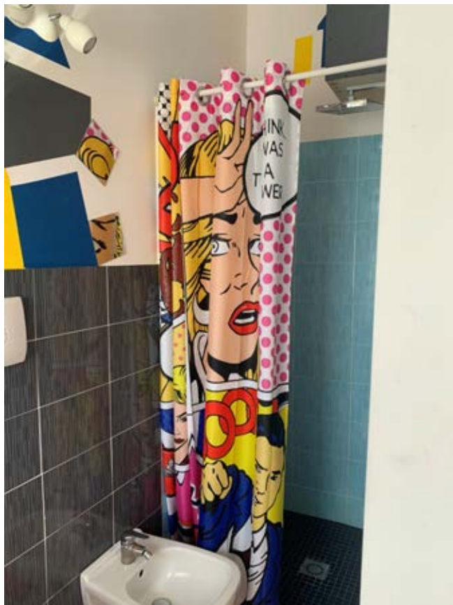
Figura 19: Bagno al piano primo (terra rialzato di via S. Spiridione)