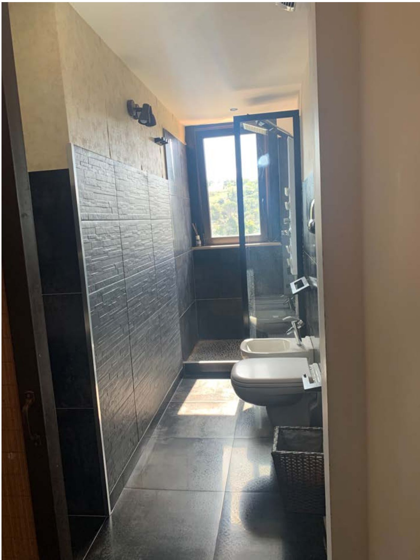
Figura 24: Bagno al piano terzo (piano secondo di via S. Spiridione)