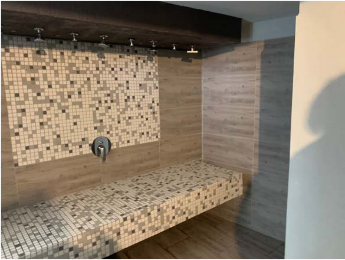
Figura 10: Doccia emozionale