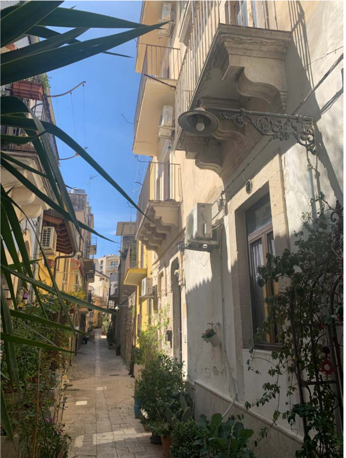
Figura 1: Facciata via Sant'Alberto