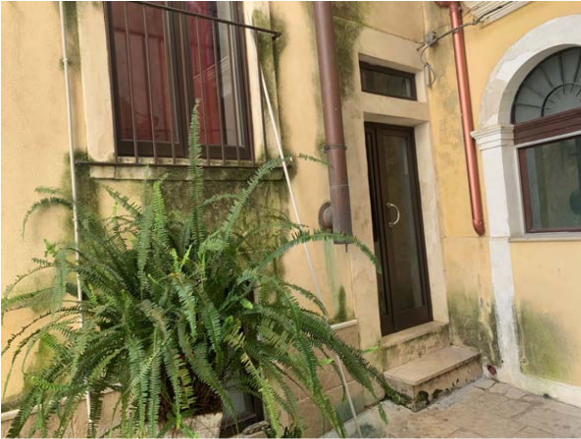
Figura 12: Ingresso di via Santo Spiridione