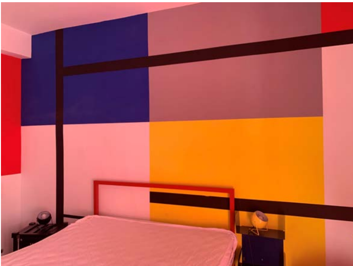
Figura 17: Camera matrimoniale al piano primo (terra rialzato di via S. Spiridione)