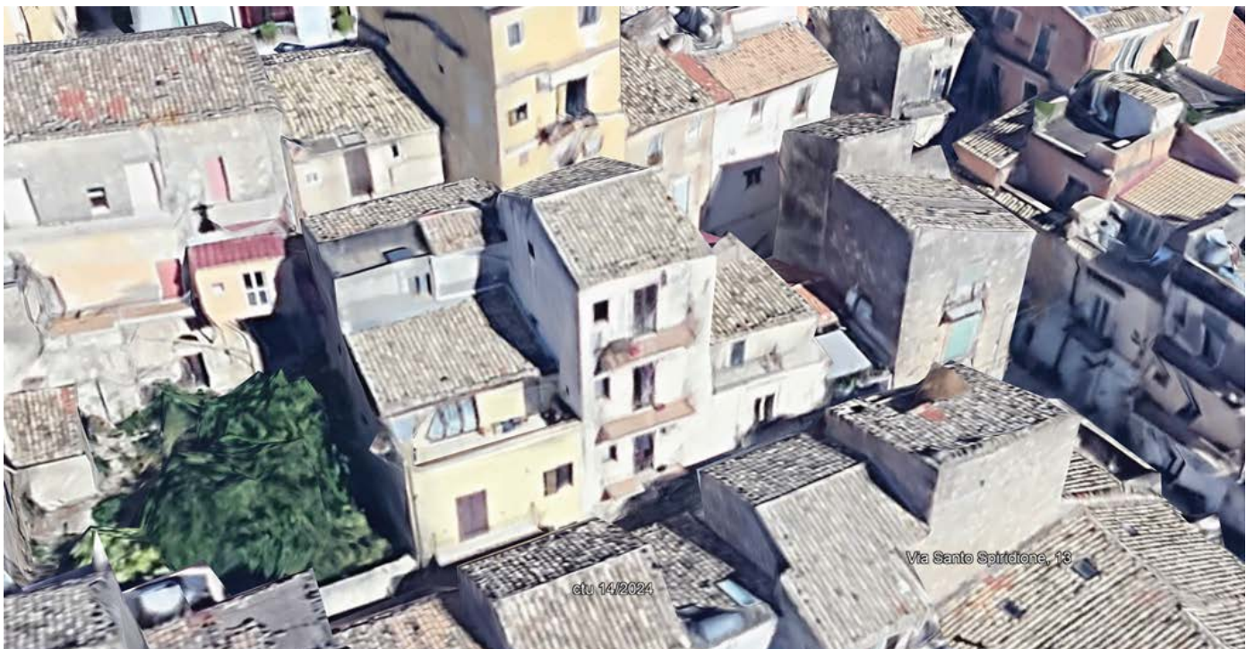
Figura 27: Restituzione tridimensionale da Immagini telerilevate