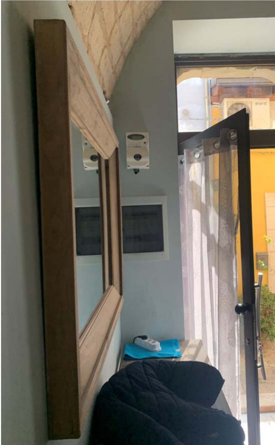
Figura 4: Ingresso