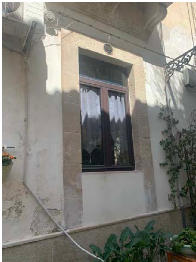
Figura 3: Particolare facciata