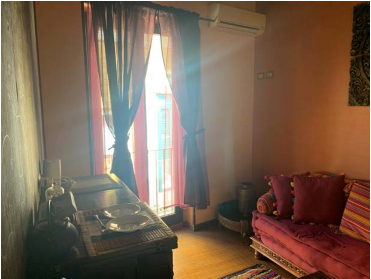
Figura 23: disimpegno camera al piano terzo (piano secondo di via S. Spiridione)