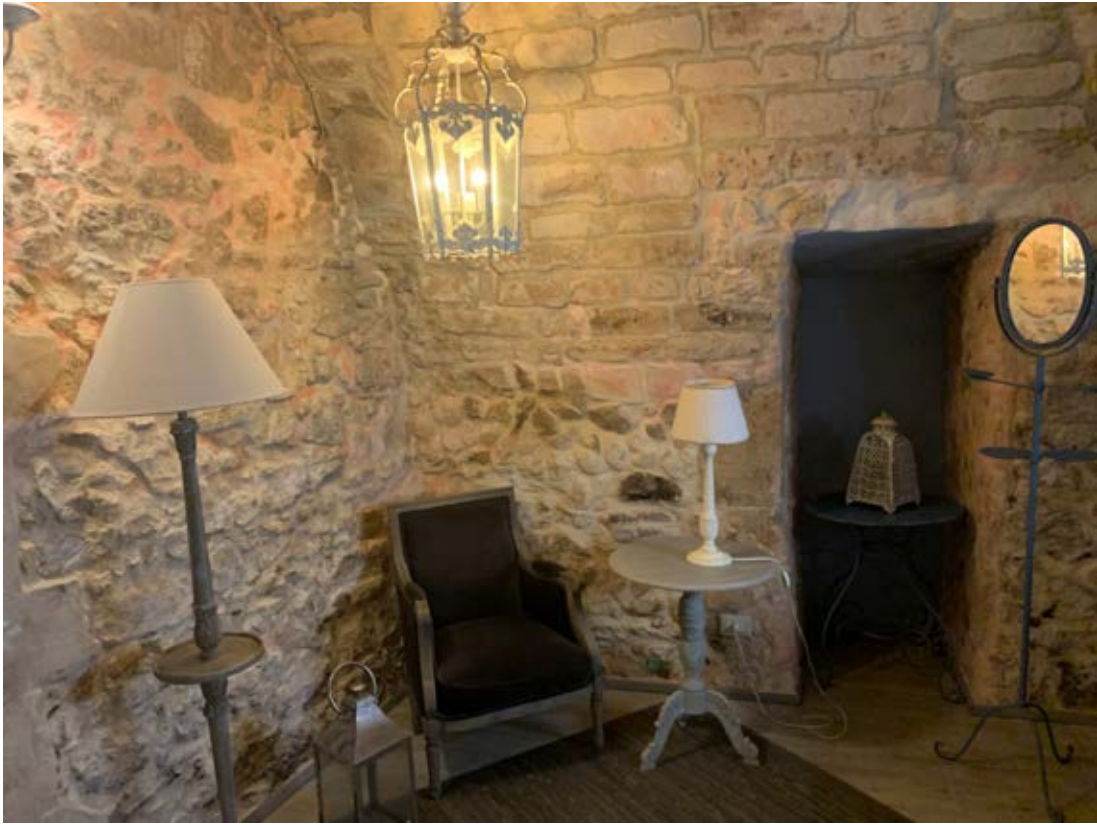
Figura 7: Disimpegno bagno