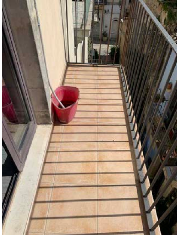
Figura 22: Balcone su via Sant'Alberto