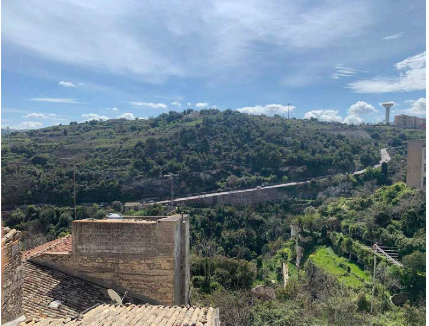
Figura 26: Vista panoramica dal balcone al piano terzo di via Sant'Alberto