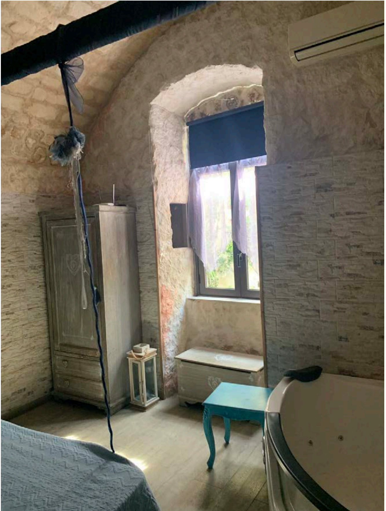
Figura 6: Camerad matrimoniale