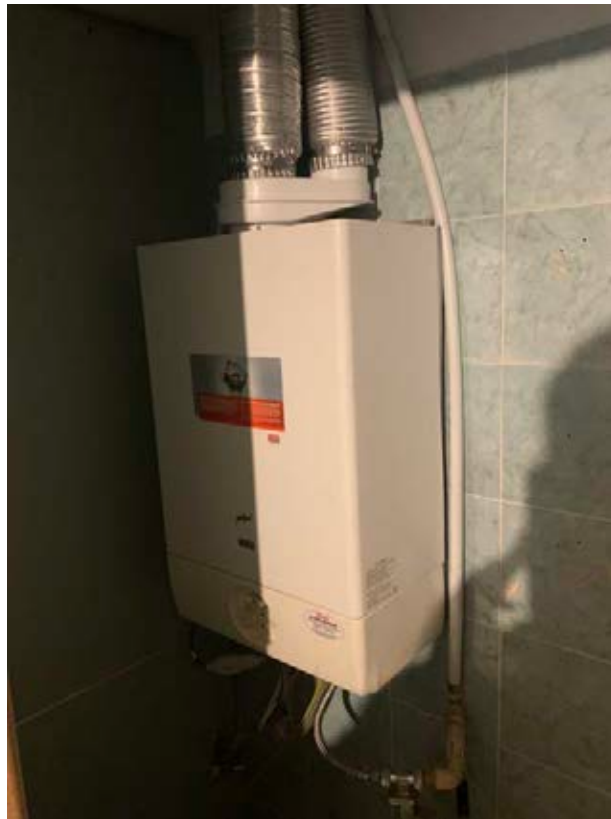
Figura 11: Caldaia a metano per l'acqua calda sanitaria dell'intera abitazione