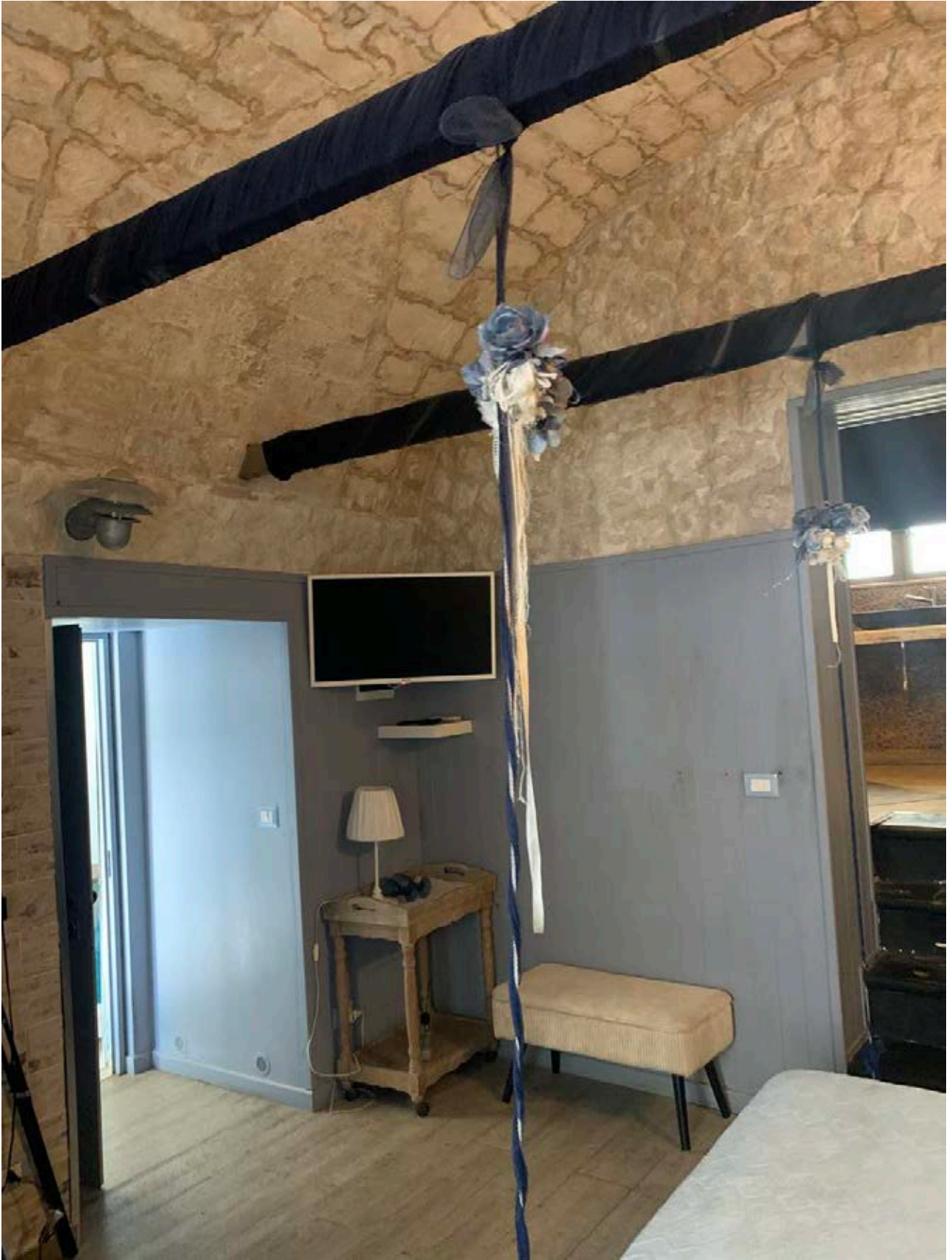
Figura 5: Camera matrimoniale