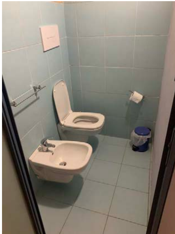
Figura 8: W.C.