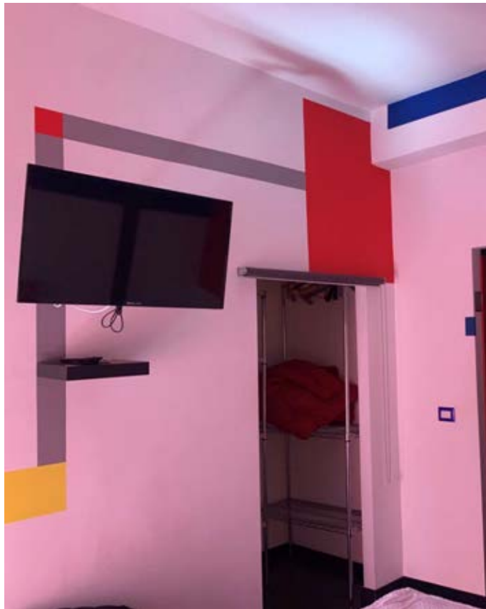
Figura 16: Camera matrimoniale al piano primo (piano terra rialzato di via S. Spiridione)