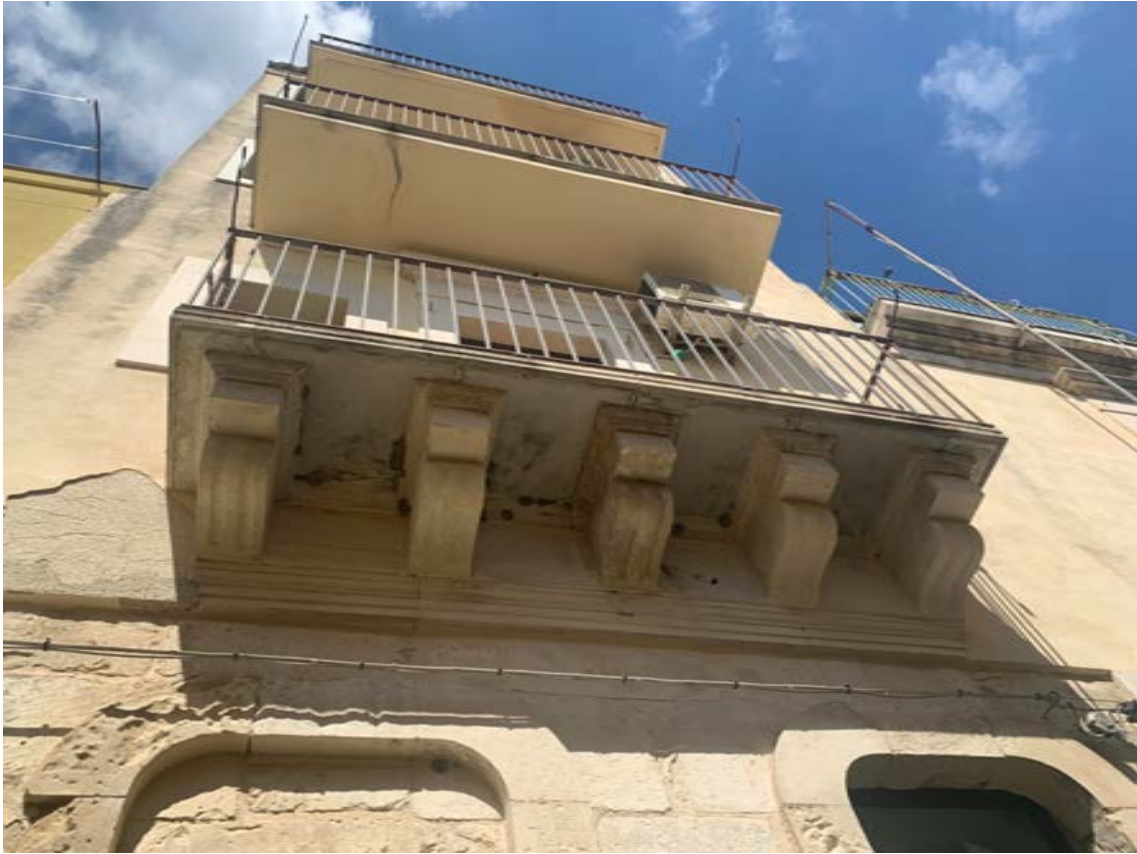
Figura 2: Particolare facciata