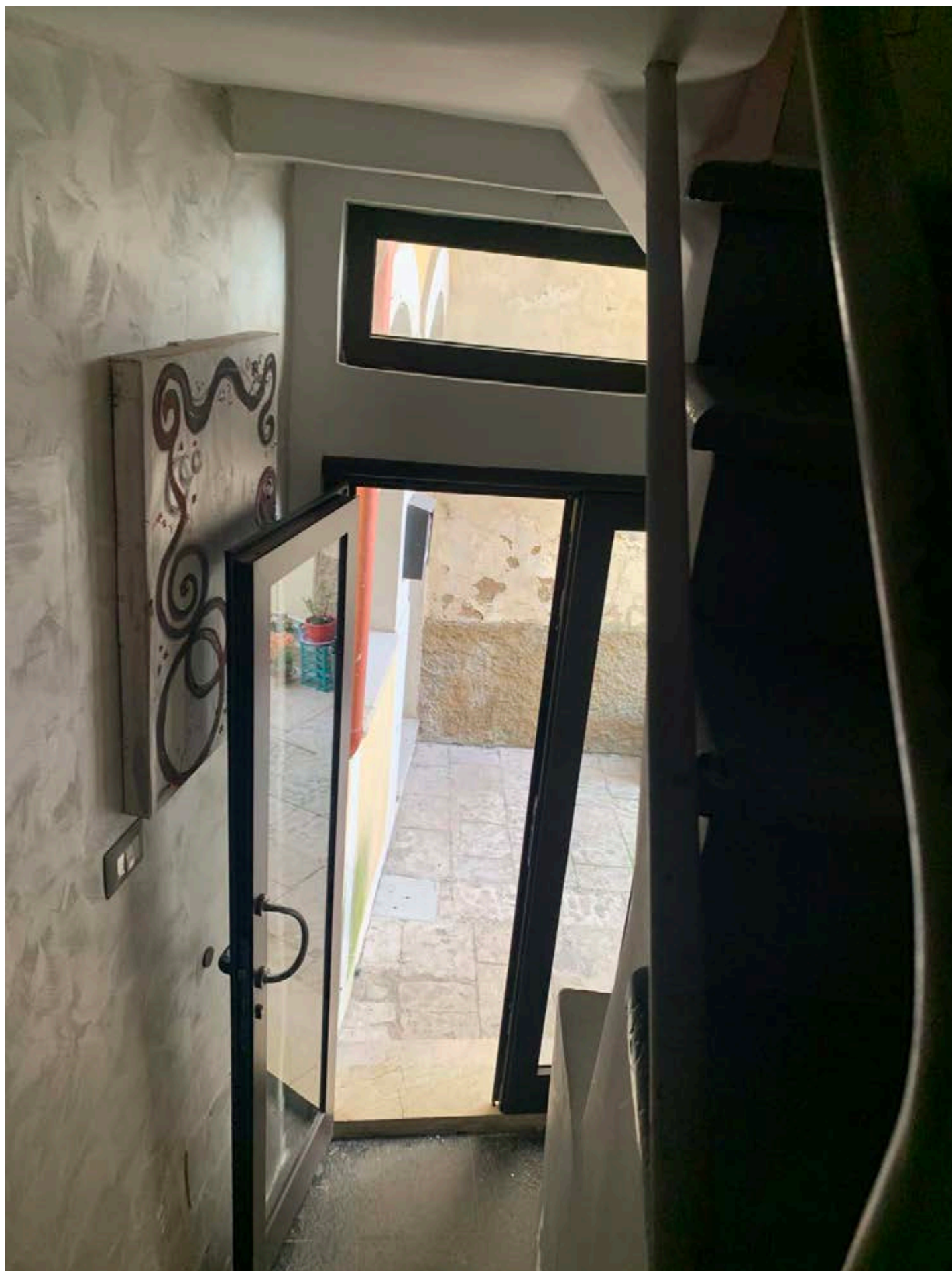
Figura 14: Ingresso vano scale