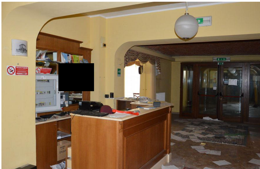
Illustrazione 5: Ingresso posto al piano terra.