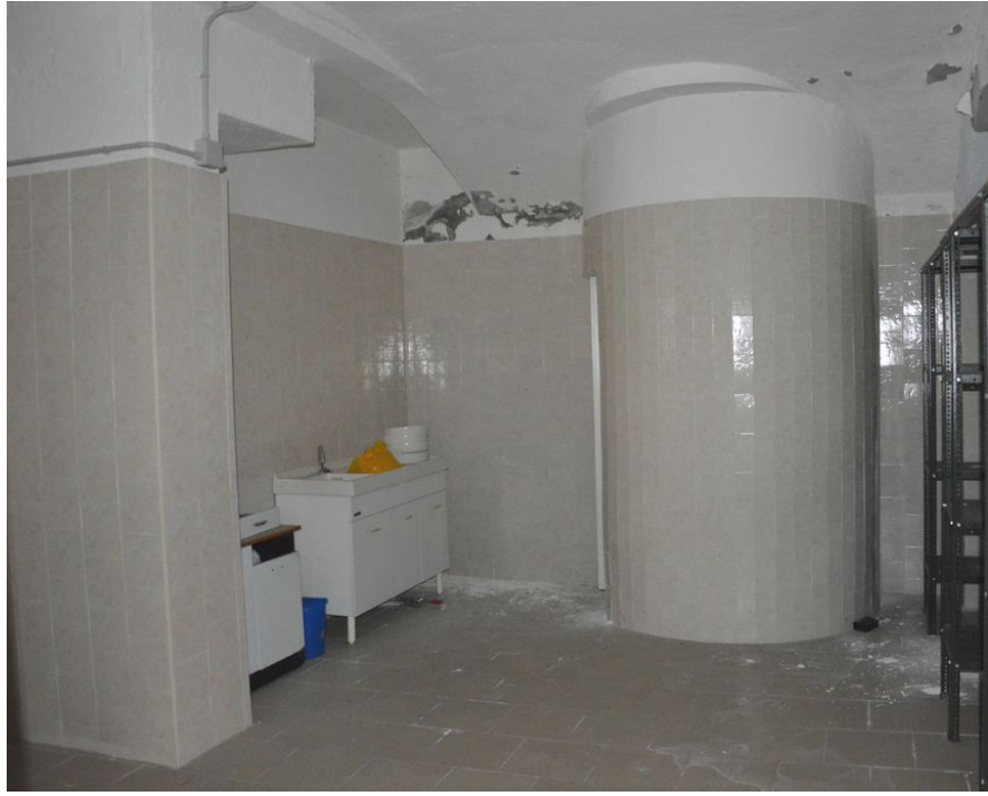
Illustrazione 12: Cantina formaggi posta al piano seminterrato e vano scale circolare entro cui trova collocazione chiocciola di distribuzione verticale al livello superiore. Si evidenziano diffuse esfoliazioni degli intonaci.

ecoArchitettare studio associato di Architettura Bioclimatica dott. arch. Michele Ricupero | geom. Yvette Comé C.T.U. incaricato: arch. Michele Ricupero