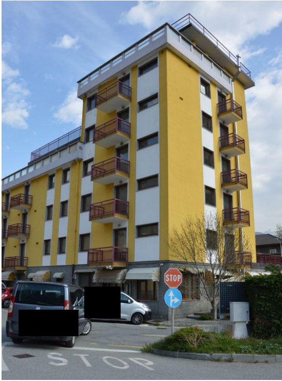
Illustrazione 2: Vista dei fronti sud-est del fabbricato in cui è ubicato il ristorante oggetto di esecuzione immobiliare.