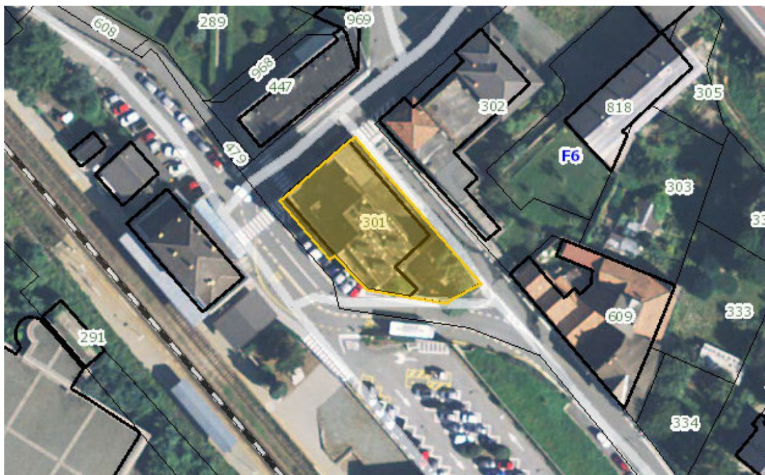
Illustrazione 1: Il lotto n. 3 è costituito dai piani seminterrato e terra di un fabbricato censito al catasto fabbricati del comune di Verrès al foglio 6 n. 301 sub. 6, adibito a ristorante e relative pertinenze.