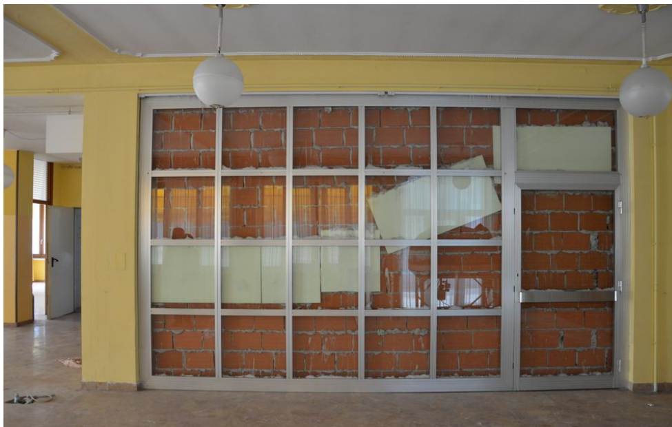
Illustrazione 9: Partizione verticale che separa la sala ristorante dal vano scala che conduce all'hotel posto ai piani superiori (non oggetto della presente esecuzione). La partizione è stata realizzata senza alcuna cura estetica.