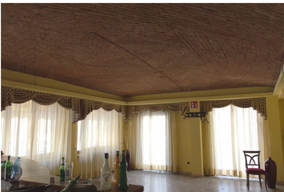
Illustrazione 11: Bar posto al piano terra. Presa fotografica opposta rispetto alla precedente.