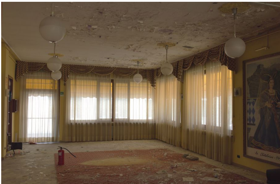
Illustrazione 7: Sala ristorante posta al piano terra. Si evidenziano diffuse esfoliazioni dello strato corticale interno dell'intradosso del solaio superiore. Emergono altresì segni di atti vandalici (svuotamento per terra del contenuto dell'estintore)