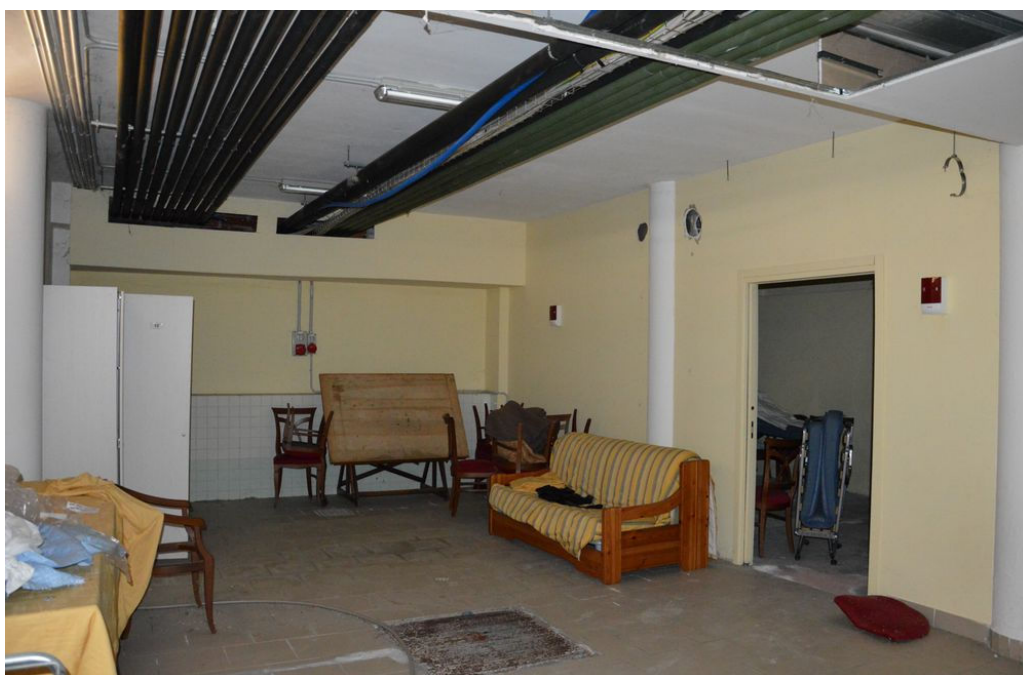
Illustrazione 17: Stireria posta al piano seminterrato. All'interno di tale ambiente compaiono a vista reti impiantistiche ancorate a soffitto.