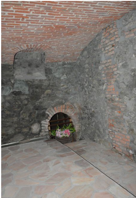
Illustrazione 20: Locale posto al piano seminterrato che sulla planimetria catastale viene denominato "caveau". Modifica del punto di presa.