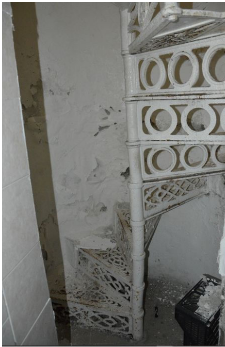
Illustrazione 13: Scala a chiocciola metallica che collega la cucina alla cantina formaggi. Si evidenziano diffuse esfoliazioni degli intonaci.