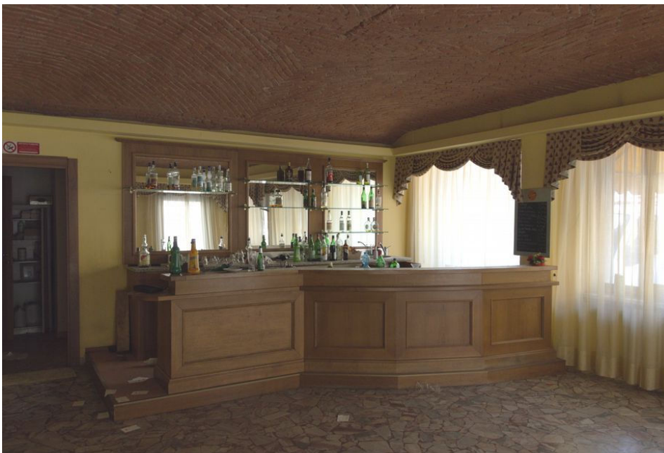
Illustrazione 10: Bar posto al piano terra. Tale ambiente risulta coperto con una volta in laterizio.