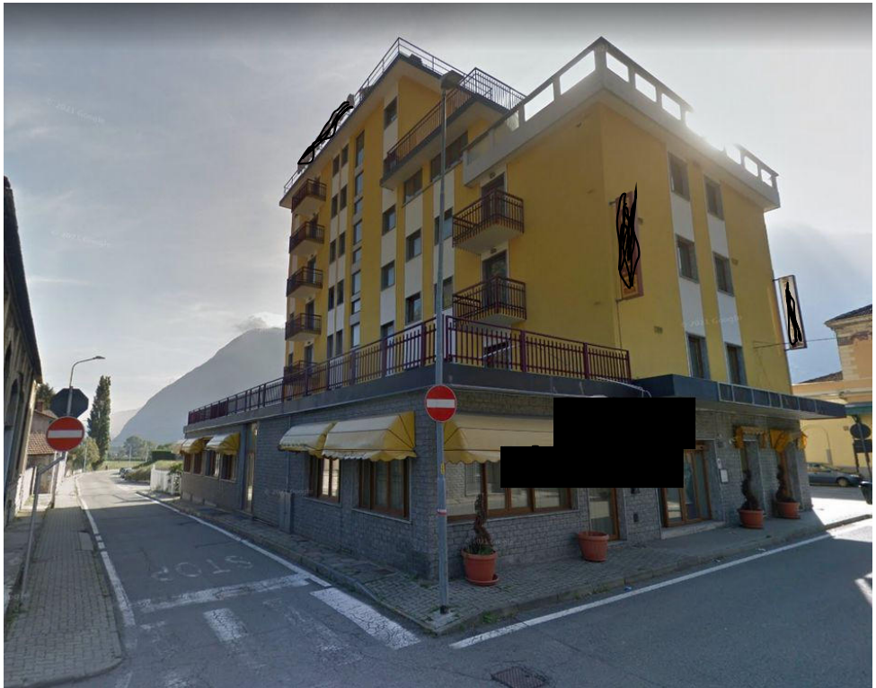
Illustrazione 4: Vista dei fronti nord-ovest del fabbricato in cui è ubicato il ristorante oggetto di esecuzione immobiliare.

ecoArchitettare studio associato di Architettura Bioclimatica dott. arch. Michele Ricupero | geom. Yvette Comé C.T.U. incaricato: arch. Michele Ricupero