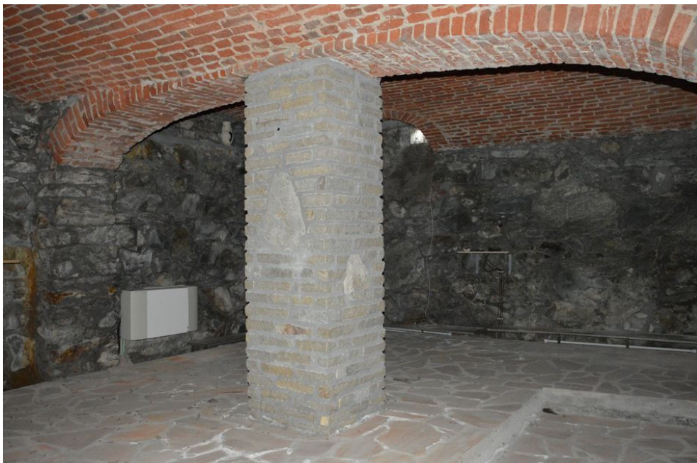
Illustrazione 18: Locale posto al piano seminterrato che all'interno della planimetria catastale è stato denominato "caveau". Si evidenzia la struttura in muratura portante in pietra con volte in laterizio apparentemente integre.