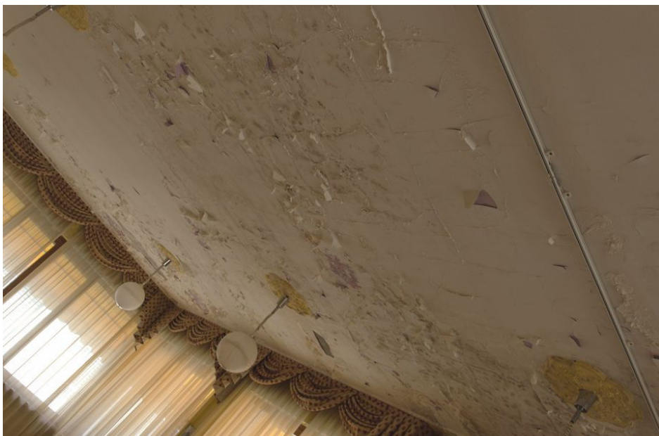
Illustrazione 8: Sala ristorante: particolare del livello di degrado riscontrato in relazione al solaio posto a copertura della sala. Emergono diffuse esfoliazioni e diffuse tracce di muffa che suggeriscono la presenza di infiltrazioni provenienti dall'estradosso.