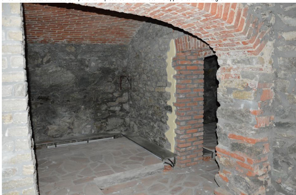
Illustrazione 19: Idem come da precedente illustrazione. Modifica del punto di presa.