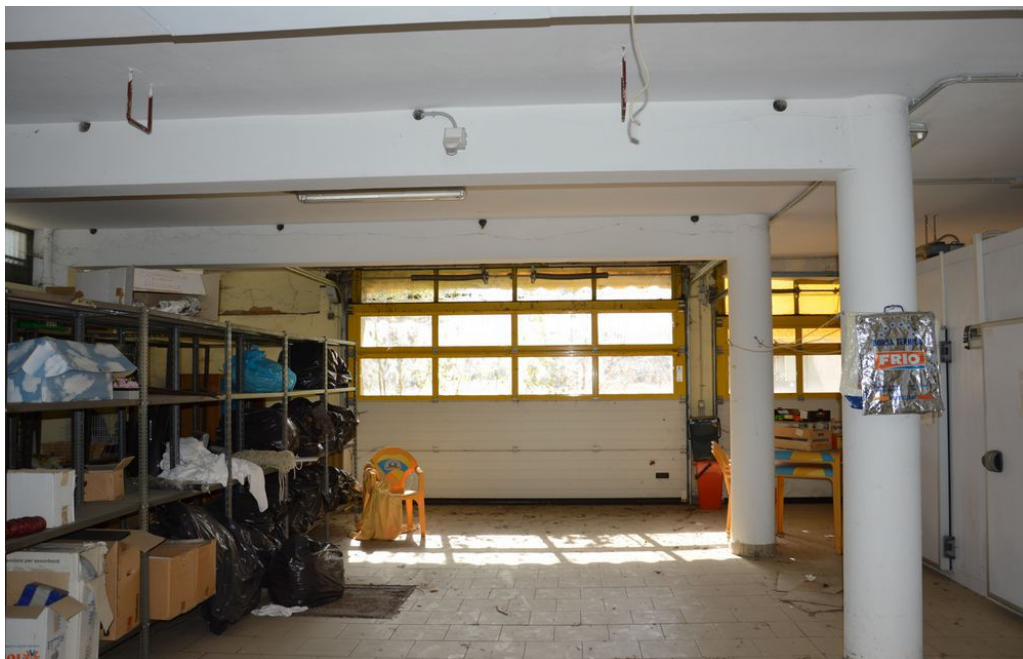
Illustrazione 16: Deposito posto al piano seminterrato in cui sono ubicate anche le celle frigo.