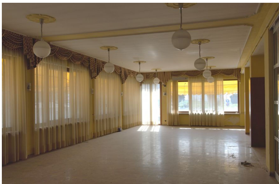
Illustrazione 6: Sala ristorante posta al piano terra.