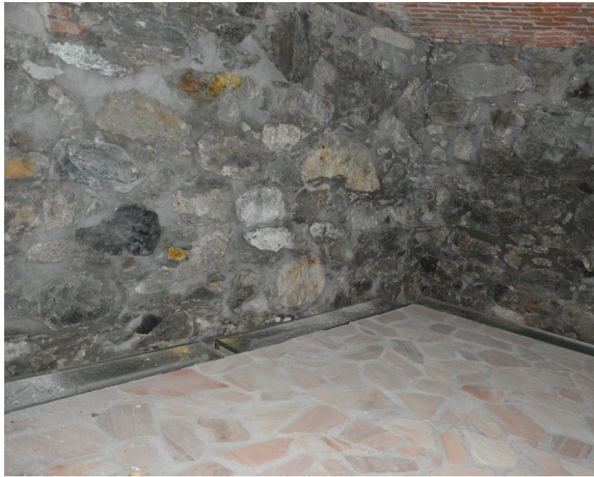
Illustrazione 21: Locale posto al piano seminterrato che sulla planimetria catastale viene denominato "caveau" del punto di presa.

ecoArchitettare studio associato di Architettura Bioclimatica dott. arch. Michele Ricupero | geom. Yvette Comé C.T.U. incaricato: arch. Michele Ricupero