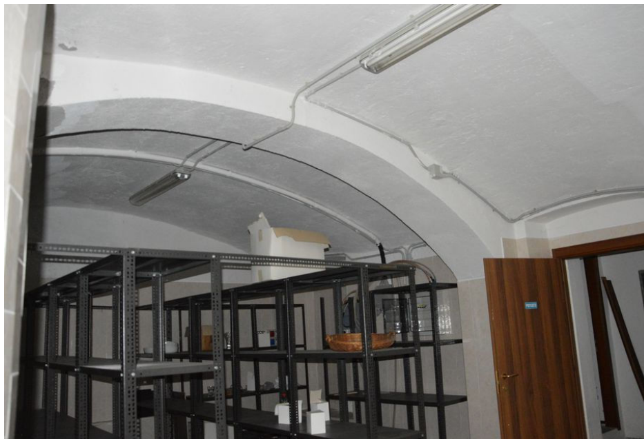
Illustrazione 14: Cantina formaggi posta al piano seminterrato.