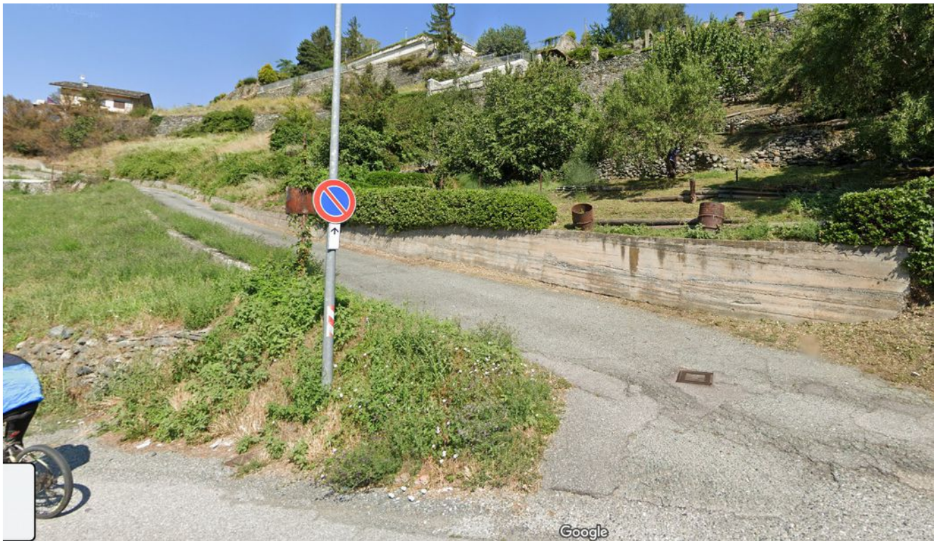
Illustrazione 2: Strada privata di accesso ai Lotti che insiste sui seguenti mappali oggetto di esecuzione: n. 363, 419, 420, 335 e 810.