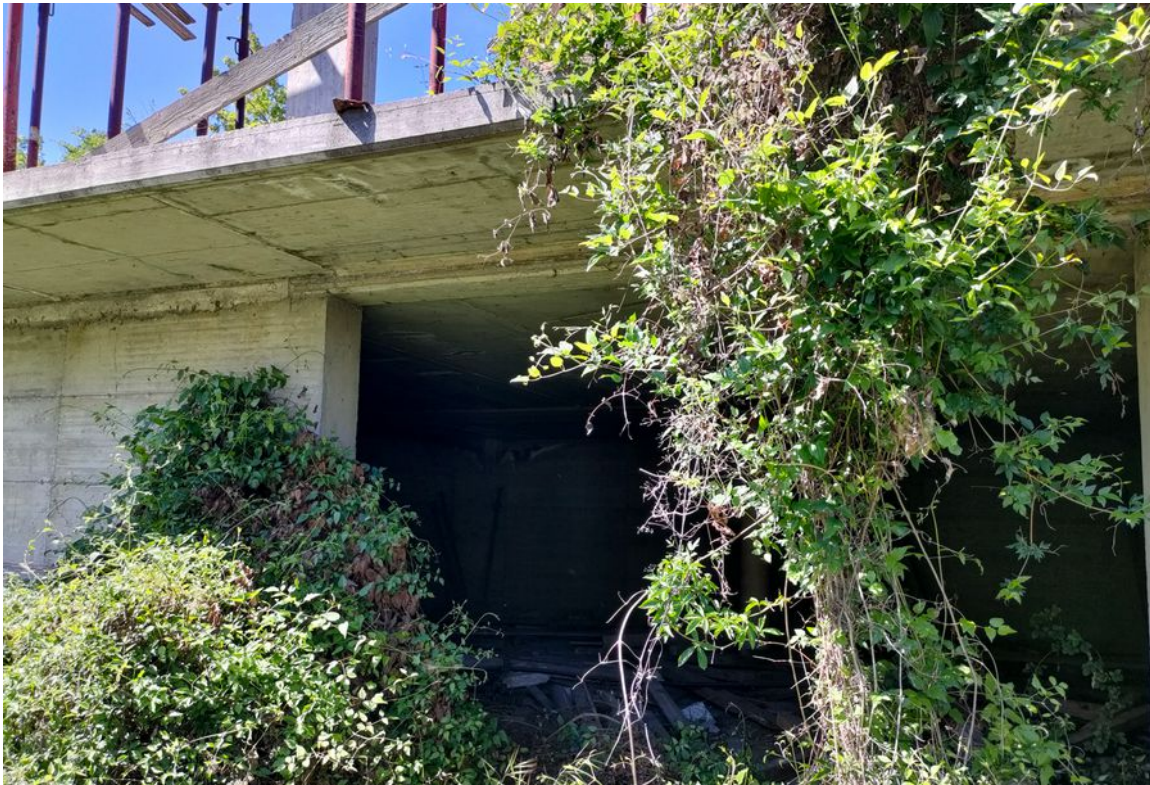
Illustrazione 10: Livello inferiore del fabbricato in corso di costruzione e mai ultimato.