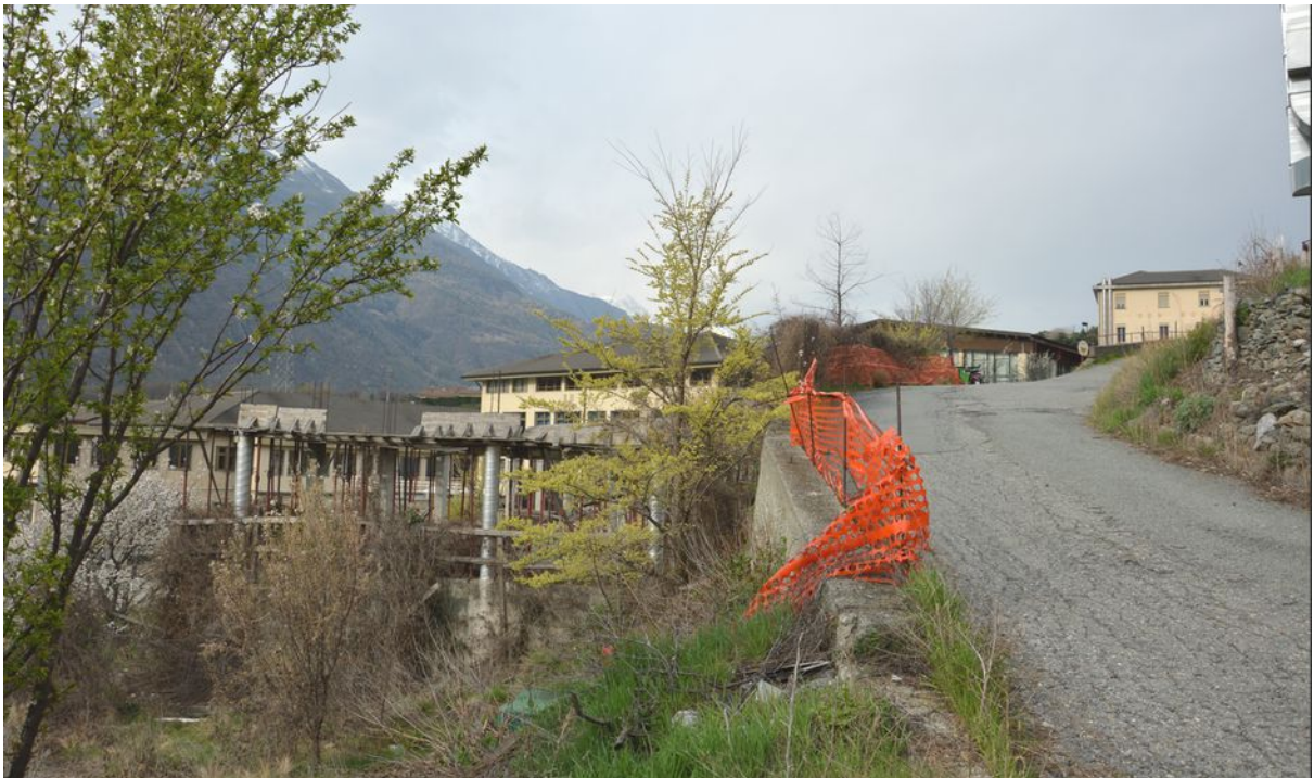
Illustrazione 5: Mappale n. 809 su cui insiste un fabbricato in corso di costruzione e mappale n. 810 occupato dalla strada privata.