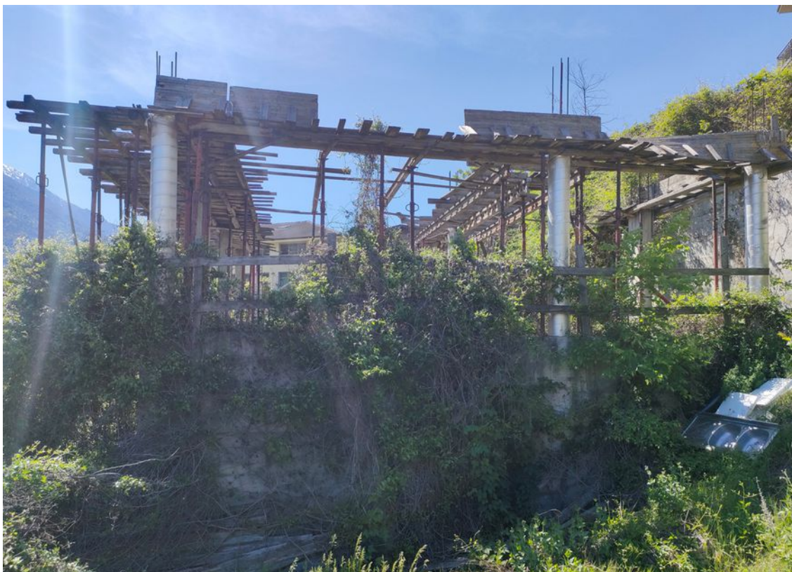
Illustrazione 8: Fabbricato mai ultimato sito sul mappale 809 autorizzato con concessione edilizia rilasciata dal Comune di Châtillon n. 48/2006 e concessione edilizia n. 17/2011 che prevedeva la realizzazione di un fabbricato a 3 piani con garages e posti auto interrati.