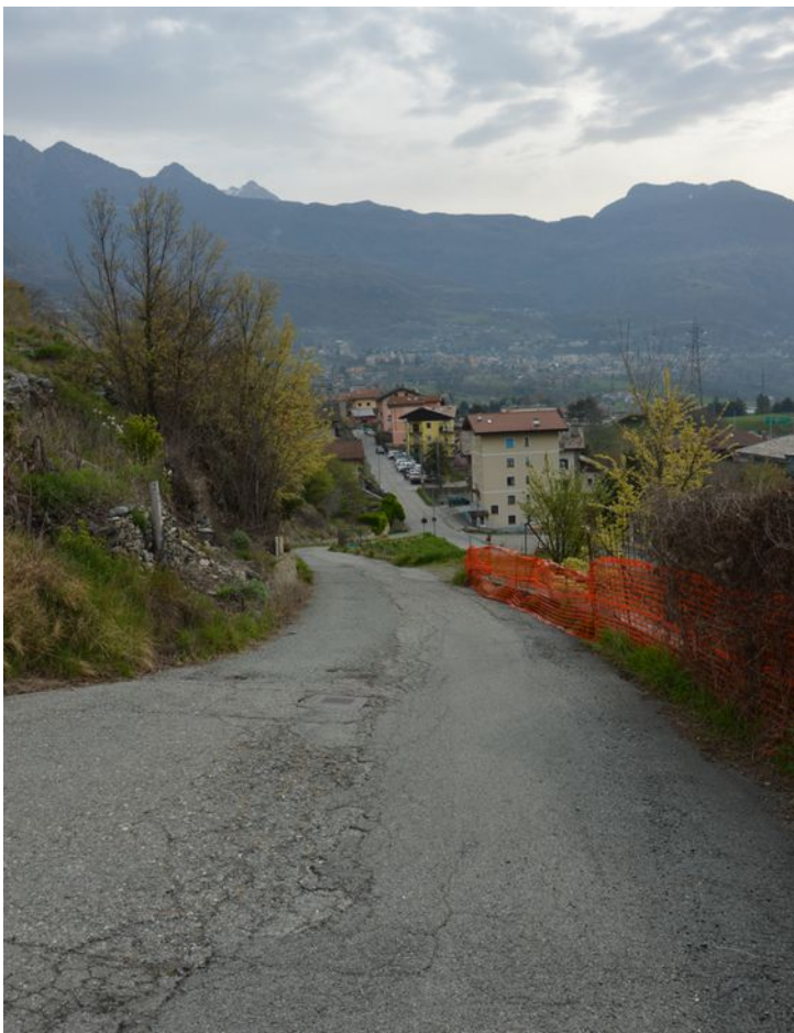
Illustrazione 6: Strada privata di accesso ai lotti che insiste sui seguenti mappali oggetto di esecuzione: n. 363, 419, 420, 335 e 810.