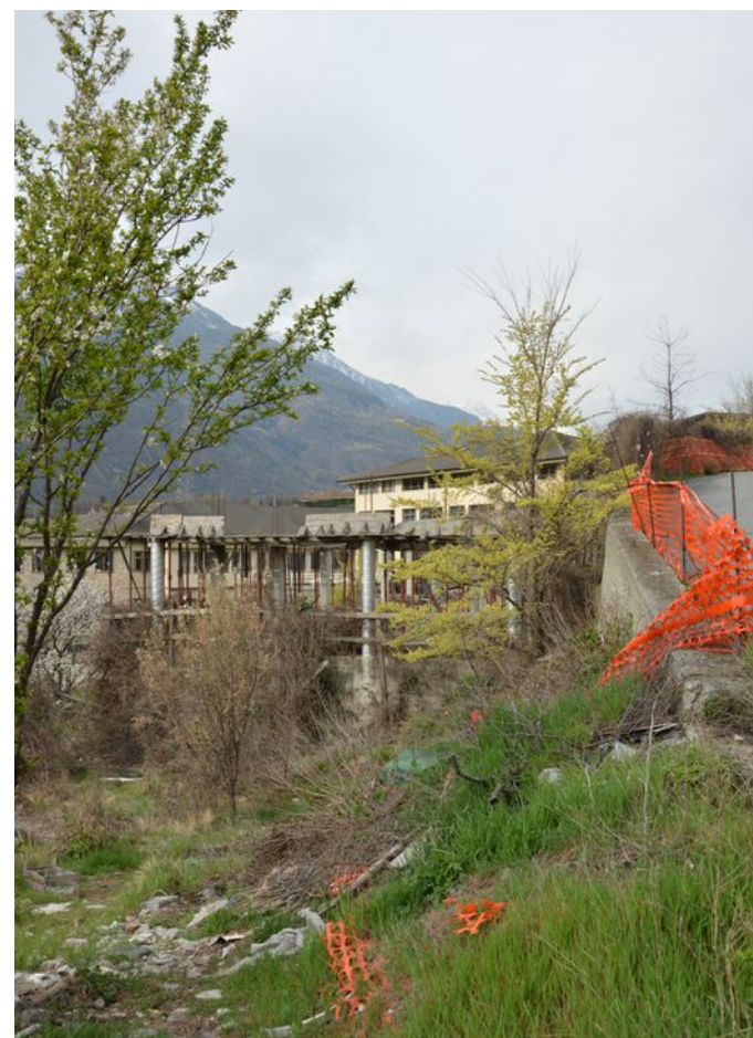
Illustrazione 7: Sulla particella n. 809 è presente un fabbricato in corso di costruzione. Il cantiere risulta abbandonato da tempo e la costruzione non è mai stata ultimata.

ecoArchitettare studio associato di Architettura Bioclimatica dott. arch. Michele Ricupero | geom. Yvette Comé C.T.U. incaricato: arch. Michele Ricupero