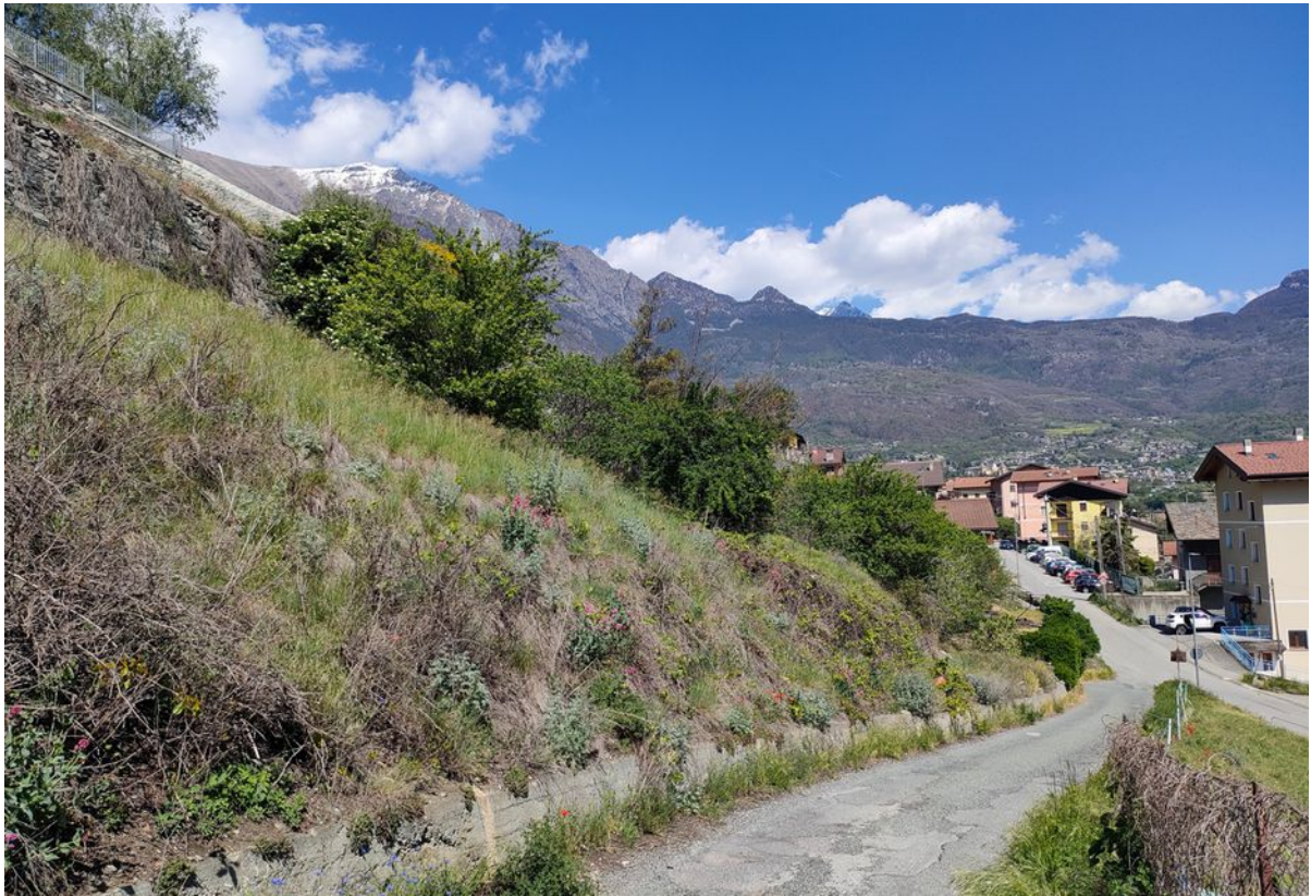
Illustrazione 4: Terreni su cui insiste la strada privata di accesso e posti a monte della stessa. Mappali n. 335-420-419-363.