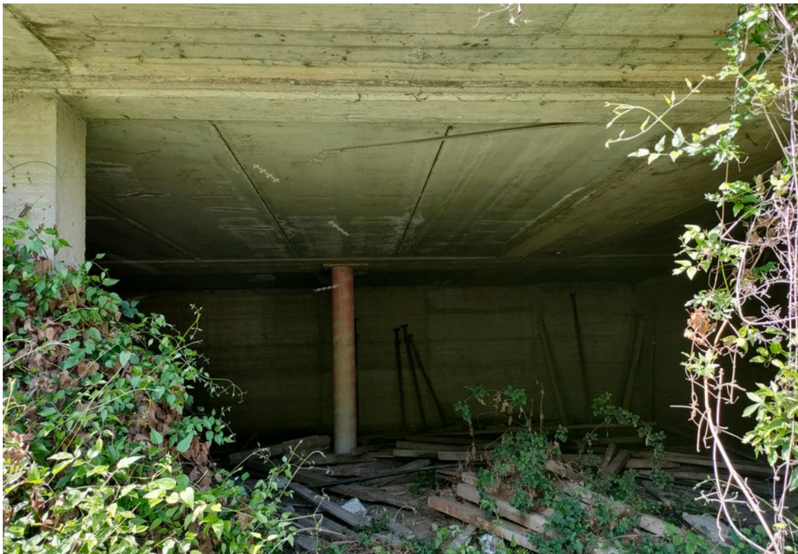
Illustrazione 11: Livello inferiore del fabbricato in corso di costruzione e mai ultimato.