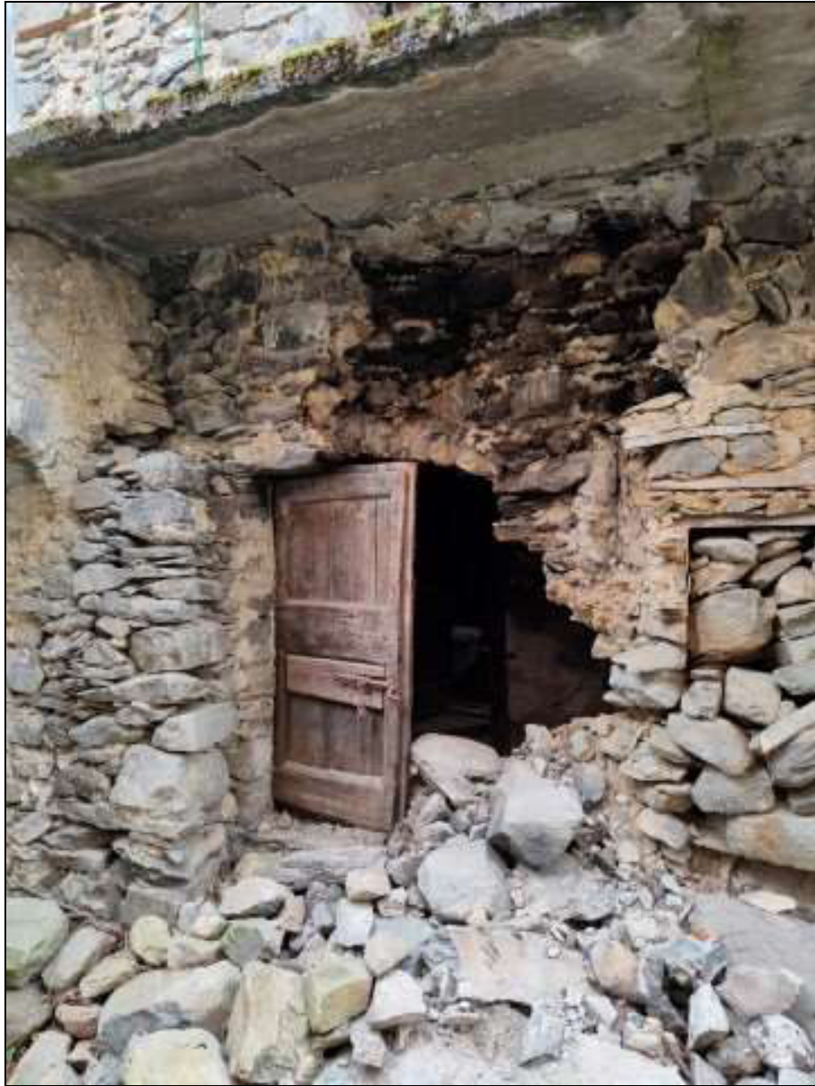
Foto n. 105 – Porta per l'accesso ai ripostigli al piano primo Foglio 50 mappale 353 sub. 4, ubicata sulla facciata nord del fabbricato