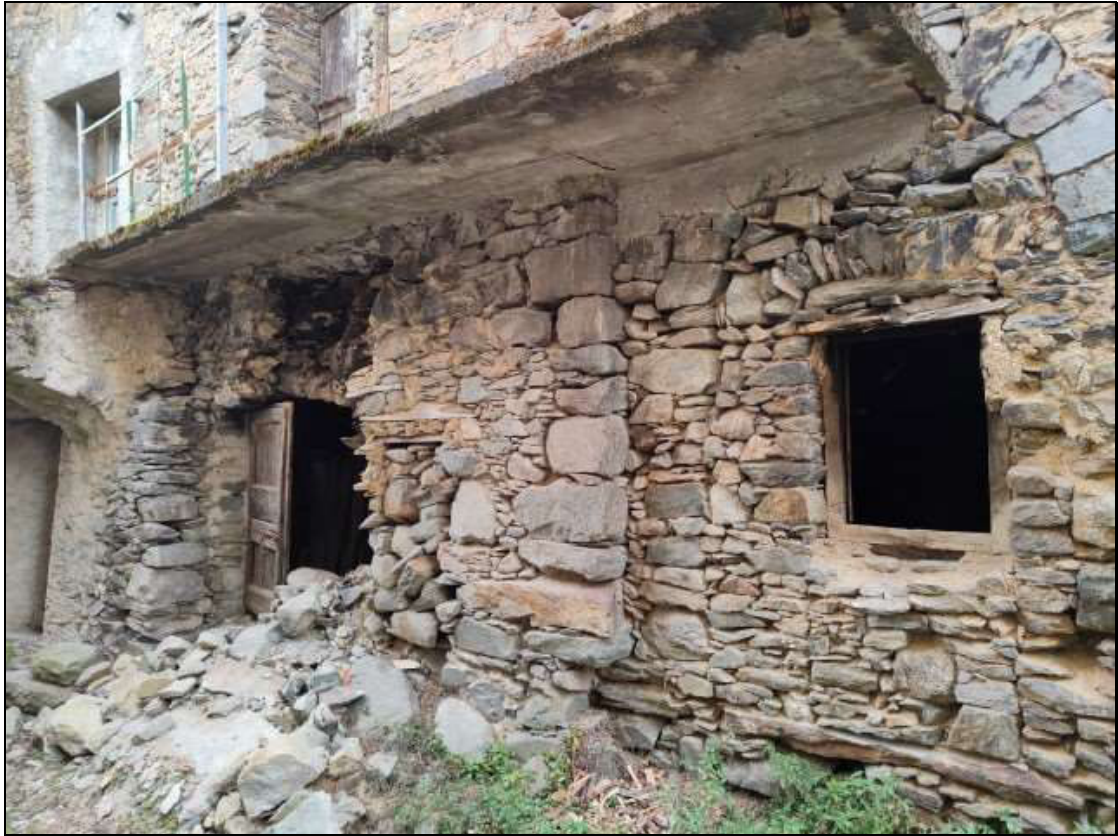
Foto n. 103 – Facciata nord (piano primo) del fabbricato Foglio 50 mappale 353, vista da nord-ovest