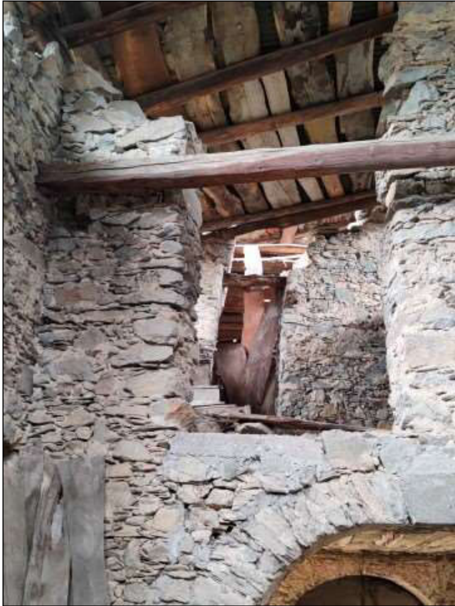
Foto n. 96 – Vista interna del ripostiglio al piano secondo Foglio 50 mappale 333 sub. 4