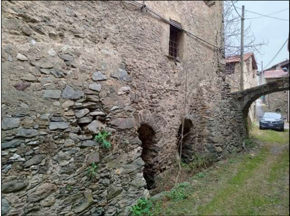
Foto n. 99 – Facciata sud (piani bassi) del fabbricato Foglio 50 mappale 337, vista da sud-ovest