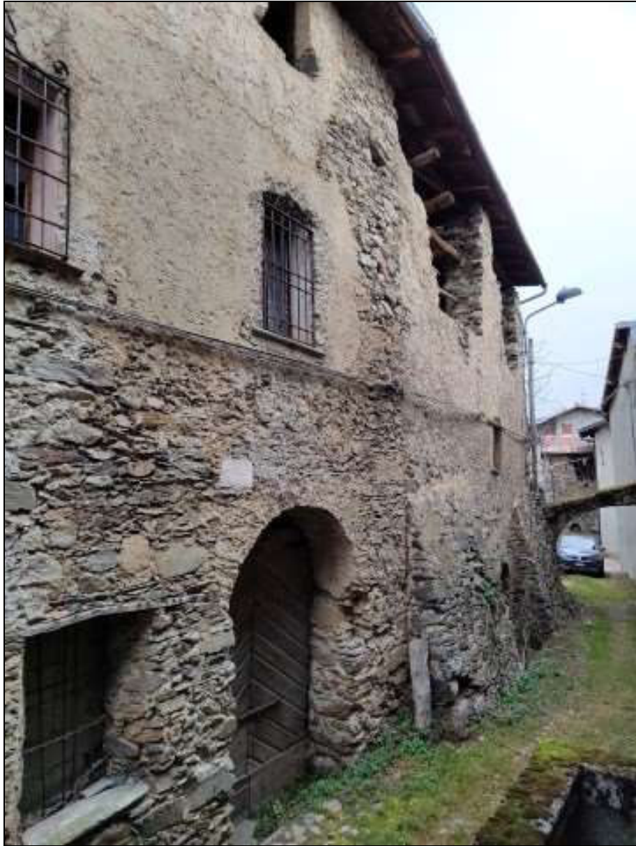
Foto n. 98 – Facciata sud del fabbricato Foglio 50 mappale 337, vista da sud-ovest