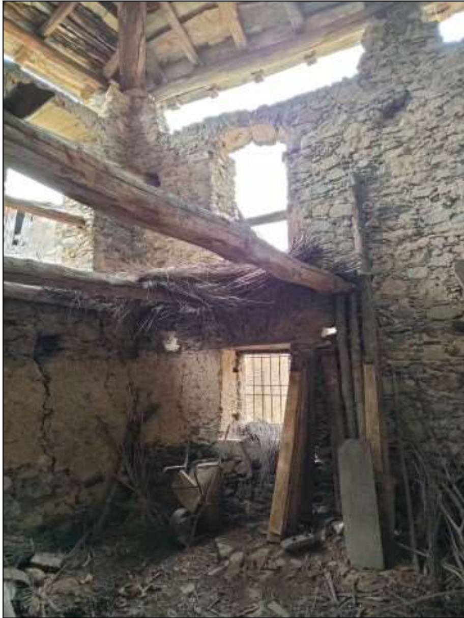
Foto n. 92 – Vista interna del ripostiglio al piano primo Foglio 50 mappale 333 sub. 4