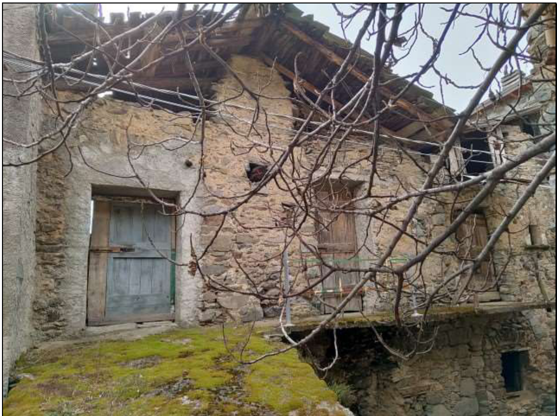
Foto n. 104 – Facciata nord (piano secondo) del fabbricato Foglio 50 mappale 353, vista da nord-est