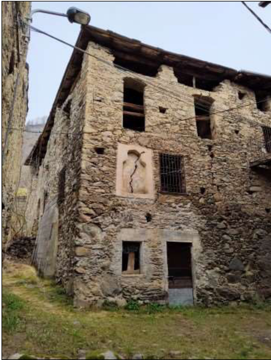
Foto n. 87 – Fabbricato Foglio 50 mappale 333, visto da sud-ovest