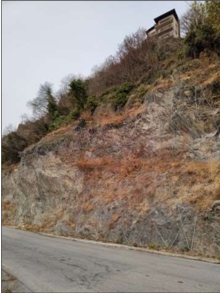
Foto n. 111 – Terreni Foglio 50 mappali 878-879, visti da sud-est