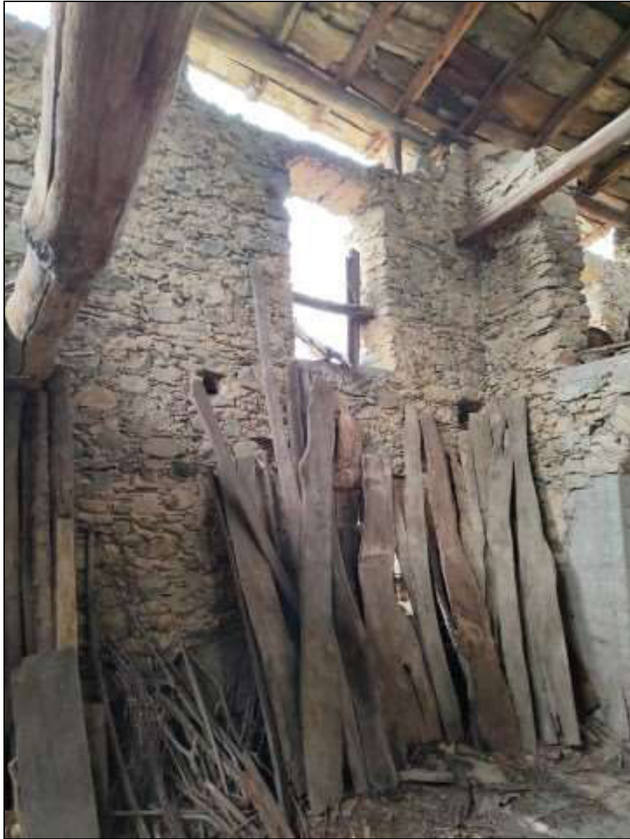
Foto n. 94 – Vista interna del ripostiglio al piano primo Foglio 50 mappale 333 sub. 4