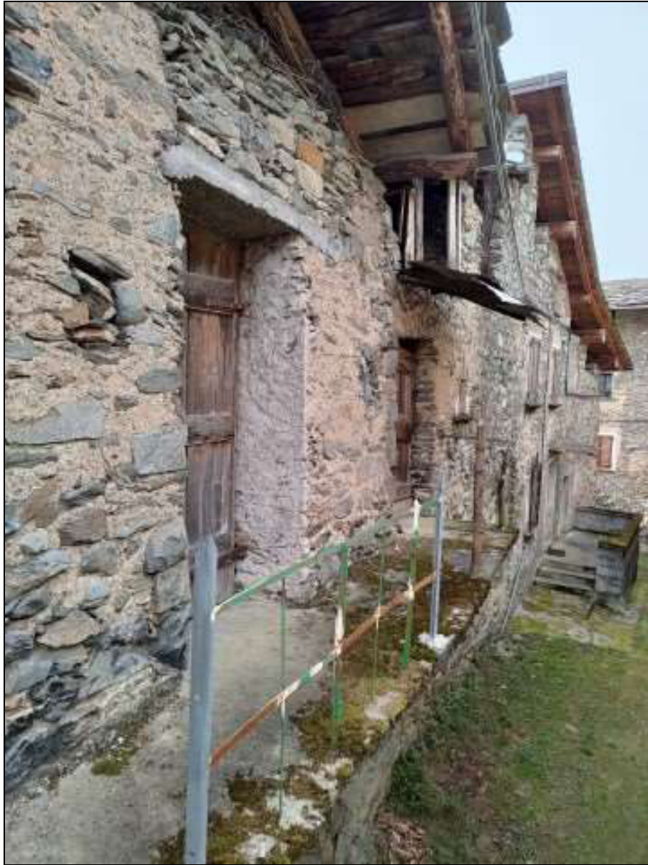
Foto n. 106 – Porta per l'accesso al ripostiglio al piano secondo Foglio 50 mappale 353 sub. 4, ubicata sulla facciata nord del fabbricato