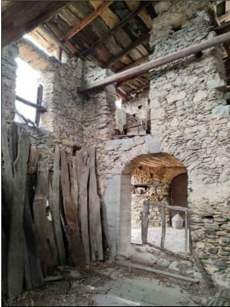
Foto n. 95 – Vista interna del ripostiglio al piano primo Foglio 50 mappale 333 sub. 4