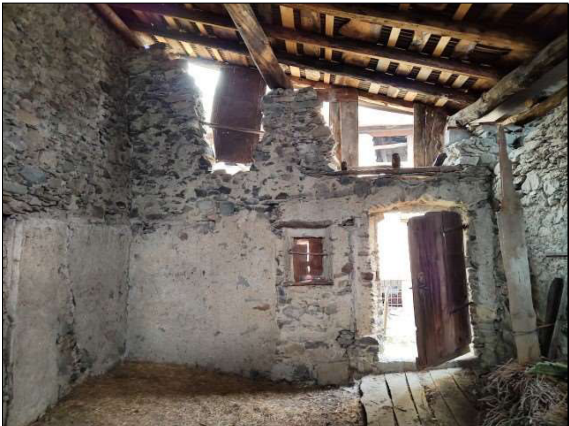
Foto n. 108 – Vista interna del ripostiglio al piano secondo Foglio 50 mappale 353 sub. 4