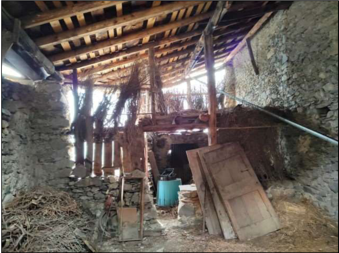
Foto n. 107 – Vista interna del ripostiglio al piano secondo Foglio 50 mappale 353 sub. 4