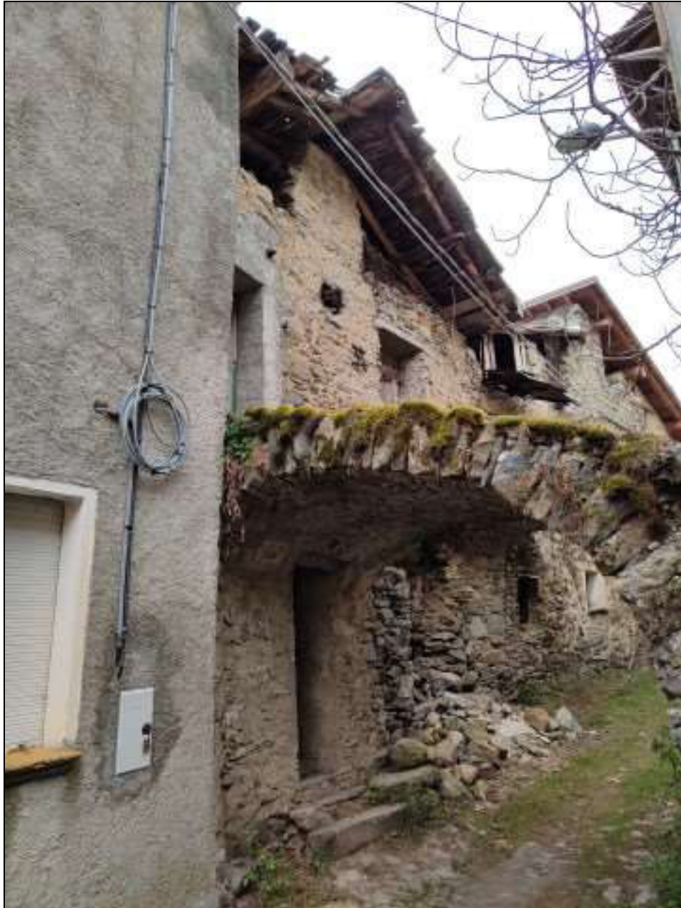
Foto n. 101 – Facciata nord del fabbricato Foglio 50 mappale 353, vista da nord-est