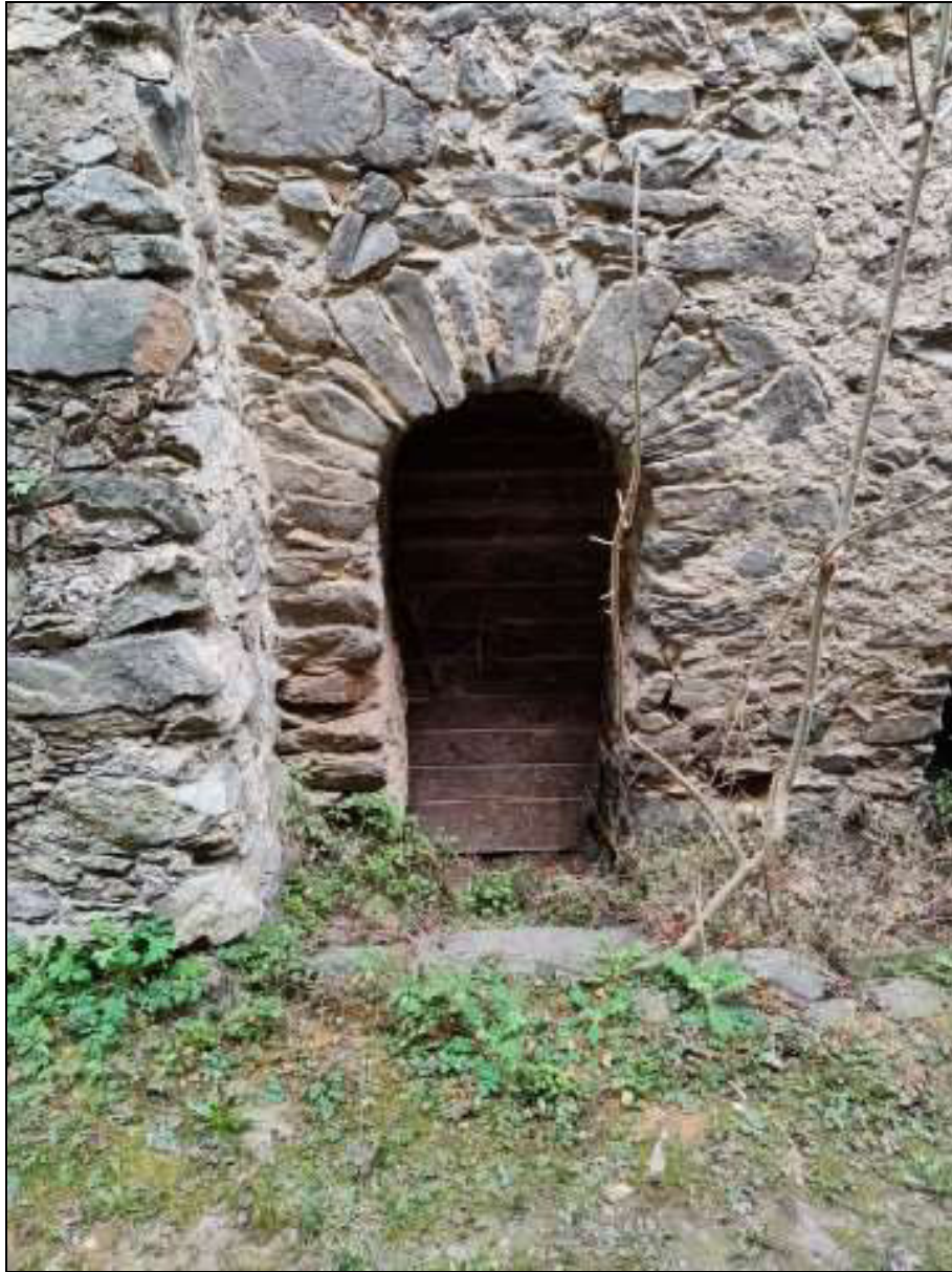
Foto n. 100 – Porta per l'accesso al ripostiglio al piano terra Foglio 50 mappale 337 sub. 2, ubicata sulla facciata sud del fabbricato