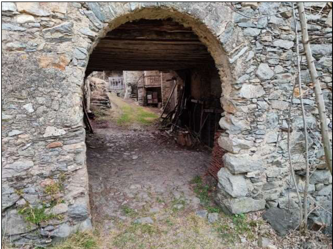
Foto n. 89 – Accesso all'andito coperto comune (B.C.N.C.) Foglio 50 mappale 333 sub. 8, visto da ovest