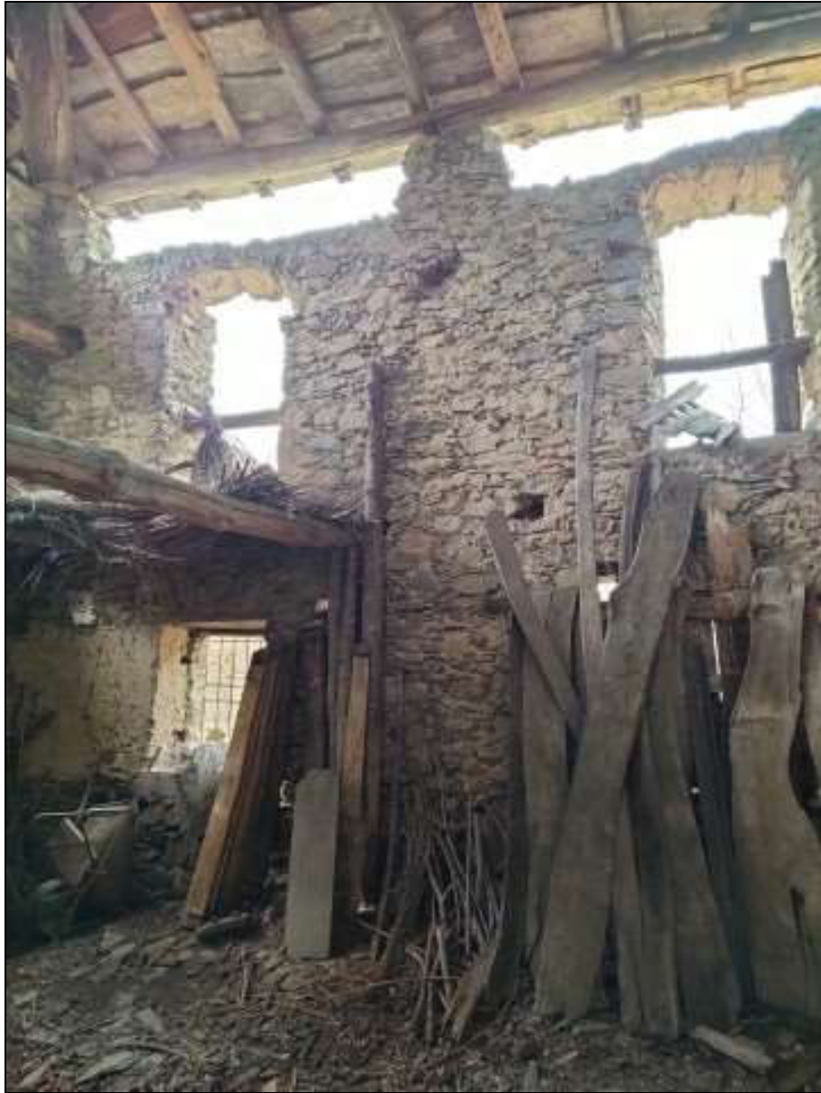
Foto n. 93 – Vista interna del ripostiglio al piano primo Foglio 50 mappale 333 sub. 4