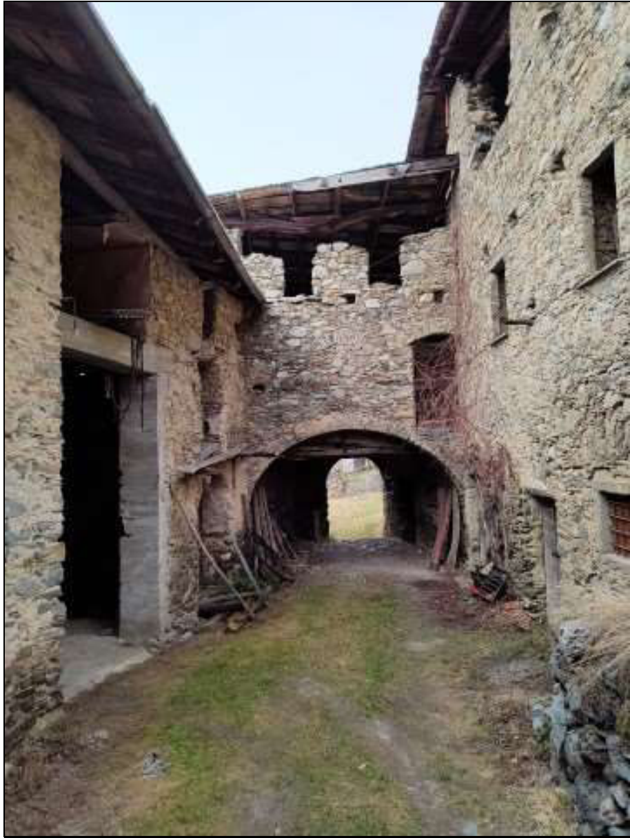
Foto n. 90 – Accesso all'andito coperto comune (B.C.N.C.) Foglio 50 mappale 333 sub. 8, visto da est