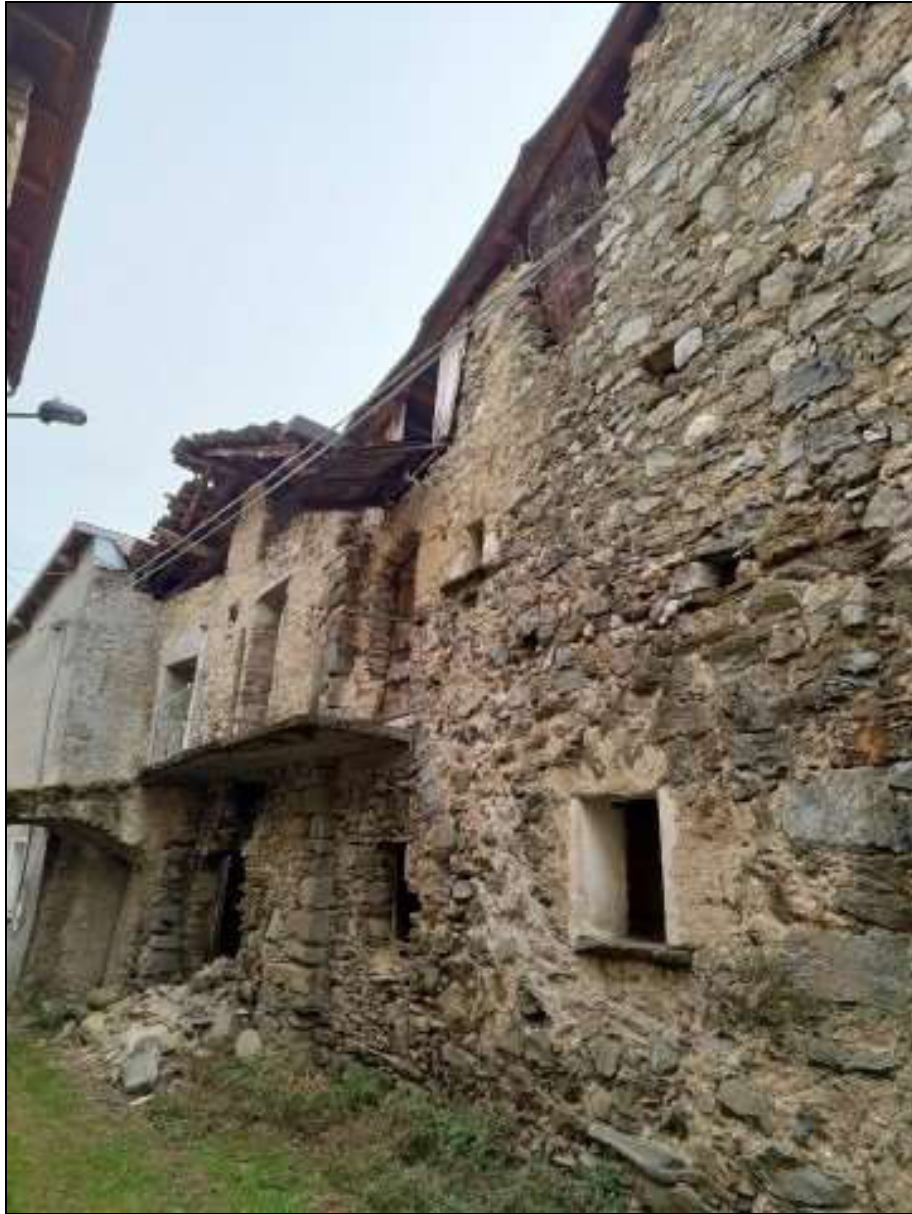
Foto n. 102 – Facciata nord del fabbricato Foglio 50 mappale 353, vista da nord-ovest