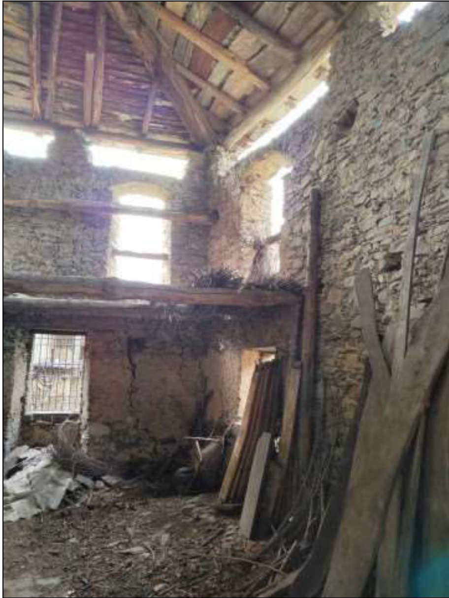
Foto n. 91 – Vista interna del ripostiglio al piano primo Foglio 50 mappale 333 sub. 4