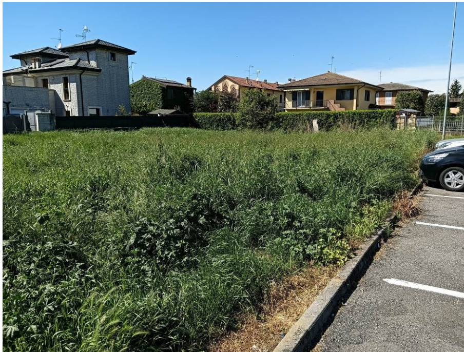
Vista dal parcheggio