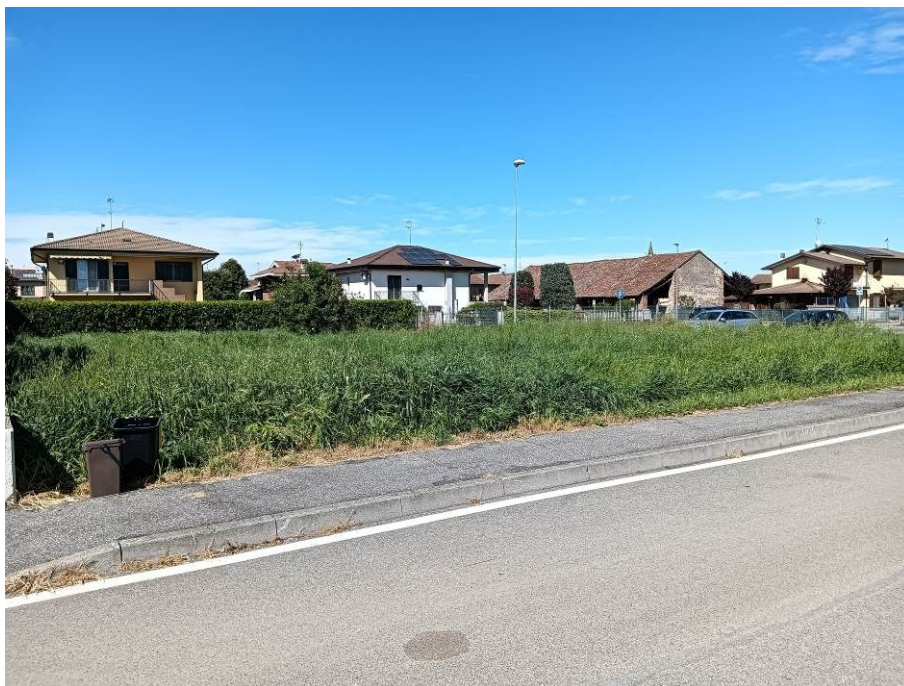
Vista da confinante lotto di sinistra