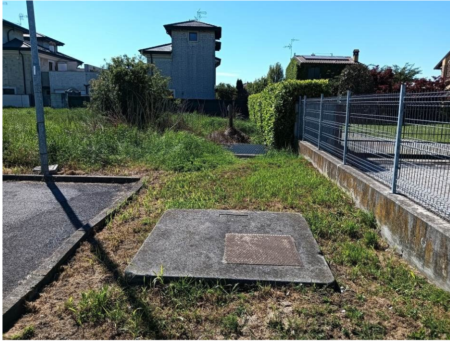
Vista laterale parcheggio in corrispondenza del mappale 497 (roggia tombinata)