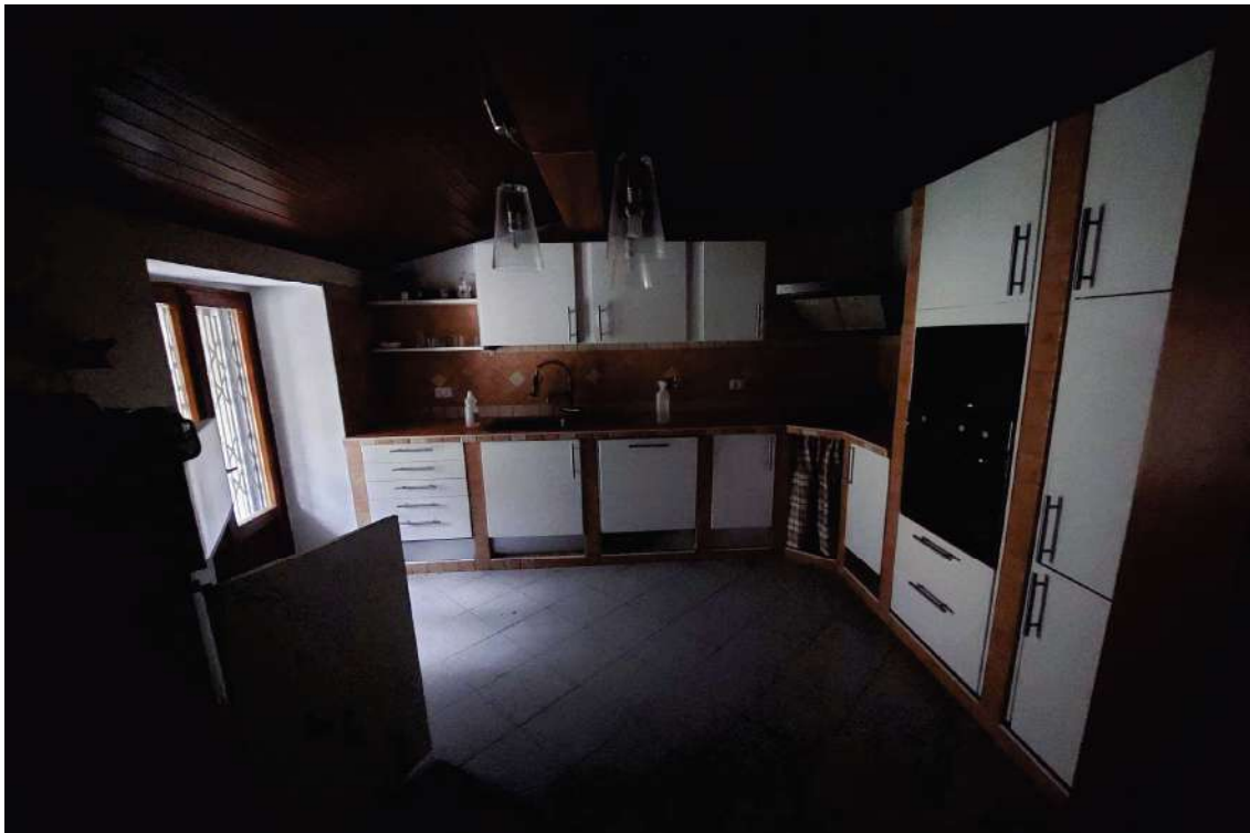
FOTO N. 8 - CUCINA