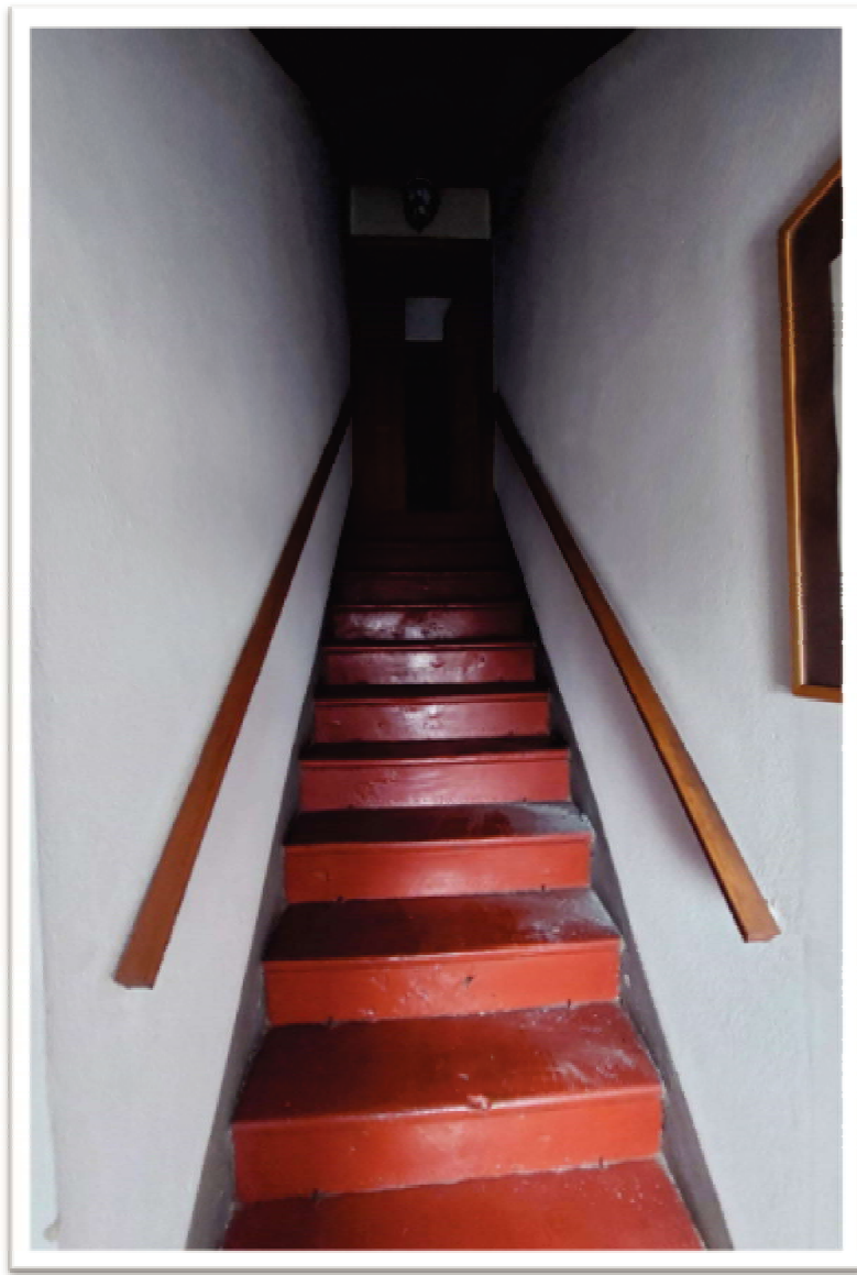
FOTO N. 4 - VANO SCALA DI ACCESSO AL PIANO SECONDO