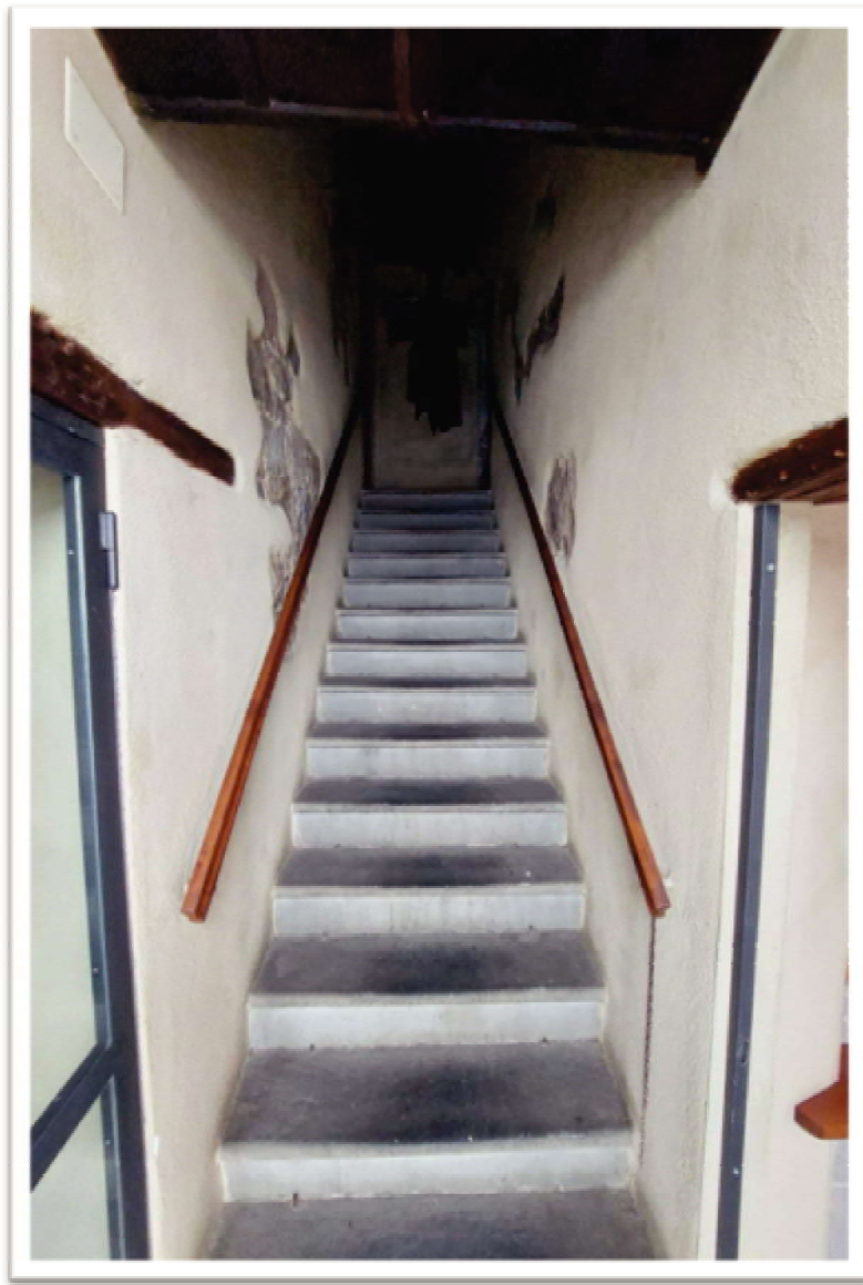
FOTO N. 3 - VANO SCALA A COMUNE