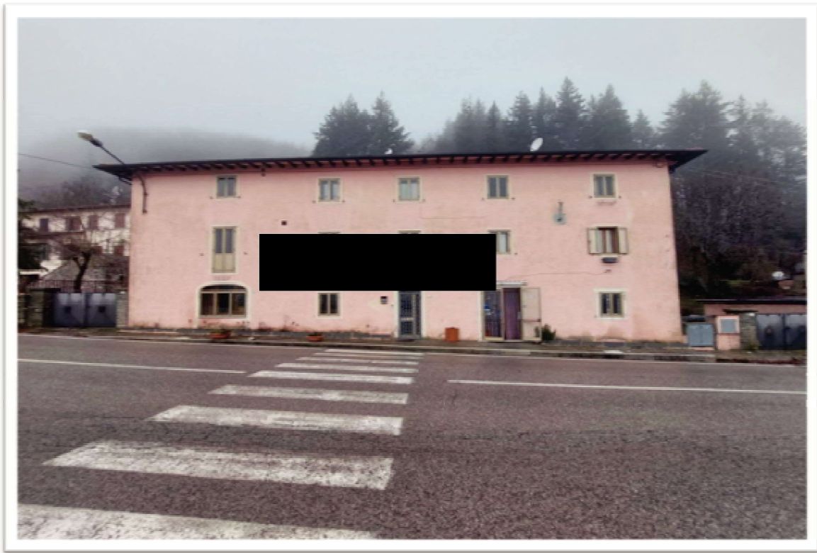
FOTO N. 1 - FACCIATA PRINCIPALE DELL'EDIFICIO