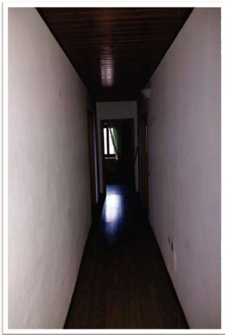
FOTO N. 5 - Disimpegno