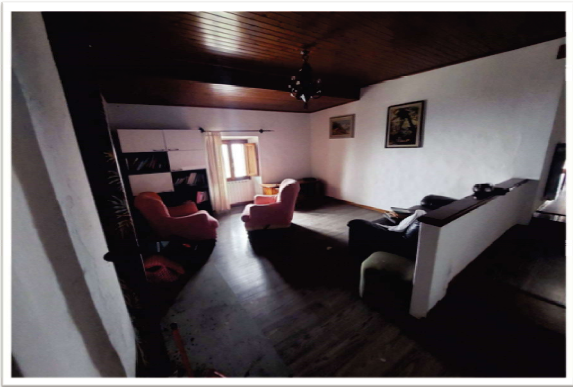
FOTO N. 7 - SOGGIORNO