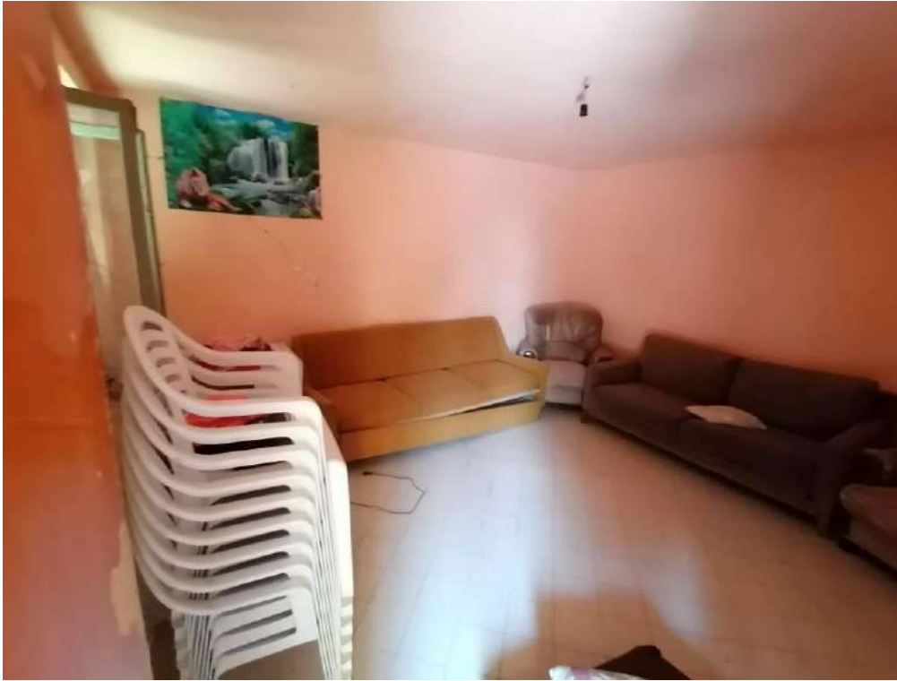
FOTO 37 (Fabbricato Fg. 91, Part. 80, Sub. 2 – soggiorno al piano terra)