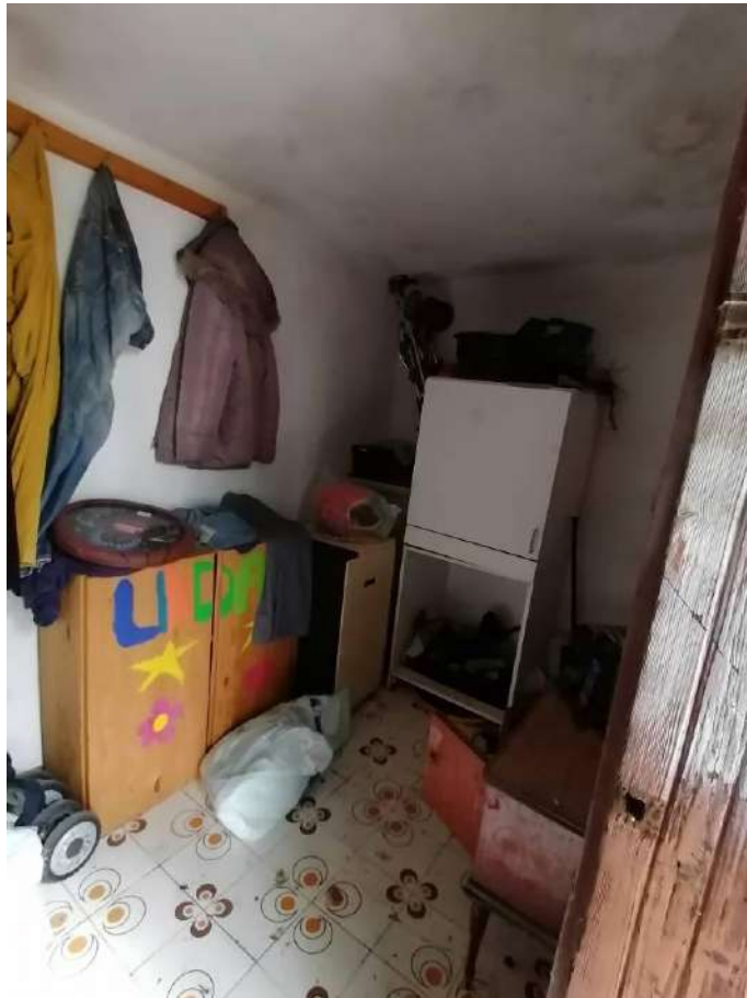
FOTO 34 (Fabbricato Fg. 91, Part. 80, Sub. 2 – locale ripostiglio al piano terra)