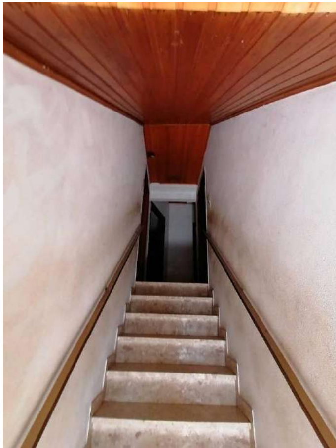
FOTO 36 (Fabbricato Fg. 91, Part. 80, Sub. 2 – scala interna di accesso al piano primo)