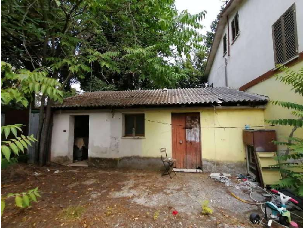
FOTO 33 (Fabbricato Fg. 91, Part. 80, Sub. 2 – vista ovest porzione sud)