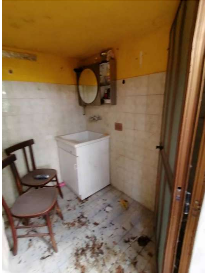
FOTO 35 (Fabbricato Fg. 91, Part. 80, Sub. 2 – bagno al piano terra)