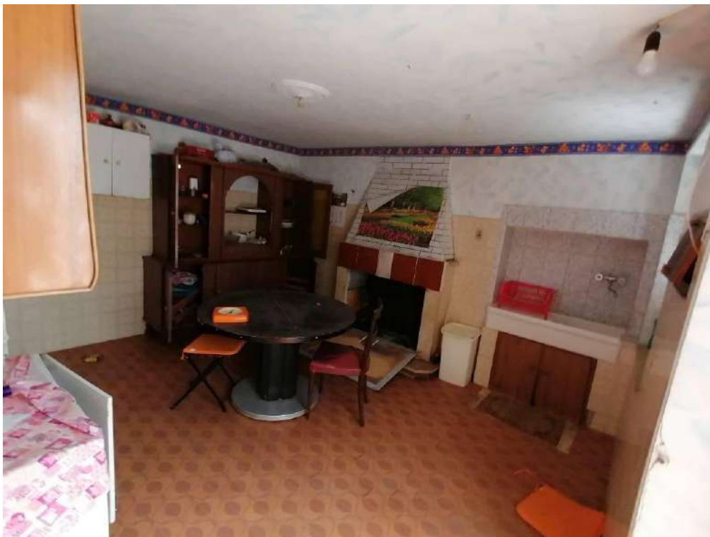
FOTO 38 (Fabbricato Fg. 91, Part. 80, Sub. 2 – cucina al piano terra)