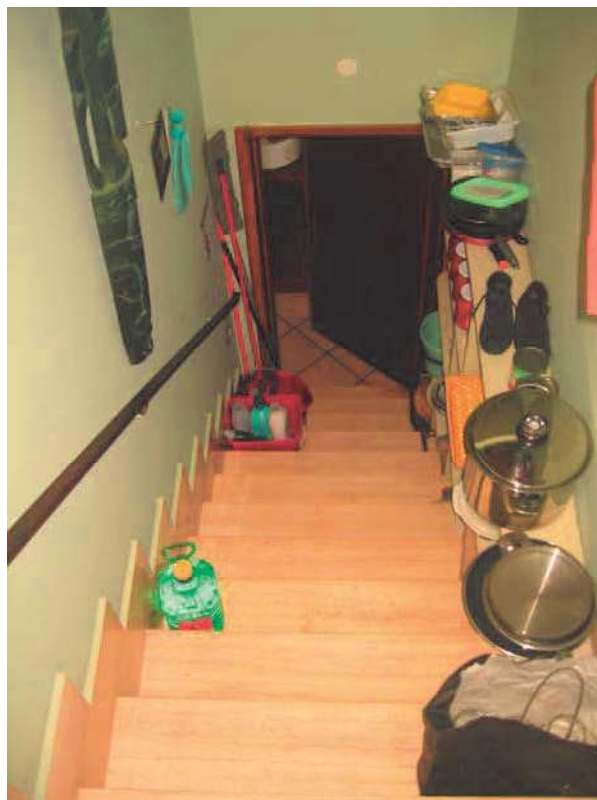
VANO SCALA INTERNO DI ACCESSO AL PIANO DELLE COPERTURE