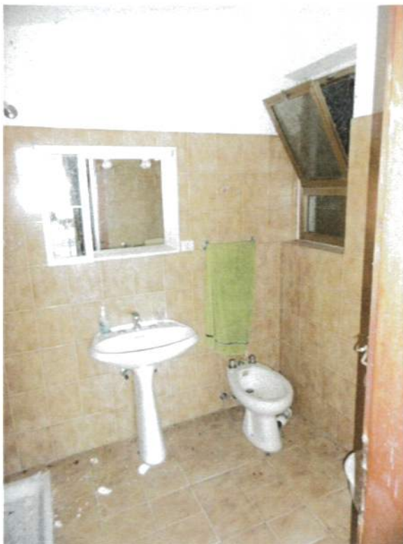
Interno – Servizio