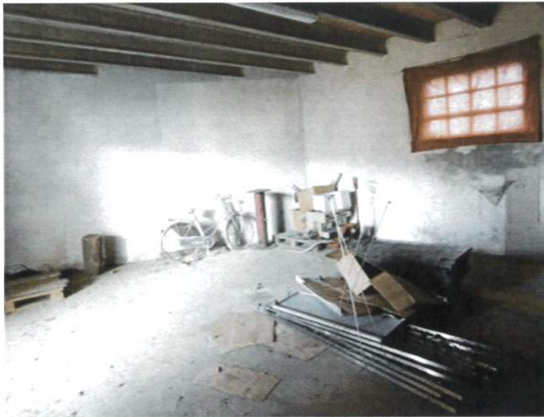
Interno – Edificio Agricolo Rimessa P.T.