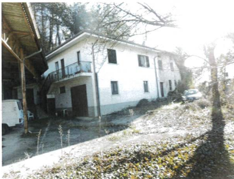
Compendio - Corte