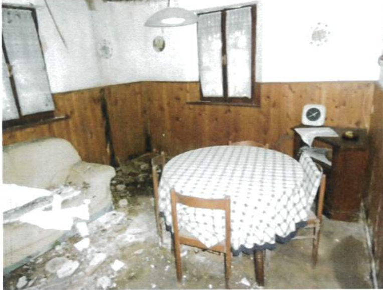
Interno – Abitazione P.T.