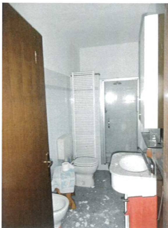
Interno – Abitazione 1°P