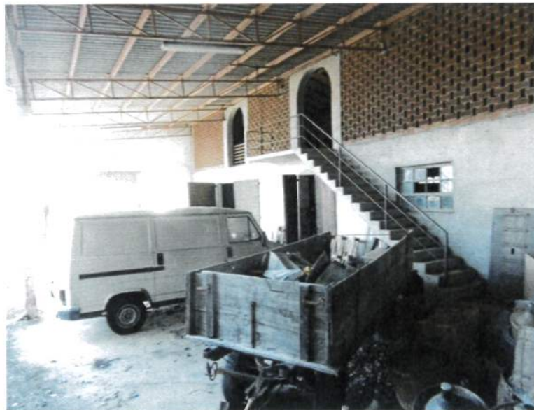
Edificio Agricolo Scala accesso 1°P