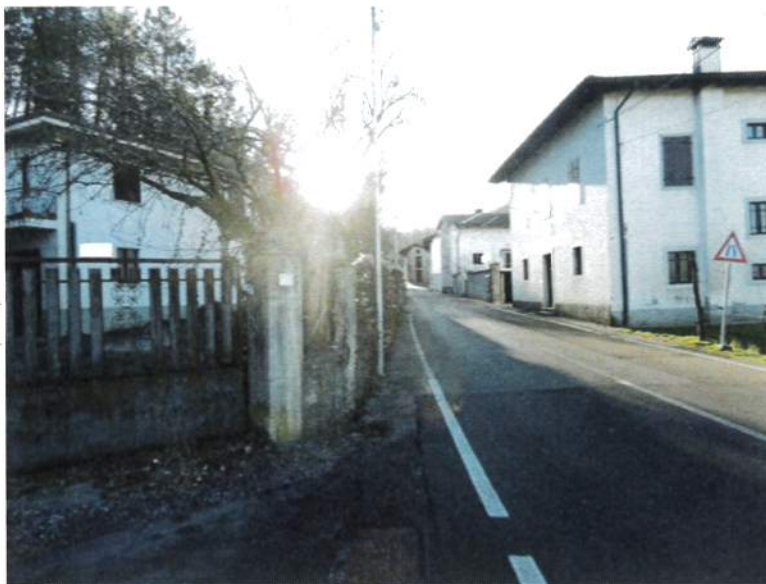
Contesto di zona