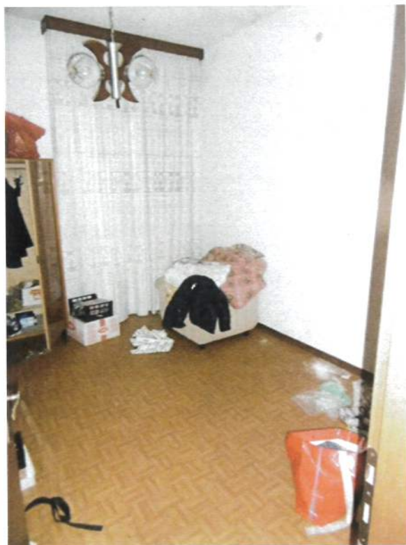
Interno – Abitazione 1°P