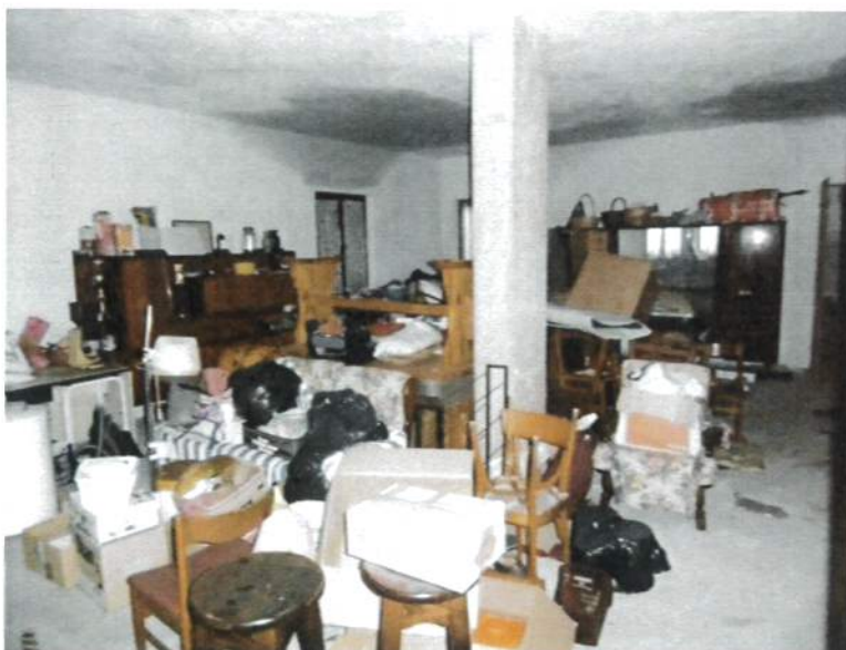
Interno – Edificio Abitazione Magazzino 1° P