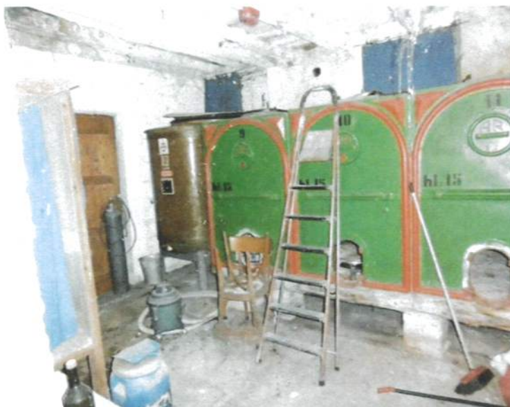
Interno – Edificio Abitazione Magazzino P.T.