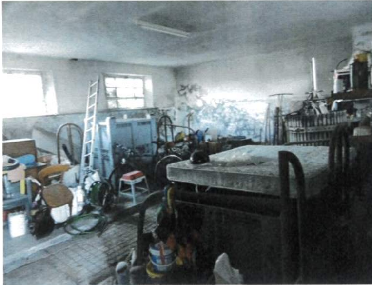
Interno – Edificio Agricolo Deposito P.T.