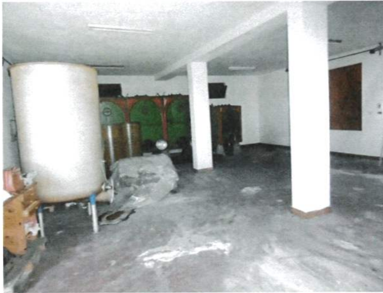
Interno – Edificio Abitazione Magazzino P.T. (vinificazione)