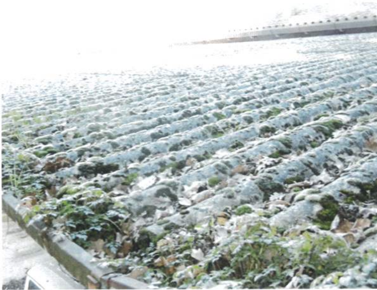
Particolare copertura "eternit"