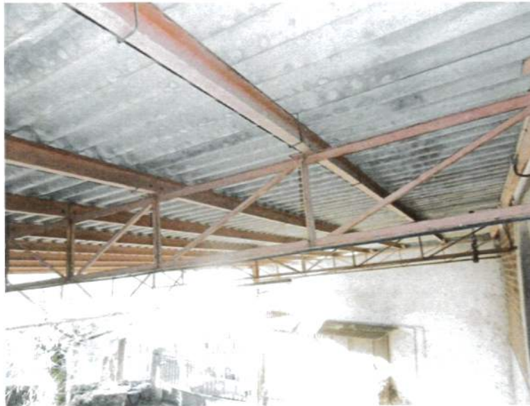
Particolare Tettoia copertura "eternit"