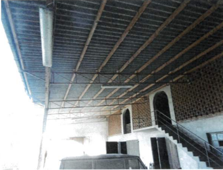
Particolare Tettoia copertura "eternit"