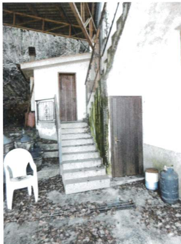
Edificio Abitazione – Scala – Servizio