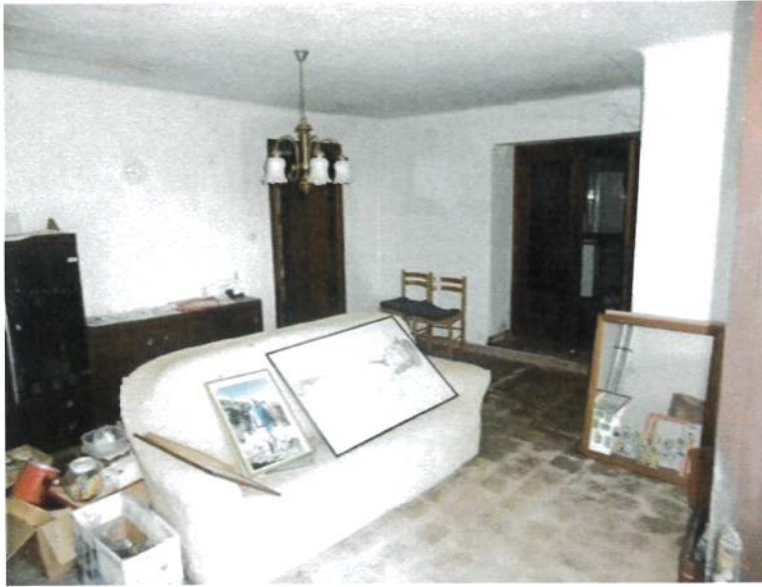
Interno – Abitazione P.T.