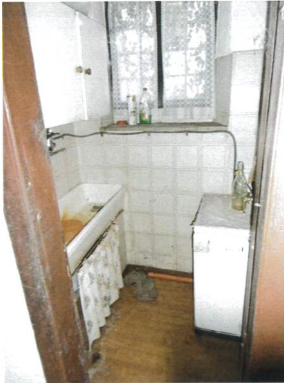
Interno – Abitazione P.T.