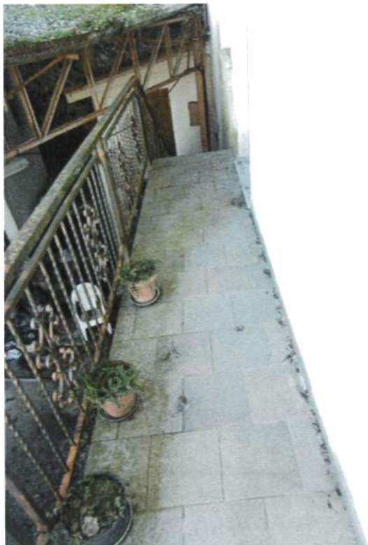
Esterno – Terrazza Abitazione