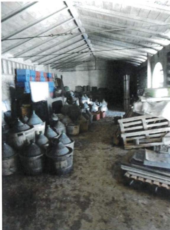
Interno – Edificio agricolo Deposito 1° P