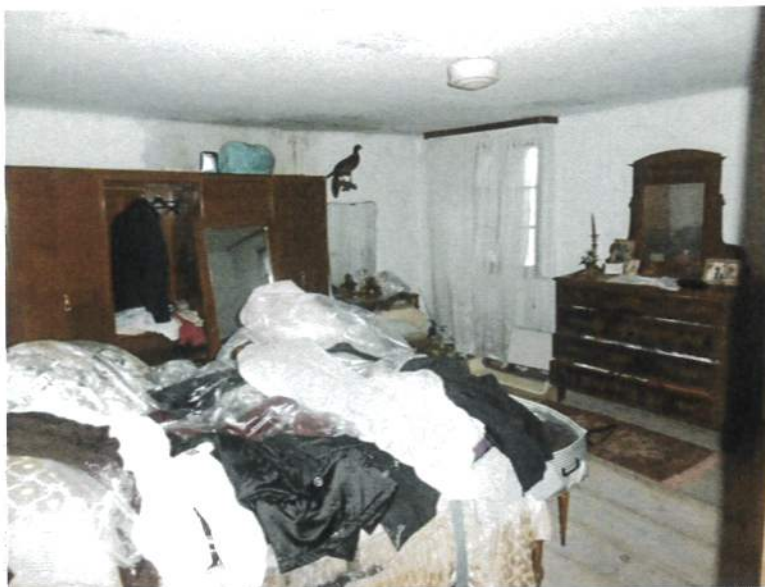
Interno – Abitazione 1°P