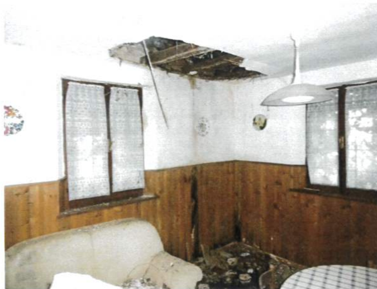
Interno – Abitazione P.T.