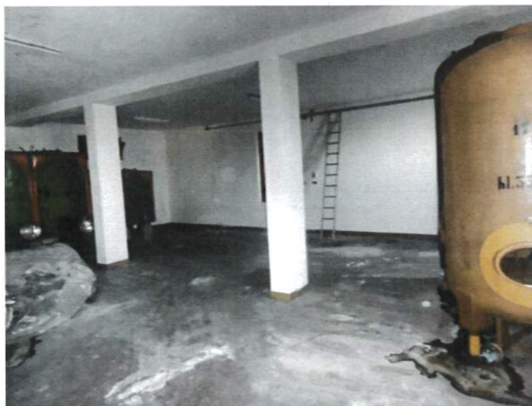
Interno – Edificio Abitazione Magazzino P.T. (vinificazione)