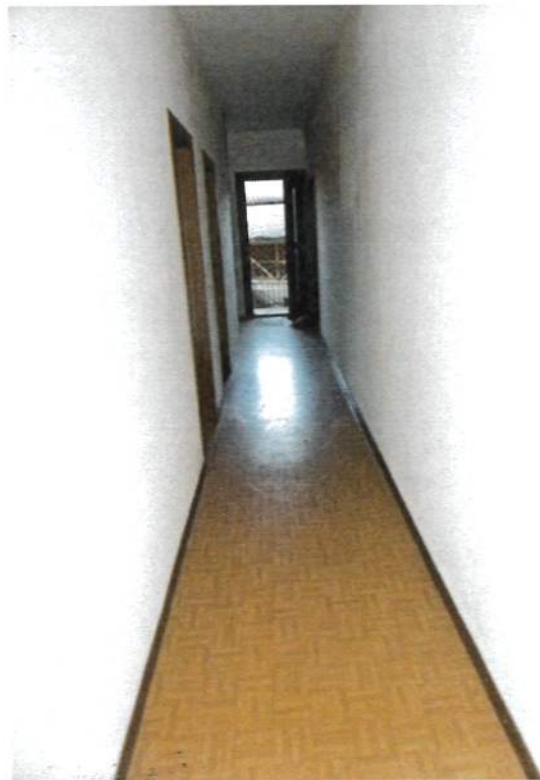
Interno – Abitazione 1°P