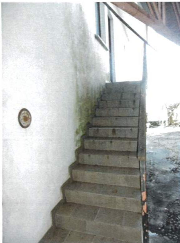
Edificio Abitazione - Scala