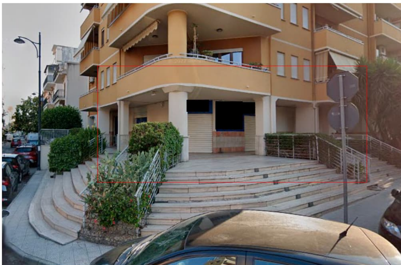
Foto ingresso negozio

La documentazione fotografica completa dell'unità immobiliare è riportata all'interno dell' Allegato 2.c .