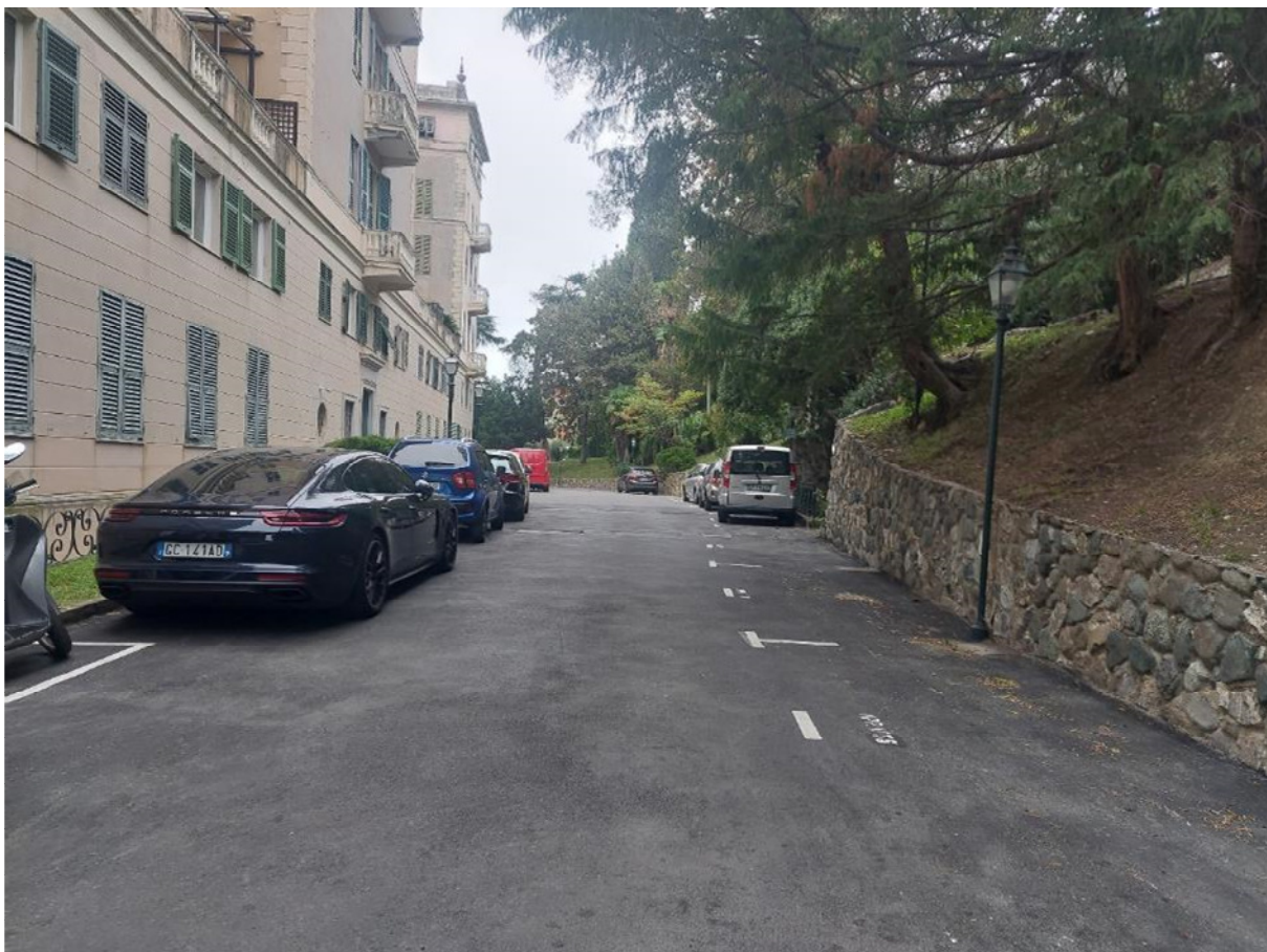
FOTO 13: viale carrabile di accesso all'ingresso principale posto sul prospetto posteriore (nord)