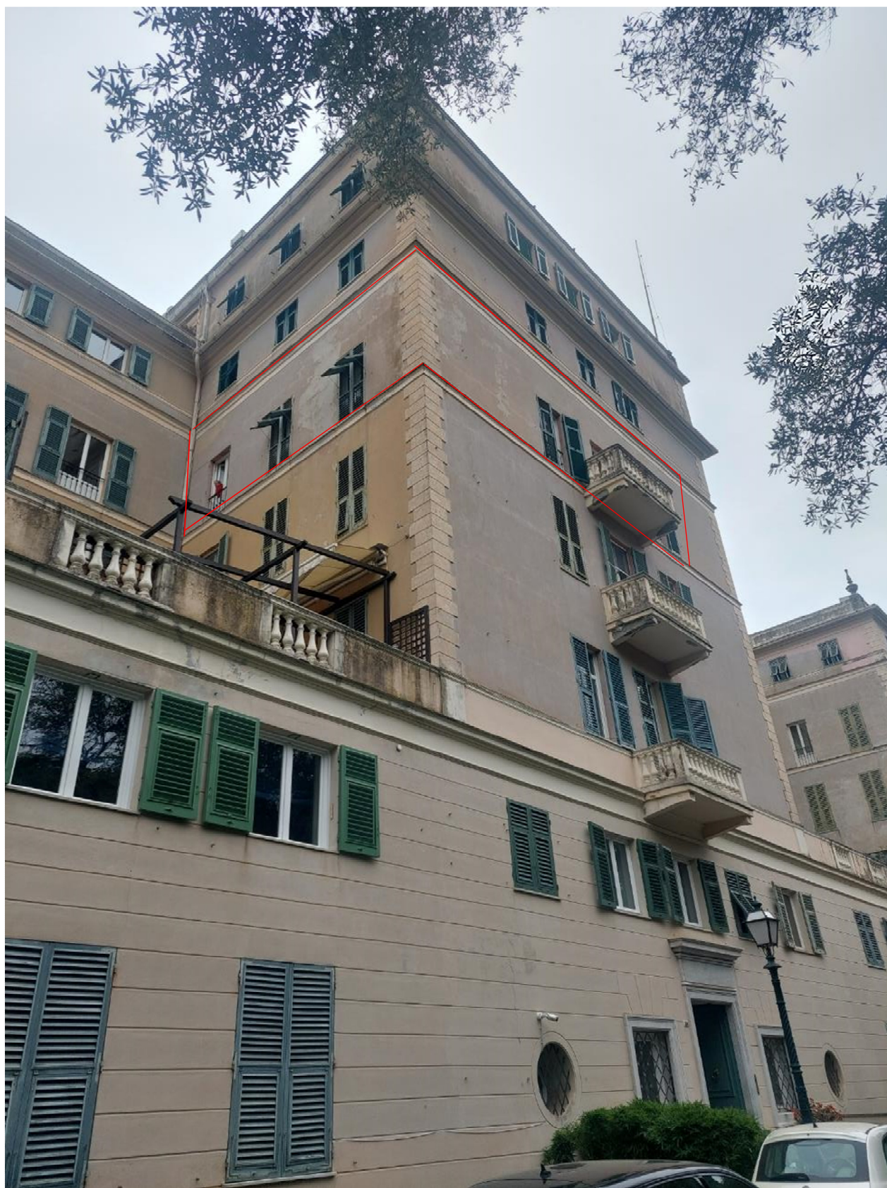
FOTO 16: prospetto nord – in evidenza gli affacci dell'interno 58