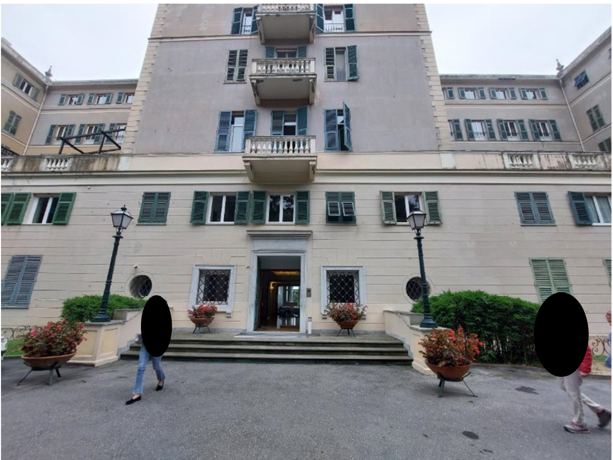
FOTO 14,15: prospetto nord dell'immobile; in vista l'ingresso principale con portineria