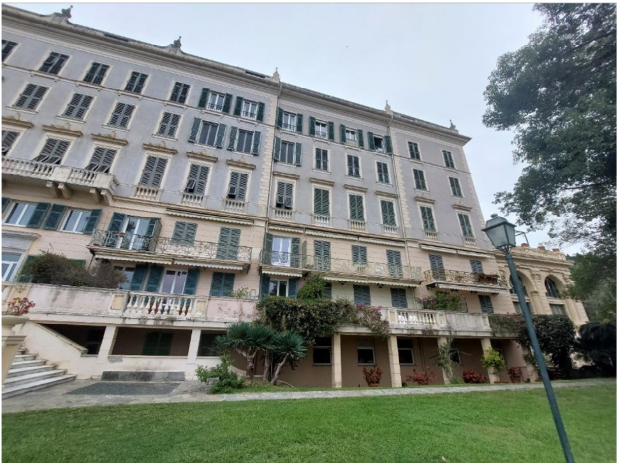
FOTO 4,5: prospetto principale del Condominio Eden sul parco di pertinenza