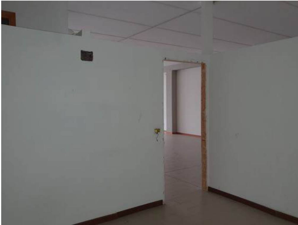
Fotografia I.56 - Archivio (ZONA A)