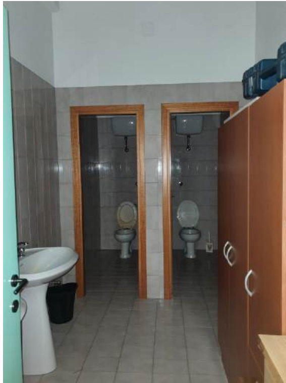
Fotografia I.36 - Anti w.c. - w.c. (ZONA C)