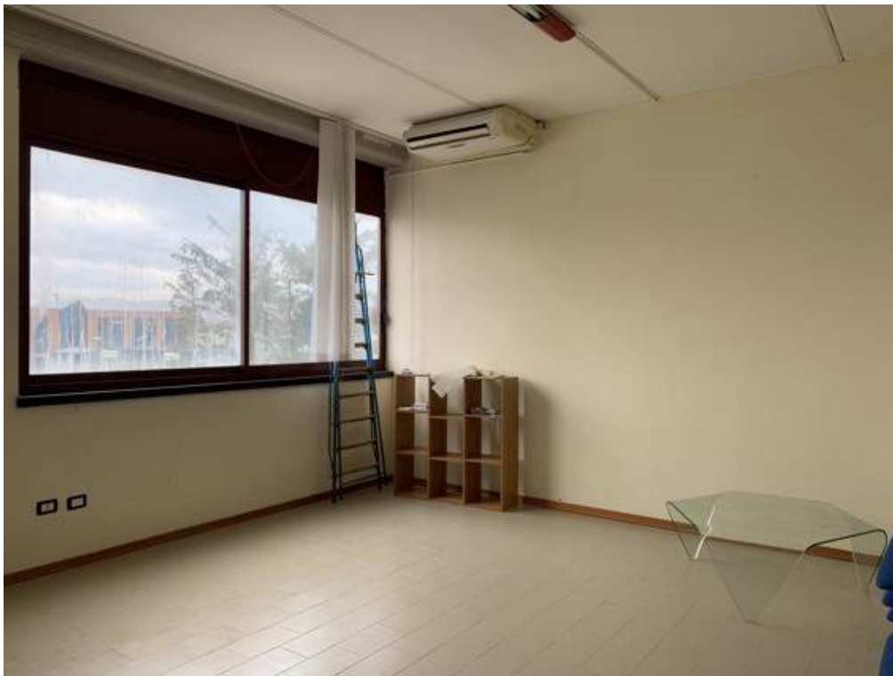
Fotografia I.11 - Ufficio (ZONA A)