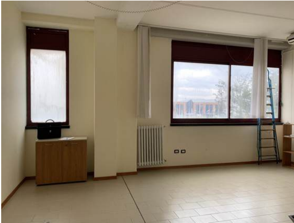
Fotografia I.10 - Ufficio (ZONA A)