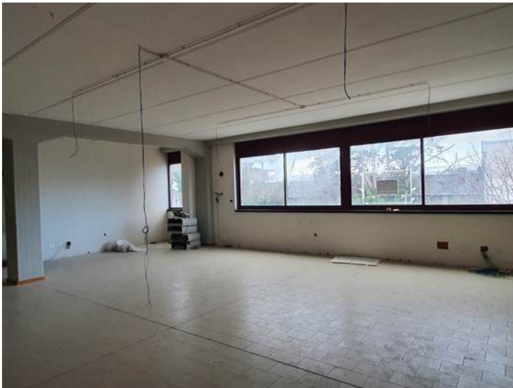
Fotografia I.63 - Ufficio 2 (ZONA B)