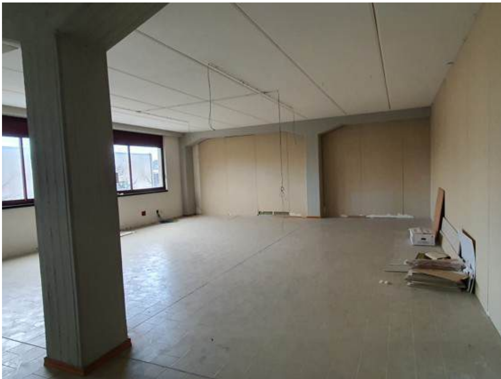
Fotografia I.61 - Ufficio 2 (ZONA B)