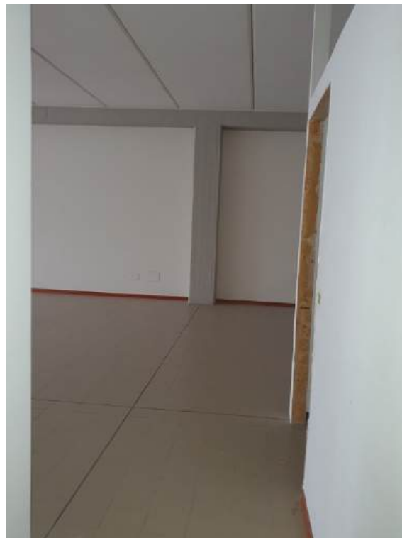
Fotografia I.57 - Ufficio 1 (ZONA A)