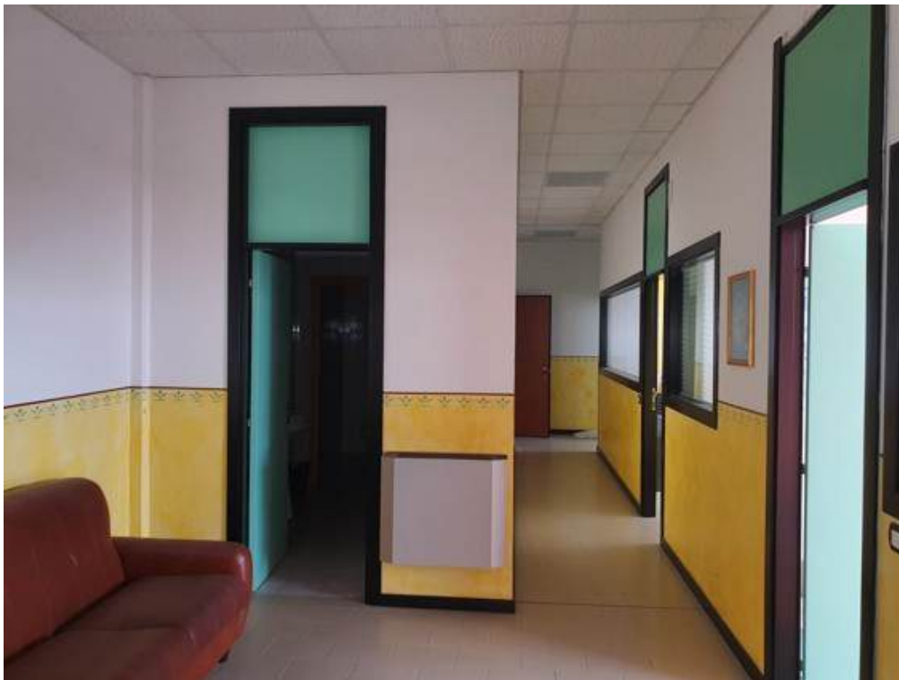
Fotografia I.35 - Disimpegno (ZONA C)