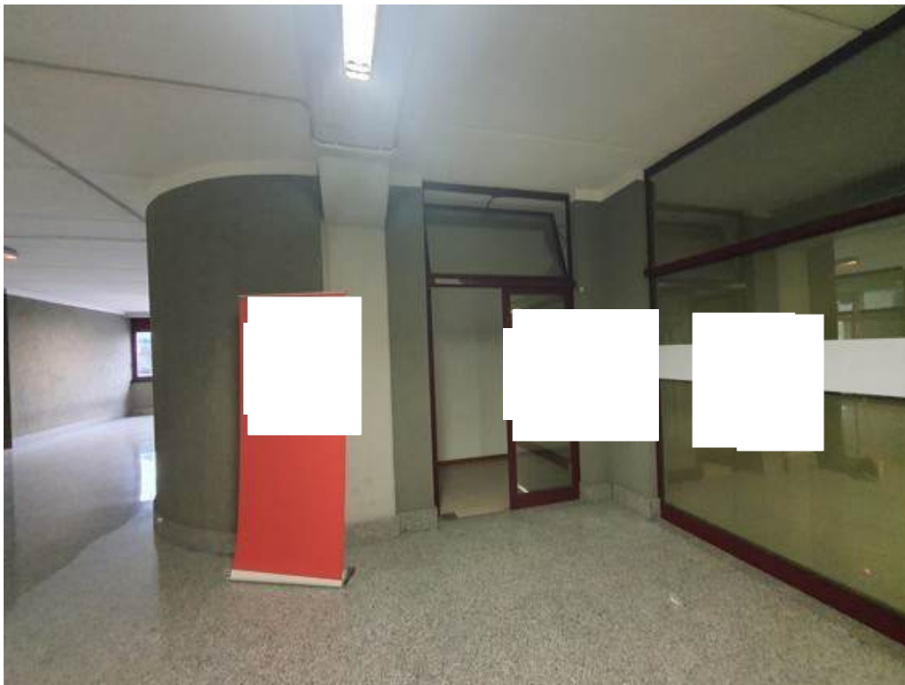
Fotografia I.47 - Vista da zona condominiale dell'ingresso all'ufficio 1 (ZONA A)