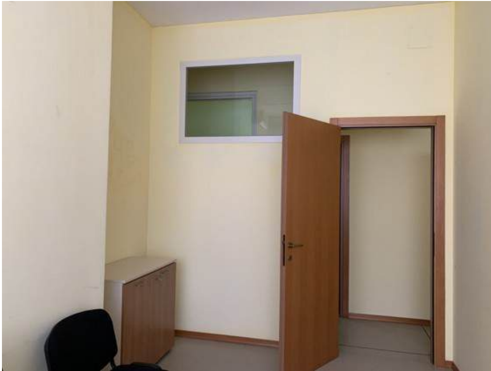
Fotografia I.16 - Ufficio (ZONA A)