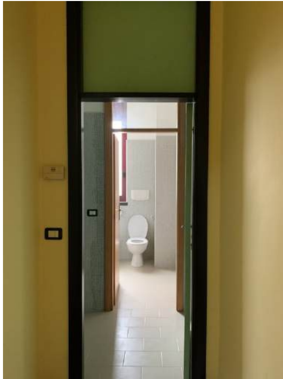
Fotografia I.20 - Anti w.c. - w.c. (ZONA A)