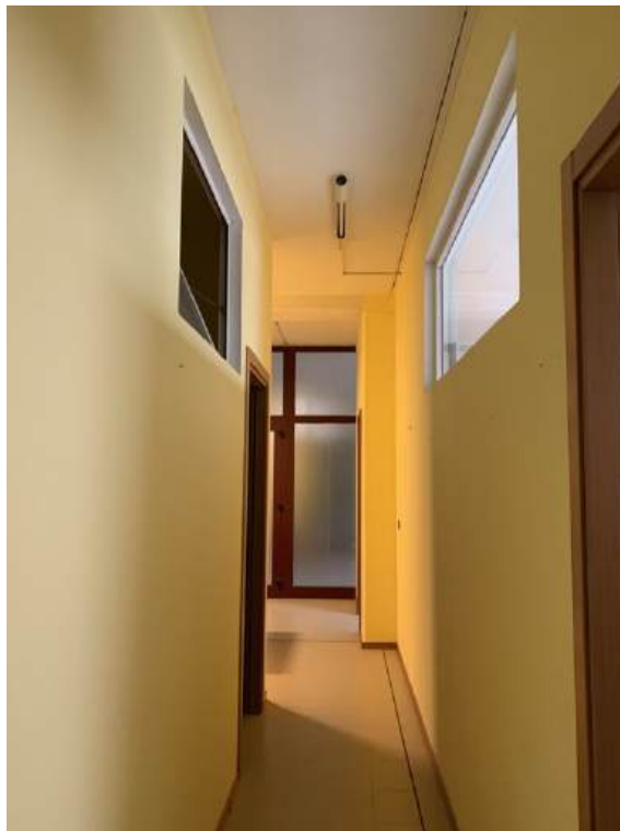
Fotografia I.19 - Disimpegno (ZONA A)