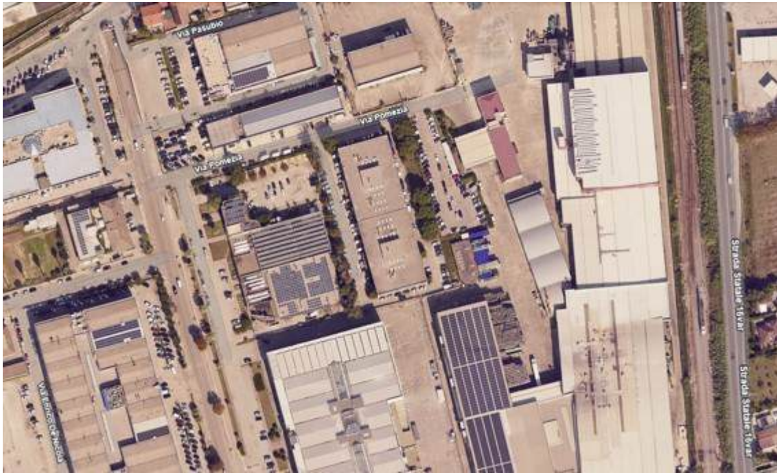
Fotografia I.1 - Vista aerea del fabbricato