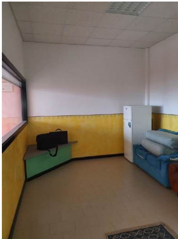
Fotografia I.37 - Disimpegno (ZONA C)