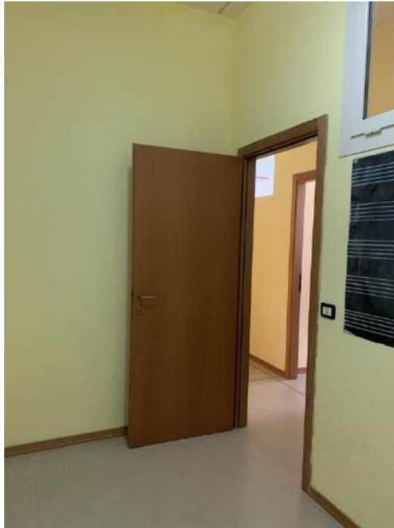
Fotografia I.18 - Ripostiglio (ZONA A)