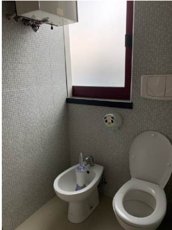
Fotografia I.22 - W.c. (ZONA A)