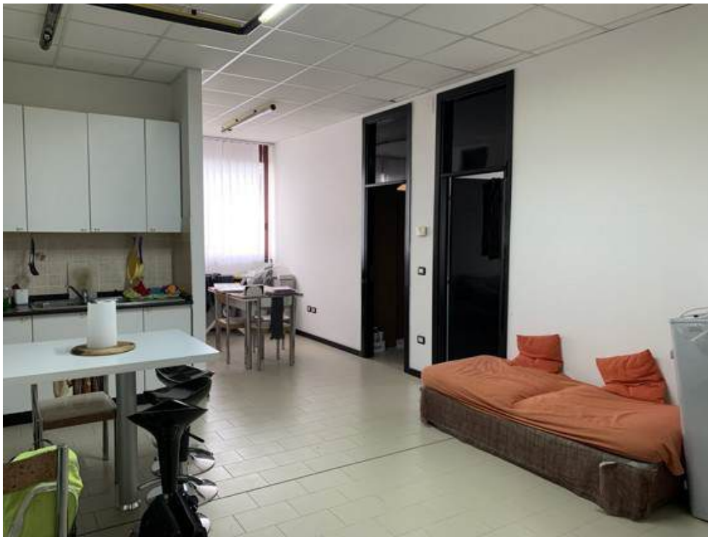
Fotografia I.27 - Ingresso (ZONA B)