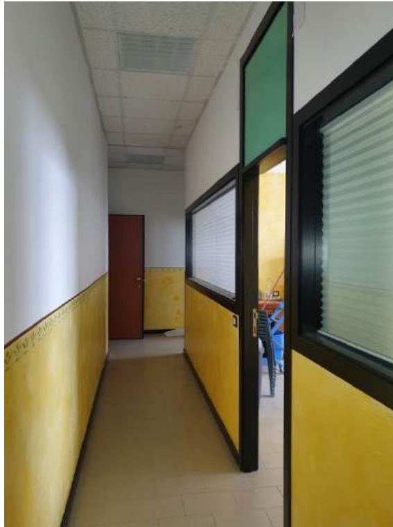
Fotografia I.34 - Disimpegno (ZONA C)