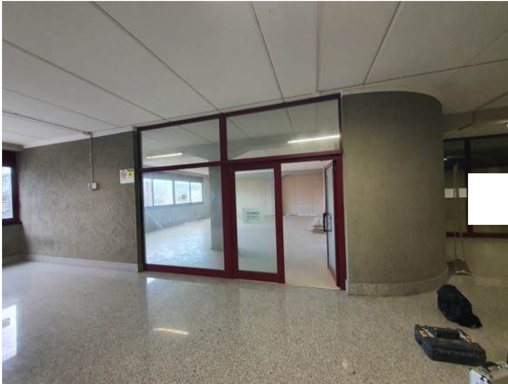
Fotografia I.60 - Vista da zona condominiale dell'ingresso all'ufficio 2 (ZONA B)