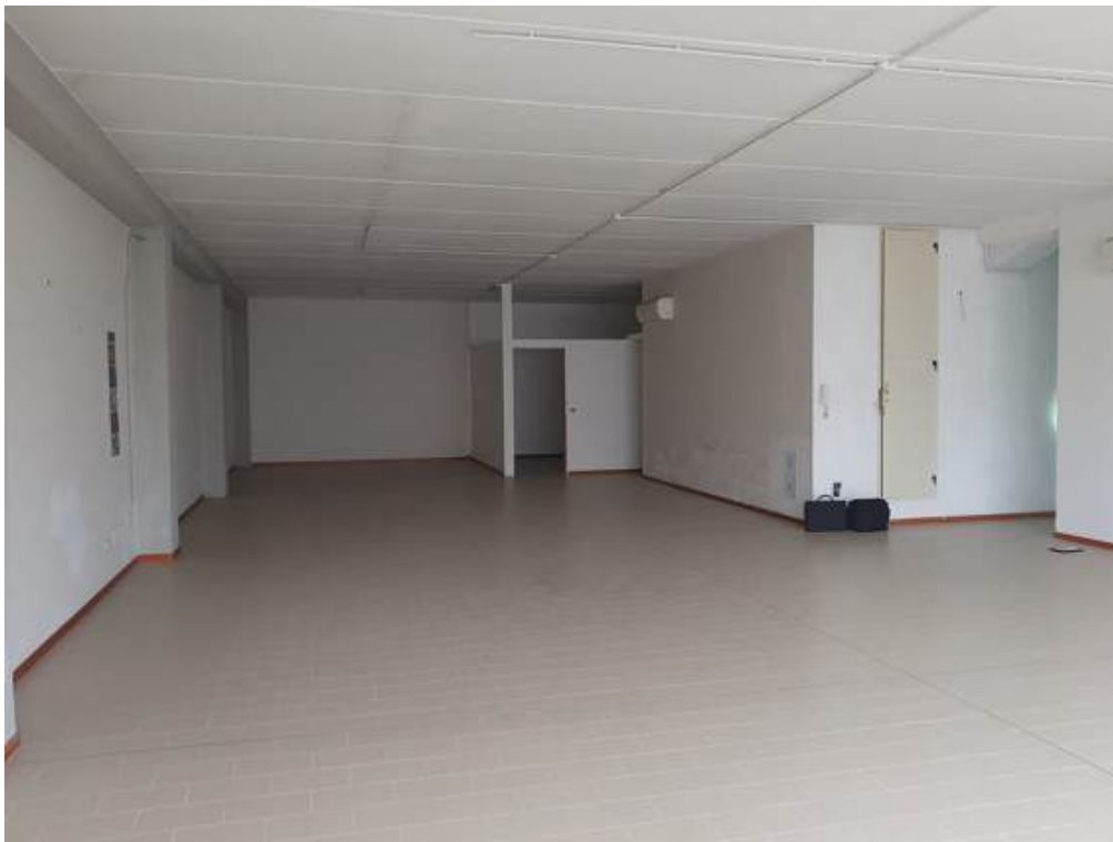
Fotografia I.53 - Ufficio 1 (ZONA A)