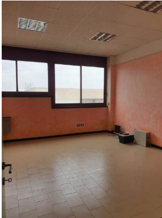
Fotografia I.38 - Ufficio (ZONA C)