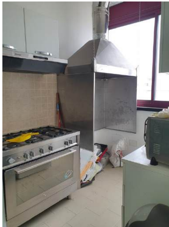
Fotografia I.43 - Ripostiglio (ZONA C)