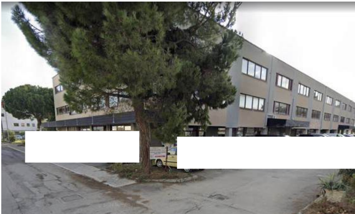
Fotografia I.2 - Vista esterna del fabbricato