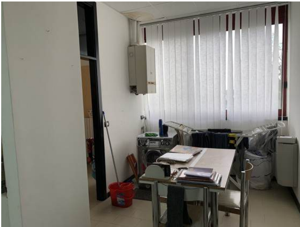
Fotografia I.29 - Zona attesa (ZONA B)