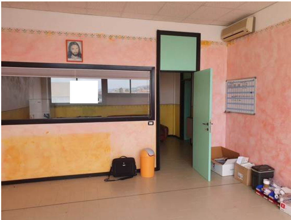
Fotografia I.39 - Ufficio (ZONA C)