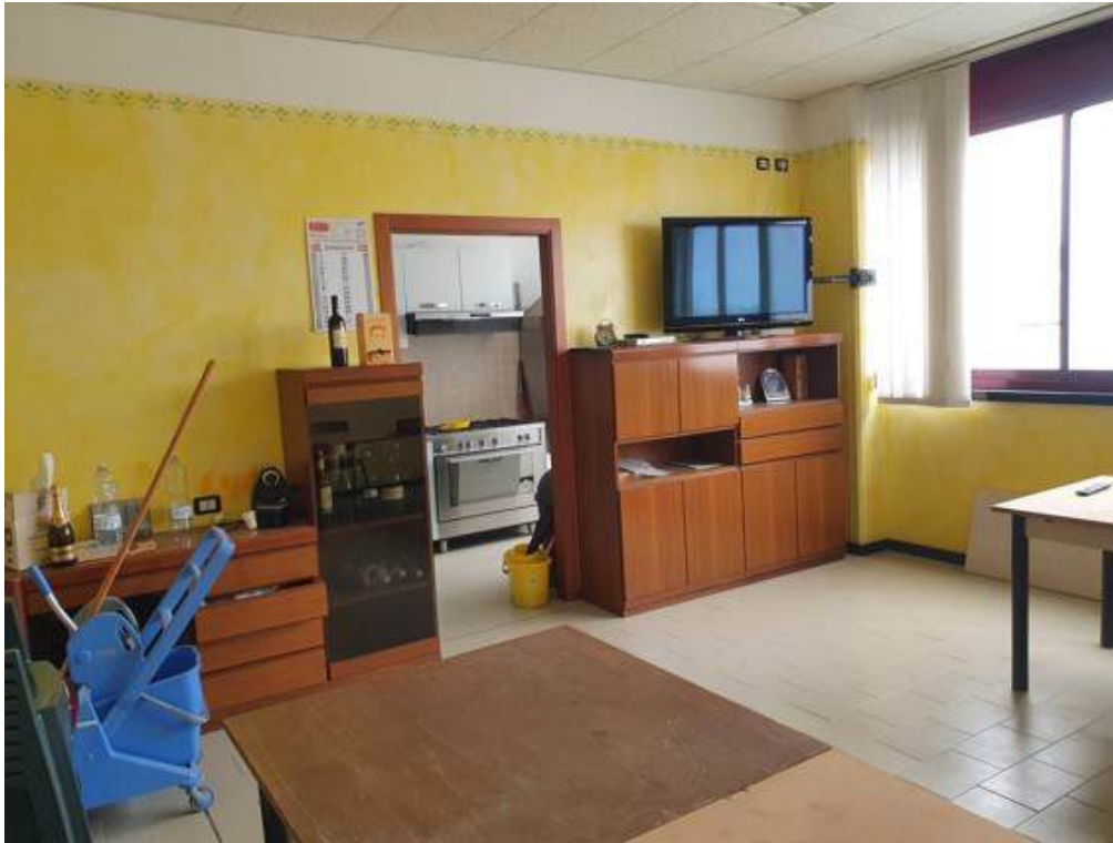
Fotografia I.42 - Ufficio (ZONA C)