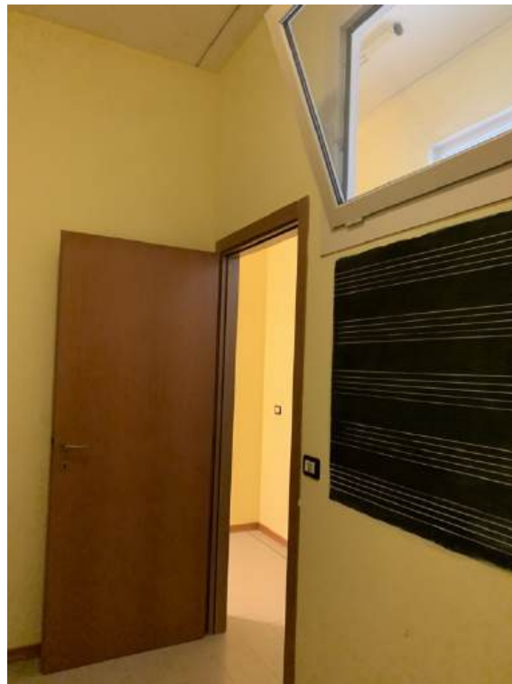
Fotografia I.17 - Archivio (ZONA A)