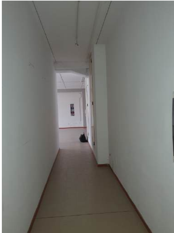
Fotografia I.48 - Ingresso (ZONA A)