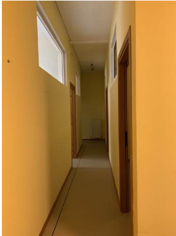
Fotografia I.14 - Disimpegno (ZONA A)