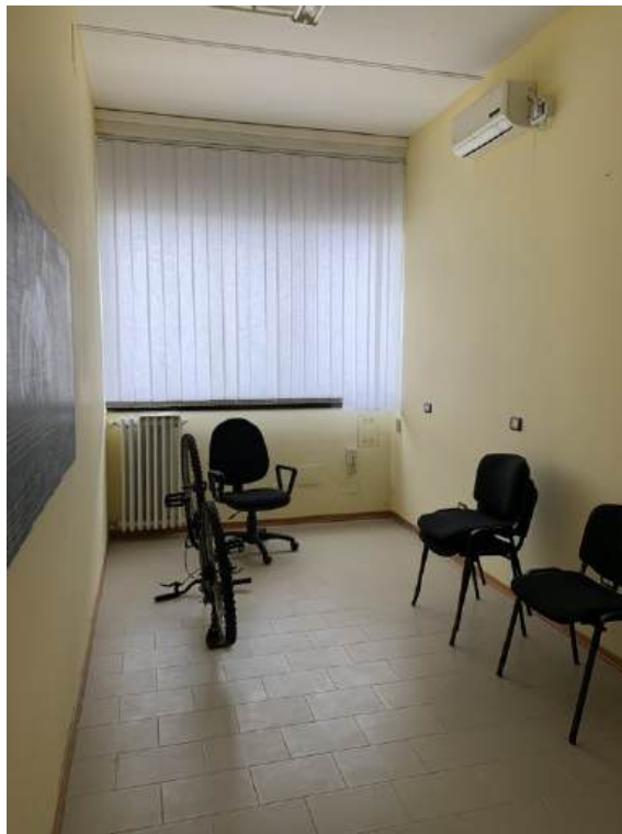
Fotografia I.15 - Ufficio (ZONA A)