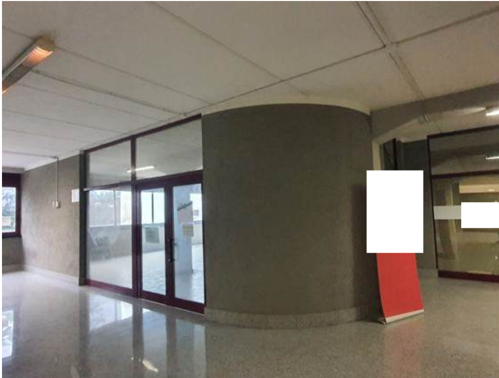
Fotografia I.46 - Vista da zona condominiale dell'ingresso all'ufficio 2 (ZONA B)