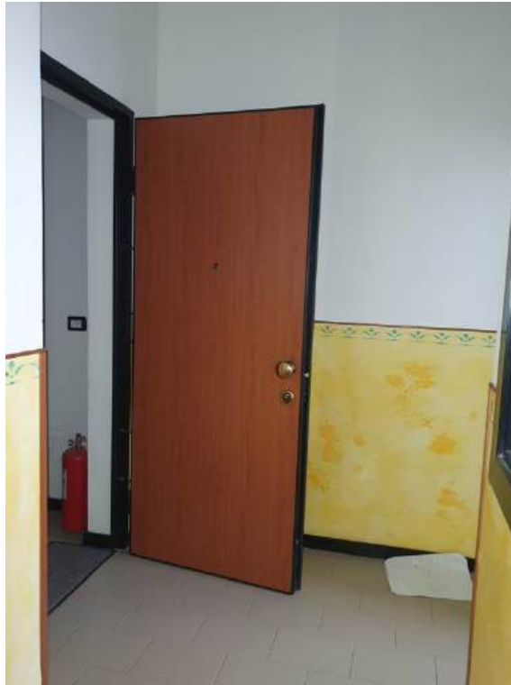
Fotografia I.32 - Ingresso (ZONA C)