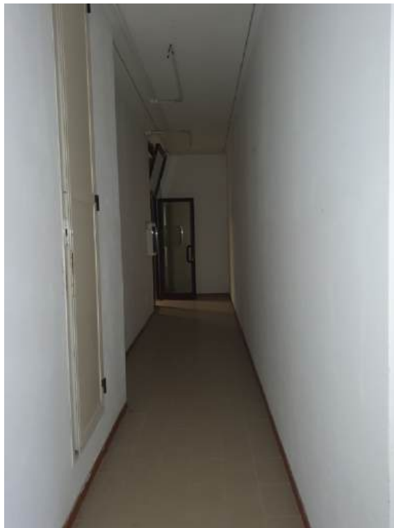
Fotografia I.49 - Ingresso (ZONA A)