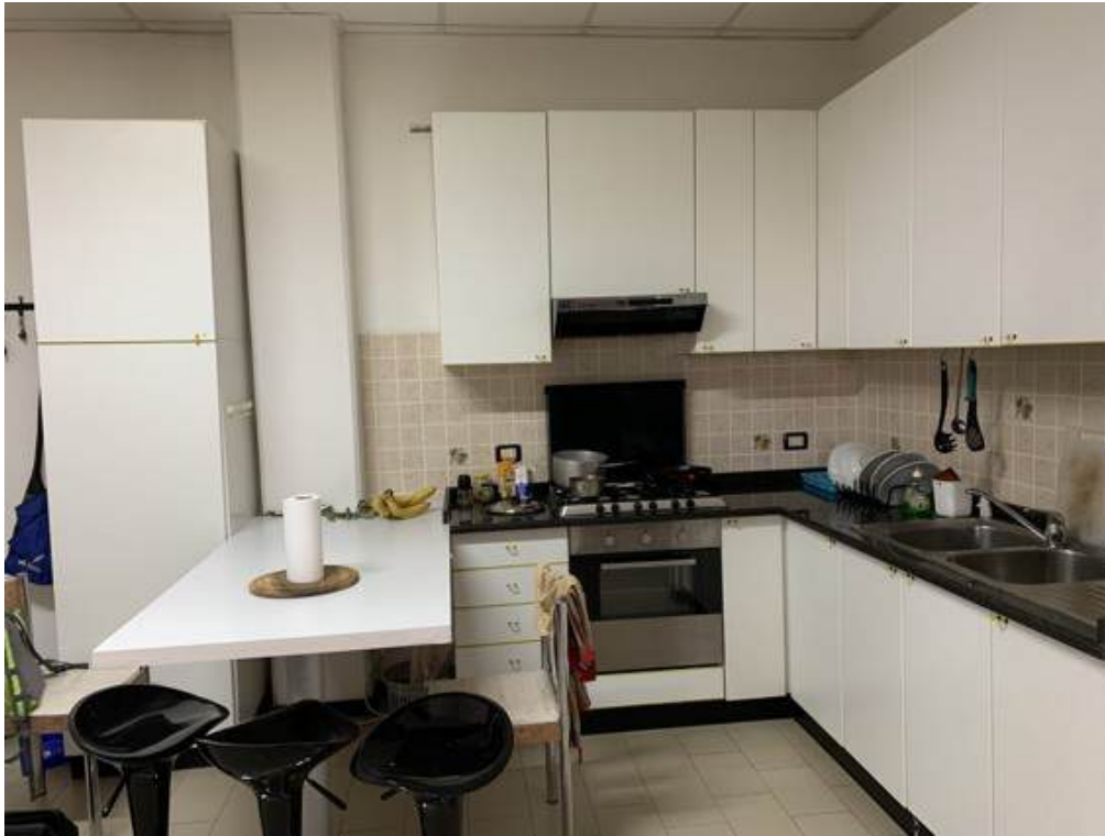
Fotografia I.28 - Zona attesa (ZONA B)