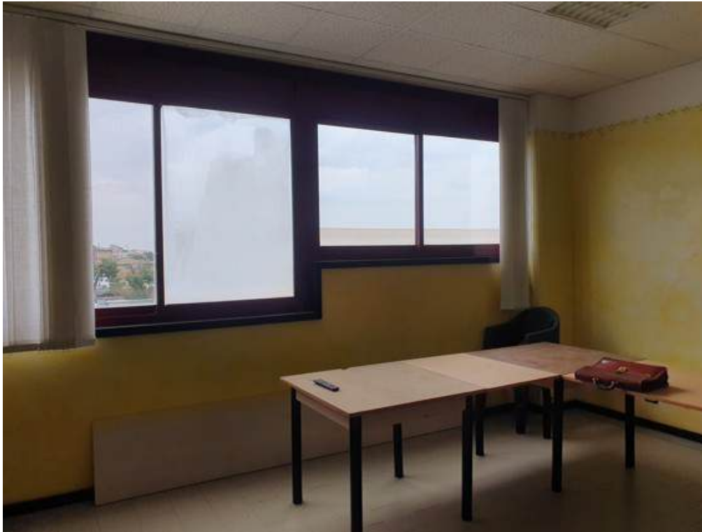
Fotografia I.40 - Ufficio (ZONA C)