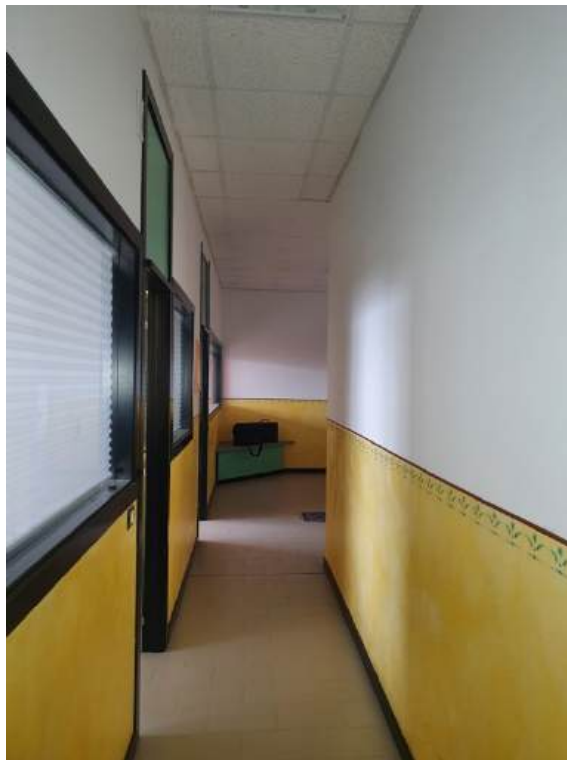
Fotografia I.33 - Disimpegno (ZONA C)