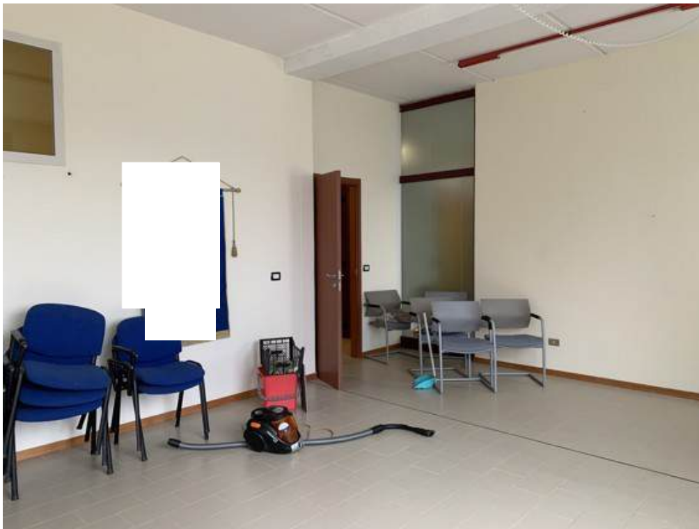
Fotografia I.13 - Ufficio (ZONA A)