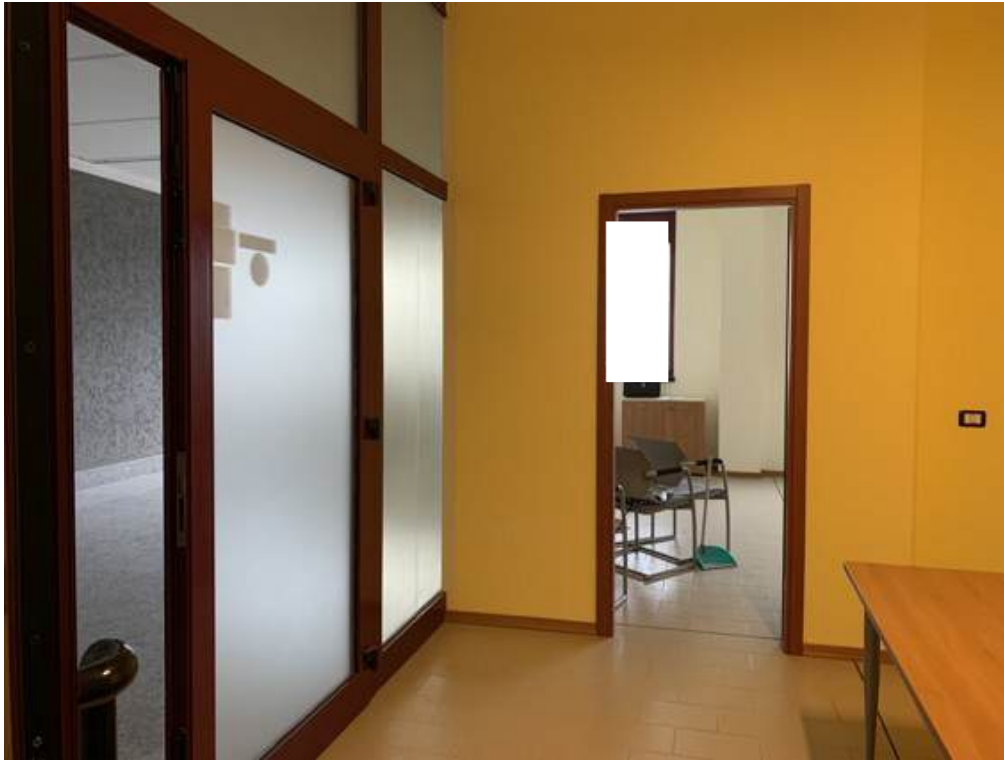
Fotografia I.6 - Ingresso (ZONA A)