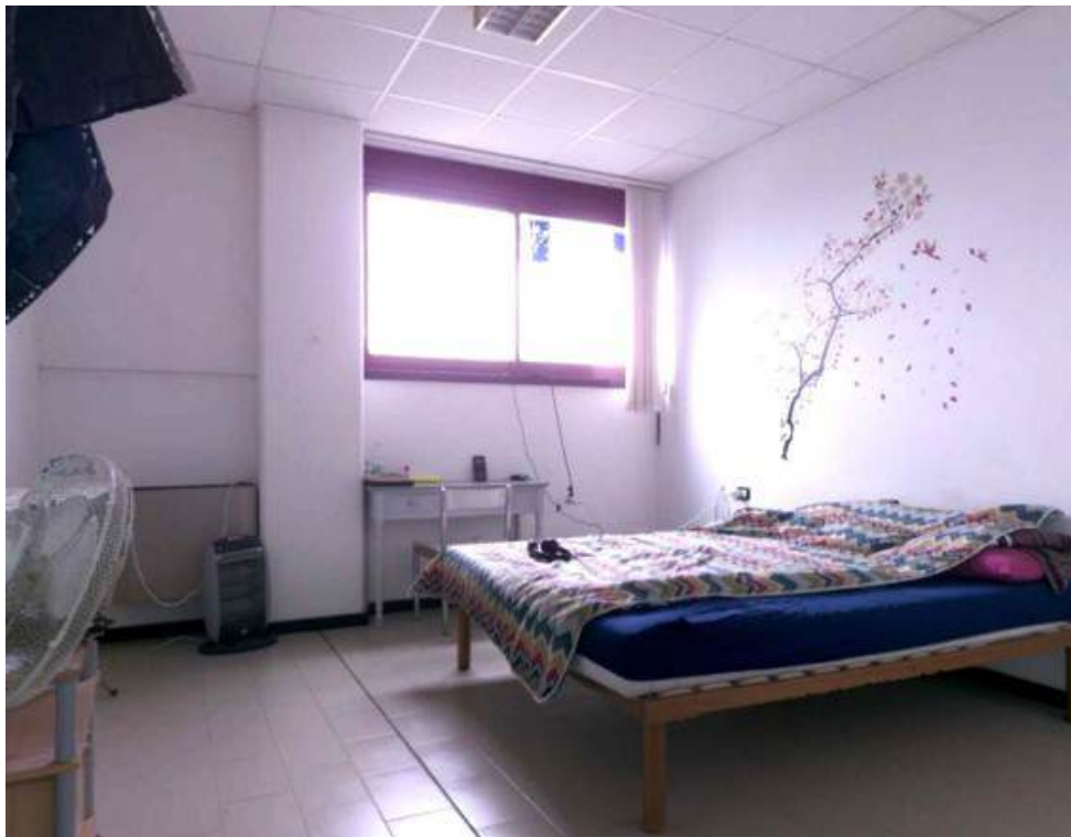
Fotografia I.31 - Ufficio (ZONA B)