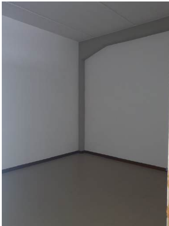
Fotografia I.55 - Archivio (ZONA A)