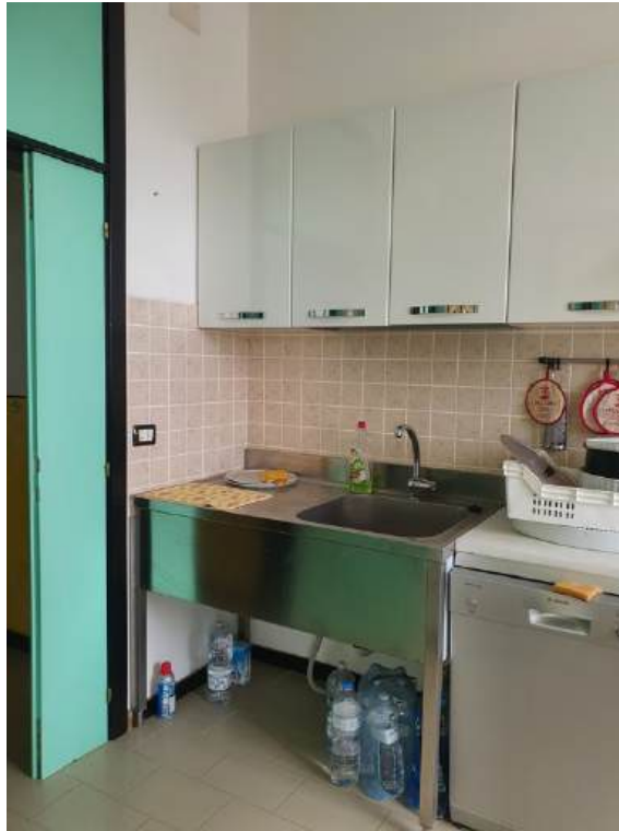
Fotografia I.44 - Ripostiglio (ZONA C)