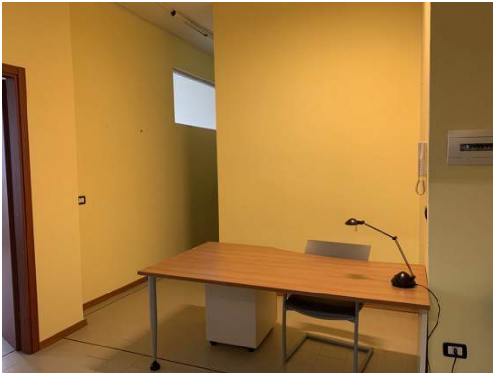
Fotografia I.9 - Ingresso (ZONA A)