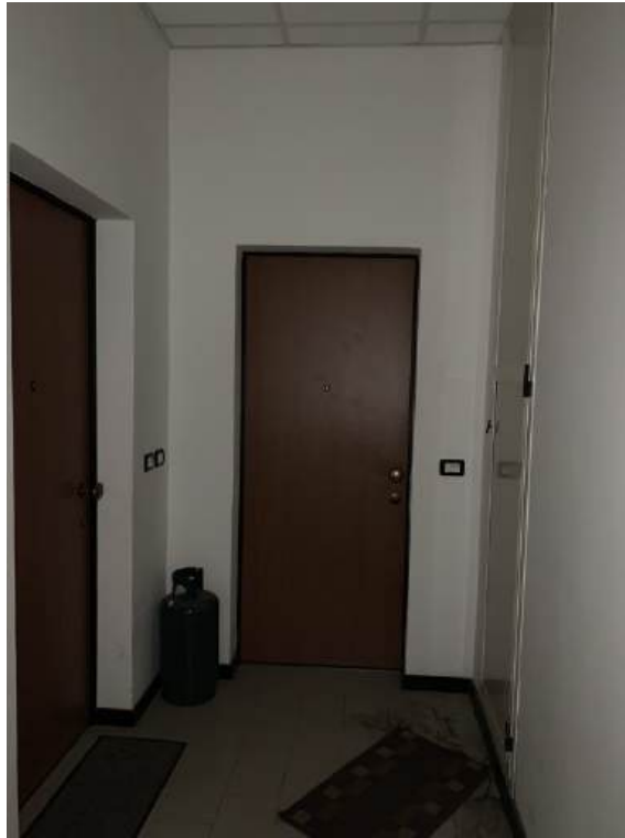
Fotografia I.26 - Ingresso alle ZONE B e C (ZONA D)