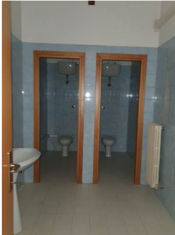
Fotografia I.58 - Anti w.c. - w.c. (ZONA A)