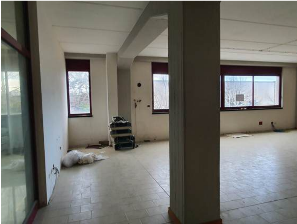
Fotografia I.62 - Ufficio 2 (ZONA B)