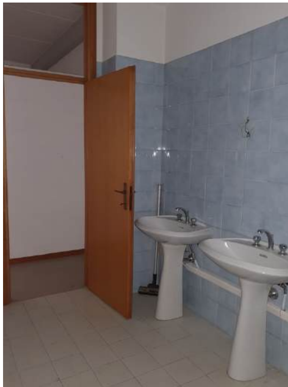
Fotografia I.59 - Anti w.c. (ZONA A)