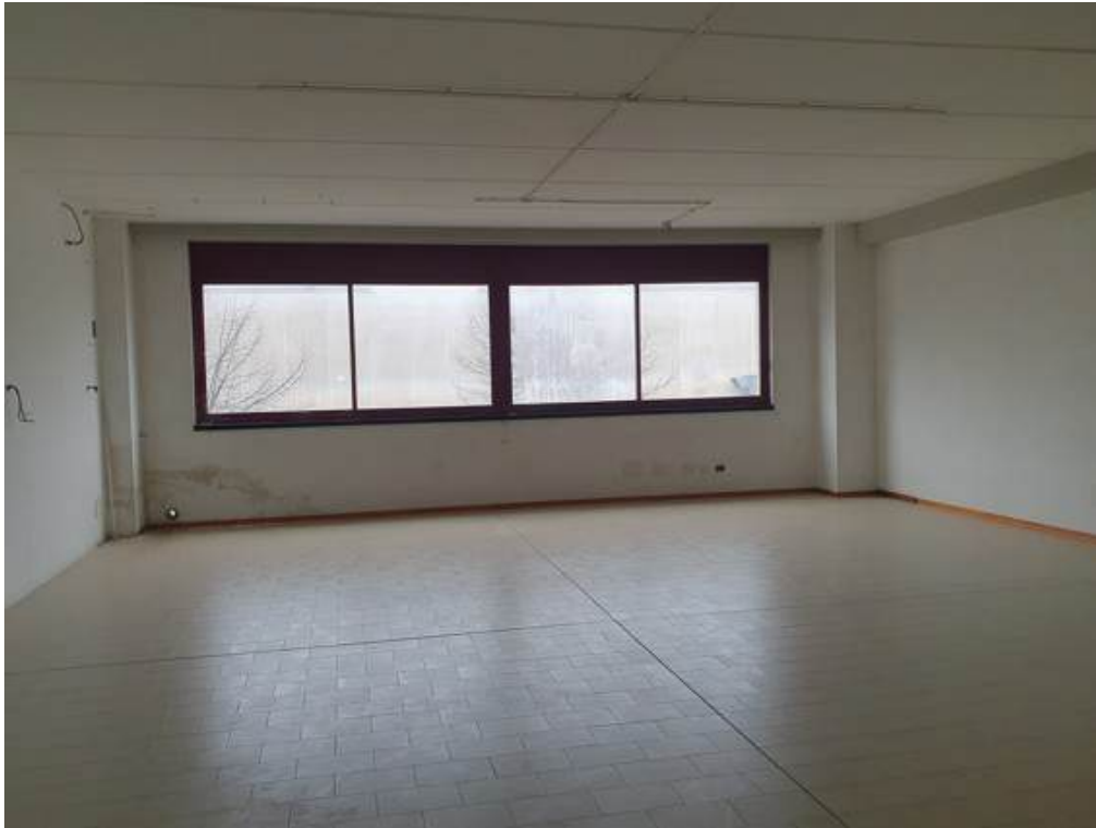
Fotografia I.50 - Ufficio 1 (ZONA A)