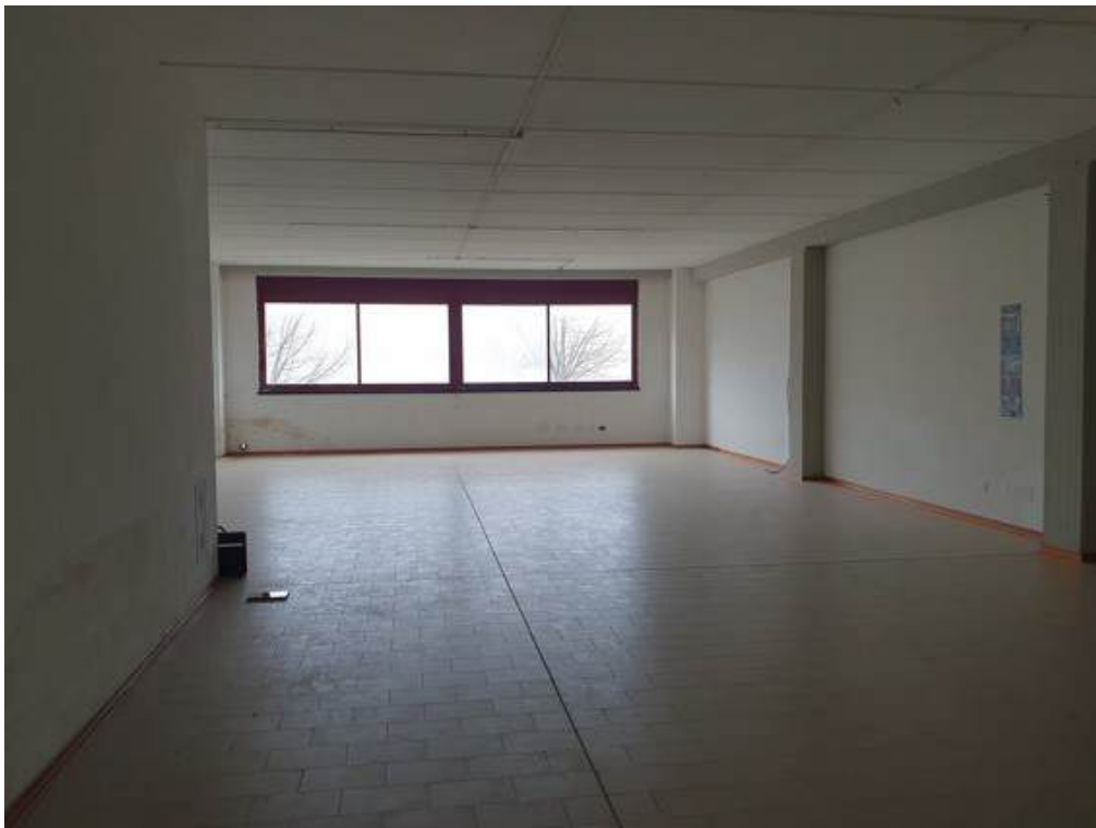
Fotografia I.51 - Ufficio 1 (ZONA A)