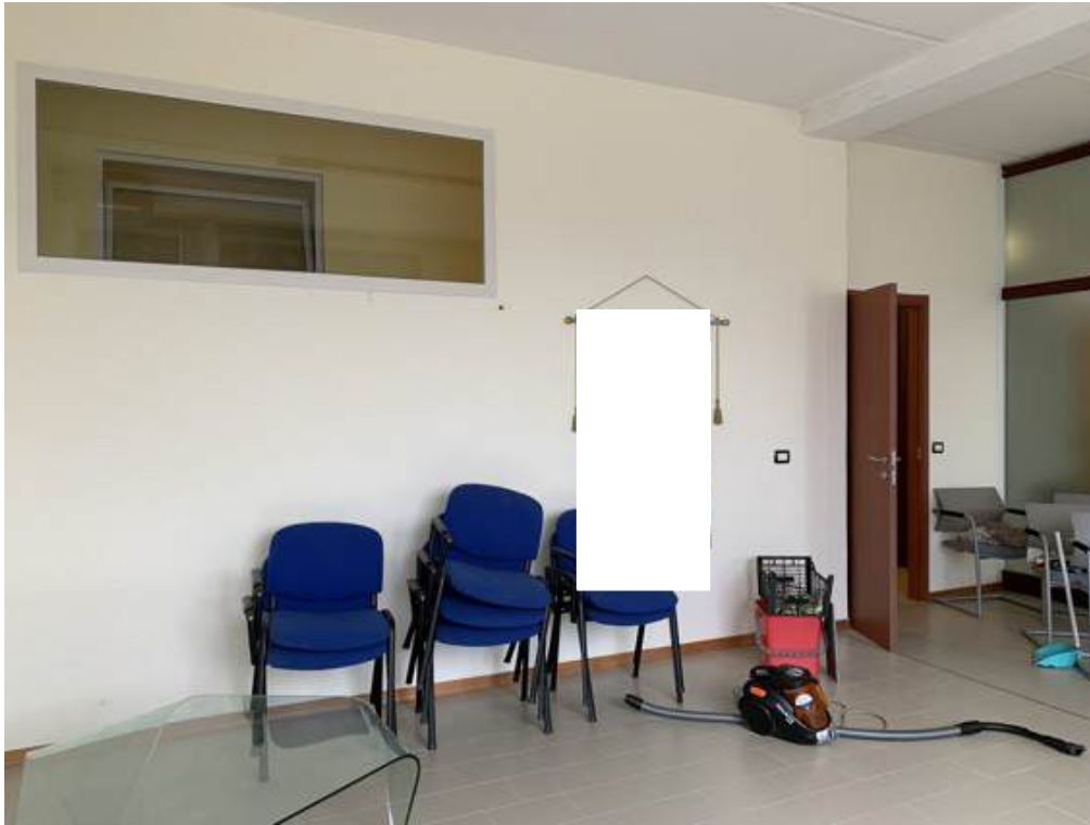
Fotografia I.12 - Ufficio (ZONA A)