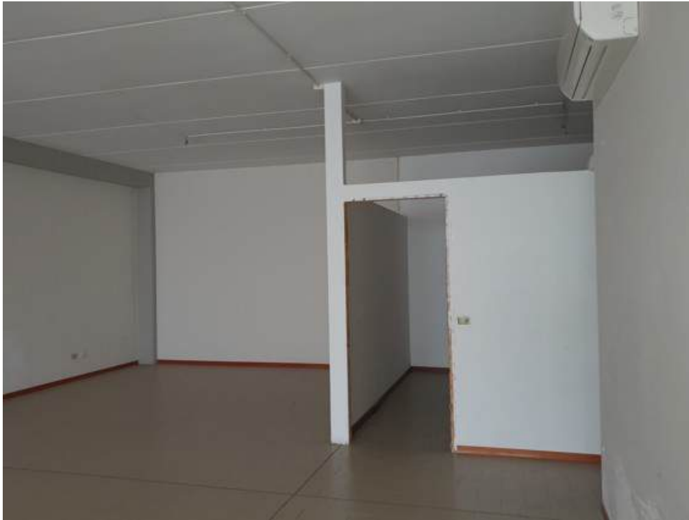
Fotografia I.54 - Ufficio 1 - archivio (ZONA A)