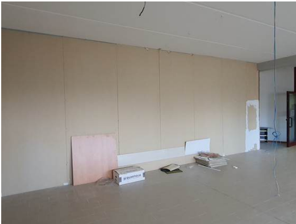
Fotografia I.65 - Ufficio 2 (ZONA B)