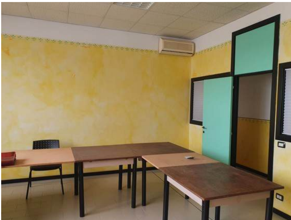
Fotografia I.41 - Ufficio (ZONA C)