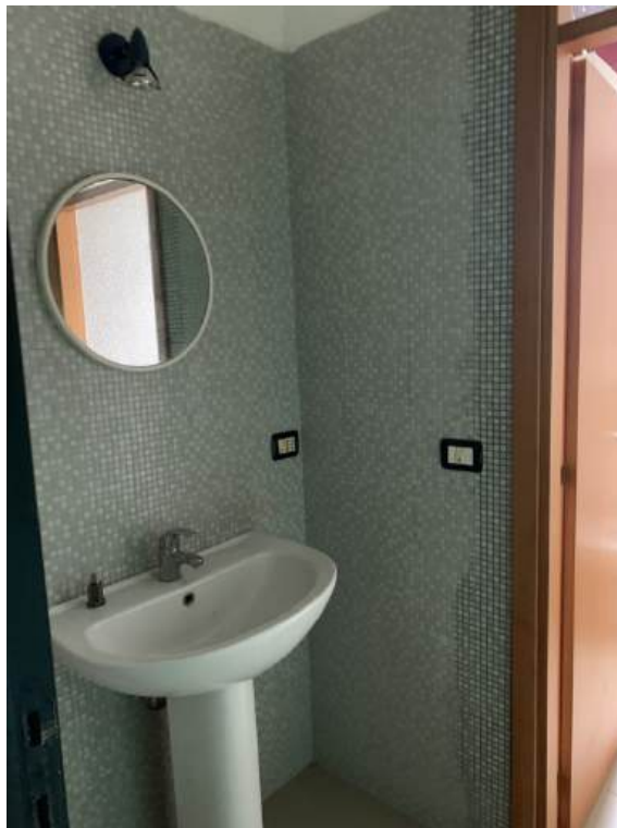
Fotografia I.21 - Anti w.c. (ZONA A)