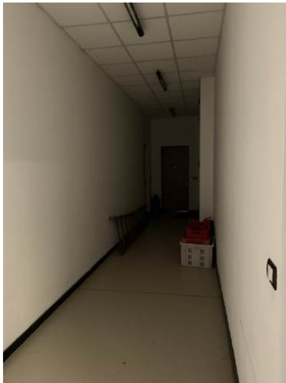
Fotografia I.25 - Ingresso alle ZONE B e C (ZONA D)