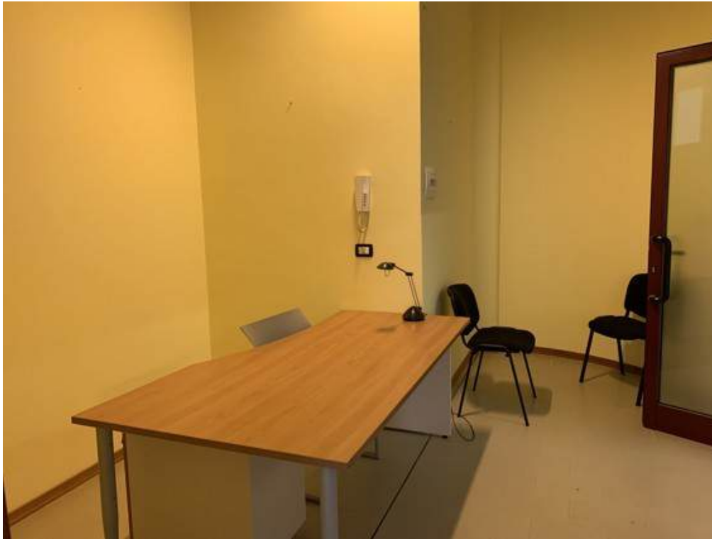
Fotografia I.8 - Ingresso (ZONA A)