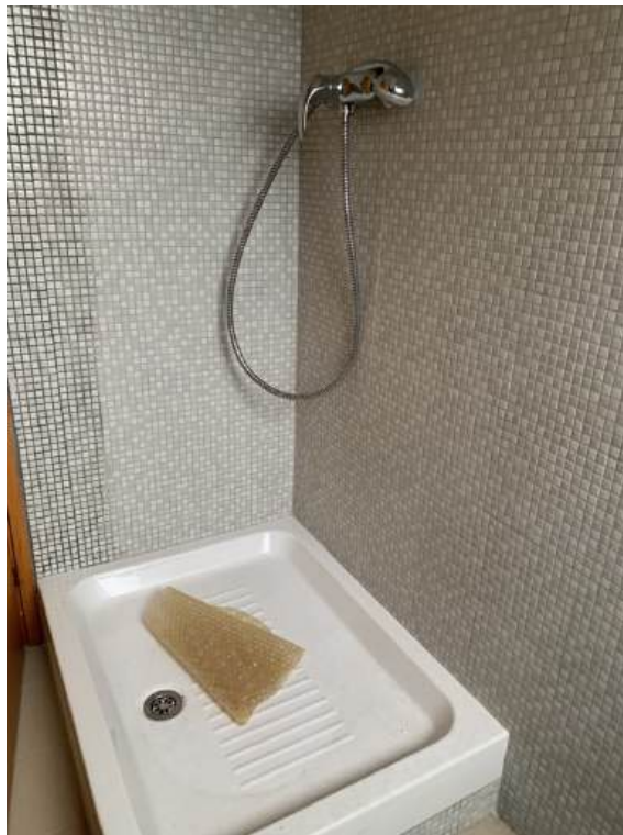
Fotografia I.23 - W.c. (ZONA A)