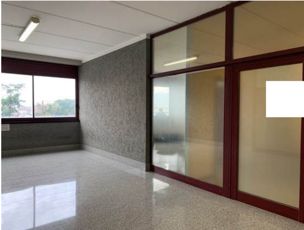
Fotografia I.4 - Vista da zona condominiale dell'ingresso agli uffici (ZONA A)