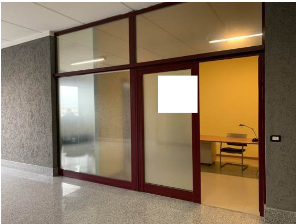
Fotografia I.5 - Vista da zona condominiale dell'ingresso agli uffici (ZONA A)