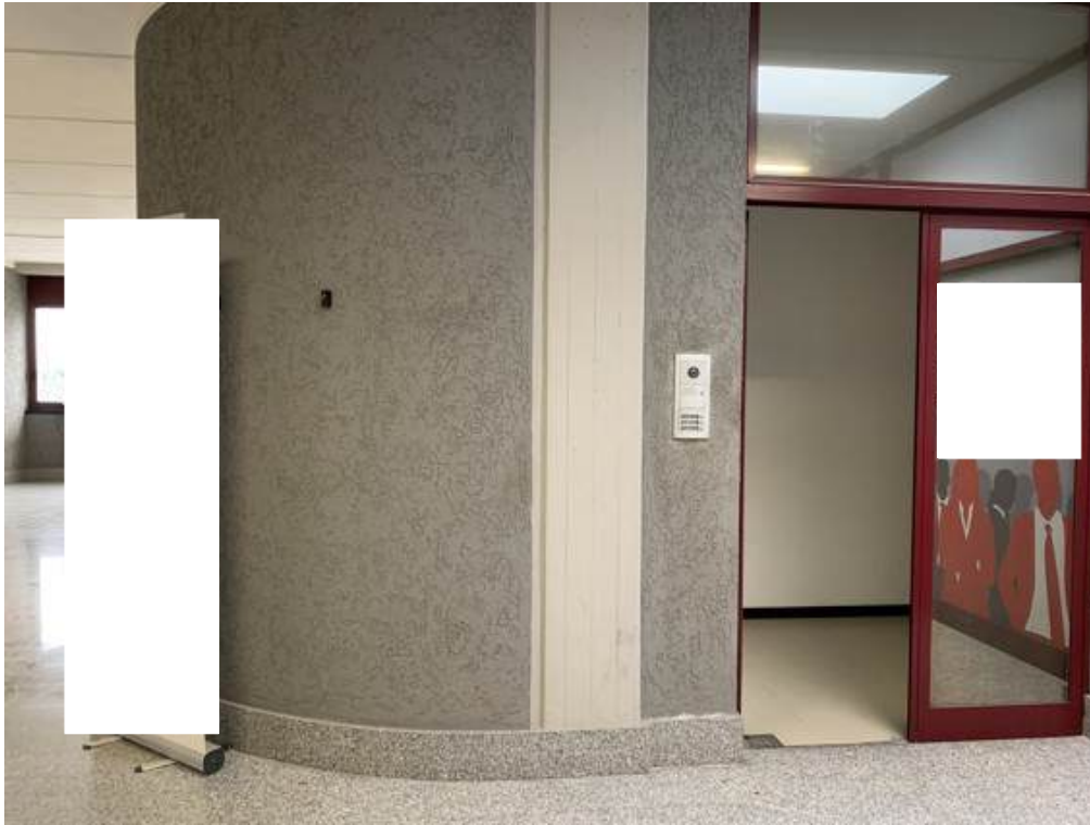
Fotografia I.24 - Vista da zona condominiale alla zona ingresso (ZONA D)