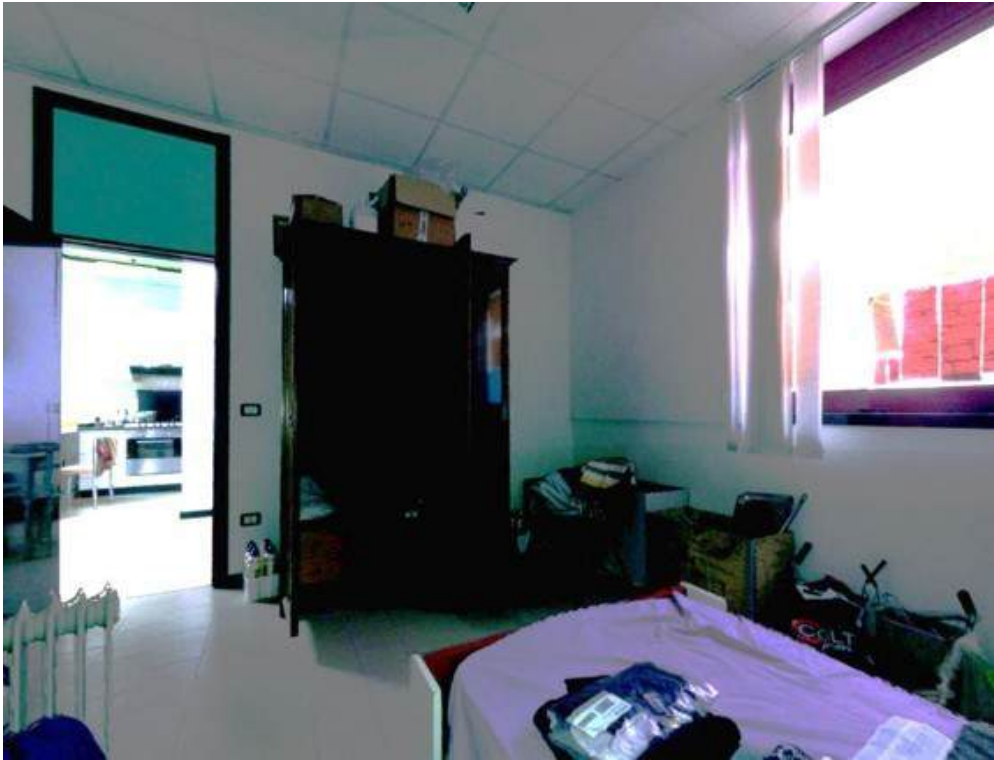
Fotografia I.30 - Ufficio (ZONA B)