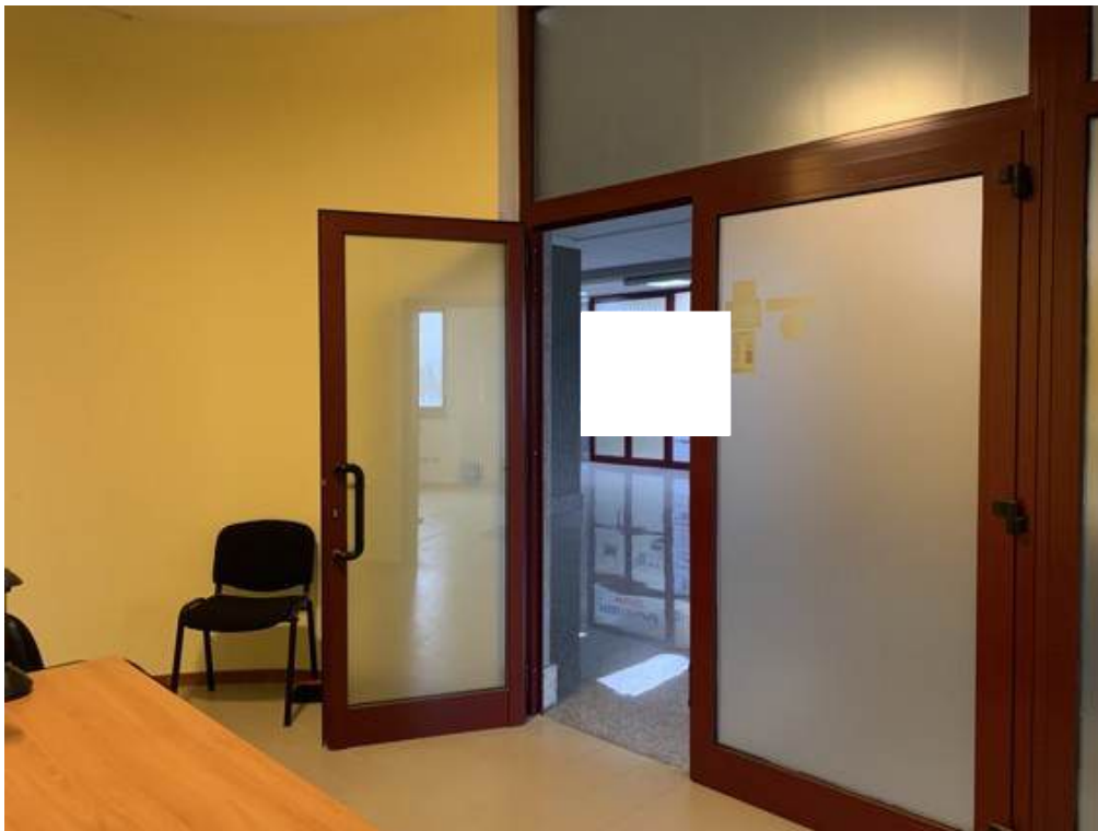
Fotografia I.7 - Ingresso (ZONA A)