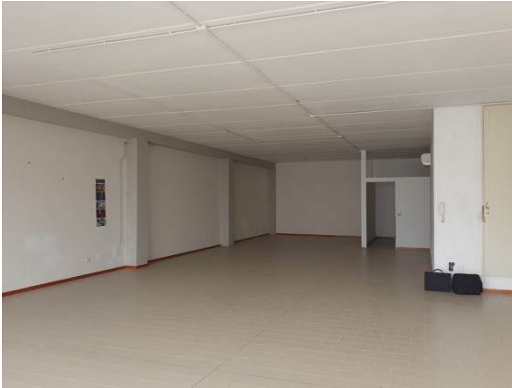
Fotografia I.52 - Ufficio 1 (ZONA A)