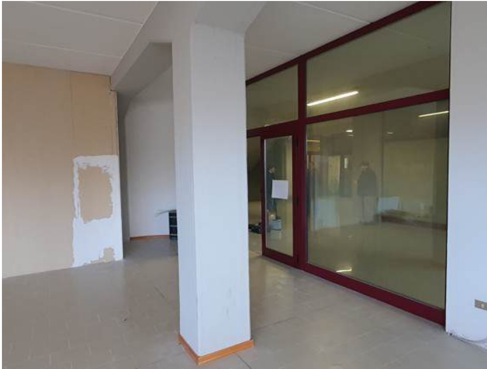
Fotografia I.64 - Ufficio 2 (ZONA B)