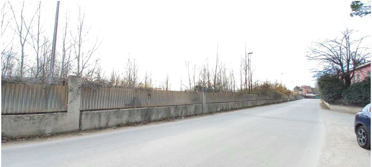
Via Corso Italia