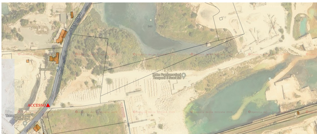
Sovrapposizione Estratto di mappa e foto aerea

Il lotto confina a nord con la particella 560, ad est con le particelle 561 e 629 a sud con le particelle 570 e 572 ad ovest con la strada Corso Italia. Si tratta di un terreno pianeggiante incolto, recitato esclusivamente sul lato stradale con un muro di cinta in cls. L'accesso carrabile è caratterizzato da un ampio cancello di metallo scorrevole situato all'angolo sud-ovest che dà accesso anche al lotto intercluso della particella 629. La maggior parte del lotto è utilizzato dalla Società confinante quale deposito dei marmi estratti dalla cava limitrofa. Infatti i tre lati rimanenti del lotto non hanno recinzione.