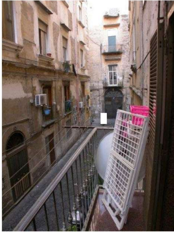
Foto n° 15 e 16 - via del Priorato dal balconcino della camera da letto