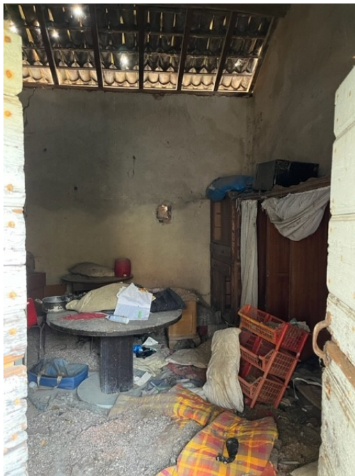
Locale di sgombero

Viale A. Necchi 4 27100 Pavia Tel. 3392772355 e-mail nverdi2@gmail.com pec mail: nicola.verdi@pec.ording.pv.it P.IVA 01806320188 Iscritto all'Albo degli Ingegneri della Provincia di Pavia al n. 1981