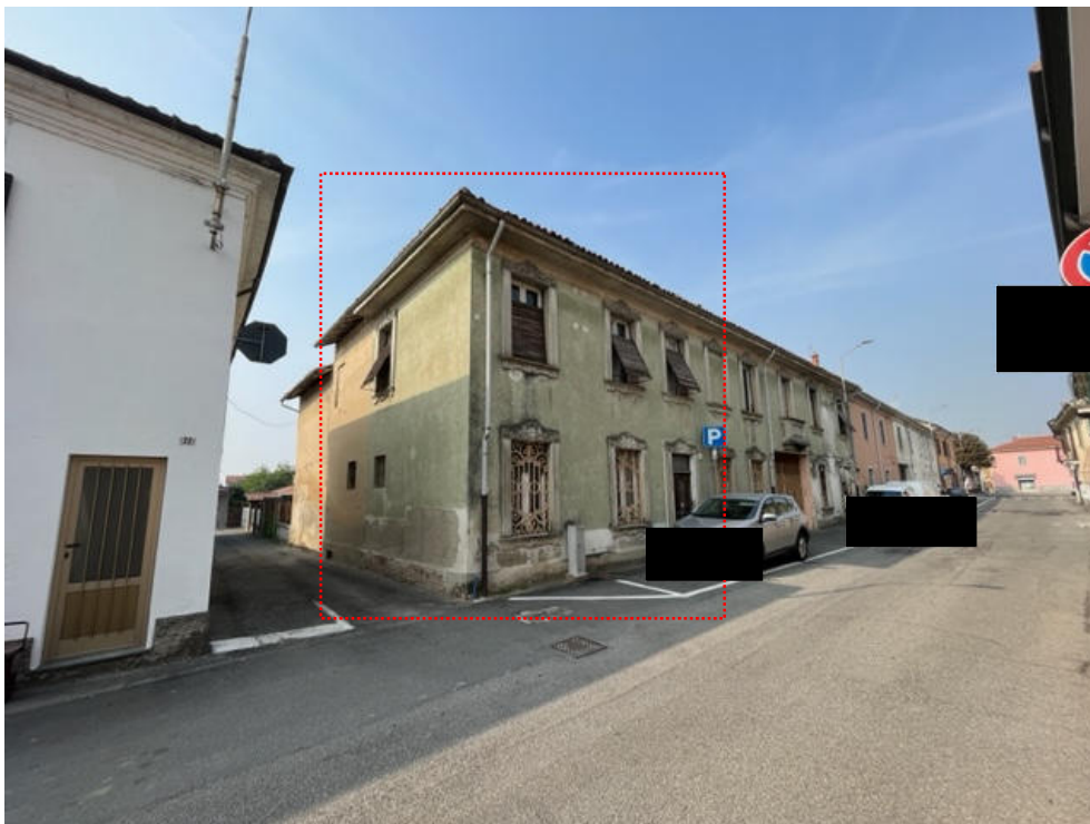
Vista del fabbricato dalla pubblica via Olivelli (lato nord-ovest).