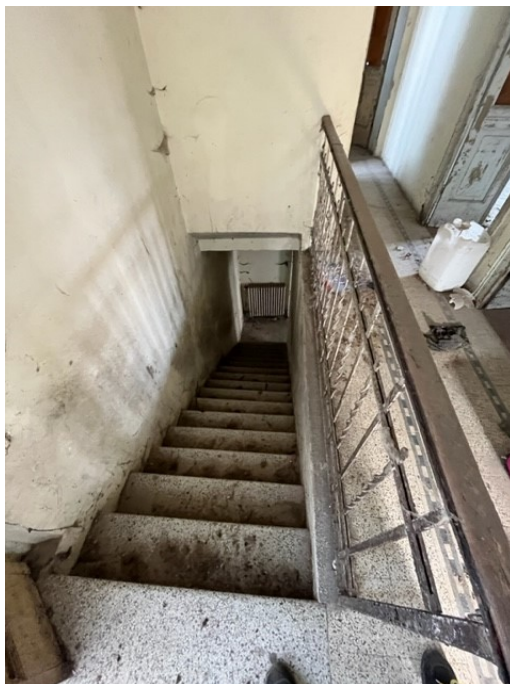
Scala di accesso al piano primo