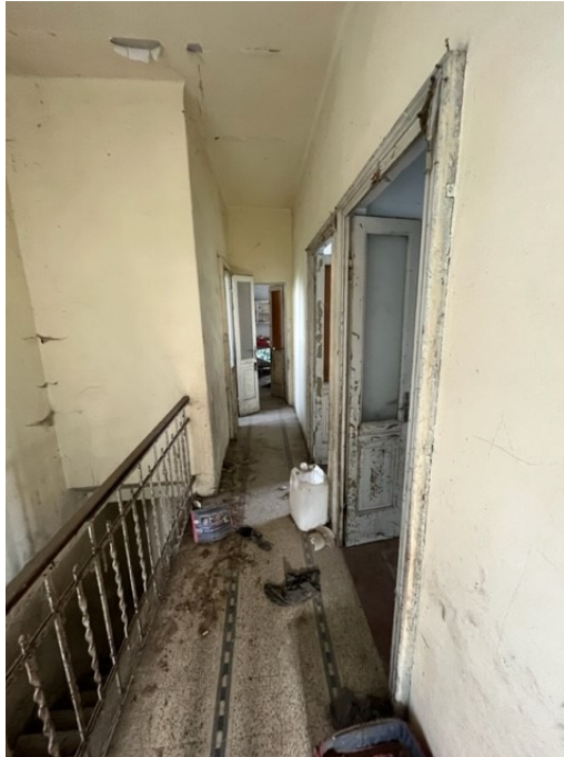
Corridoio al piano primo

Viale A. Necchi 4 27100 Pavia Tel. 3392772355 e-mail nverdi2@gmail.com pec mail: nicola.verdi@pec.ording.pv.it P.IVA 01806320188 Iscritto all'Albo degli Ingegneri della Provincia di Pavia al n. 1981