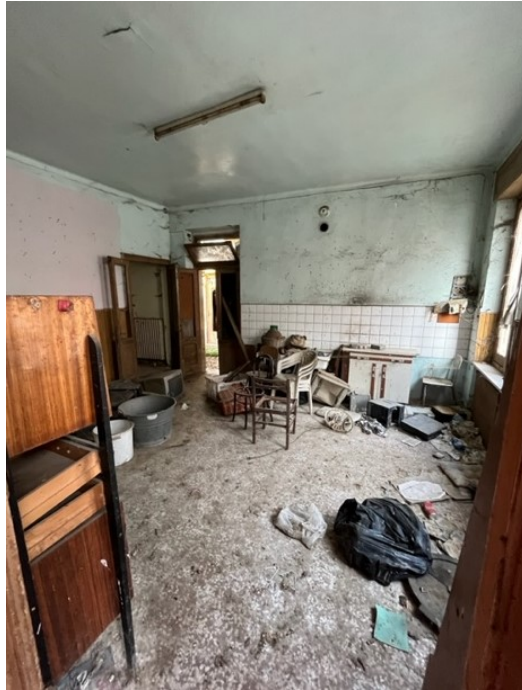
Piano terra: cucina entrando a destra

Viale A. Necchi 4 27100 Pavia Tel. 3392772355 e-mail nverdi2@gmail.com pec mail: nicola.verdi@pec.ording.pv.it P.IVA 01806320188 Iscritto all'Albo degli Ingegneri della Provincia di Pavia al n. 1981