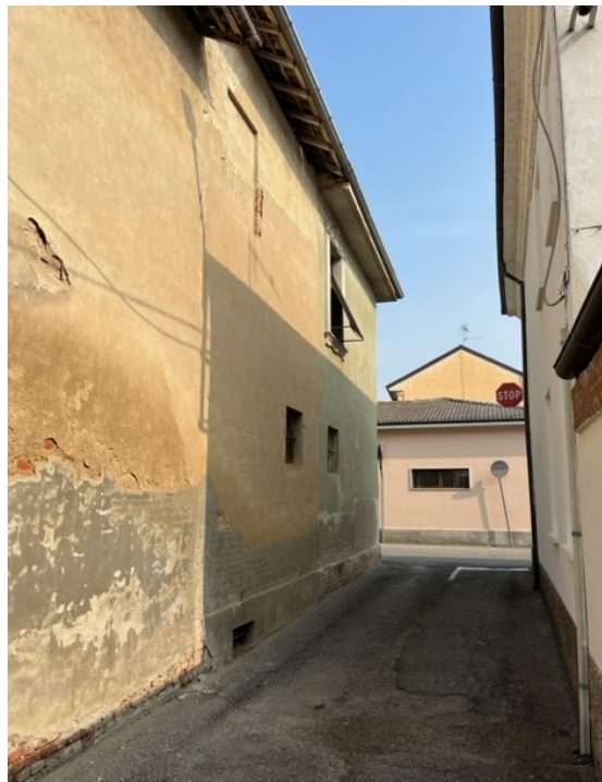
Vista esterna lato ovest – vicolo S Rocco