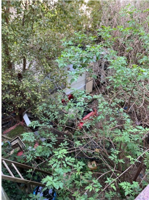
Vista dal balcone del cortile comune sottostante