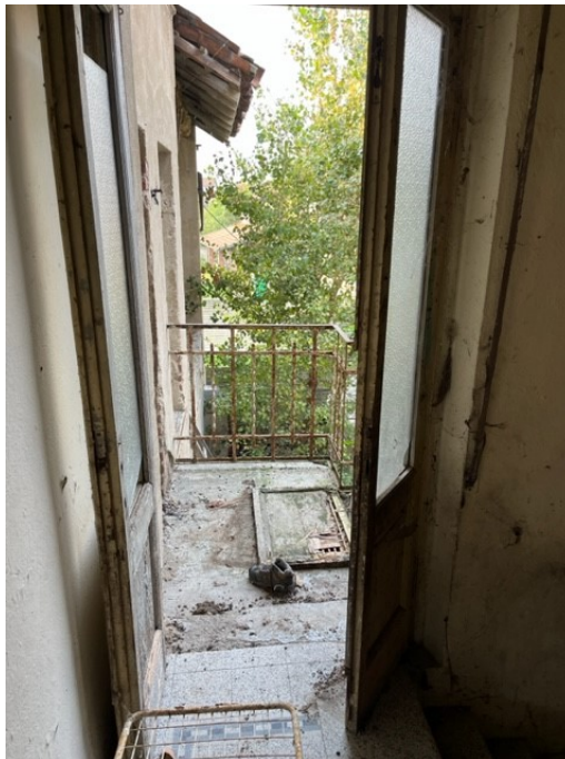
Balcone in lato sud di accesso esterno al locale di sgombero