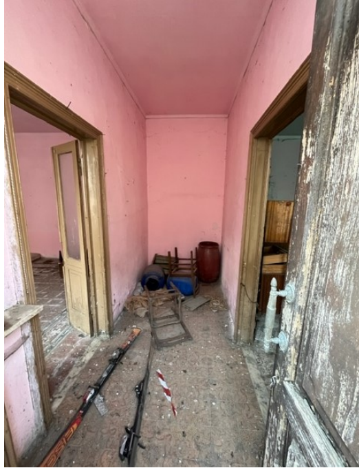
Piano terra: ingresso dalla porta su pubblica via

Viale A. Necchi 4 27100 Pavia Tel. 3392772355 e-mail nverdi2@gmail.com pec mail: nicola.verdi@pec.ording.pv.it P.IVA 01806320188 Iscritto all'Albo degli Ingegneri della Provincia di Pavia al n. 1981