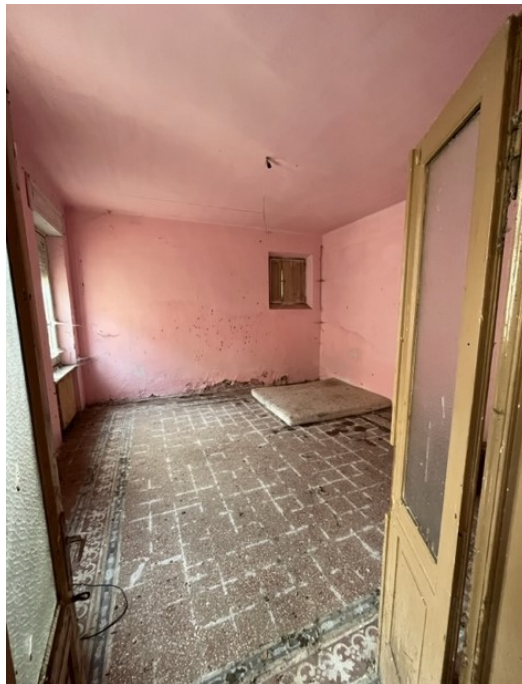
Piano terra: stanza entrando a sinistra