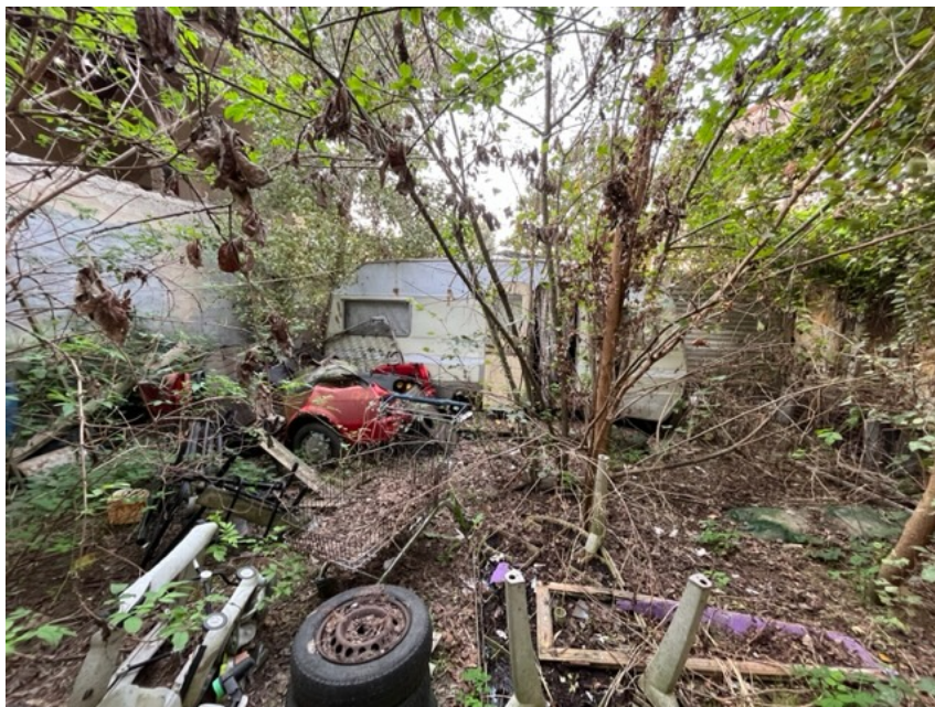
Vista del cortile interno di uso comune