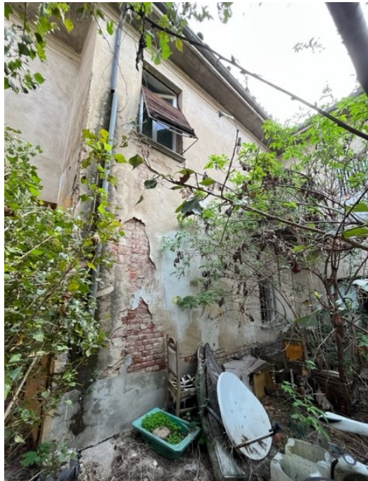
Vista facciata sud dal cortile interno

Viale A. Necchi 4 27100 Pavia Tel. 3392772355 e-mail nverdi2@gmail.com pec mail: nicola.verdi@pec.ording.pv.it P.IVA 01806320188 Iscritto all'Albo degli Ingegneri della Provincia di Pavia al n. 1981