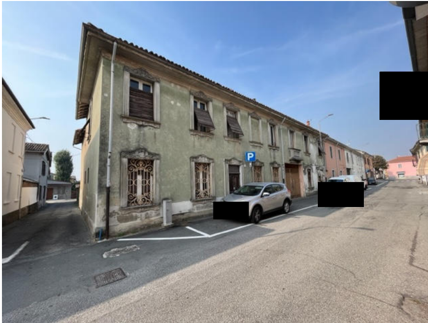
Vista del fabbricato dalla pubblica via Olivelli (lato nord).

Viale A. Necchi 4 27100 Pavia Tel. 3392772355 e-mail nverdi2@gmail.com pec mail: nicola.verdi@pec.ording.pv.it P.IVA 01806320188 Iscritto all'Albo degli Ingegneri della Provincia di Pavia al n. 1981