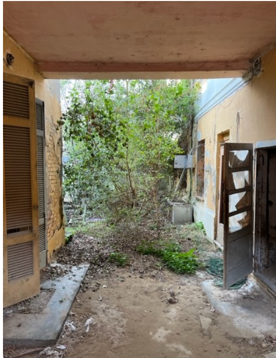
Vista dall' androne di ingresso di uso comune

Viale A. Necchi 4 27100 Pavia Tel. 3392772355 e-mail nverdi2@gmail.com pec mail: nicola.verdi@pec.ording.pv.it P.IVA 01806320188 Iscritto all'Albo degli Ingegneri della Provincia di Pavia al n. 1981