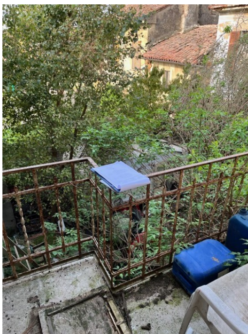
Balcone lato sud