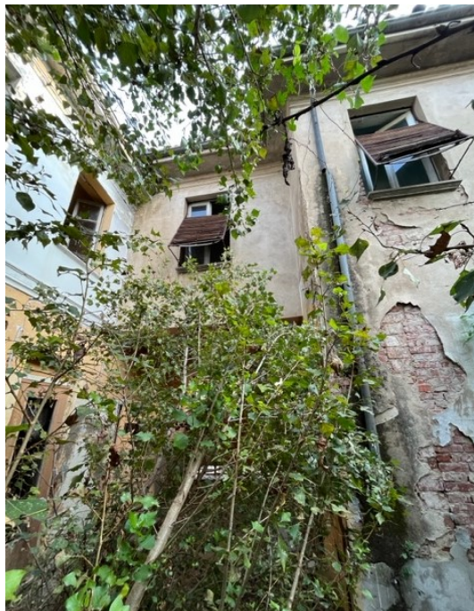
Vista facciata sud dal cortile interno