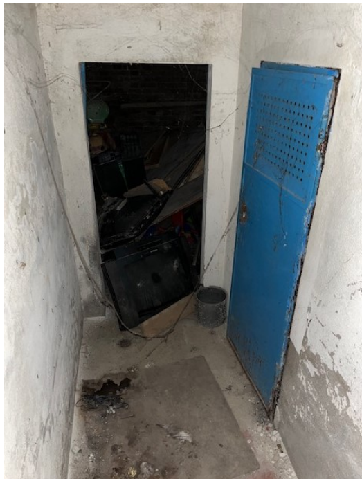
Locali al piano interrato inaccessibili in quanto colmi di materiale vario

Viale A. Necchi 4 27100 Pavia Tel. 3392772355 e-mail nverdi2@gmail.com pec mail: nicola.verdi@pec.ording.pv.it P.IVA 01806320188 Iscritto all'Albo degli Ingegneri della Provincia di Pavia al n. 1981